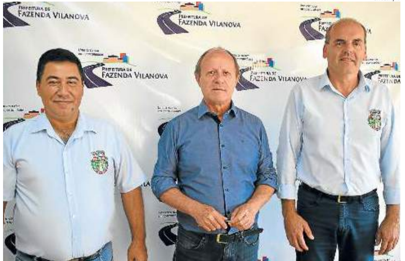
Fernandes e Brito deixaram a liderança de Secretarias