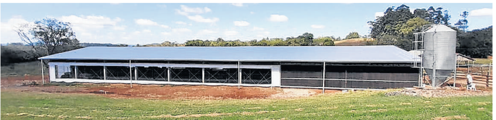
Galpão novo, modelo Freesthal, permite acomodar 64 animais