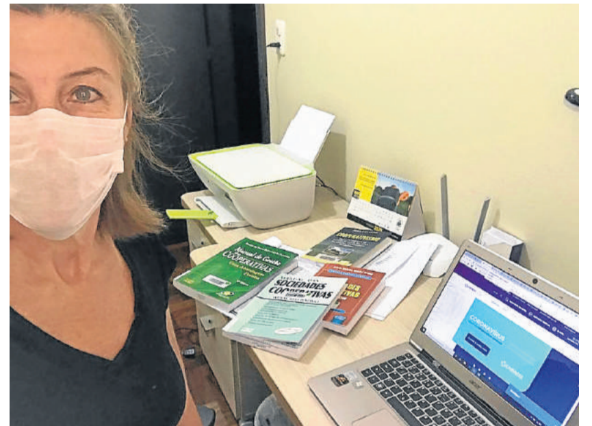
Primeira semana de quarentena usei máscara em tempo integral para não contaminar nenhum ambiente e nem minha roupa