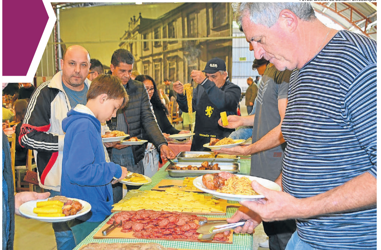
Festival Colonial Italiano ressalta a farta gastronomia italiana

Faça desta páscoa um momento de agradecimento, paz e tranquilidade. Quem sabe em breve será possível reunir a família toda em torno de uma mesa, rir e abraçar. Porém, agora, a prevenção e a baixa circulação ainda são as melhores medidas de segurança.