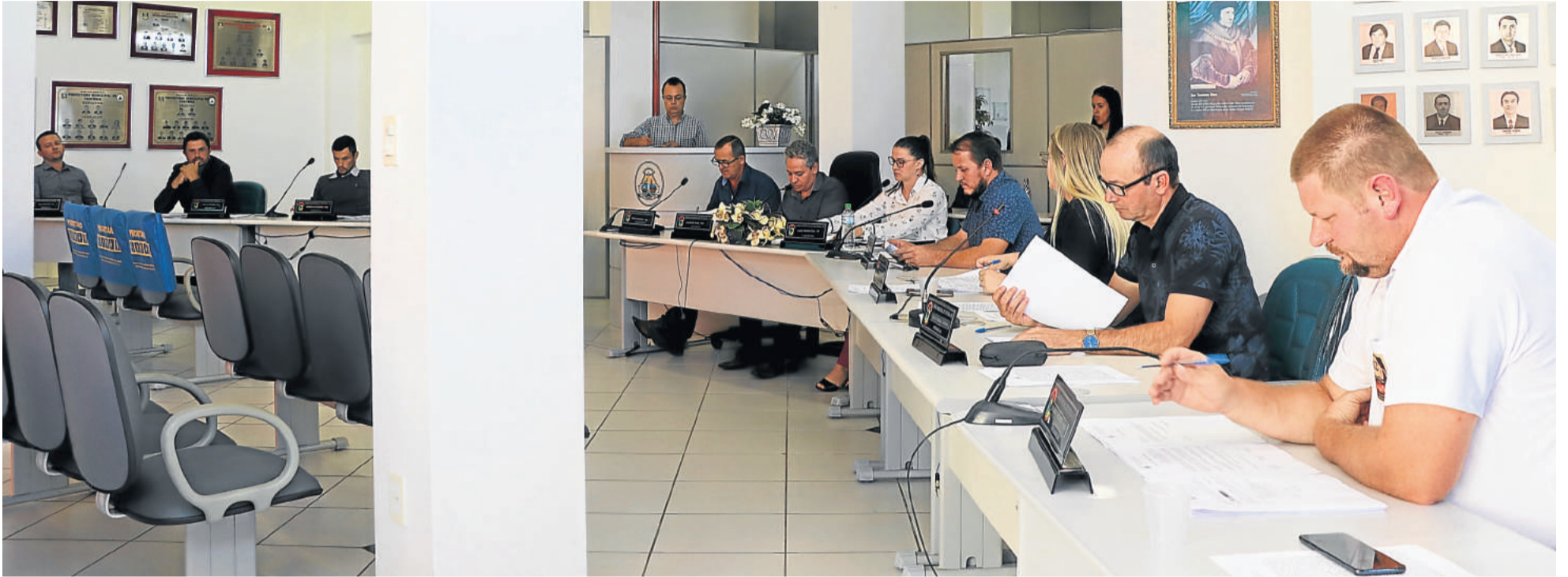
Aprovações ocorreram na sessão ordinária desta terça-feira (07/04)