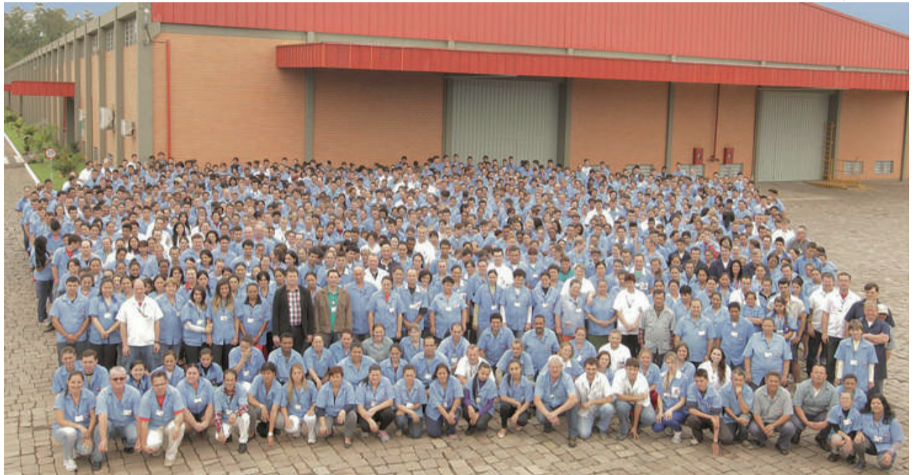
Calçados Beira Rio de Teutônia é uma das maiores empregadoras do setor