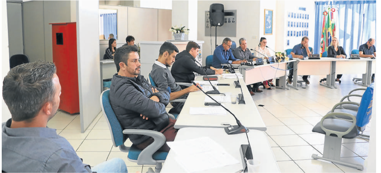
Coronavírus voltou a pautar os pronunciamentos da Câmara de Teutônia