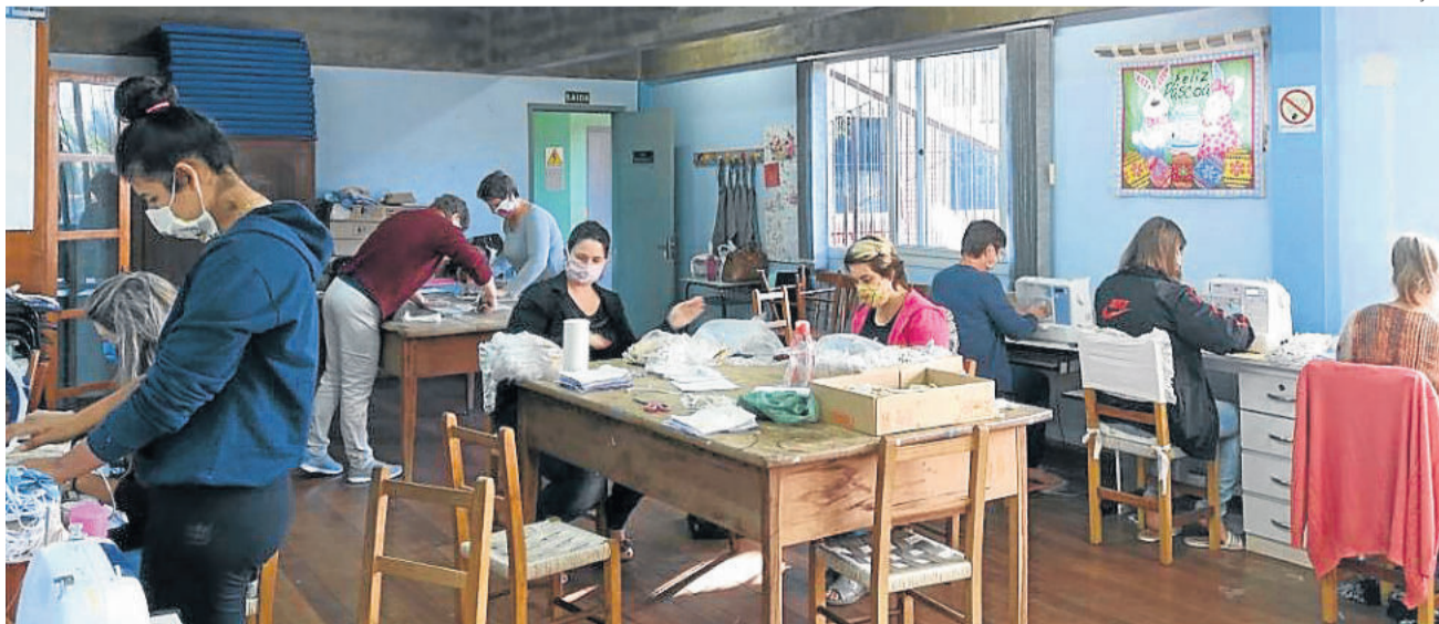
Voluntárias, servidores e estagiários do Município trabalham na produção