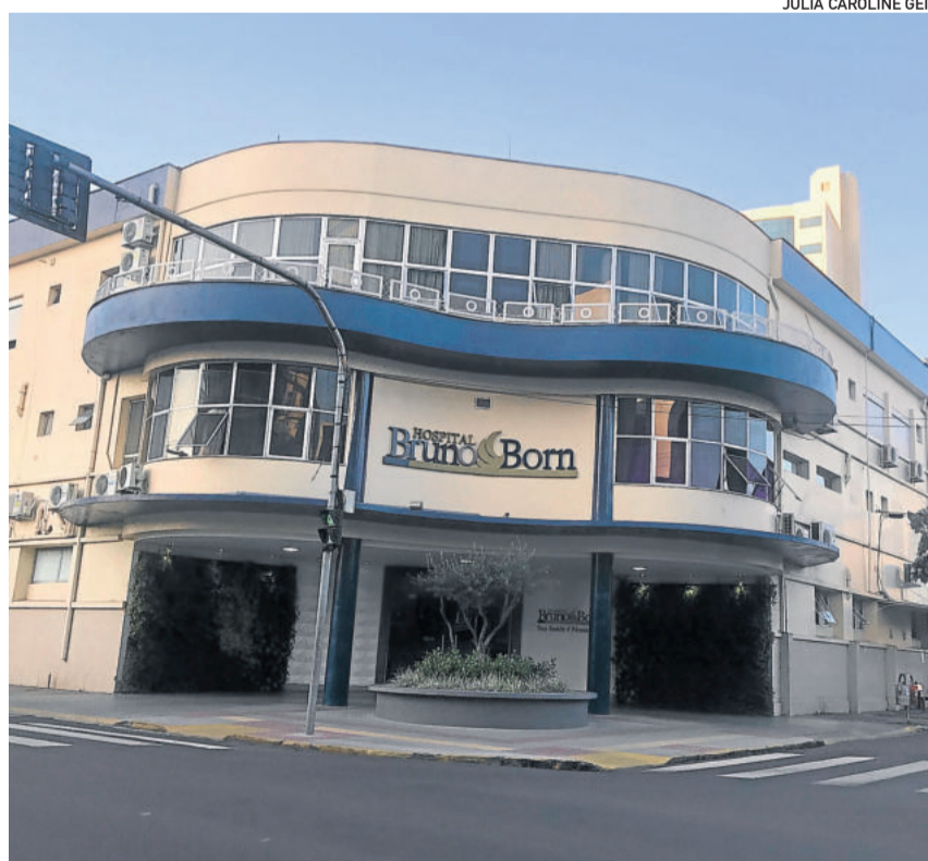
Hospital Bruno Born registrou dois óbitos nesta semana