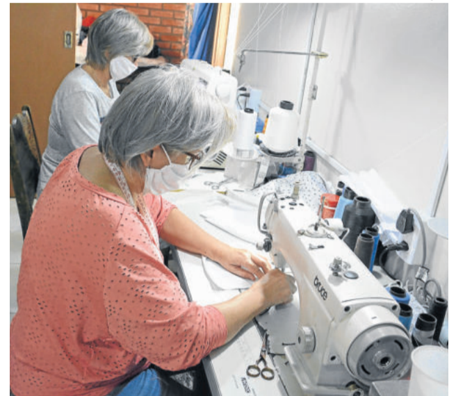
Voluntárias dedicam tempo integral na confecção de máscaras, as quais também são distribuídas gratuitamente à comunidade