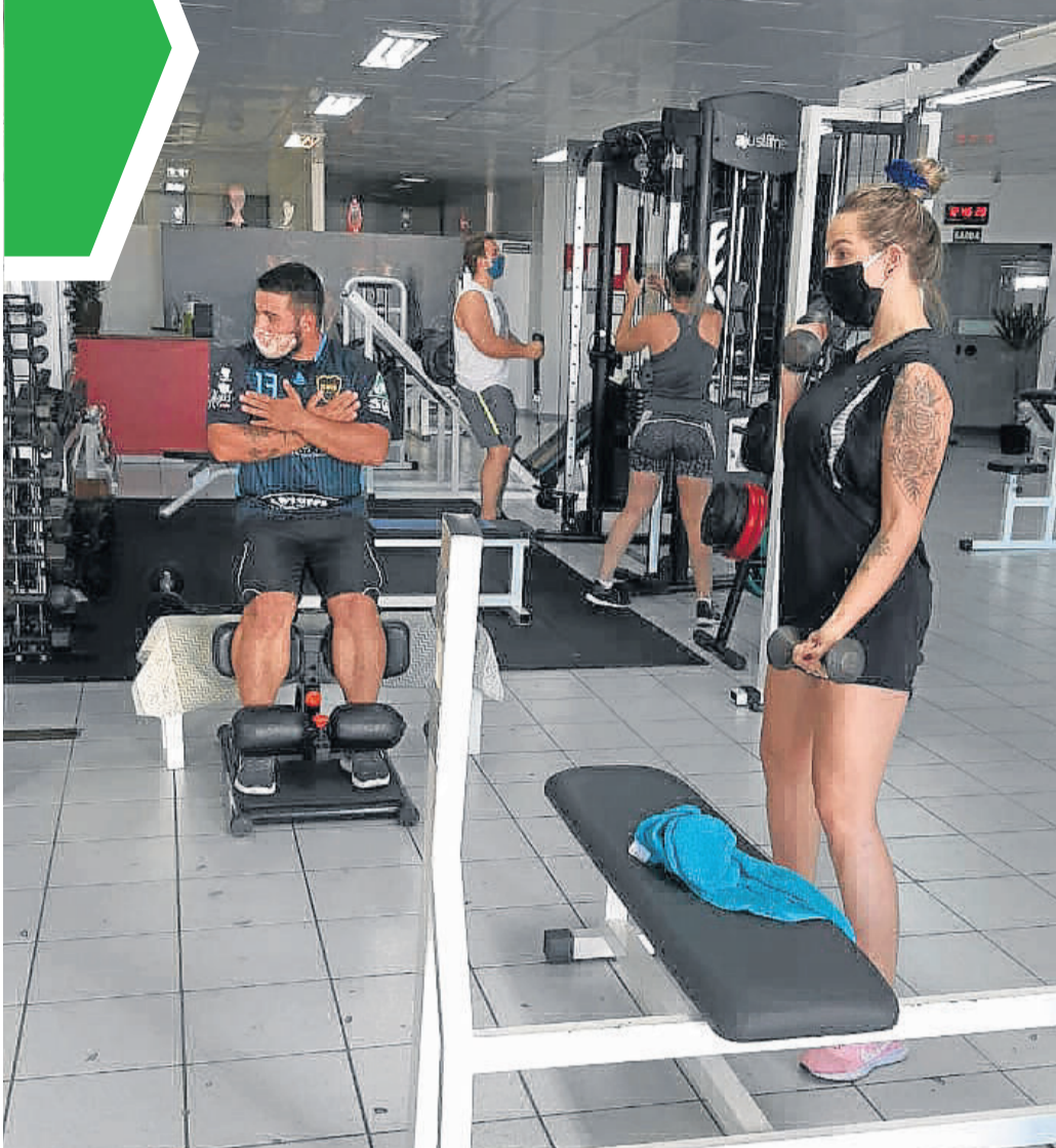
Treinos tiveram que ser adaptados às medidas de prevenção e higienização