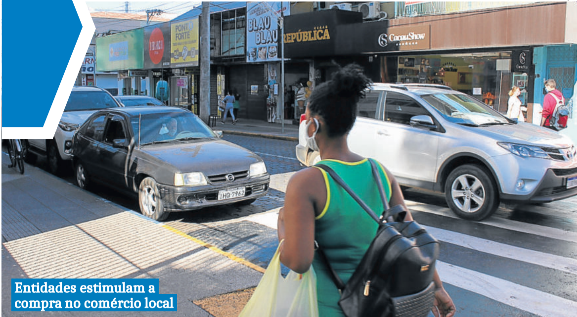
Entidades estimulam a compra no comércio local