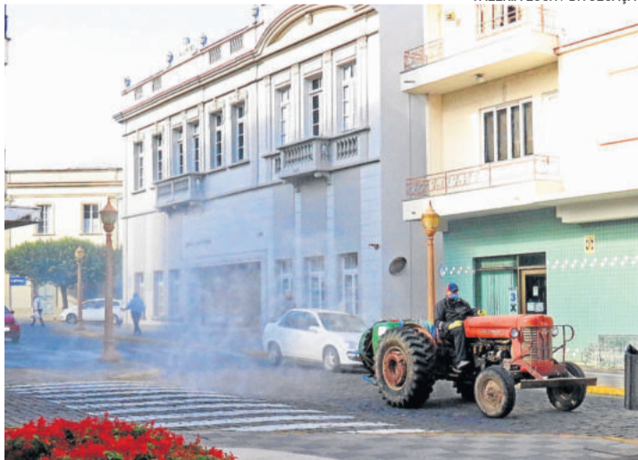
Serão usados tratores que pulverizarão solução de quaternário de amônia