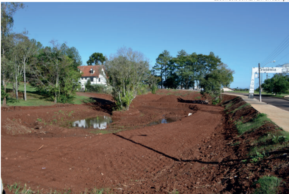
Espaço onde está projetado o espaço de lazer