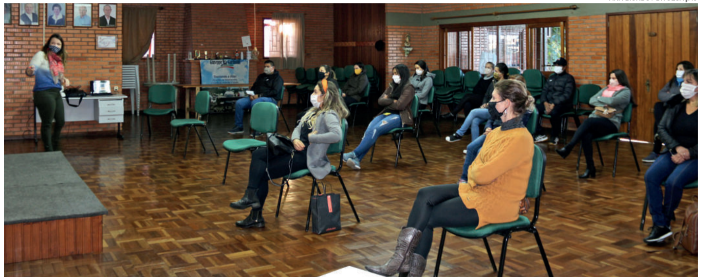
Treinamento dos agentes da dengue