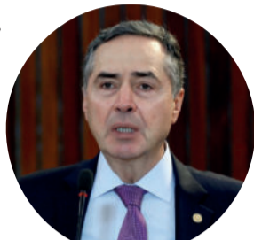
LUÍS ROBERTO BARROSO