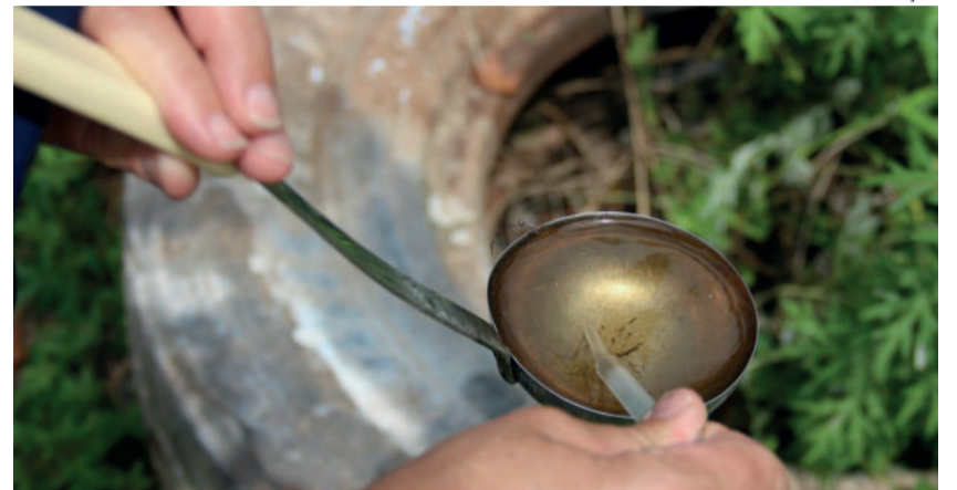
Três amostras positivas foram coletadas entre janeiro e março