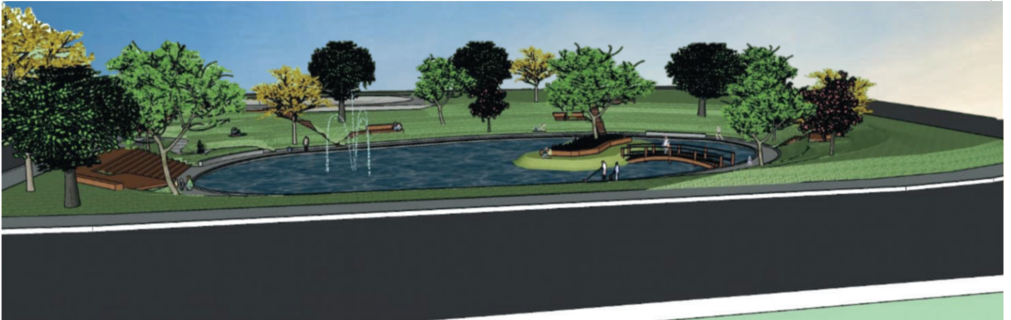
Logo ao passar pelo trevo, as pessoas terão uma visão ampla do espaço de lazer projetado