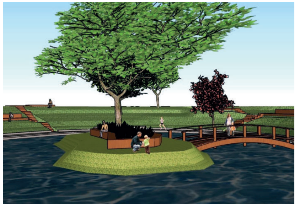
Lago terá um espaço diferenciado com uma pequena ilha