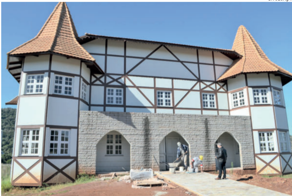
A expectativa é fazer a mudança na segunda quinzena deste mês de junho

obra 100%, faltam detalhes como mobília, instalação do elevador, entre outros. “Contudo, o término parcial para poder ser utilizado está quase concluído, restando apenas alguns acabamentos”, considera.