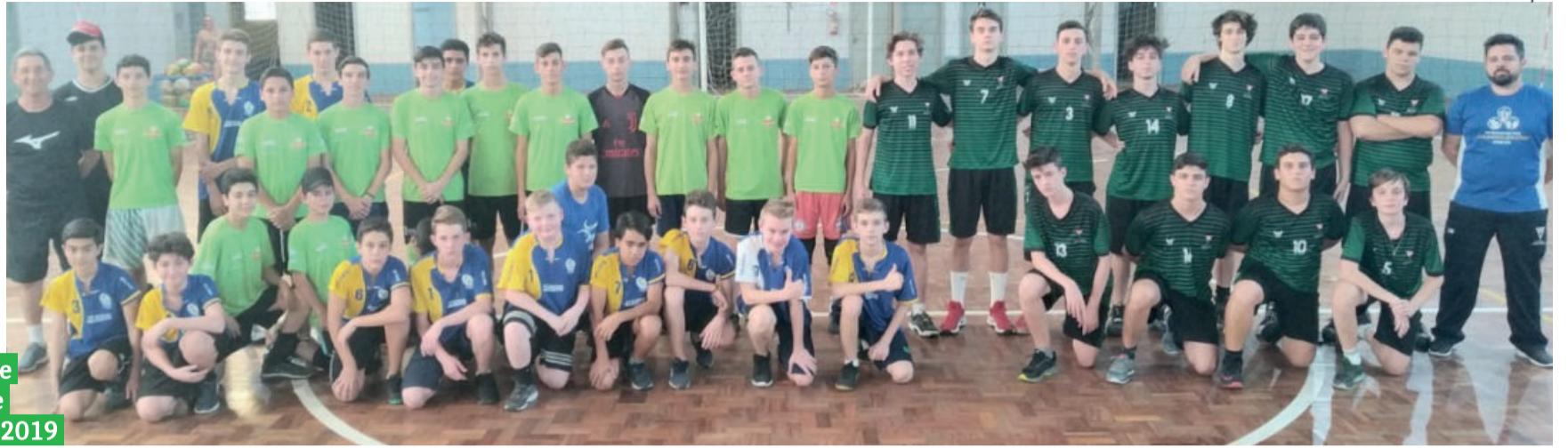
Alunos do vôlei masculino durante uma copa em que participaram em 2019