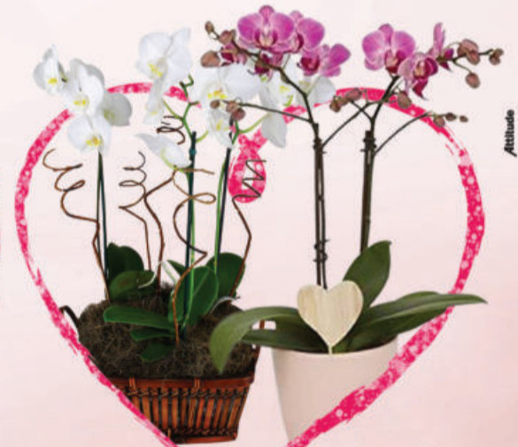
ARRANJOS DE FLORES