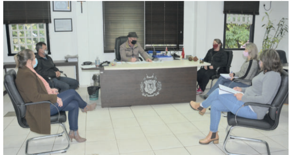
Prefeito de Westfália anunciou homologação do resultado da licitação