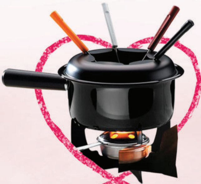
APARELHO PARA FONDUE