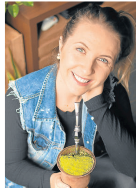
A fotógrafa Andrieli Magedanz focou-se na realização de ensaios em datas especiais