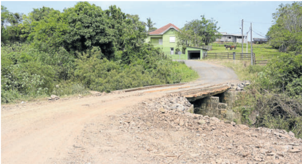
Ponte antiga, de madeira, fica submersa em dias de enchente do arroio