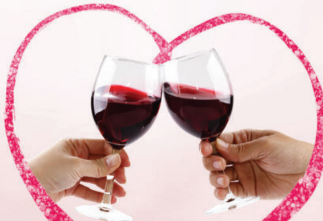
TAÇAS PARA VINHOS