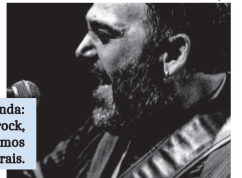
Xepa e banda: pop rock, regionalismos e autorais.