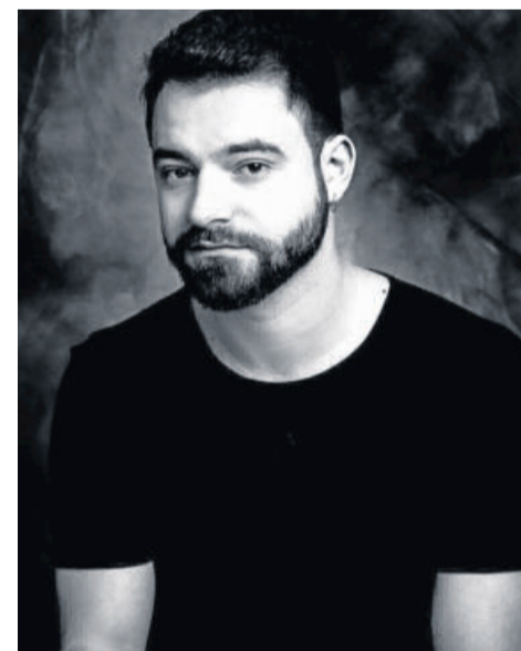
O fotógrafo William Perin também optou por focar em outros tipos de trabalhos