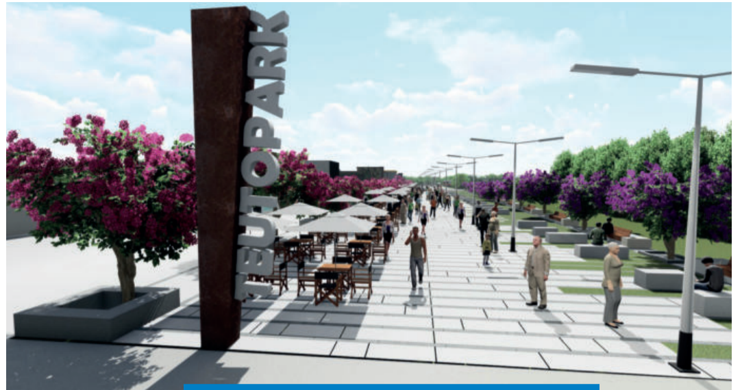
Perspectiva da primeira etapa do TeutoPark