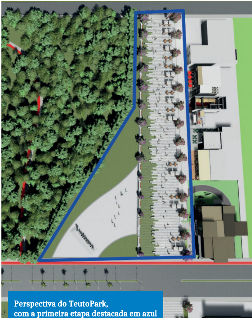
Perspectiva do TeutoPark, com a primeira etapa destacada em azul