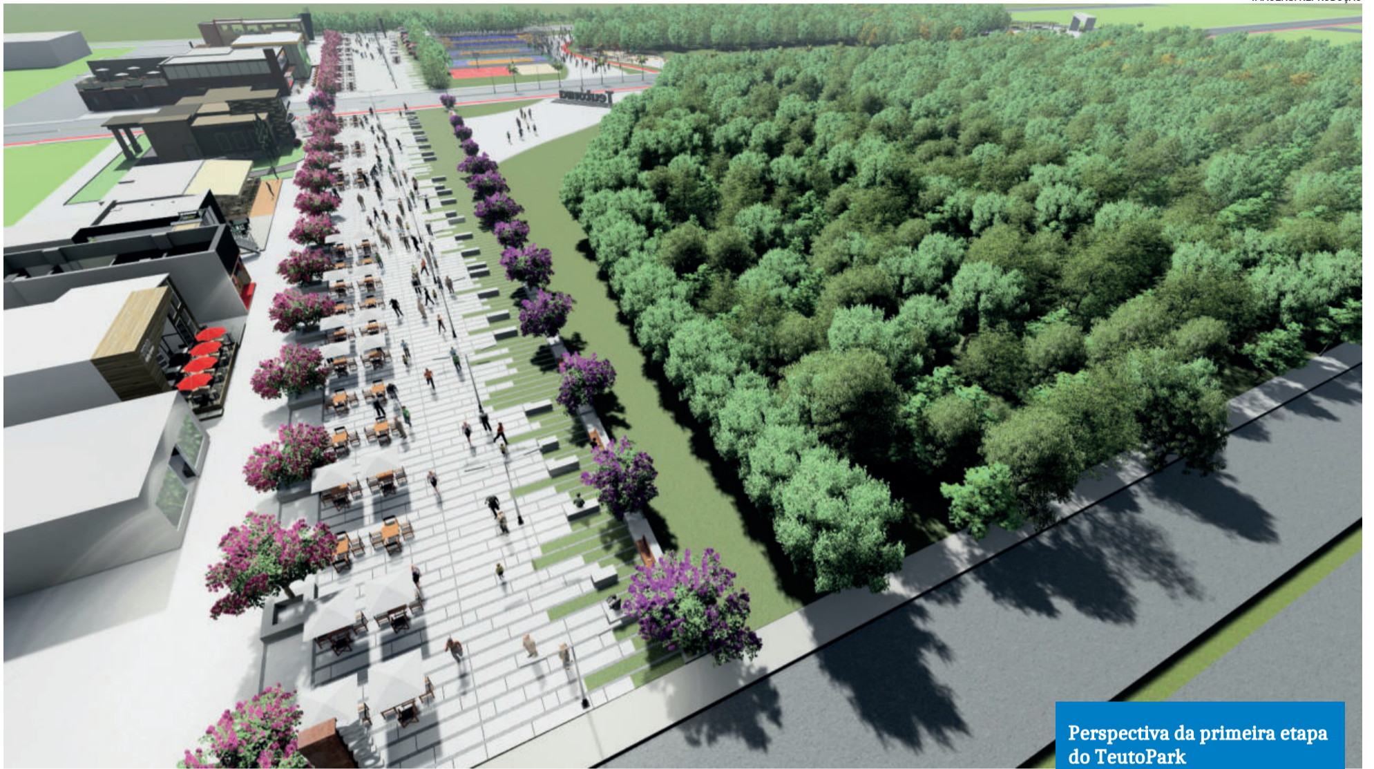
Perspectiva da primeira etapa do TeutoPark