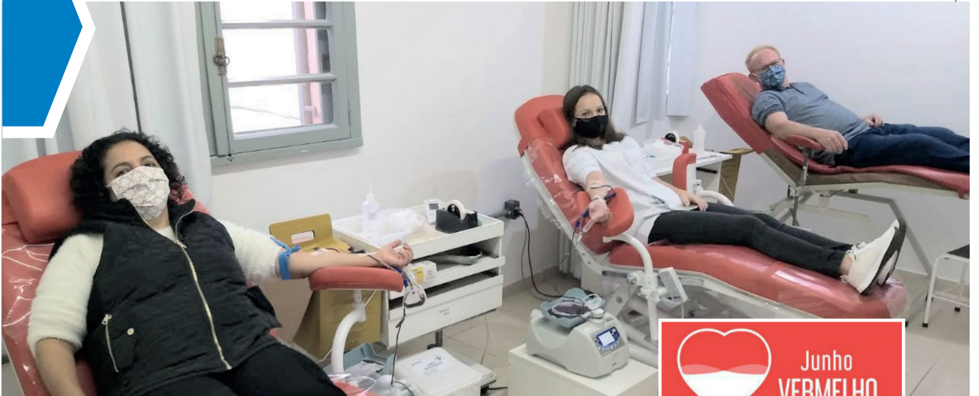
Um grupo de seis doadores organizado pelo Rotary foi até o Hemovalé no sábado (06/06)