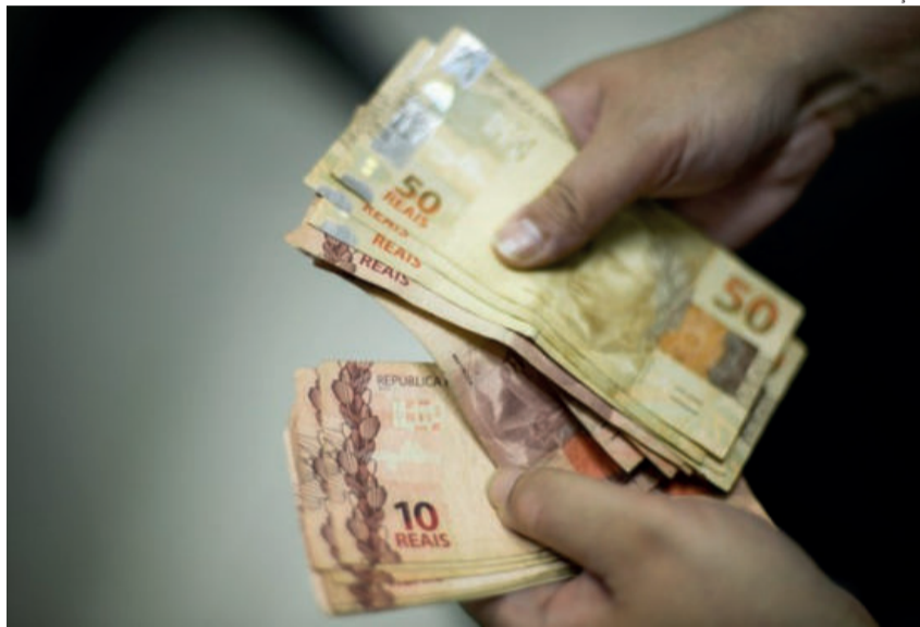
Valores são para repor perdas de arrecadação