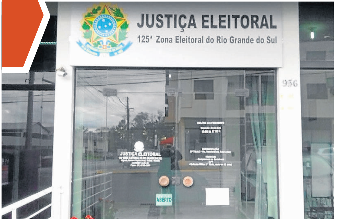
Cartório Eleitoral de Teutônia está com atividades suspensas desde 17 de março e retoma atividades apenas internas

Todas as nossas plataformas em um único lugar