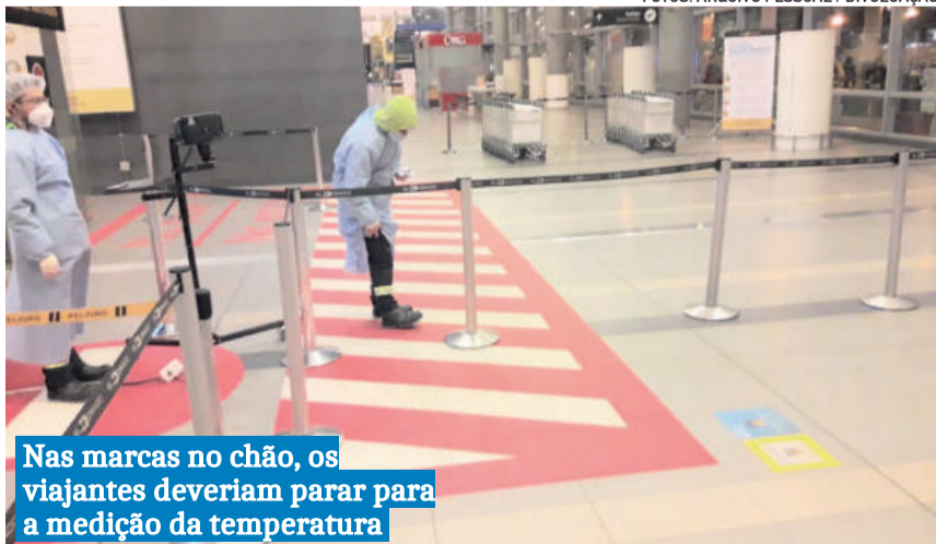
Nas marcas no chão, os viajantes deveriam parar para a medição da temperatura