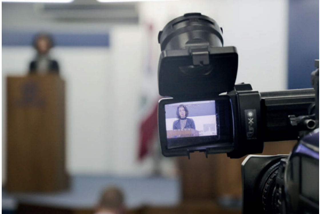
Evento também foi transmitido por live no Facebook da Univates