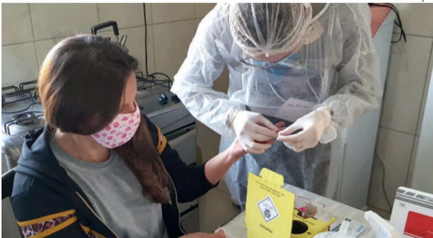
A primeira fase da pesquisa foi realizada de 30 de maio a 4 de junho, em Lajeado, com uma amostra de 1.450 participantes.