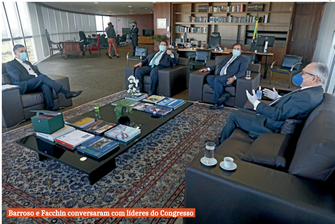
Barroso e Fachin conversaram com líderes do Congresso