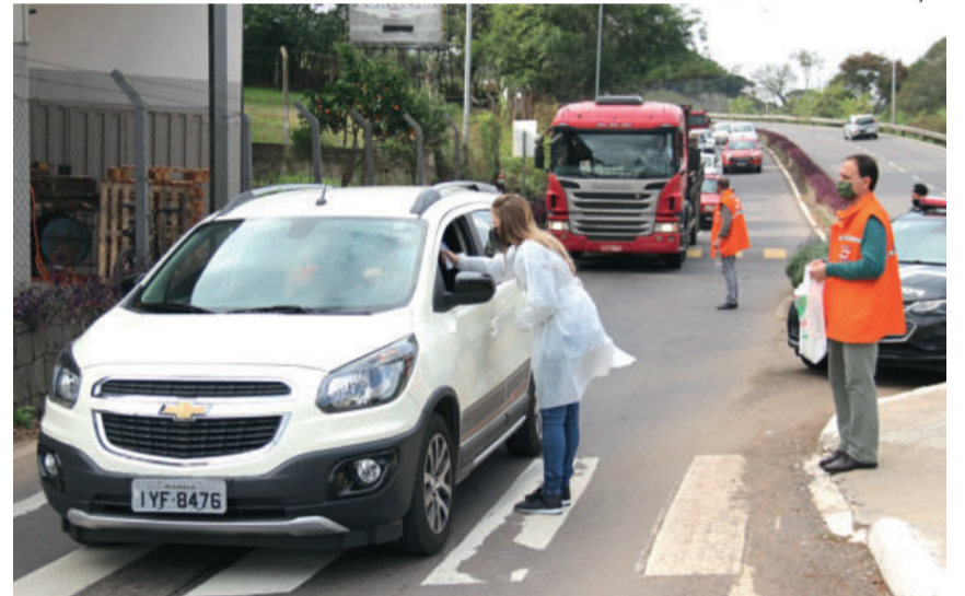
Ação ocorreu nos acessos da cidade