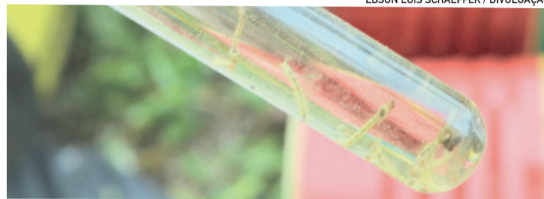
Coleta é realizada semanalmente pelos agentes de endemias