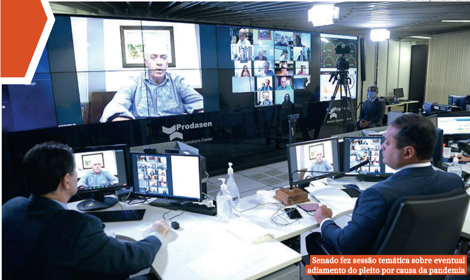
Senado fez sessão temática sobre eventual adiamento do pleito por causa da pandemia