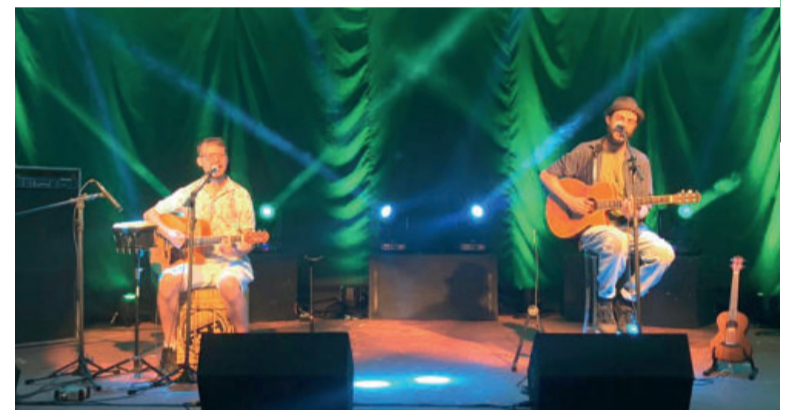
Os irmãos da DiLuau Acústico fecharam a noite com muito reggae e surf music