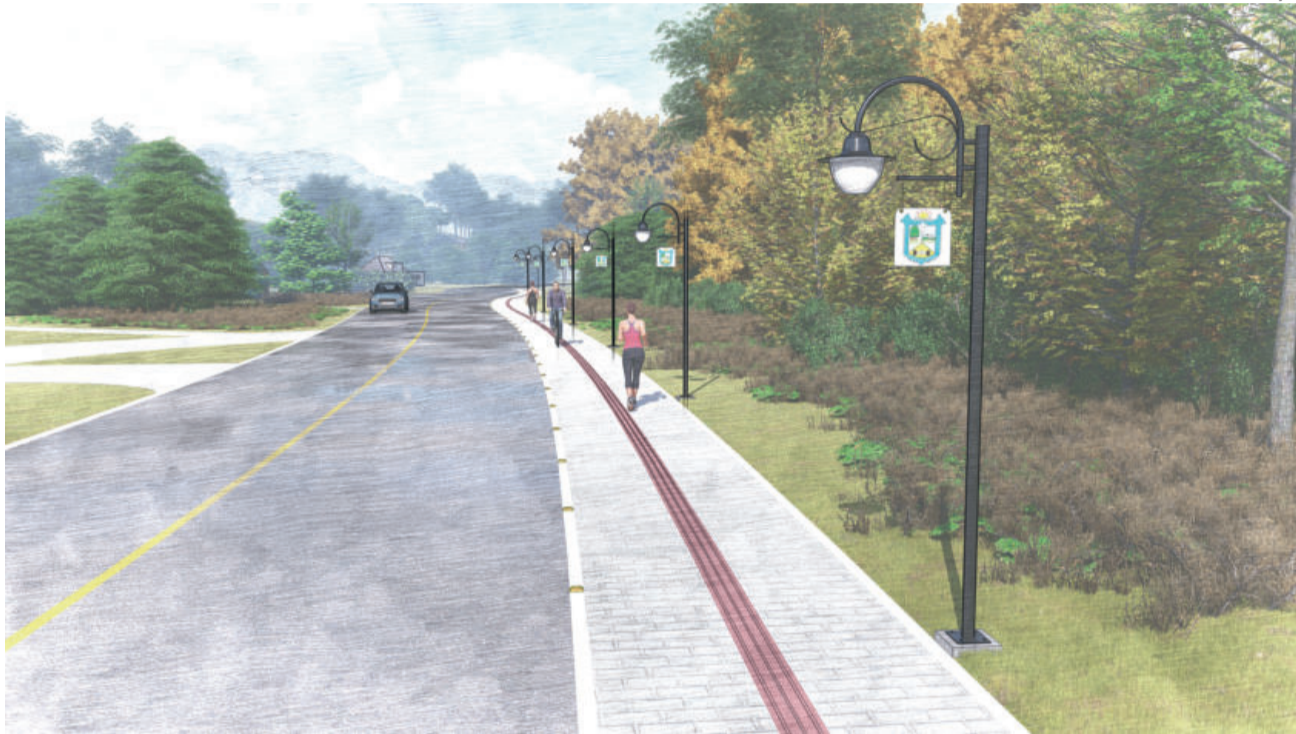
Caminhódromo terá uma extensão de 800 metros