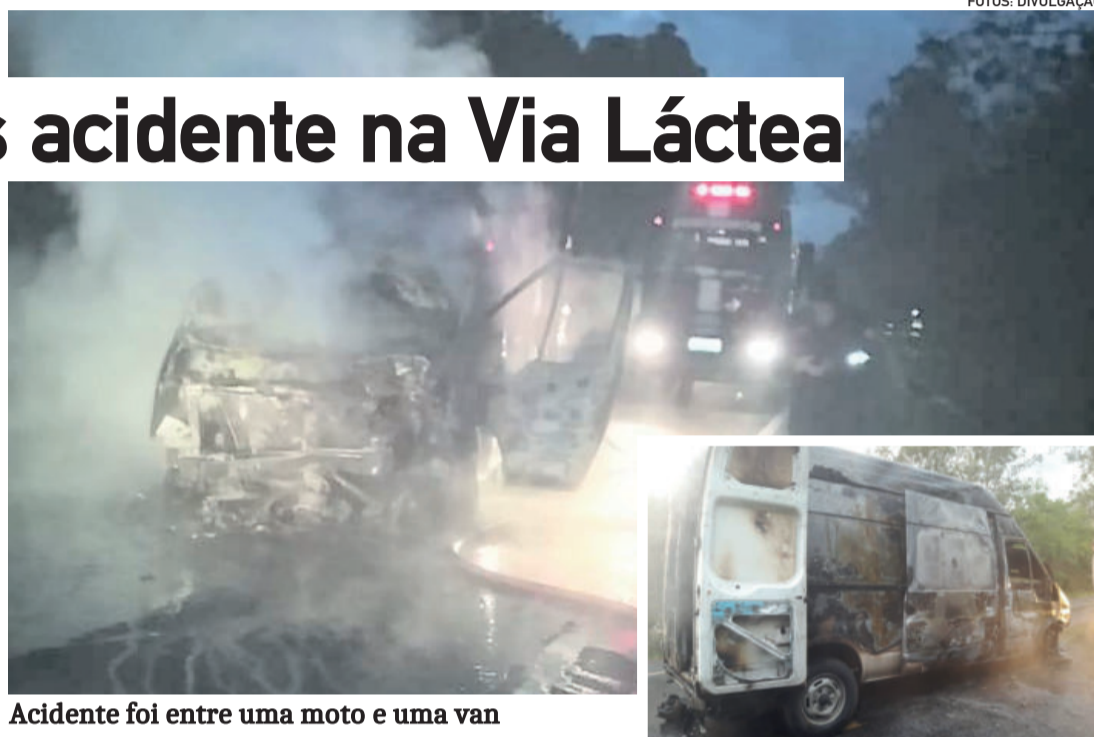
Acidente foi entre uma moto e uma van