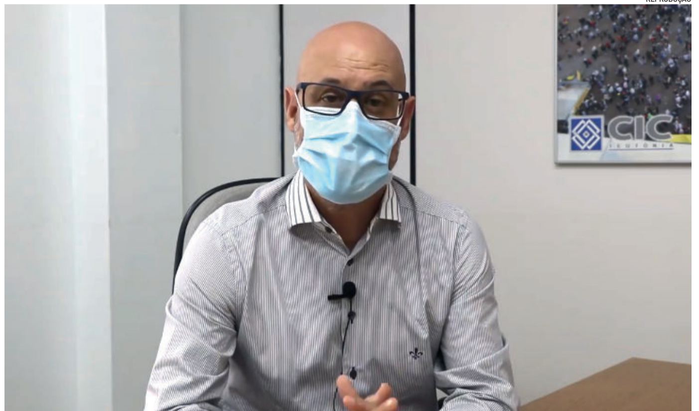
Conforme o médico, em 18 dias, o Brasil passou de 30 mil mortes para mais de 45 mil mortes por Covid-19