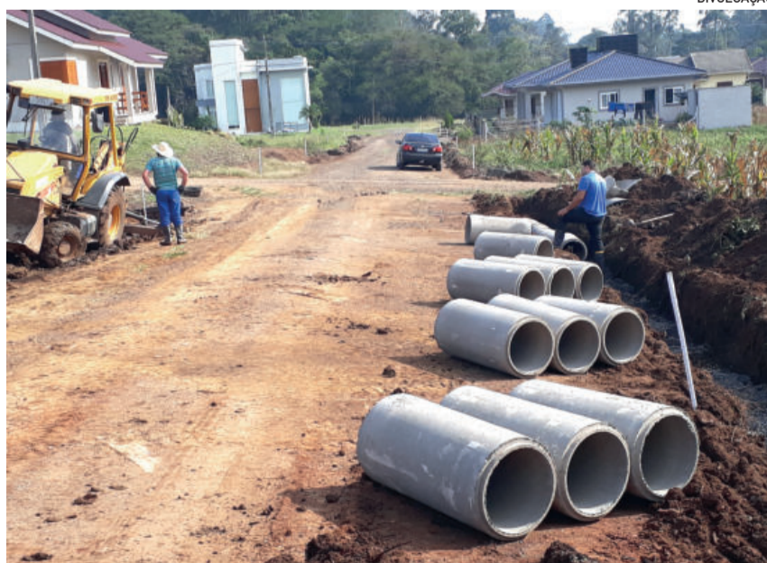
Obras são importantes pelo grande fluxo de veículos nos locais

Para os moradores o investimento é importante, pelo intenso fluxo de veículos no local. Conforme a empresa vencedora do certame licitatório a obra deve ser finalizada no mês de outubro. A obra compreende 3.115,60 metros quadrados e oito metros de largura, sendo investidos R$ 579.538,54.