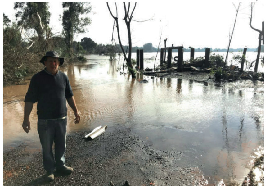
Muitas residências foram destruídas pela cheia do Rio Taquari