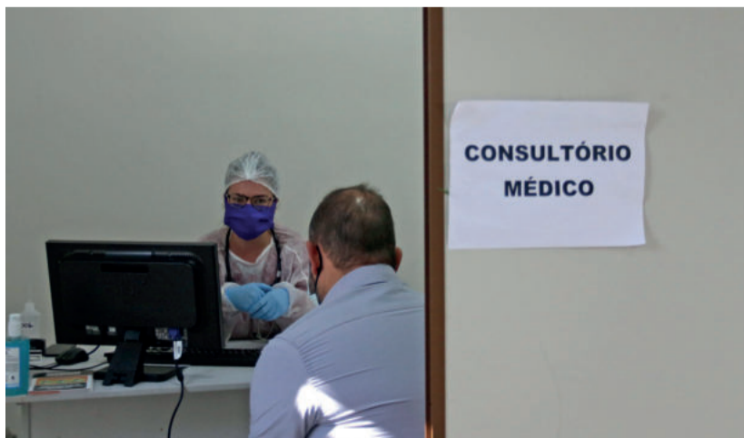
Pacientes que tiverem sintomas suspeitos poderão receber o tratamento, sob prescrição médica