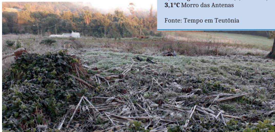
No Bairro Alesgut, a geada tomou conta da paisagem