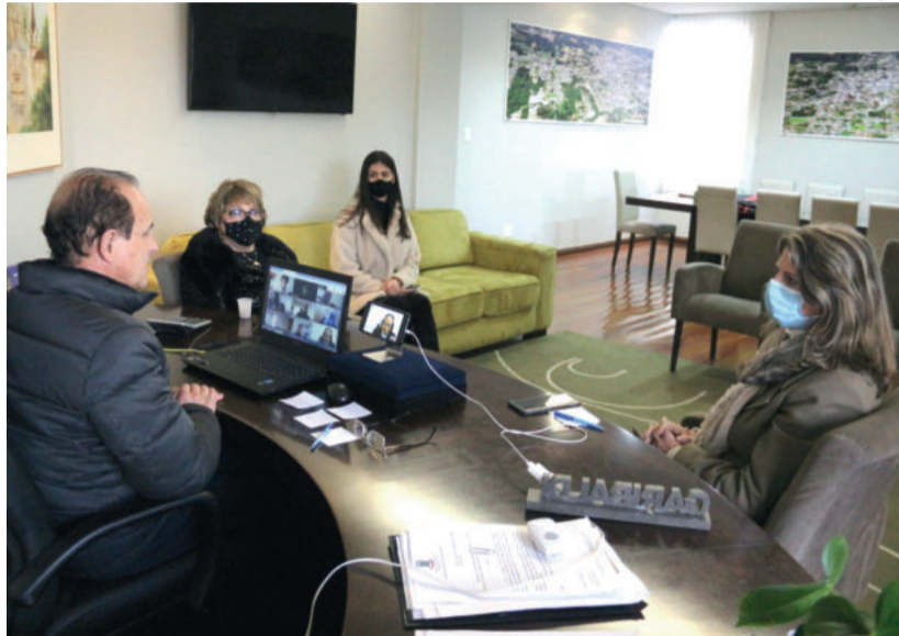
Reunião da Amesne ocorreu na sexta-feira (10/07)