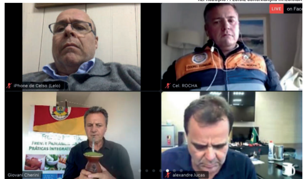
Videoconferência reuniu bancada gaúcha e representantes de cidades atingidas pelas cheias