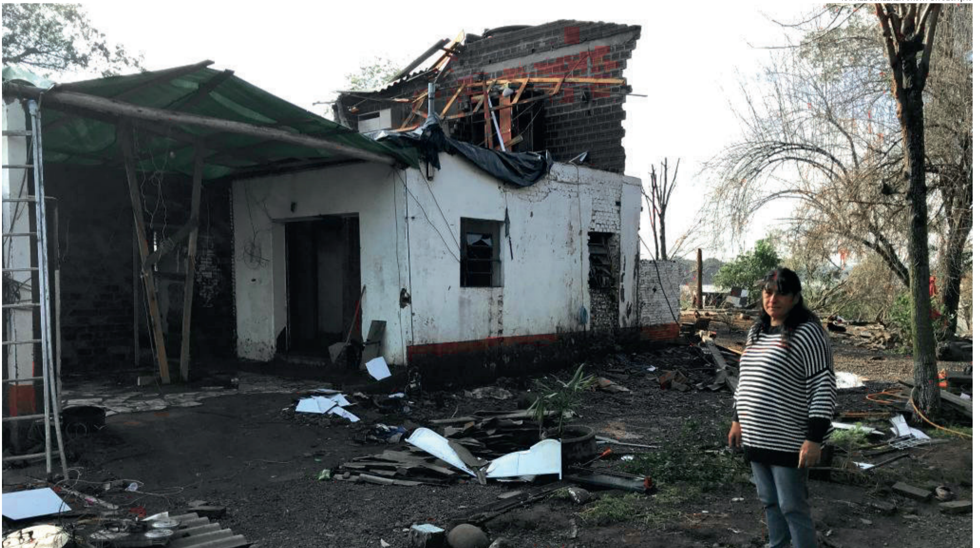
Enchente deixou rastro de destruição em diversos municípios, como em Lajeado