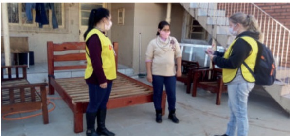
Servidores estavam identificados e tomando cuidados como o distanciamento social

Os relatórios serão repassados pela Defesa Civil para o Sistema Integrado de Informações sobre Desastres, que é utilizado para obter recursos junto ao Governo Federal. Também ajudarão na formação de um cadastro que será utilizado pela Assistência Social, onde será possível verificar, com mais eficiência, a situação de cada bairro, rua e família, ajudar no direcionamento dos auxílios, respeitando os casos mais urgentes, como para evitar a duplicidade dos benefícios. As famílias que ainda estão desalojadas ou desabrigadas também farão parte do relatório. Nesta terça-feira mais três famílias voltaram para suas casas. No momento, 19 famílias e mais de 75 pessoas seguem desabrigadas.