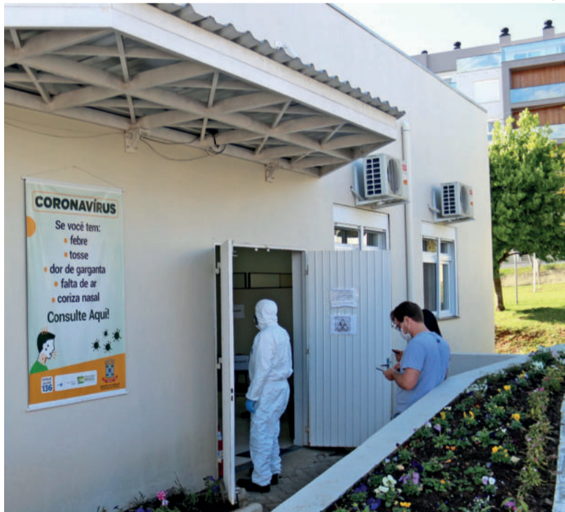
Pessoas com sintomas devem buscar atendimento no Ambulatório Covid-19