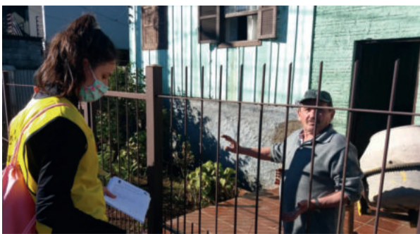
Nas residências das ruas mais atingidas conversaram com os moradores