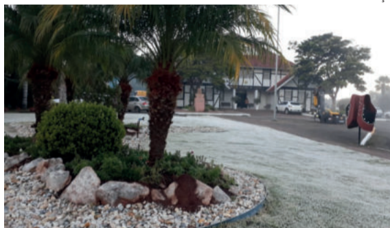
Em Westfália também teve geada