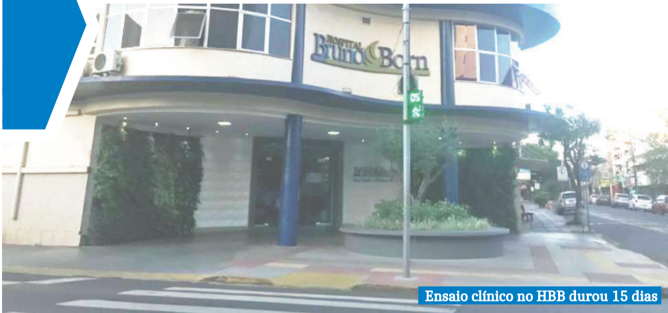
Ensaio clínico no HBB durou 15 dias