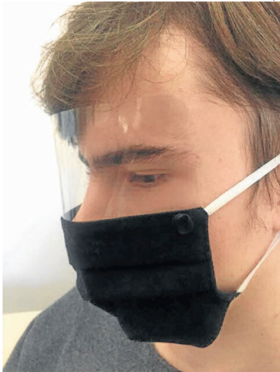
Modelo buscar dar conforto e praticidade