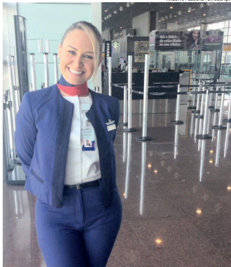
Segundo a comissária Cristine, é impressionante caminhar pelo aeroporto e vê-lo vazio