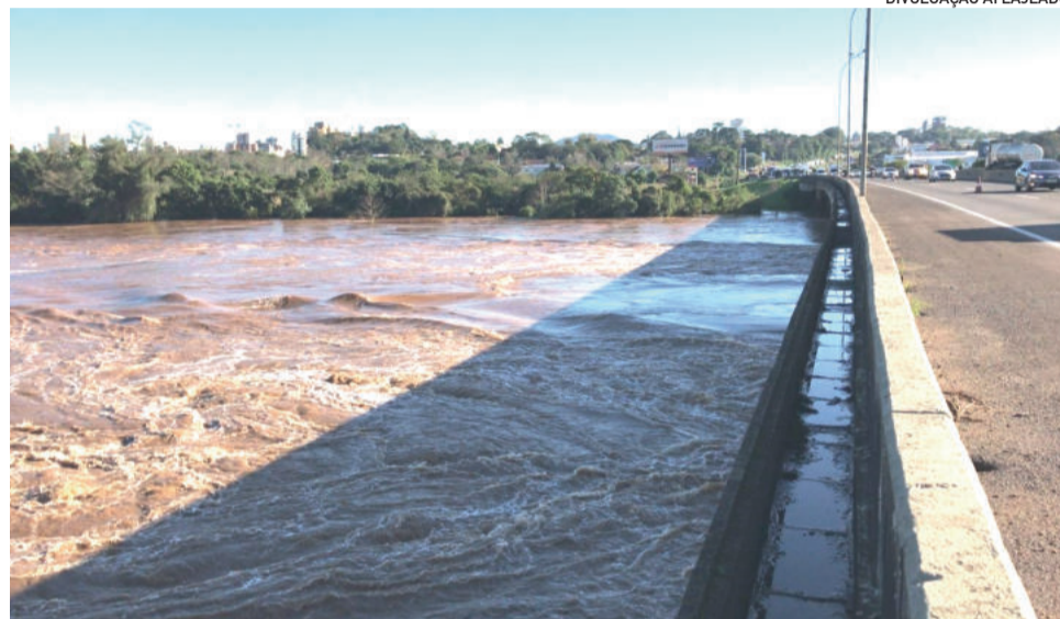
Ponte sobre o Rio Taquari na BR-386, com Lajeado ao fundo

Nos cálculos de pontes, Garcia observa que os engenheiros projetam no mínimo 1 metro acima da maior enchente que teve. “Geralmente, fazem 2 metros acima desse nível”, observa. No caso da ponte do Rio Taquari, foi considerada a cota da enchente de 1941. “Ela foi projetada para não chegar no tabuleiro da ponte, porque aí é perigo”, comenta. E apesar dos cálculos, há os imprevistos. “Tu não sabes o que a água pode estar carregando junto, podem vir entulhos, vai prendendo e tem a força do material que