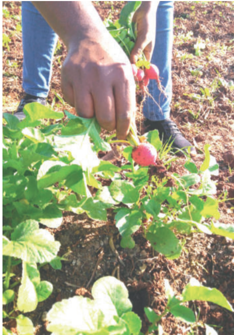
Quando no ponto, comunidade pode colher alimentos