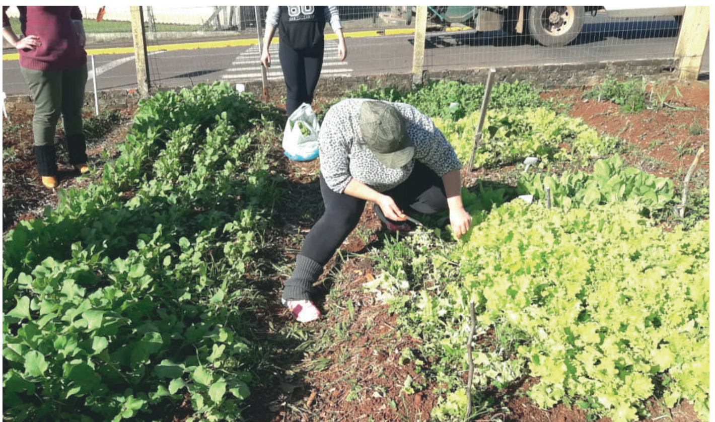
Voluntários trabalham no plantio e cuidado com as plantas

"Eu apóio muito a atitude da pastora, pois é uma iniciativa louvável. Penso que o projeto deveria inspirar a ação de outros líderes comunitários. Eu ajudei com doações e me coloquei à disposição para continuar auxiliando porque é tudo que a gente quer, que esse sonho se realize e tenhamos uma Cidade Horta", destaca.