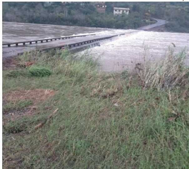
Rio das Antas, entre Cotiporã e Bento Gonçalves