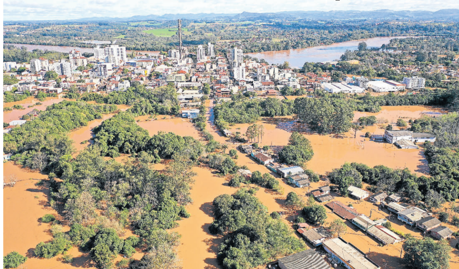
Imagem aérea de Estrela na inundação do Rio Taquari de 09 de julho de 2020, a maior dos últimos 64 anos

Neste sentido, sabe-se que rios, arroios e córregos têm sua capacidade de vazão limitada. Em situações de precipitações pluviométricas dentro do esperado, o nível até se eleva em relação ao normal, mas a água não chega a transbordar. Nesses casos, pode-se caracterizar a elevação como enchente, pois o volume da vazão ainda não superou a capacidade máxima... Quando volume de vazão e capacidade de escoamento se igualam, ocorre a cheia.