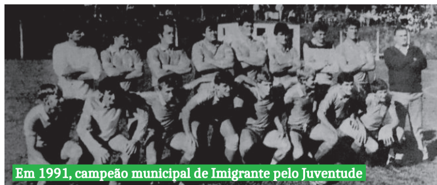
Em 1991, campeão municipal de Imigrante pelo Juventude