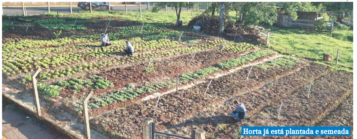
Horta já está plantada e semeada

Mais recente, surgiu outra iniciativa, na mesma linha, de proporcionar e estimular uma alimentação saudável. O 1º Café Orgânico teve excelente aceitação da comunidade e permitiu ampliar o conhecimento sobre alimentos e os sabores para outras pessoas do município, que não participavam do grupo. O sucesso da primeira edição foi ratificado com o grande público que procurou pela segunda edição. A terceira, deste ano, infelizmente não pôde ser realizada, mas tinha inclusive lista de interessados. O próprio café tornou-se um desafio às integrantes do grupo, para a criação e produção de novas receitas. Surgiram diversos tipos geleias, bolos e até tortas, todos feitos com alimentos o mais naturais e integrais possíveis.