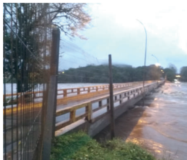
Rio Carreiro, em Serafina Corrêa