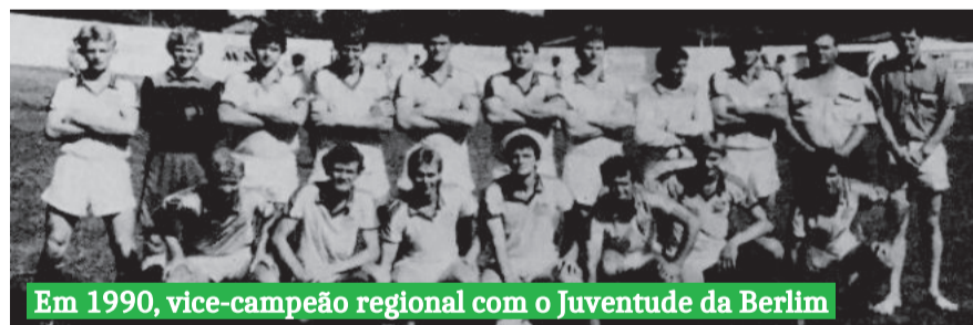
Em 1990, vice-campeão regional com o Juventude da Berlim

Segundo ele, o clube evoluiu em estrutura e apoio da comunidade, mas hoje precisa buscar bastante jogadores de fora para brigar de igual para igual, principalmente contra as equipes do regional.