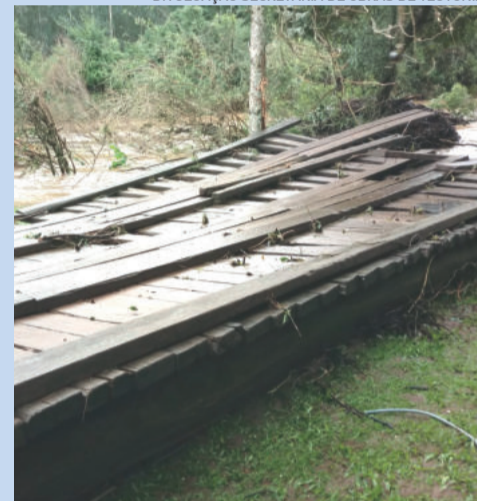
Ponte de madeira do Arroio Boa Vista foi arrastada em Teutônia