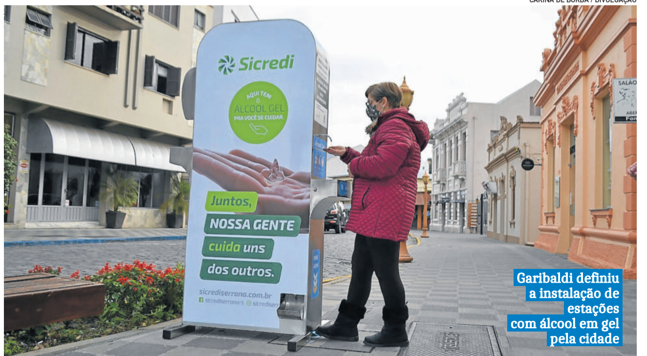
Garibaldi definiu a instalação de estações com álcool em gel pela cidade