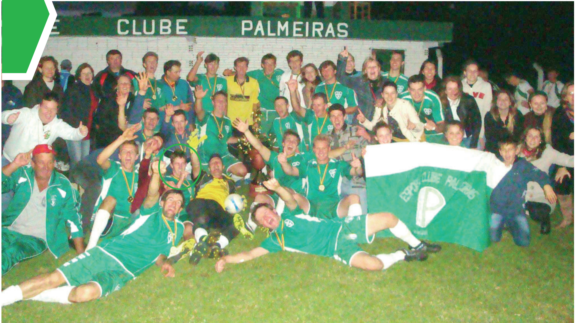
Palmeiras comemora conquista nos Titulares em Westfália: título da Taça da Amizade e Municipal no ano de 2013