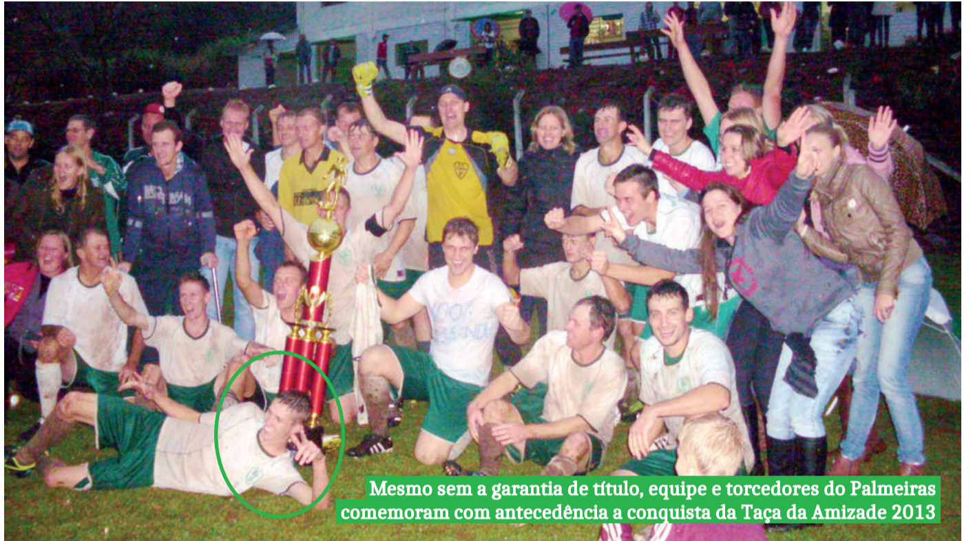
Mesmo sem a garantia de título, equipe e torcedores do Palmeiras comemoram com antecedência a conquista da Taça da Amizade 2013