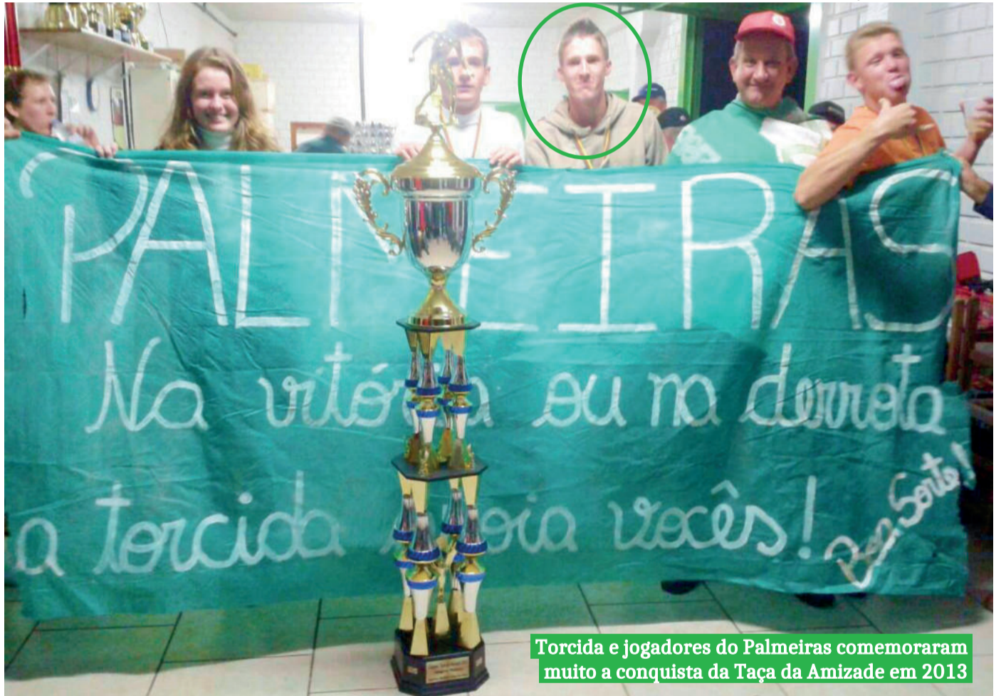
Torcida e jogadores do Palmeiras comemoraram muito a conquista da Taça da Amizade em 2013