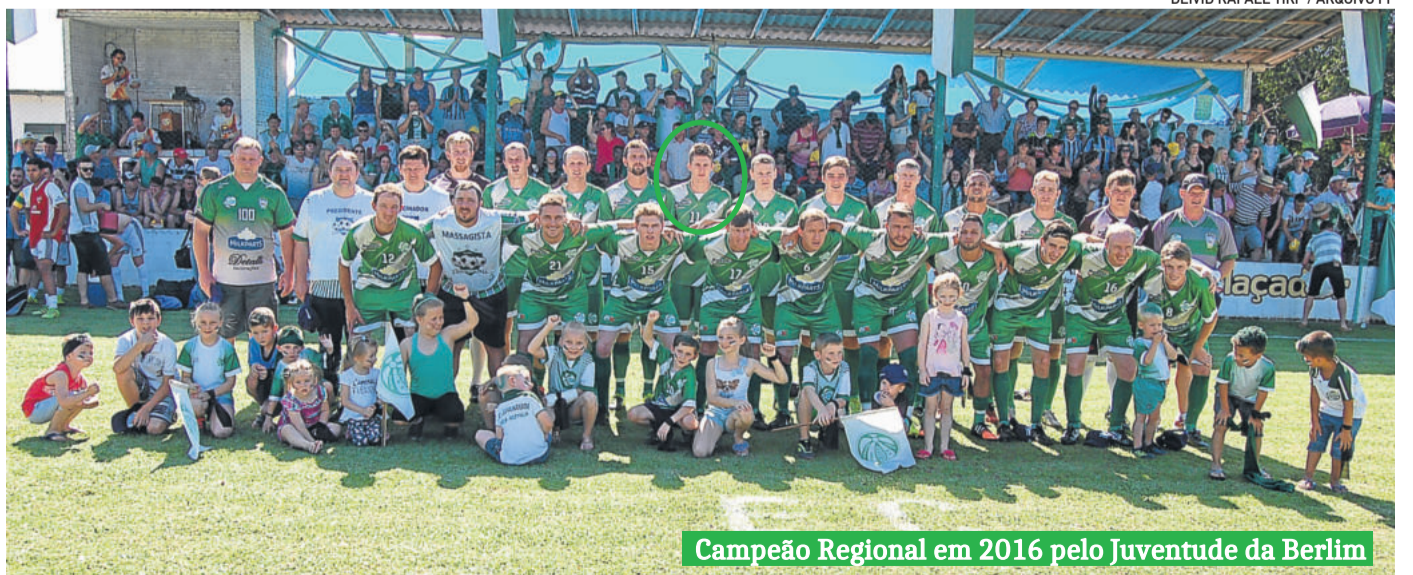
Campeão Regional em 2016 pelo Juventude da Berlim