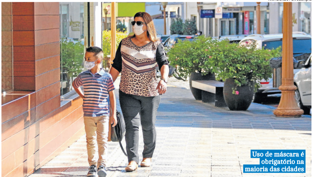
Uso de máscara é obrigatório na maioria das cidades