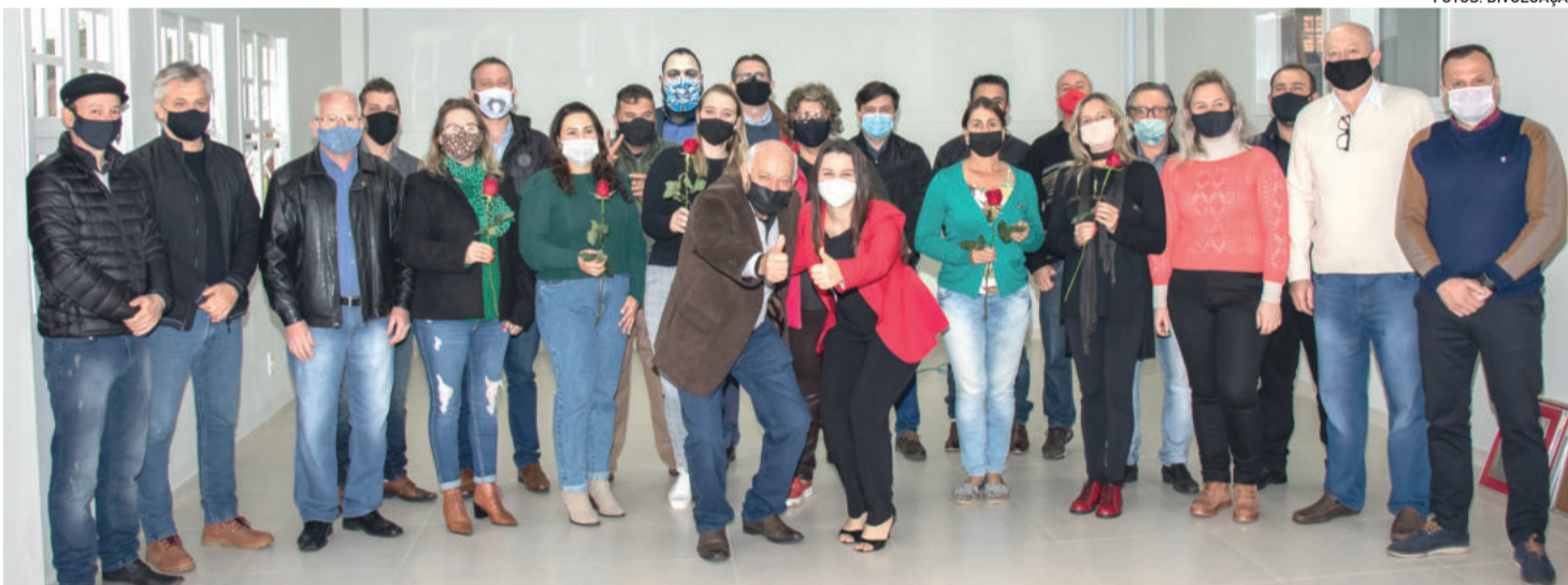
Candidatos a vereador pelo PDT e lideranças partidárias da coligação