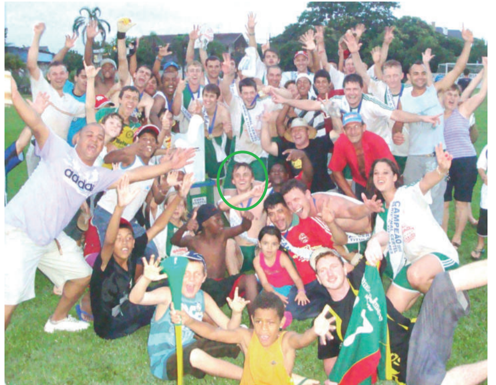
União Santo André festeja título da Série A do Regional Certel Aslivata em 2010