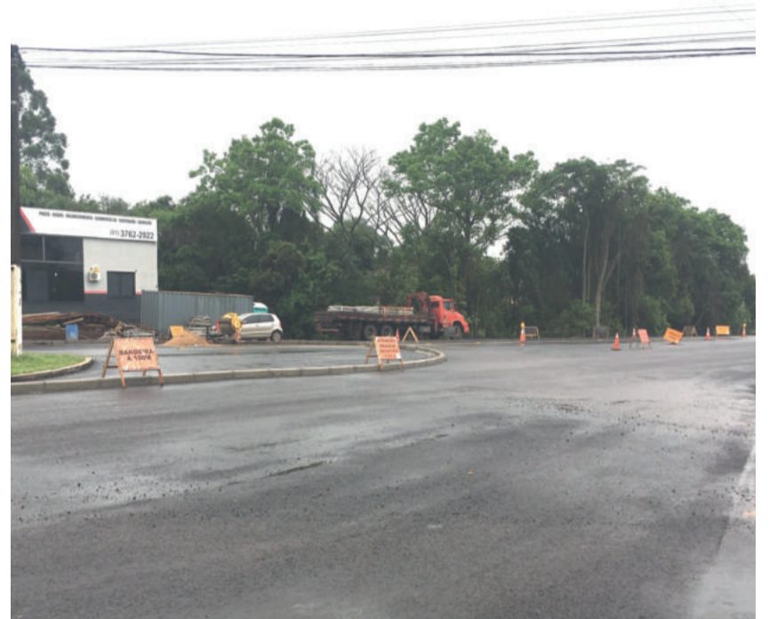
Chuva atrapalhou o andamento do cronograma de obras. Empresa pediu prorrogação do prazo, que vence dia 10 de setembro