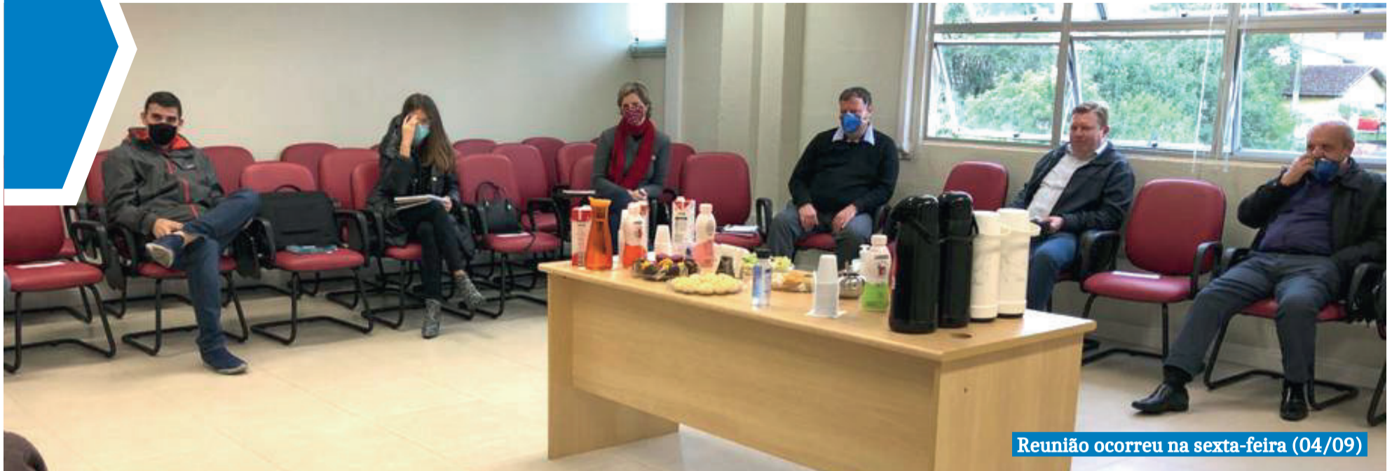
Reunião ocorreu na sexta-feira (04/09)