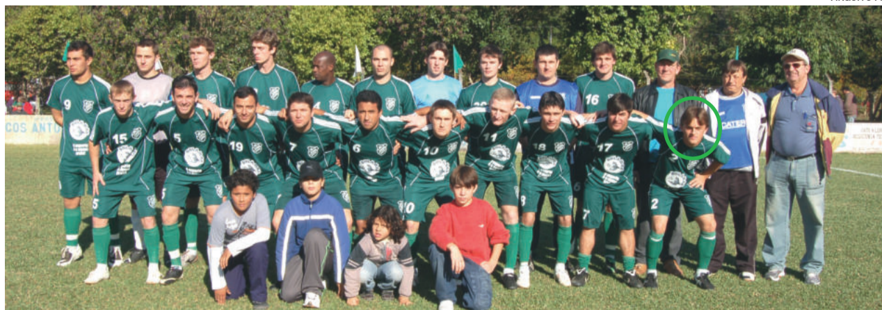
Em 2009, tricampeão municipal pelo Esperança