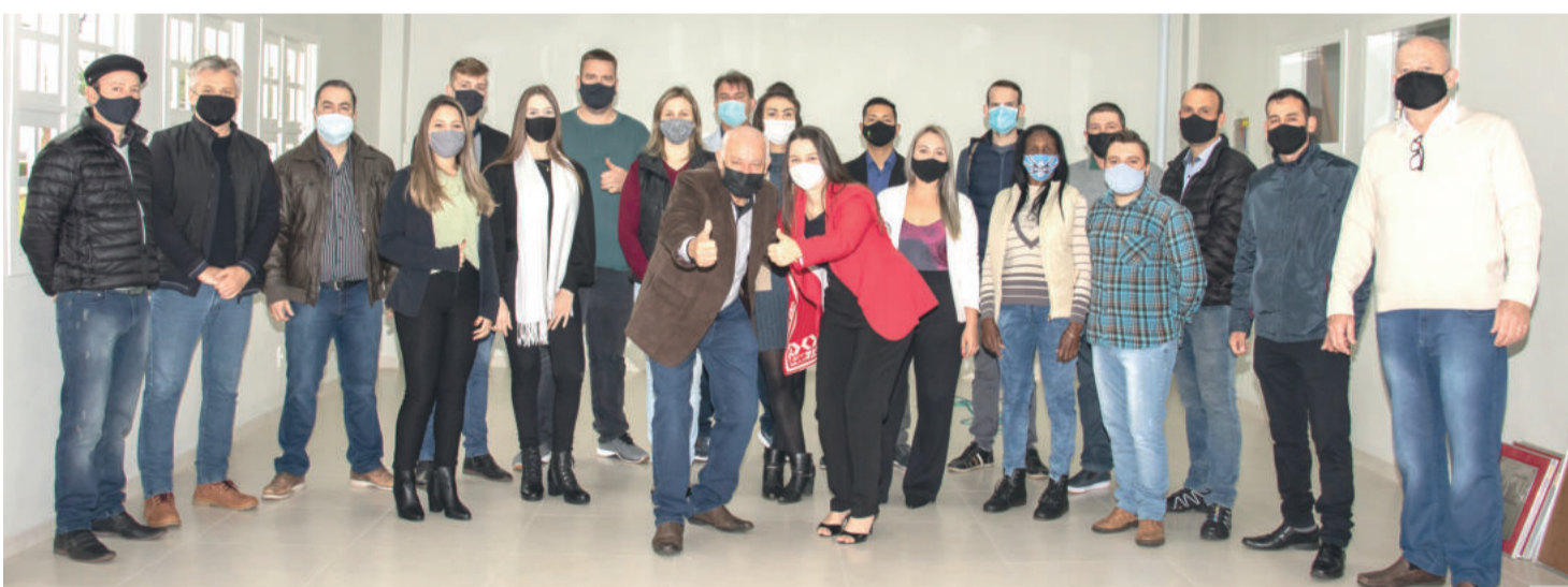
Candidatos a vereador pelo Cidadania e lideranças partidárias da coligação