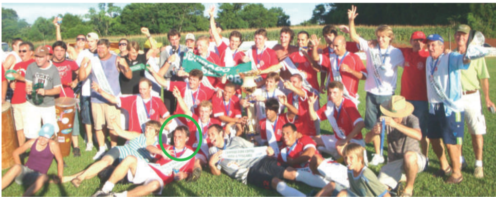
Gaúcho instantes após conquistar o tri do Regional da Aslivata em 2009