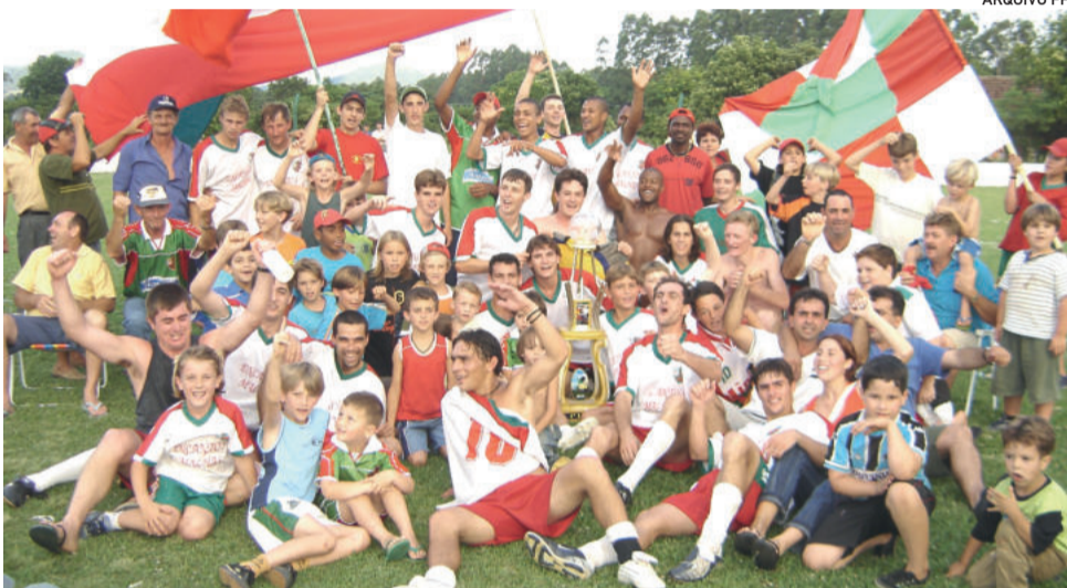
Em 2004, Canabarense festejou o título de forma invicta com um grupo fantástico