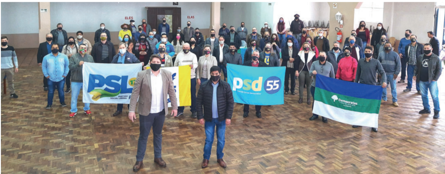
PSDB, PSD, PSL e DEM alinhados em coligação após as convenções realizadas no GR Canabarrense