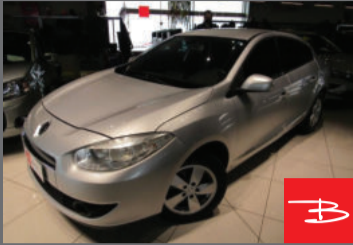
Renault Fluence Dynamique 2.0 16V HI-Flex 2012 Prata, 4 portas, Automático, Gasolina e Álcool. por R$ 32.990