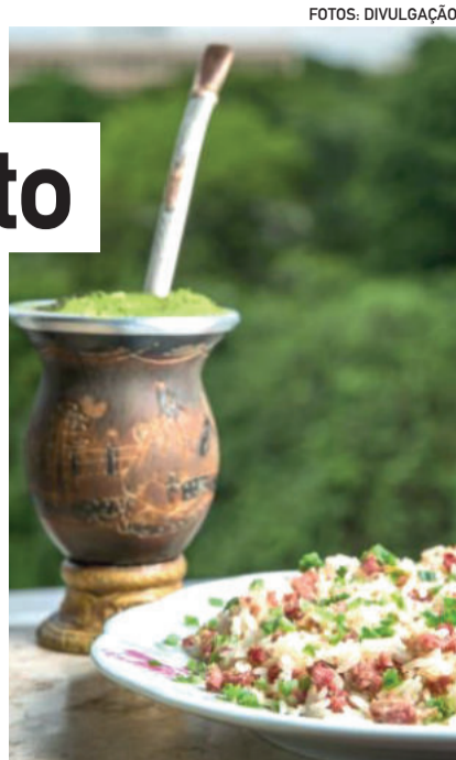
Culinária gaúcha será valorizada na Semana Farroupilha

Em Garibaldi, as atrações ocorrerão de forma on-line. A programação ocorre de 14 a 20 de setembro e será transmitida, das 17h às 18h, pelo Facebook da Rádio Garibaldi, em www.fb.com/radiogaribaldi/ . A Semana Farroupilha de Garibaldi é uma realização do CTG Sentinela da Serra.