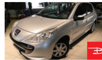
Peugeot 207 XR 1.4 8V Flex 2010 Prata, 4 portas, Manual, Gasolina e Álcool. por R$ 19.990