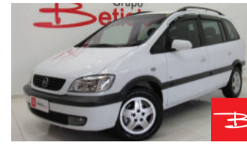
Chevrolet Zafira CD 2.0 Mpfi 16V 2002 Branco, 4 portas, Manual, Gasolina. por R$ 18.990