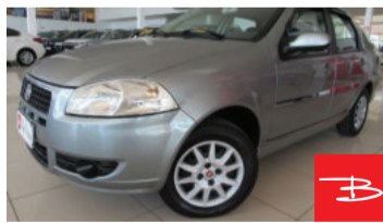
Fiat Idea Essence 1.6 16V Flex 2011 Cinza, 4 portas, Manual, Gasolina e Álcool. por R$ 23.990