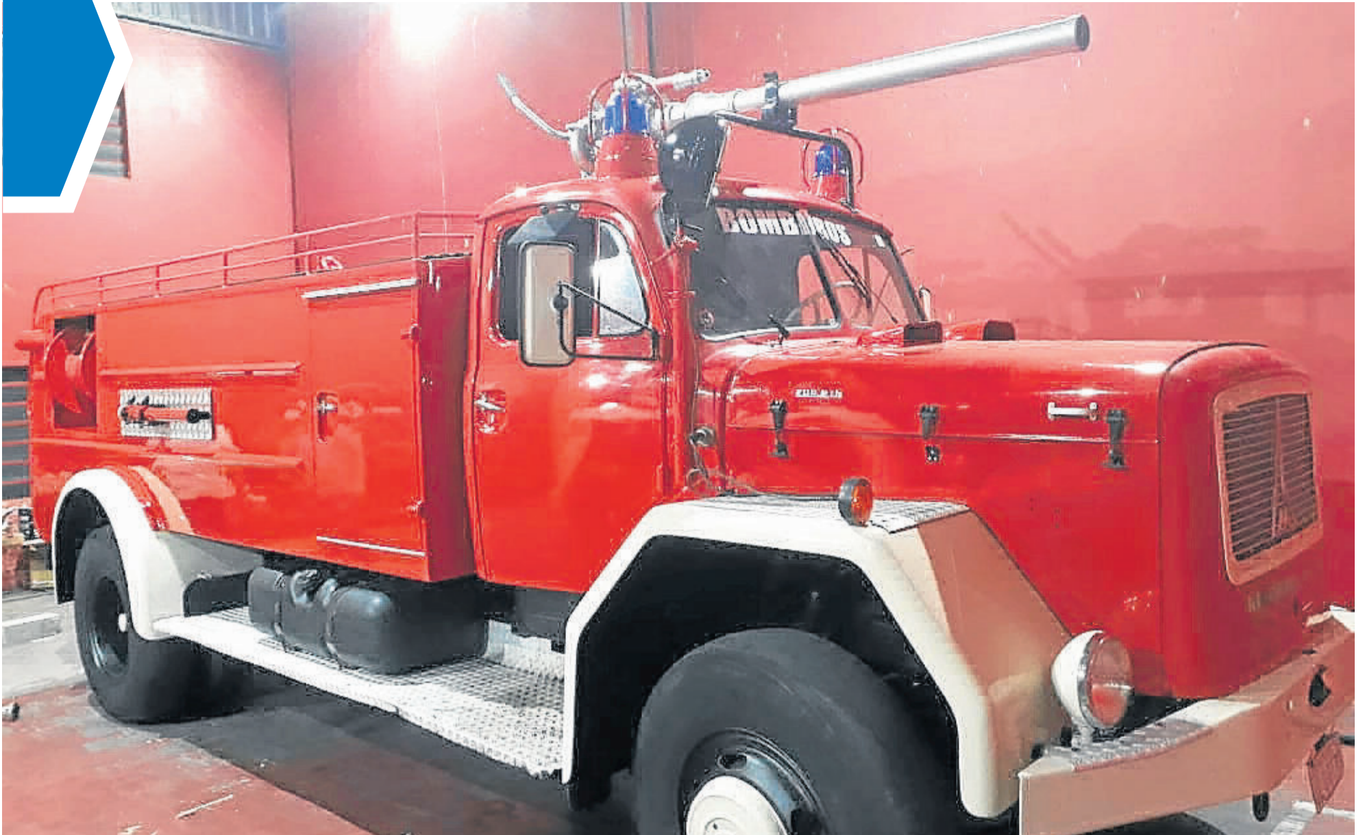
Veículo foi restaurado com o apoio de empresas