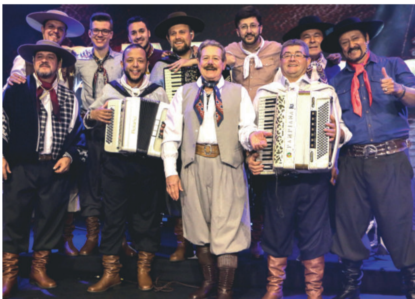
Os Monarcas se apresentam no dia 18 de setembro em Teutônia

Em nome dos organizadores do Conexões 14: Lions Club e Leo Club Teutônia. Desejamos a todos os envolvidos, confirmados e ainda não confirmados, no Show Beneficente o nosso maior apreço, carinho, consideração, parceria e GRATIDÃO! Até o próximo Conexões!!