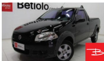
Fiat Strada Working 1.4 MPI 8V Flex 2010 Preto, 2 portas, Manual, Gasolina e Álcool. por R$ 25.990