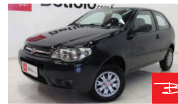
Fiat Palio 1.0 MPI 8V Fire Flex 2011 Azul, 2 portas, Manual, Gasolina e Álcool. por R$ 14.990