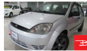
Ford Fiesta Sedan 1.0 MPI 8V Flex 2007 Prata, 4 portas, Manual, Gasolina e Álcool. por R$ 15.990