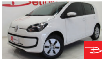
Volkswagen up! Move Up 1.0 MPI 12V Flex 2015 Branco, 4 portas, Manual, Gasolina e Álcool. por R$ 28.990