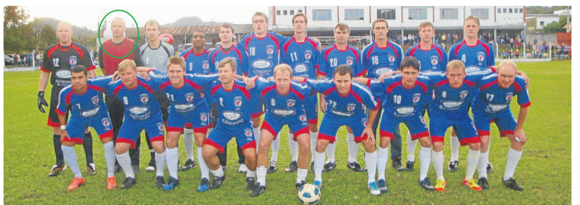
Fluminense da Harmonia, campeão da Copa Municipal da ACAT em 2012