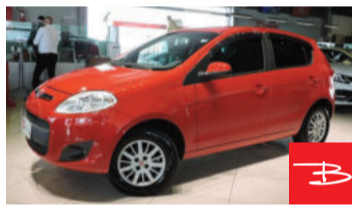
Fiat Palio Attractive 1.0 8V Flex 2014 Vermelho, 4 portas, Manual, Gasolina e Álcool. por R$ 26.900