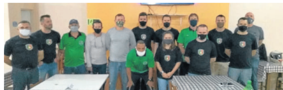
Pivi Arbitragem reuniu árbitros para atualizar as regras