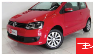
Honda Fit LX 1.4 8V 2008 Prata, 4 portas, Manual, Gasolina e Álcool. por R$ 24.900