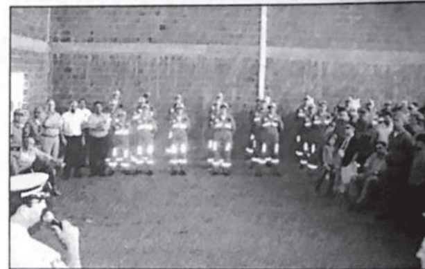
Primeira turma de Bombeiros Voluntários