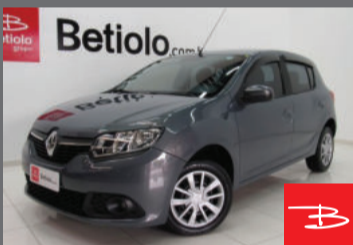
Renault Sandero Expression 1.0 16V Hi-Flex 2015 Cinza, 4 portas, Manual, Gasolina e Álcool. por R$ 28.990