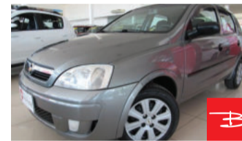
Chevrolet Corsa 1.0 Mpfi VHC 8V 2008 Cinza, 4 portas, Manual, Gasolina e Álcool. por R$ 14.990