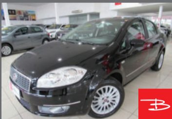
Fiat Linea Essence 1.8 16V Flex 2012 Preto, 4 portas, Manual, Gasolina e Álcool. por R$ 27.990