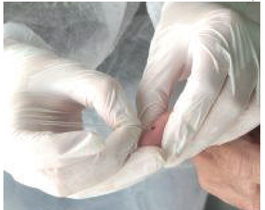
Esta foi a última etapa de testagens da pesquisa