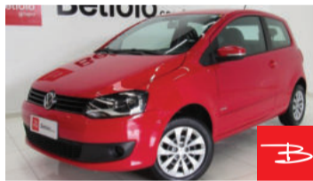
Volkswagen Fox 1.0 Mi 8V Total Flex 2013 Vermelho, 2 portas, Manual, Gasolina e Álcool. por R$ 24.990