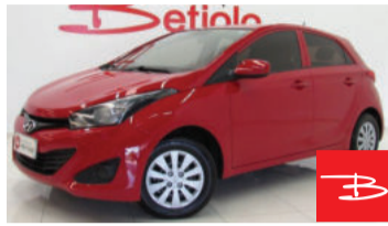
Hyundai HB20 Comfort 1.0 Flex 12V 2015 Vermelho, 4 portas, Manual, Gasolina e Álcool. por R$ 32.990