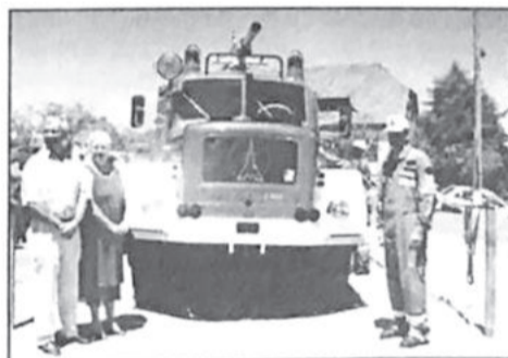
Décio (d) com casal alemão e o caminhão