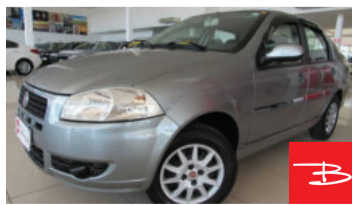
Fiat Siena Celebration EL 1.0 8V Flex 2012 Cinza, 4 portas, Manual, Gasolina e Álcool. por R$ 23.900