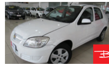
Chevrolet Prisma Maxx 1.4 mpfi 8V Econo.flex 2008 Branco, 4 portas, Manual, Gasolina e Álcool. por R$ 18.990