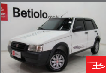
Fiat Uno Mille Way Economy 1.0 MPI 8V Flex 2013 Branco, 4 portas, Manual, Gasolina e Álcool. por R$ 21.990