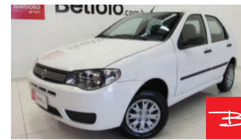
Fiat Palio 1.0 MPI 8V Fire Flex 2007 Branco, 4 portas, Manual, Gasolina e Álcool. por R$ 14.990