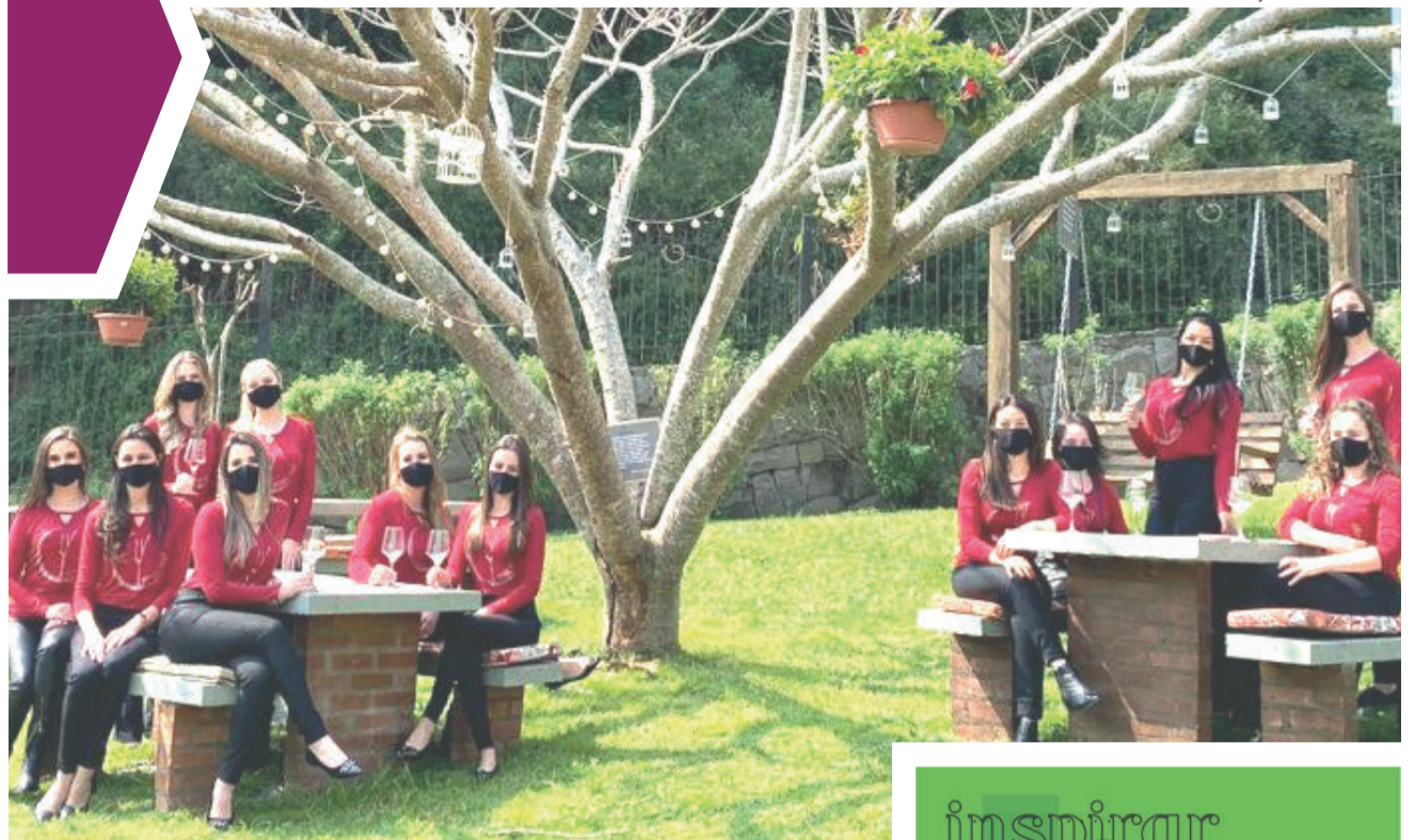
Candidatas desenvolvem atividades preparatórias para o concurso de escolha, cuja data ainda está indefinida

Apesar de sempre reforçar isso por aqui, a consulta com o profissional nutricionista é de suma importância para avaliar o seu momento atual bem como a sua meta a ser atingida, para um melhor desempenho e satisfação.