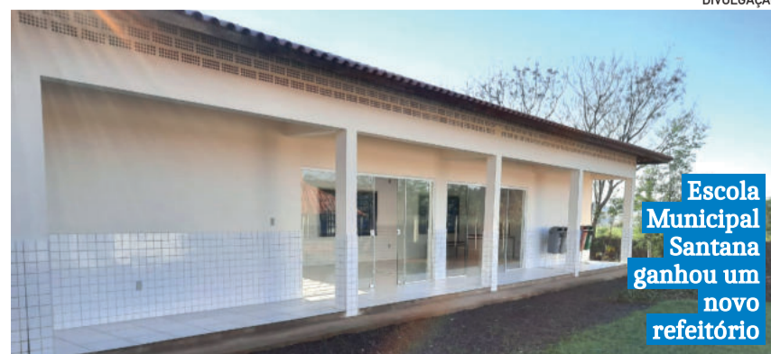
Escola Municipal Santana ganhou um novo refeitório