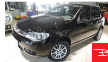
Fiat Palio Economy 1.0 8V Fire Flex 2012 Preto, 4 portas, Manual, Gasolina e Álcool. por R$ 18.900