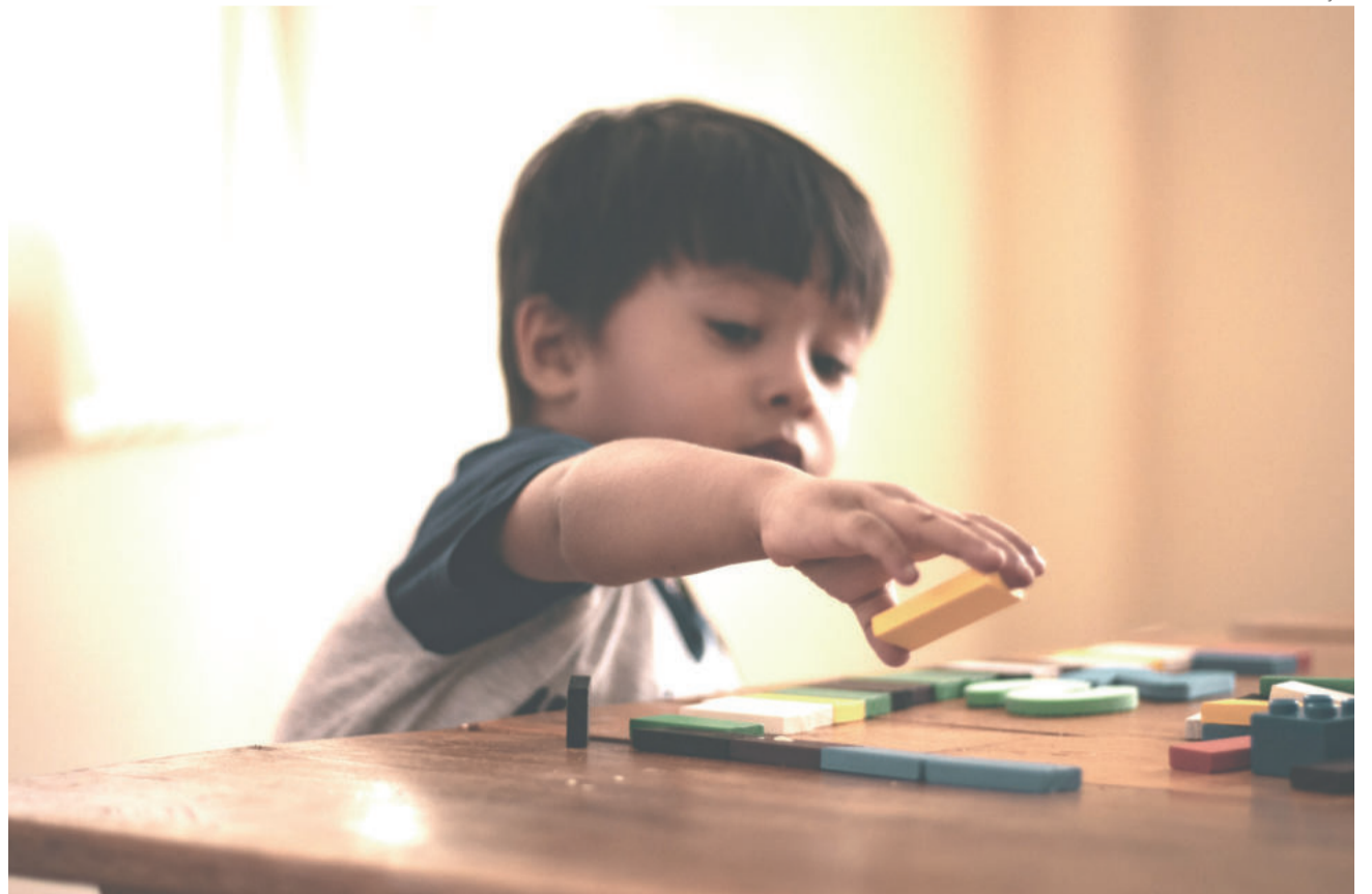
Sediada em Teutônia, casa deverá atender, também, crianças de Paverama, Imigrante, Westfália e Poço das Antas