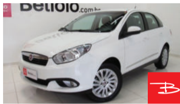
Fiat Grand Siena Essence 1.6 16V Flex 2013 Branco, 4 portas, Manual, Gasolina e Álcool. por R$ 26.990