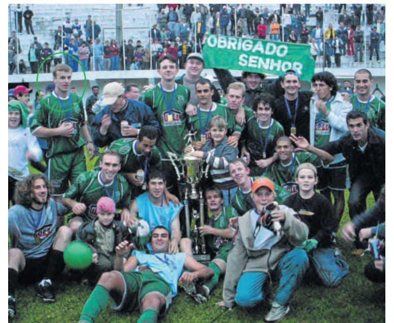
Em 2003, campeão regional pelo Esperança