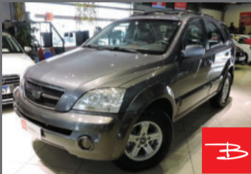
Kia Sorento EX 4X4 3.5 L V6 2004 Cinza, 4 portas, Automático, Gasolina. por R$ 29.900