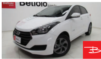
Hyundai HB20 Comfort Plus 1.0 Flex 12V 2017 Branco, 4 portas, Manual, Gasolina e Álcool. por R$ 34.990