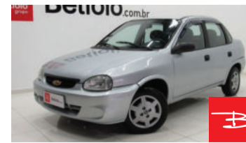
Chevrolet Classic Life 1.0 Mpfi 8V Flexpower 2010 Prata, 4 portas, Manual, Gasolina e Álcool. por R$ 14.990