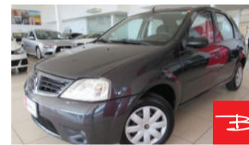
Renault Logan Expression 1.0 16V Hi-Flex 2008 Cinza, 4 portas, Manual, Gasolina e Álcool. por R$ 17.990