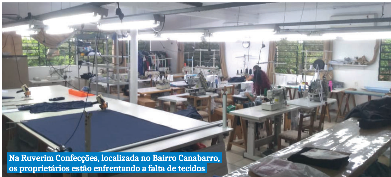
Na Ruverim Confeções, localizada no Bairro Canabarro, os proprietários estão enfrentando a falta de tecidos