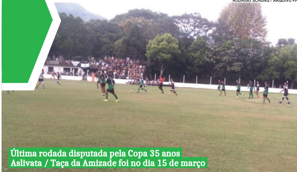
Última rodada disputada pela Copa 35 anos Aslivata / Taça da Amizade foi no dia 15 de março