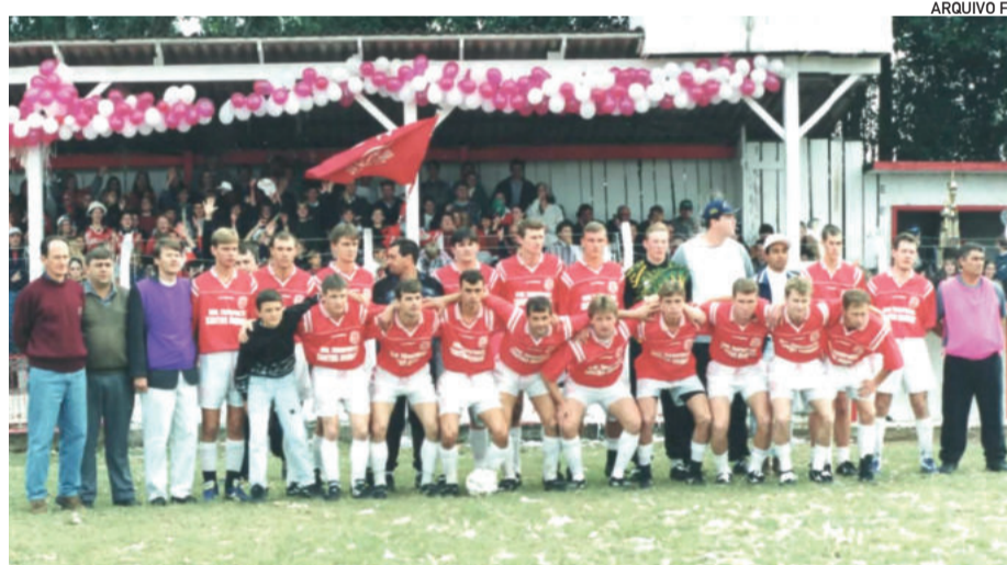
Pelo Gaúcho, campeão municipal de Teutônia em 1999

Em 2000 ele deixou a equipe do Gaúcho para jogar pelo Boa Vista. “Onde também fiz grandes amizades, um clube que lembro até hoje, meus pais são de lá. E fiquei bicampeão da Copa Hércio Pêgas pelo Boa Vista contra o Catarinense, também um título memorável”, conta.