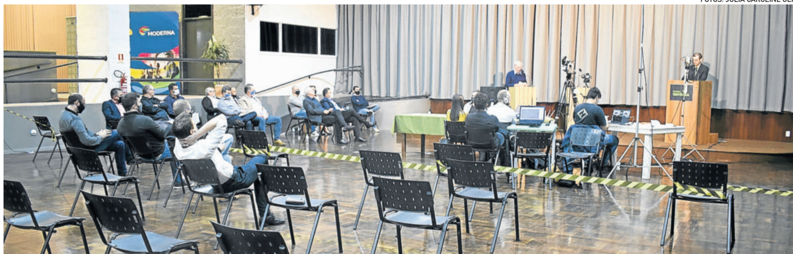
As sete chapas estiveram presentes e responderam às perguntas previamente elaboradas