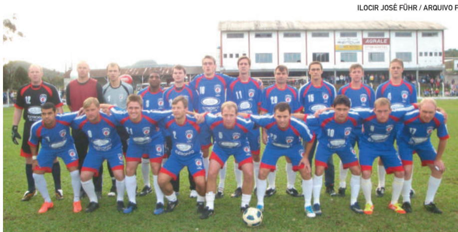
Pelo Fluminense da Harmonia, Penera também teve conquistas, como a Copa Teutônia de 2012