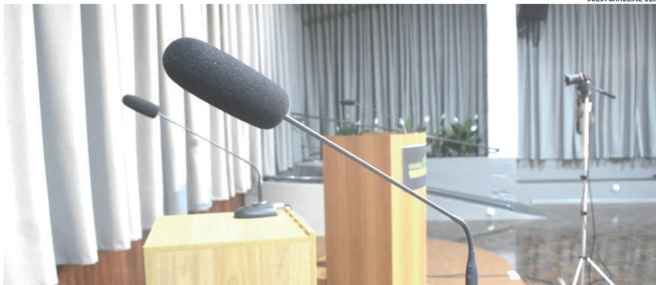
Próximos debates acontecem no sábado e domingo