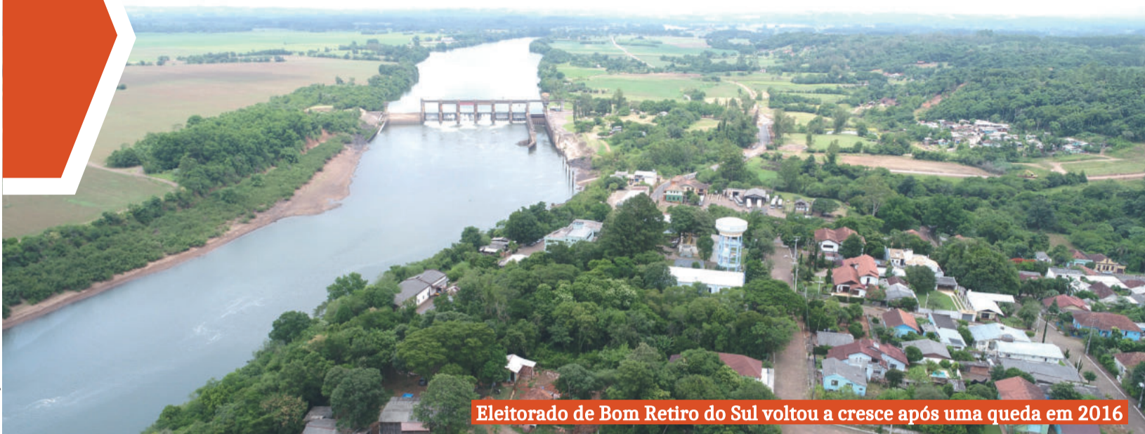
Eleitorado de Bom Retiro do Sul voltou a crescer após uma queda em 2016