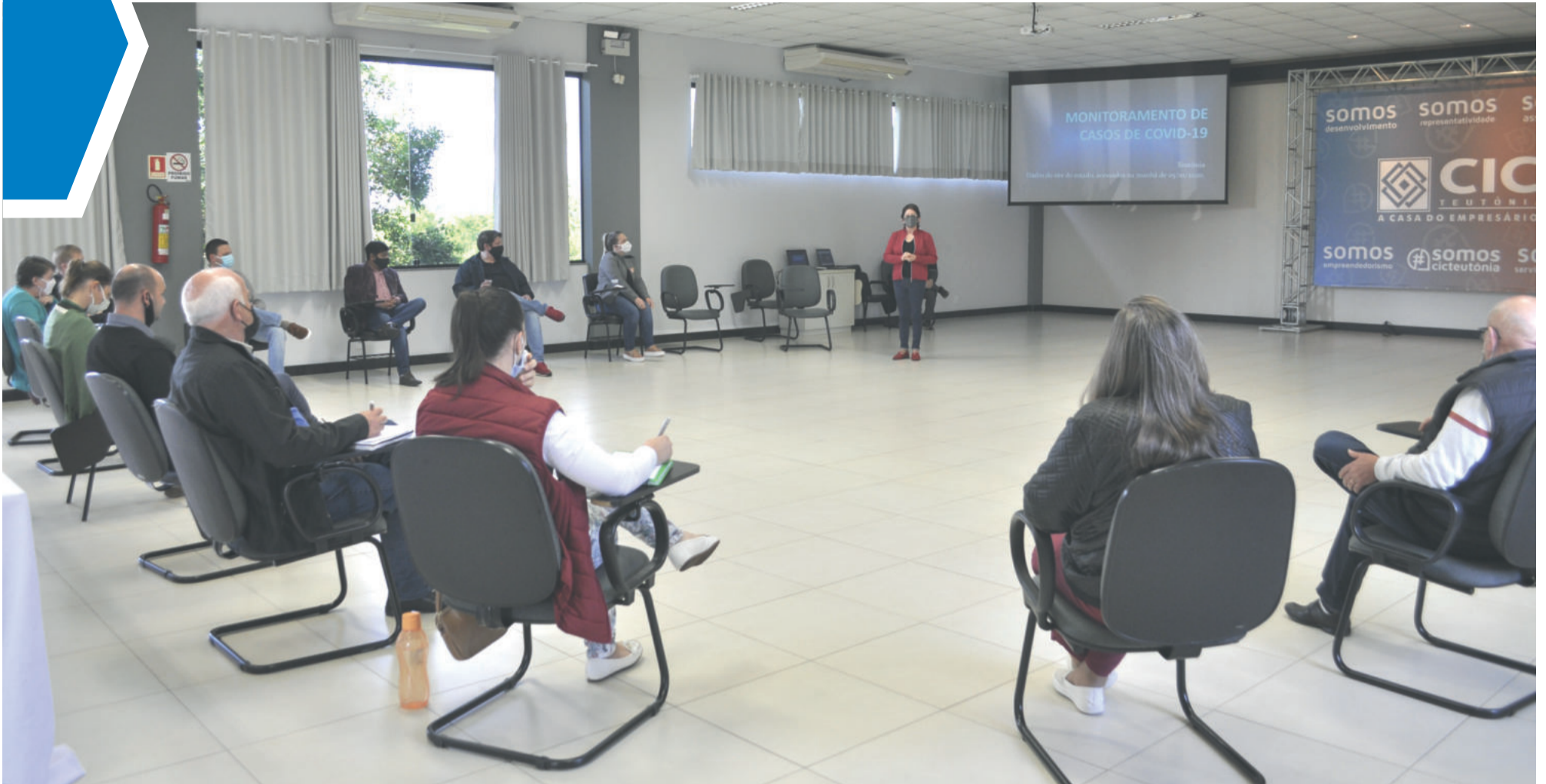
Encontro reuniu candidatos e integrantes do comitê