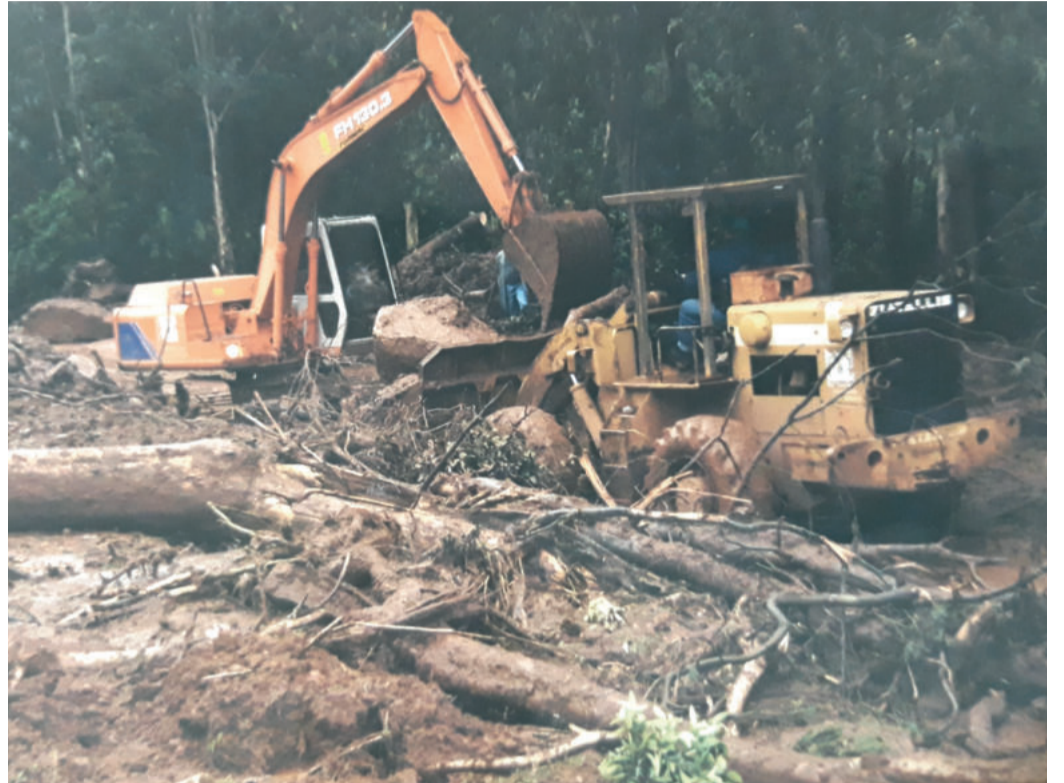
Máquinas da Prefeitura levaram uma semana para liberar a via