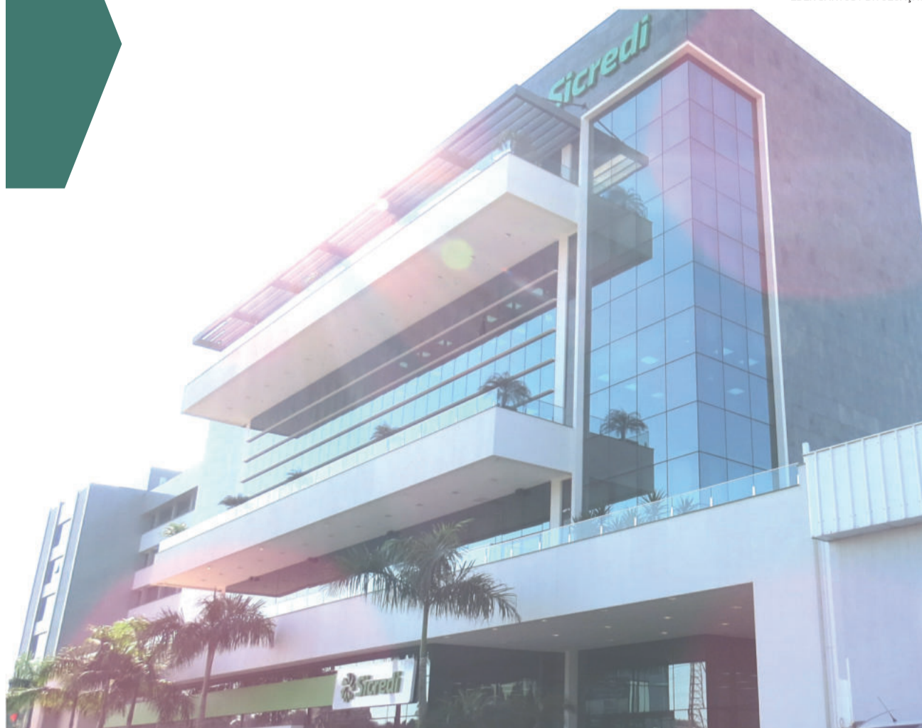
Sicredi aparece como o primeiro nome na categoria cooperativas de crédito do RS