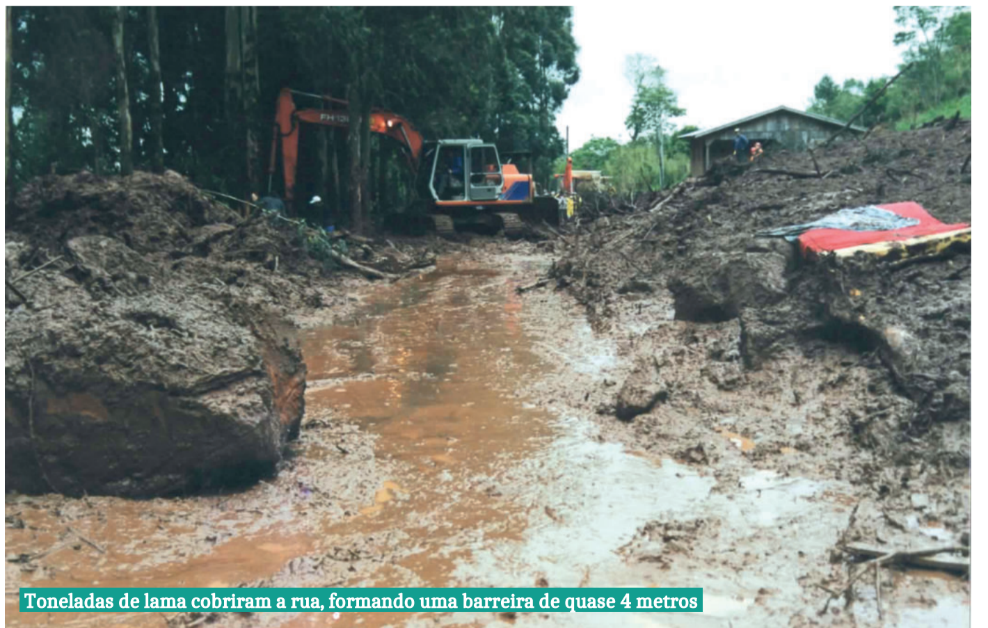
Toneladas de lama cobriram a rua, formando uma barreira de quase 4 metros