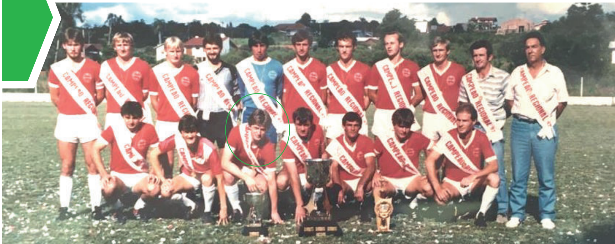
Gaúcho campeão regional em 1987