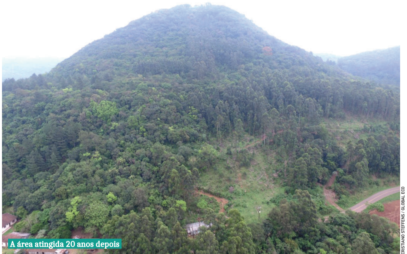
A área atingida 20 anos depois