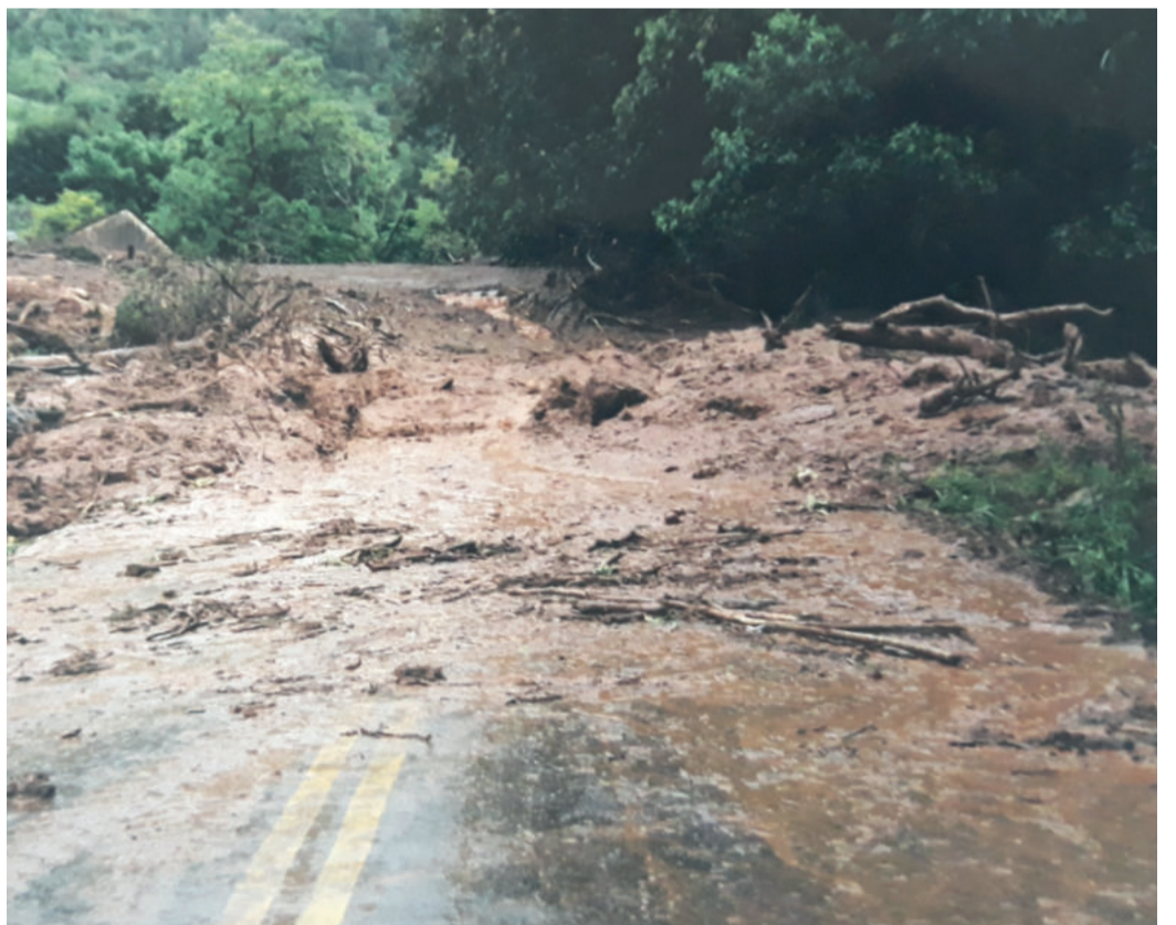
Deslizamento deixou rastro de destruição