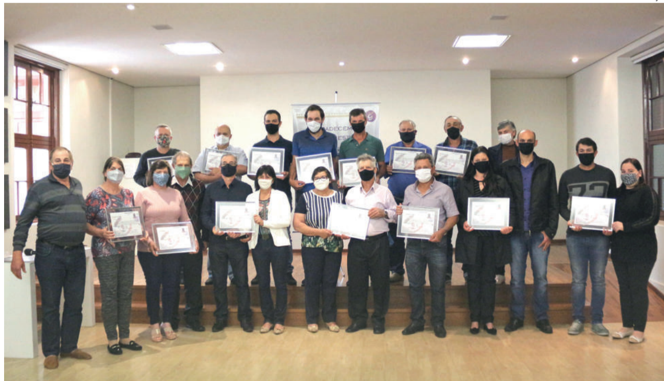
Produtores rurais homenageados