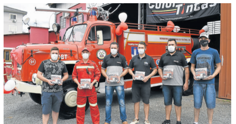
Representantes que colaboraram com a reforma