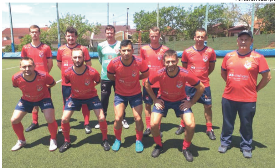
Demonhos Jr aplicou 5 a 1 e divide a liderança com mais 3 equipes