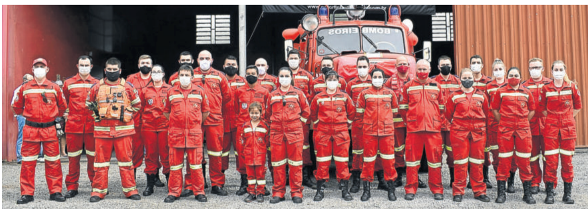
Integrantes da corporação se reúnem para ato de entrega do veículo

Os outros dois caminhões da corporação levam mil e quatro mil litros. "Se acontece um incêndio maior, precisamos de um caminhão com mais apoio, e o Alemão leva quase seis mil litros de água. A motobomba dele é muito boa. É uma relíquia pra nós e para comunidade", reforça.