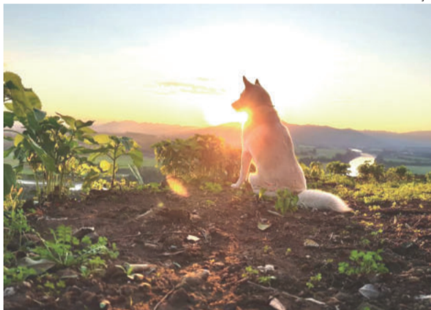
1º lugar ficou com Lauren Sulzbach