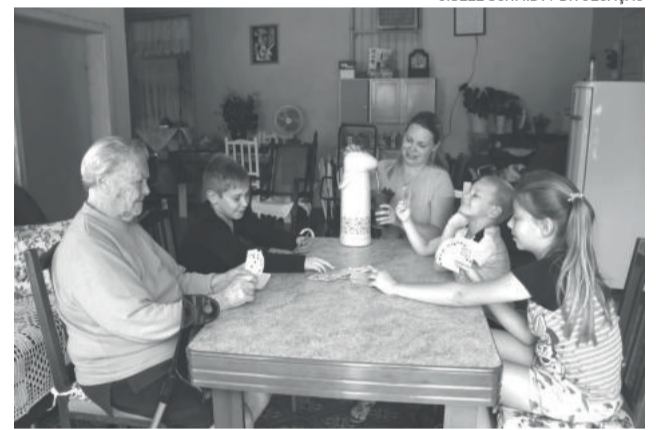
Alegrias em família, de Gisele Schmidt, é o título do 2º lugar