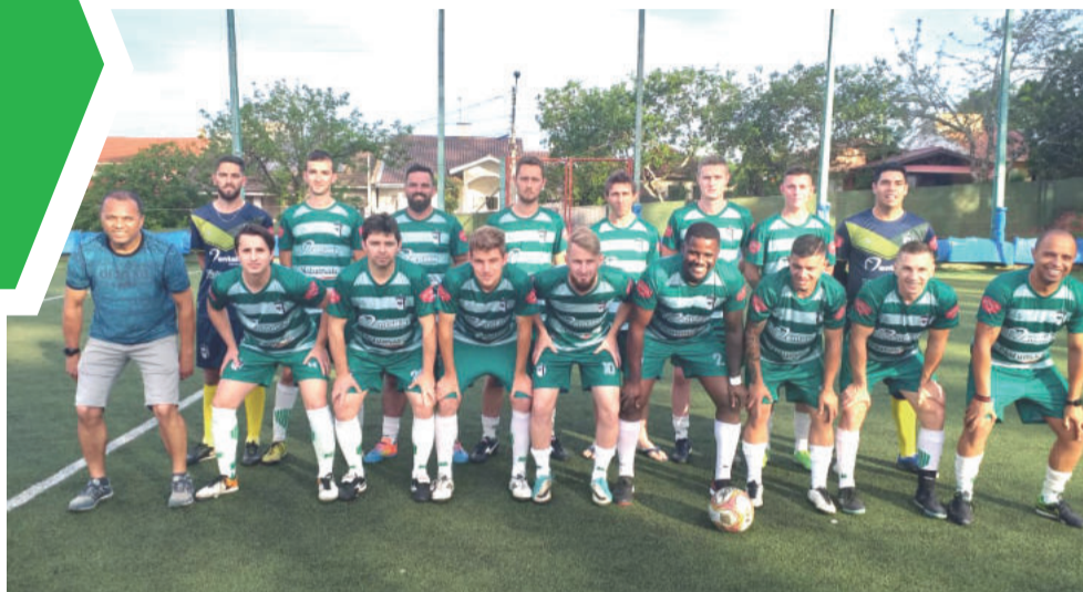
Sokanelinhas goleou por 5 a 1 e assumiu a vice-liderança do grupo azul