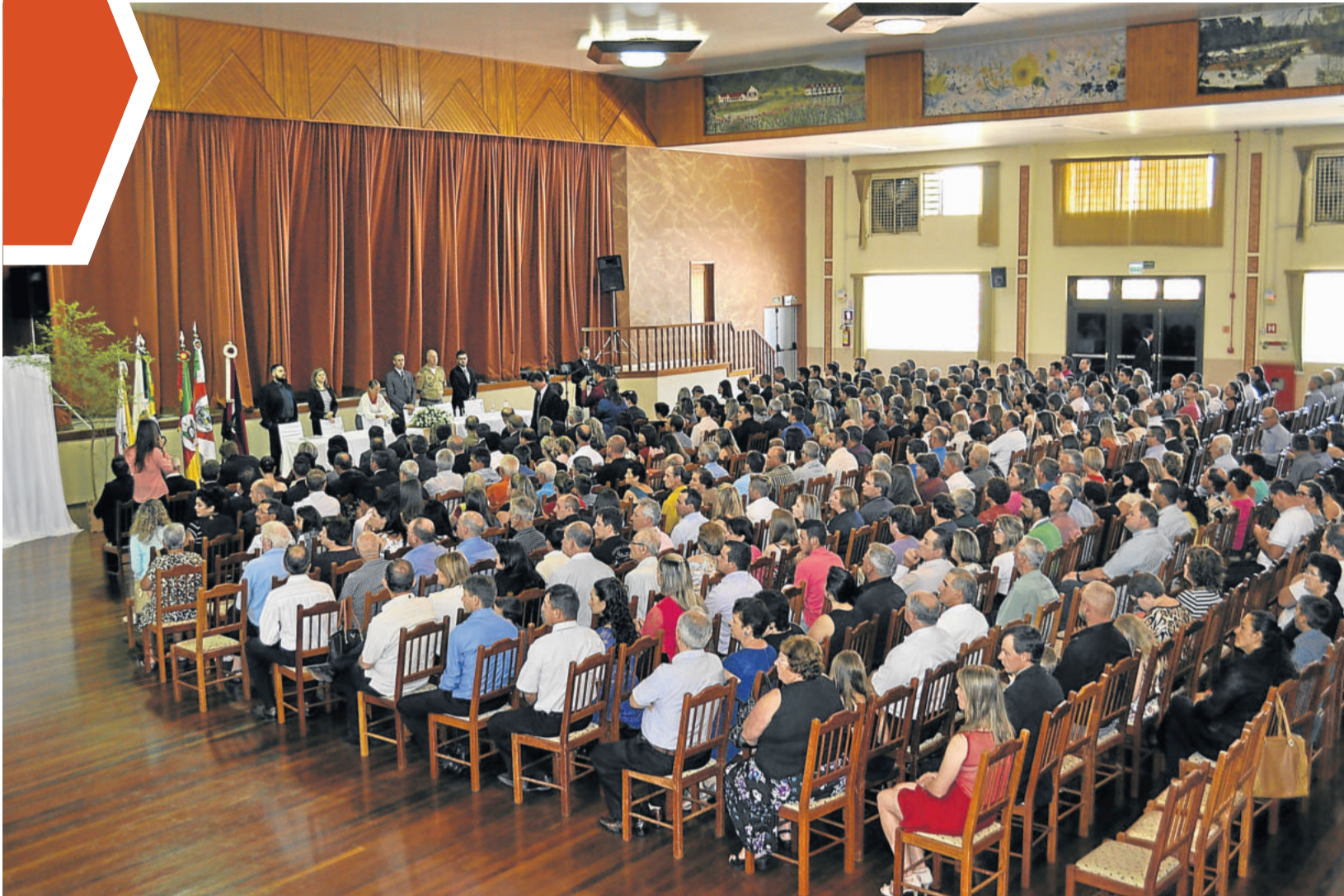
Em 2016, cerimônia de diplomação contou com a presença de público. Em 2020, somente os eleitos estarão presentes para receber o diploma.