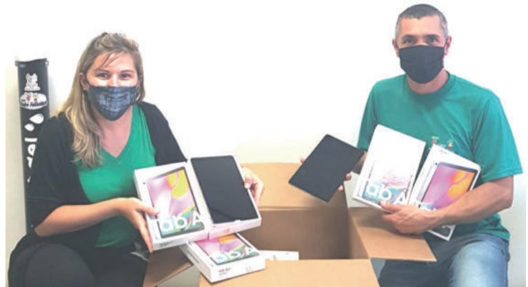
Cada escola receberá 30 tablets

Segundo ela, a exemplo das adaptações necessárias neste ano, com a pandemia do coronavírus, as escolas precisam estar cada vez mais munidas de recursos para oferecer as diferentes atividades e modalidades de ensino.