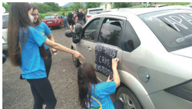
Faixas e cartazes pediram por justiça e pelo fim da violência contra os animais