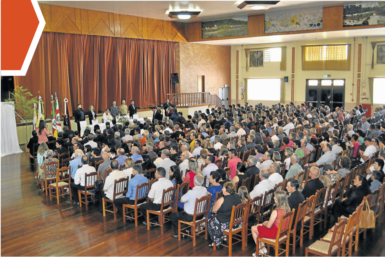
Em 2016, cerimônia de diplomação contou com a presença de público. Em 2020, somente os eleitos estarão presentes para receber o diploma.