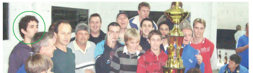
Em 2010, título marcante pelo Juventude da Frank