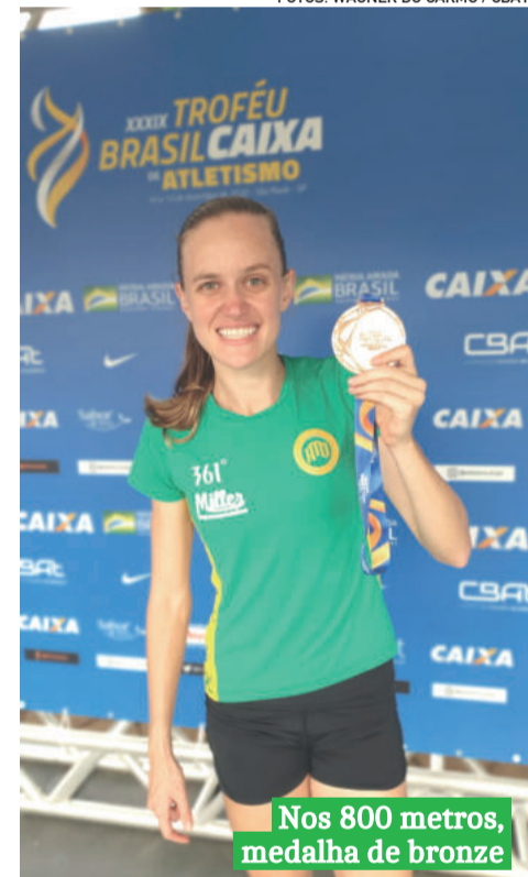
Nos 800 metros, medalha de bronze

Muita Internet para você, sua família e quem mais aparecer.