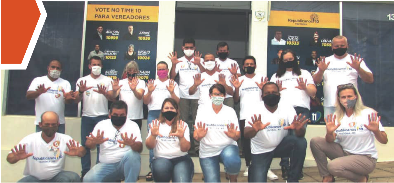
Republicanos teve sua maior nominata em Teutônia