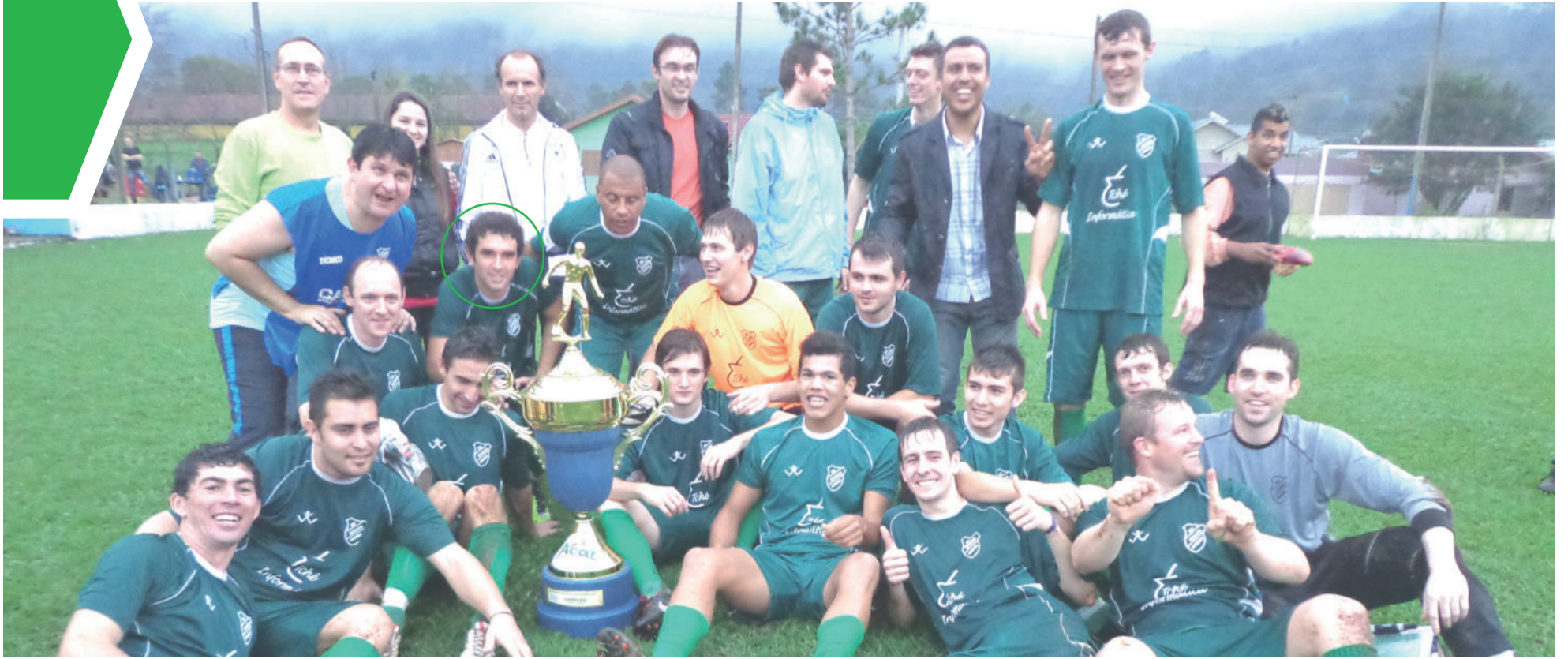
Em 2013, nova conquista pelo Esperança