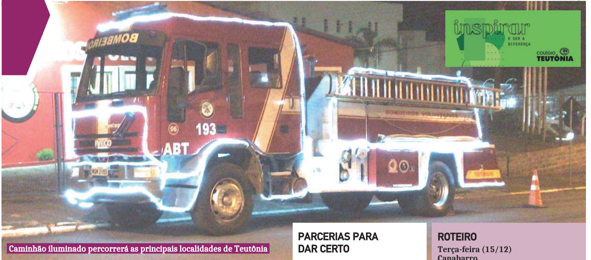
Caminhão iluminado percorrerá as principais localidades de Teutônia