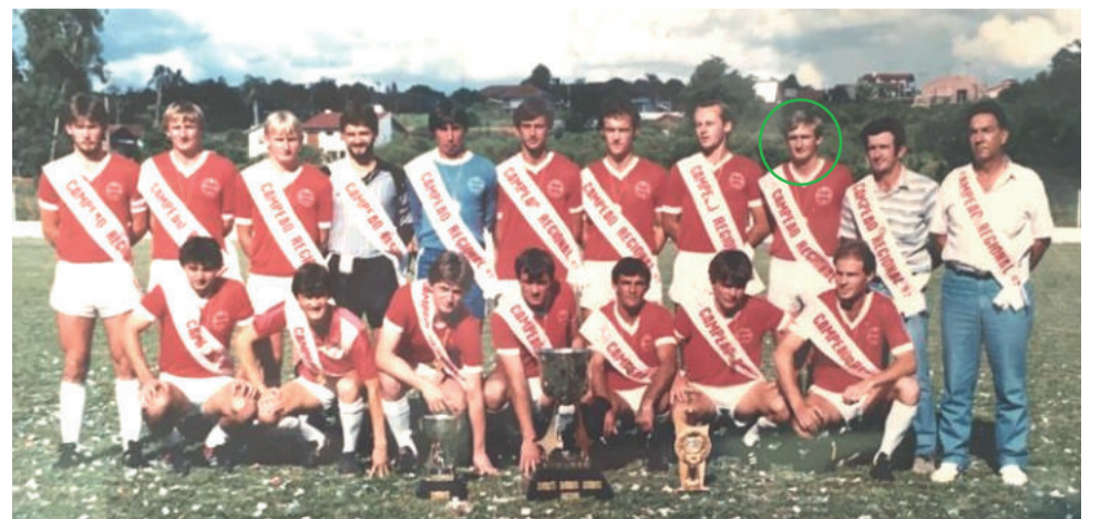
Campeão Regional com o Gaúcho em 1987

Com o passar dos anos, no entanto, foi preciso optar por uma das paixões. “O segredo da felicidade é fazer o que tu gosta, e eu sempre fiz o que eu gosto. Das duas coisas que eu sempre fiz, jogar futebol e fazer música, são minhas paixões e eu sempre fiz isso na vida. Nunca abri mão disso”, afirma. Quando teve que optar, percebeu que era preciso levar mais a sério a música. Era necessário optar por uma carreira. Mesmo com condições de atuar profissionalmente no futebol, era muito difícil alcançar essa possibilidade naquela época.