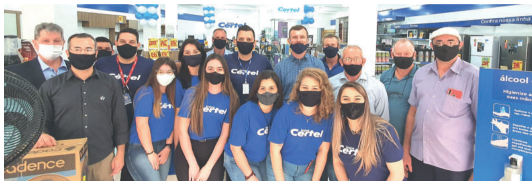
Nas lojas, atendimento aos associados e clientes