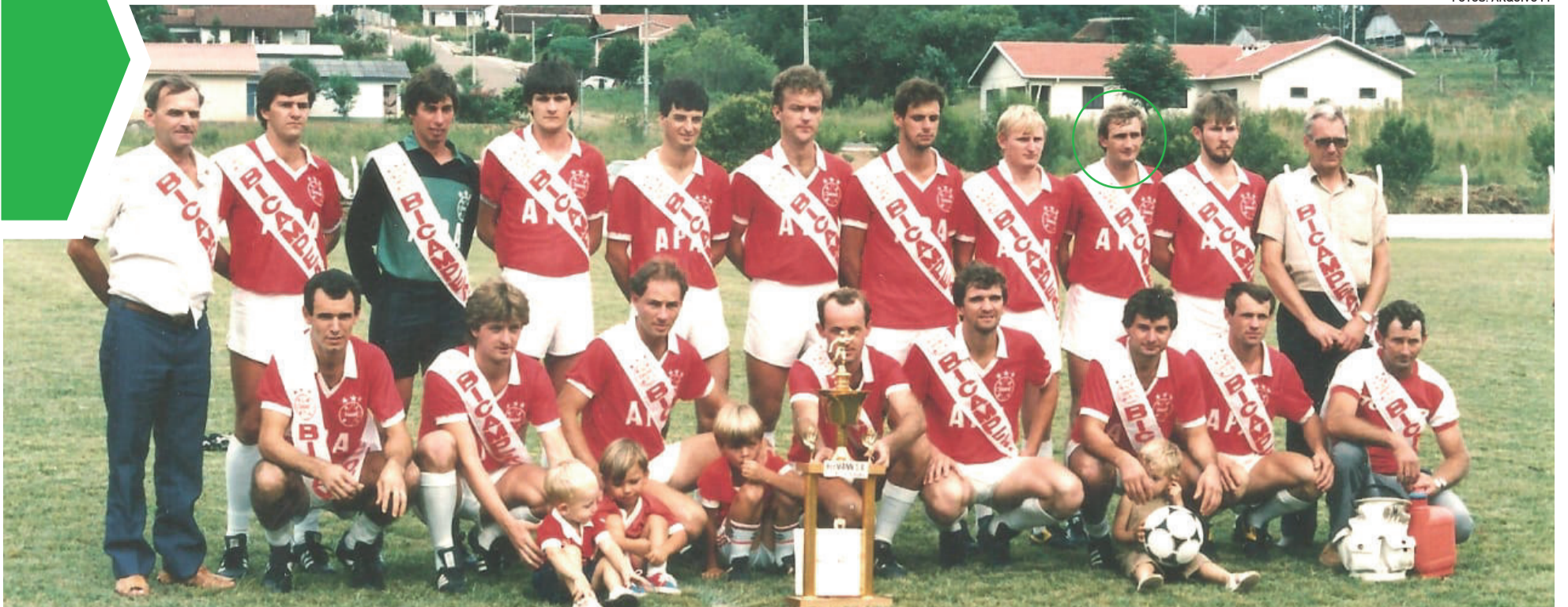
Bicampeão Regional com o Gaúcho em 1989