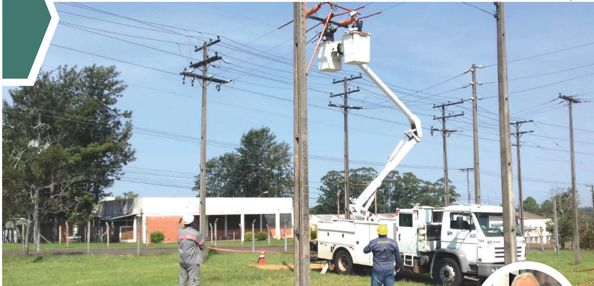
Equipes comprometidas com a qualidade do fornecimento de energia para os associados