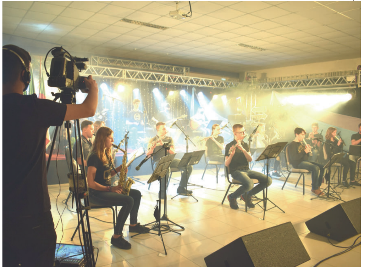
Na abertura, apresentou-se a Orquestra Jovem de Teutônia

Entre as atividades realizadas nesta quinta e sexta-feira, estiveram espaços de música, dança, contação de histórias, oficina de maquiagem artística, bate-papo com a patrona, palestras e espaço com o Coral Municipal Infante Juvenil de Teutônia. As transmissões ficarão disponíveis no canal do YouTube da pasta: Secretaria Municipal de Educação – Teutônia/RS. Toda a programação usa plataforma virtual, que poderá ser acessada pelo site www.educteutonia.com.br/feiradolivro . Pelo site, é possível ter acesso à banca virtual das duas livrarias parceiras do evento: Livraria Wessel, de Teutônia, e Livraria Kadernus, de Arroio do Meio. Também é possível acessar todas as atividades, links dos vídeos e lives após a realização.