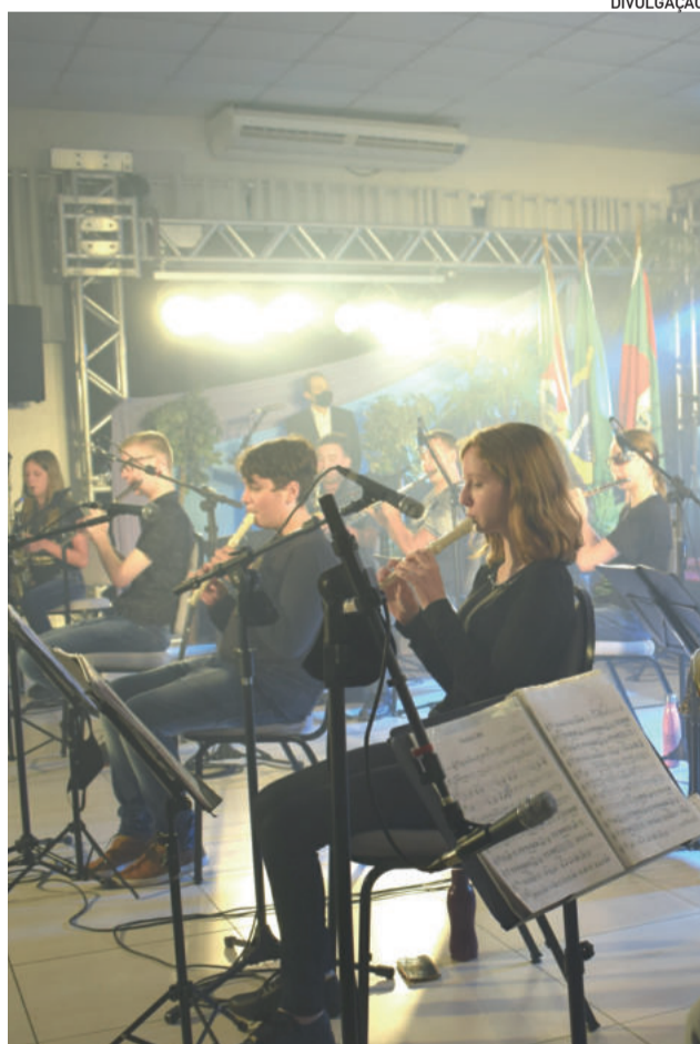
Feira do Livro pôde ser acompanhada de casa com transmissão ao vivo