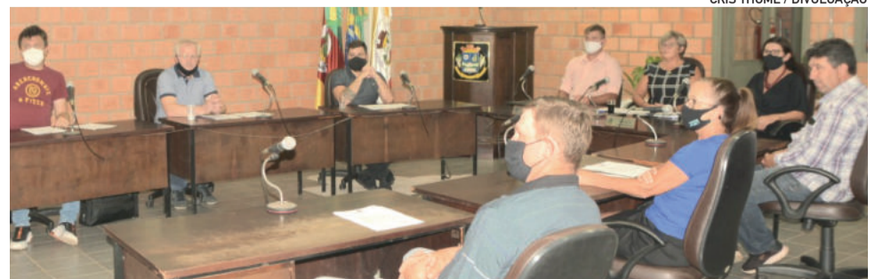
Sessão aprovou quatro projetos e não houve uso da tribuna