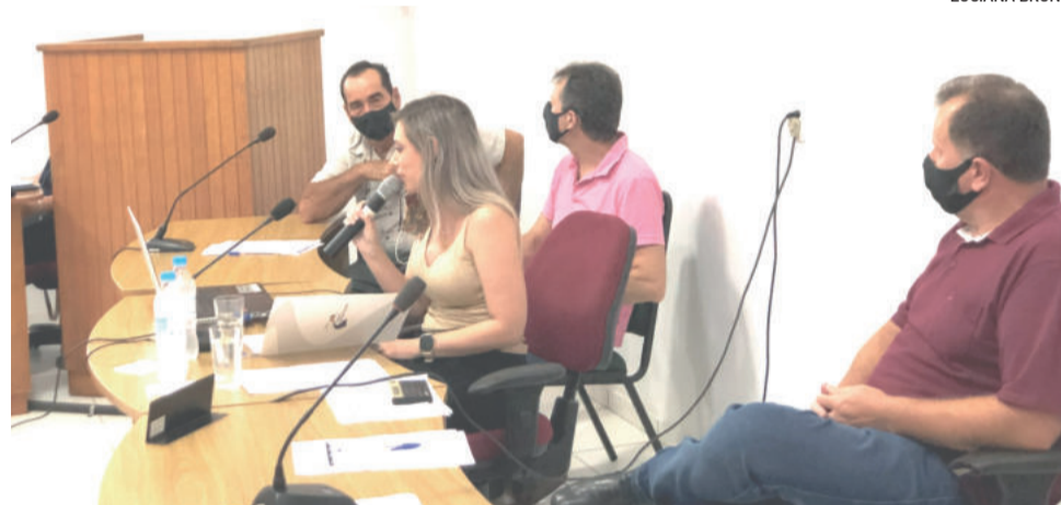
Prestação de contas foi realizada por servidores