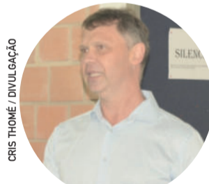
CRIS THOMÉ / DIVULGAÇÃO

gratificadas e de todos os cargos em comissão, com exceção de duas gestantes, por motivo legal. Neste primeiro momento acontece um estudo sobre a real necessidade em cada setor. Por isso, também pedimos a compreensão da comunidade, pois estamos com servidores de férias e nenhum cargo em comissão, mas mesmo assim, é preciso também destacar que todos os serviços essenciais e urgentes estão sendo atendidos” finalizou Porsche.