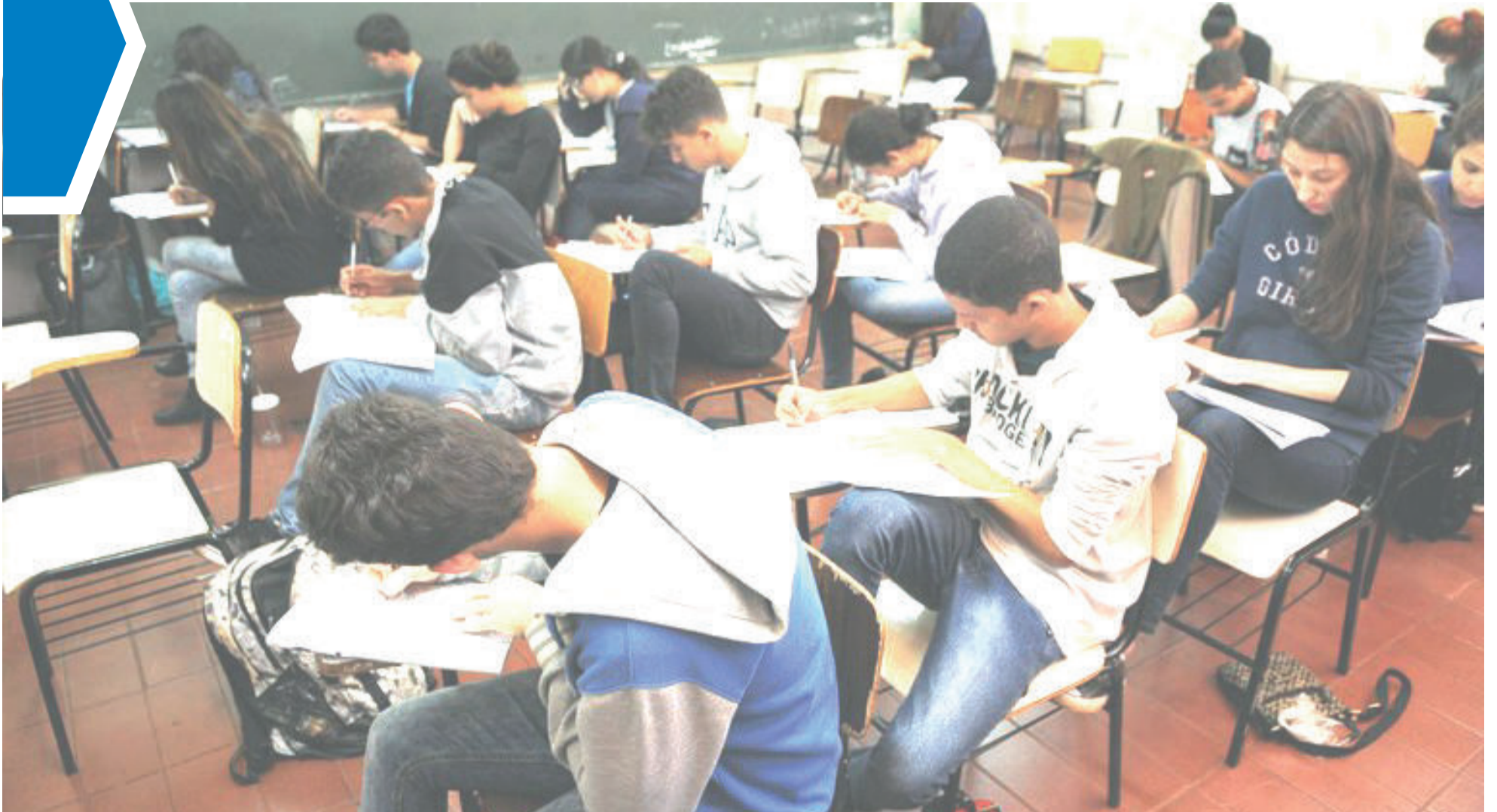
Este ano o Enem será diferente e terá que seguir diversas regras para prevenção da Covid-19