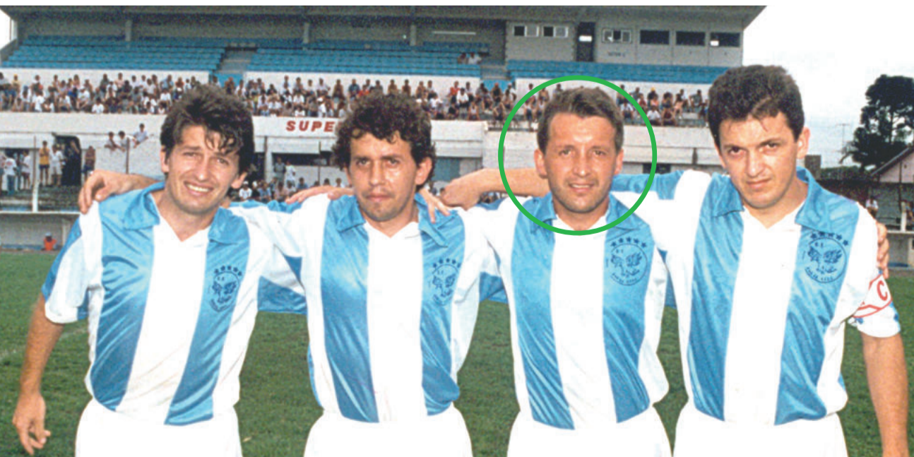
O quarteto dos Irmãos Bolinha fez história no futebol amador