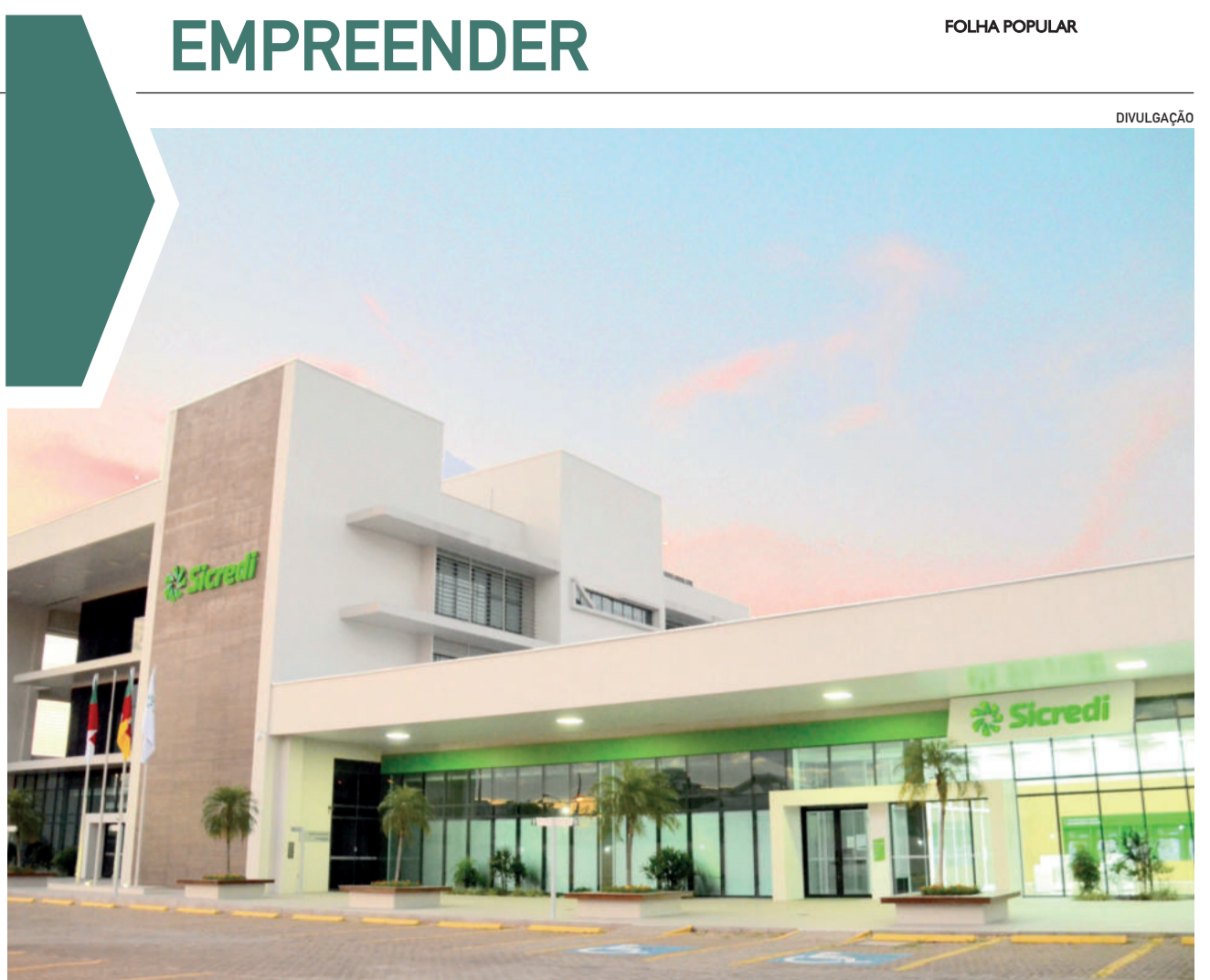
Sicredi Ouro Branco distribuiu, na cota capital dos sócios, mais de R$1,7 bilhões