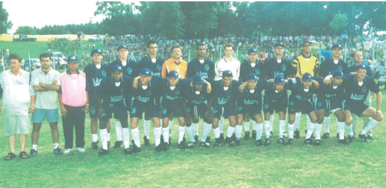
A equipe do Águia Azul, campeã regional em 1999