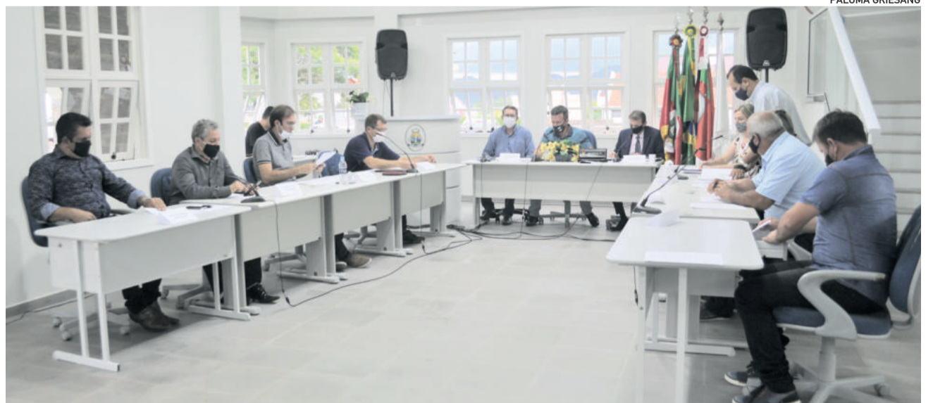
Primeiros projetos deram entrada na sessão desta terça-feira (12/1)