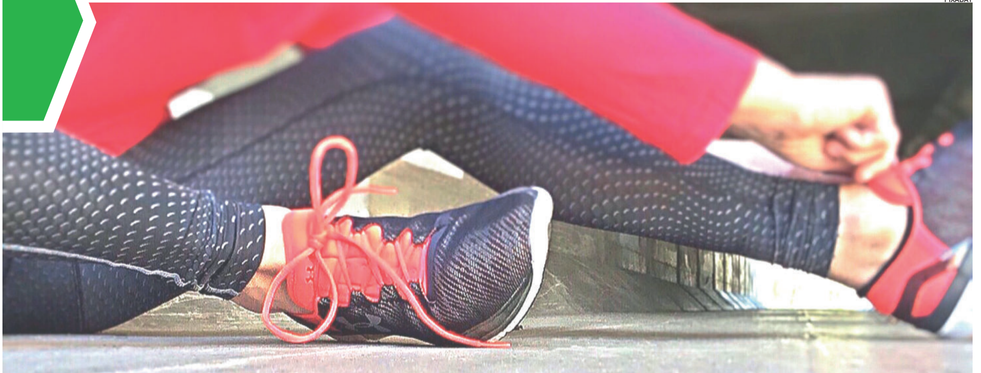
As atividades físicas proporcionam bem-estar físico e emocional