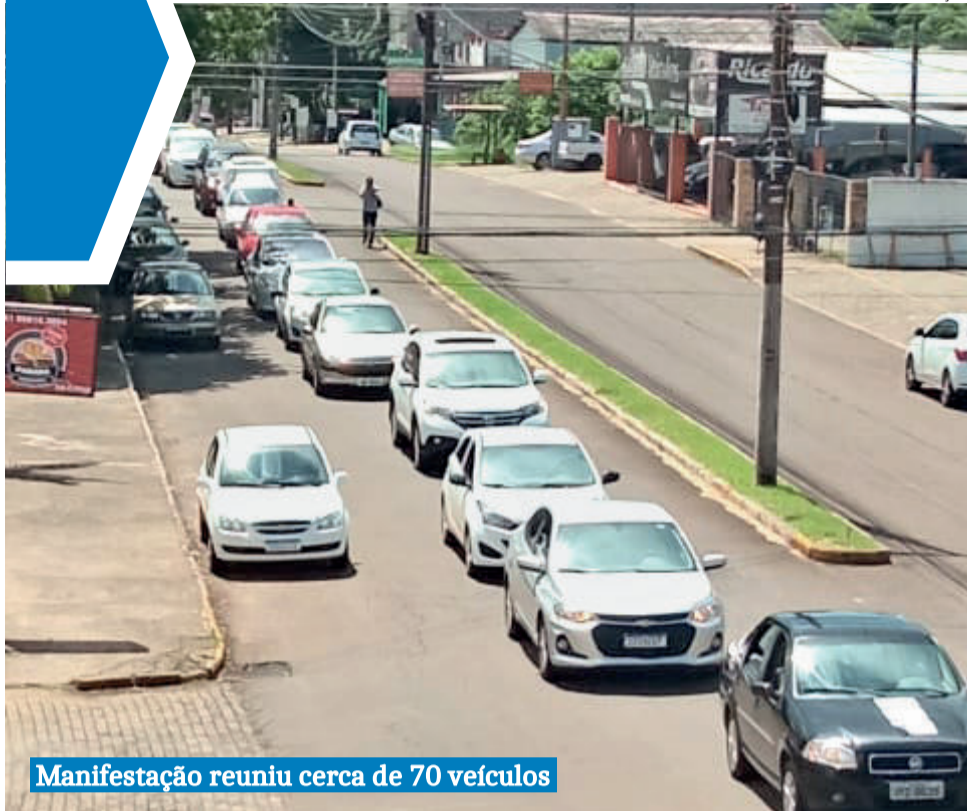
Manifestação reuniu cerca de 70 veículos