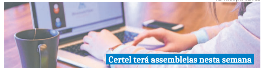
Certel terá assembleias nesta semana