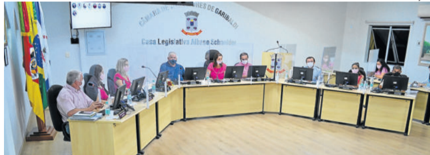
Vereadores apresentaram três primeiros projetos legislativos