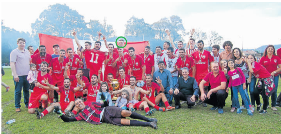
Atlético Gaúcho campeão municipal de Teutônia em 2018