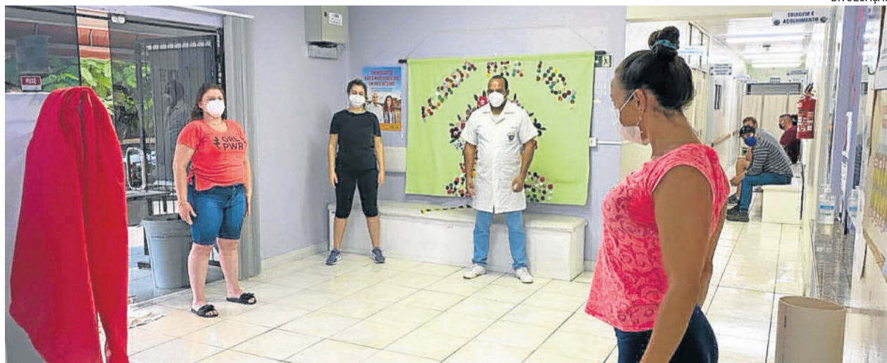
Atividades são realizadas com colaboradores

Entre os benefícios, fazer alongamentos diminui a ansiedade, melhora a postura, aumenta a flexibilidade do corpo, reduz o estresse gerado pelo ambiente de trabalho, diminui a tensão, alivia dores musculares, melhora a respiração e a sensação de bem-estar.