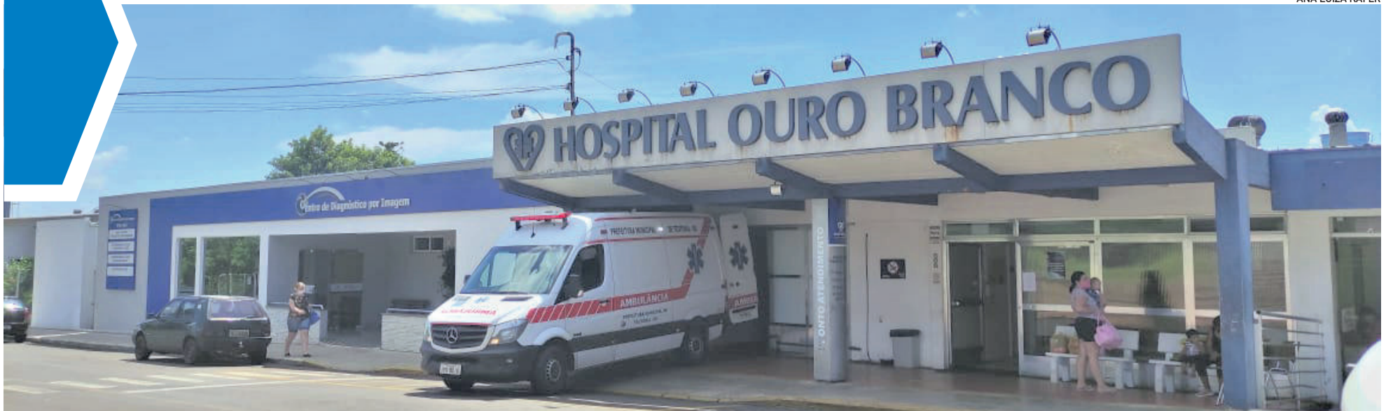
Hospital Ouro Branco, de Teutônia, será beneficiado