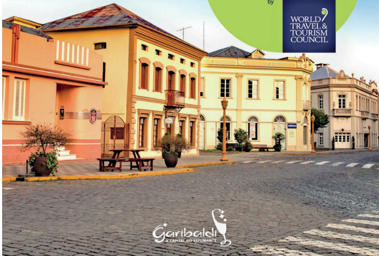
Garibaldi está entre destinos turísticos seguros e responsáveis