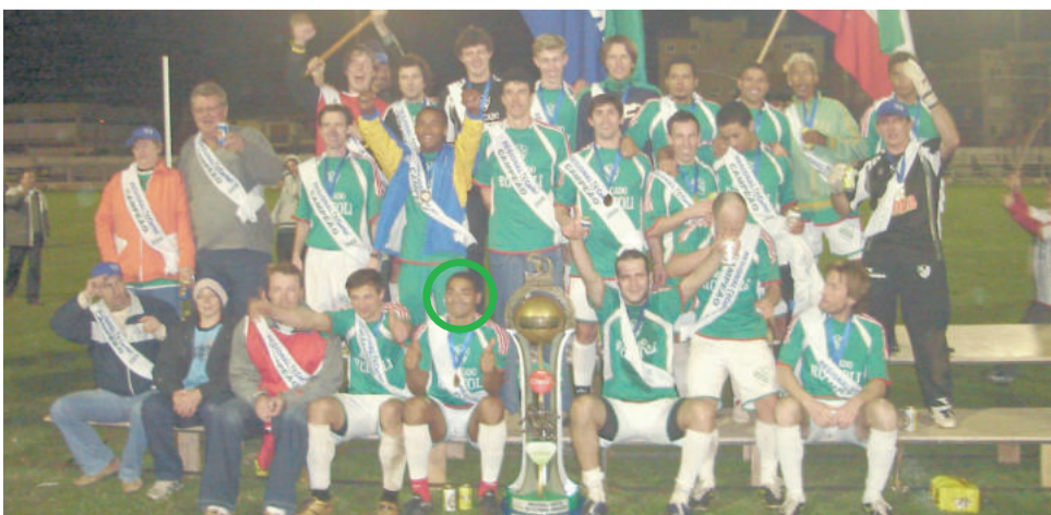
Riograndense conquistou o Regional Certel Aslivata de 2006