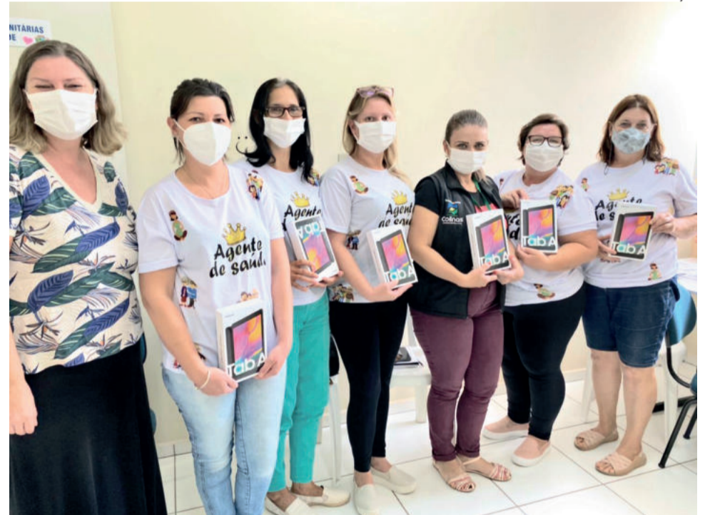
Agentes receberam tablets na reunião