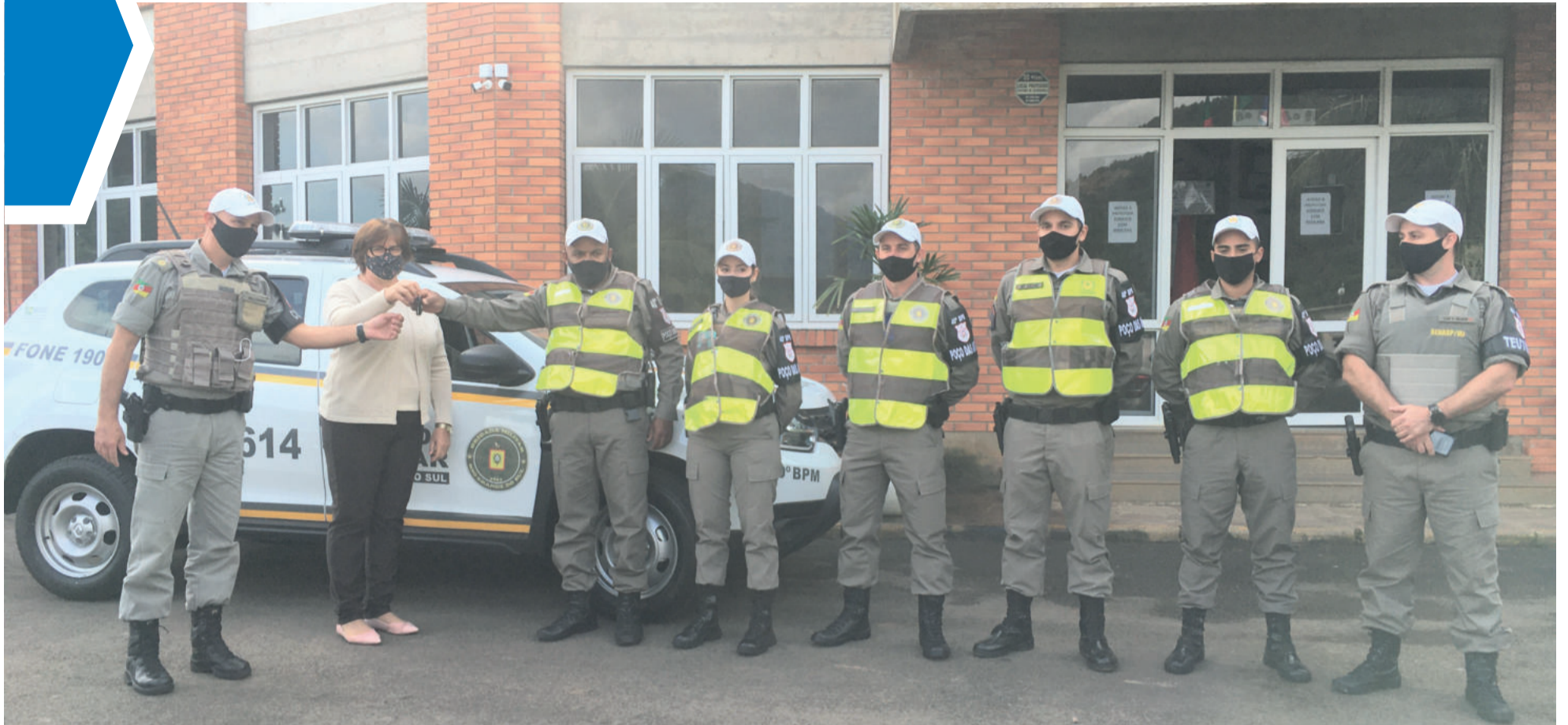
Entrega aconteceu na véspera do aniversário do município