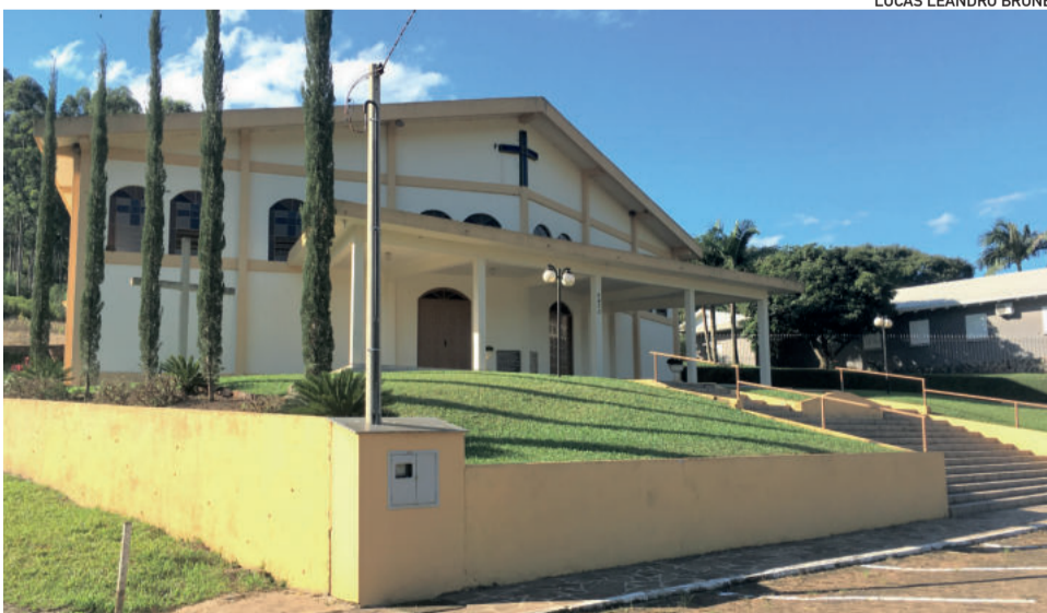
Igreja Comunidade Cristo Rei - Boa Vista