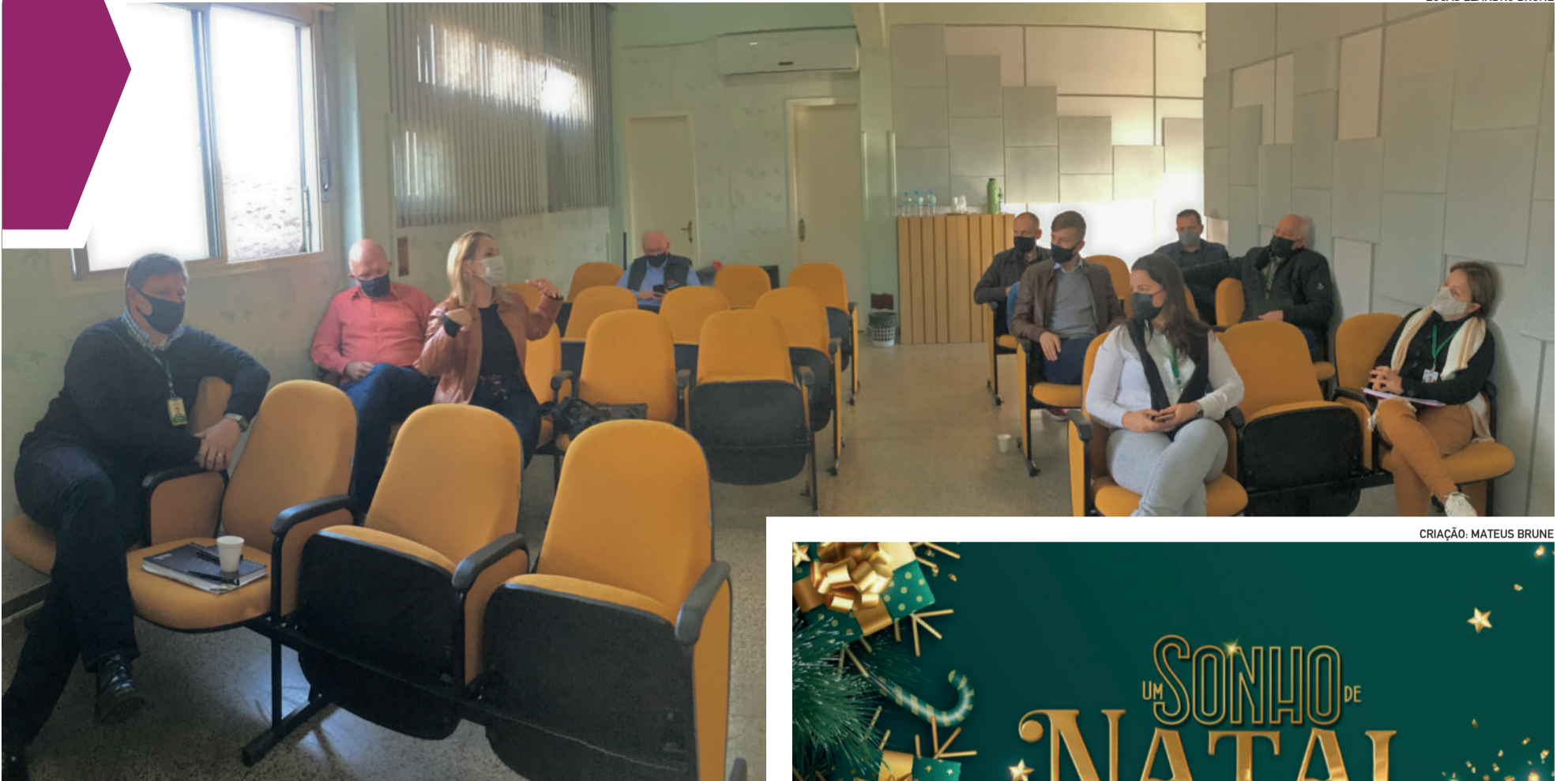
Grupo inicial começa a planejar atrações para o evento