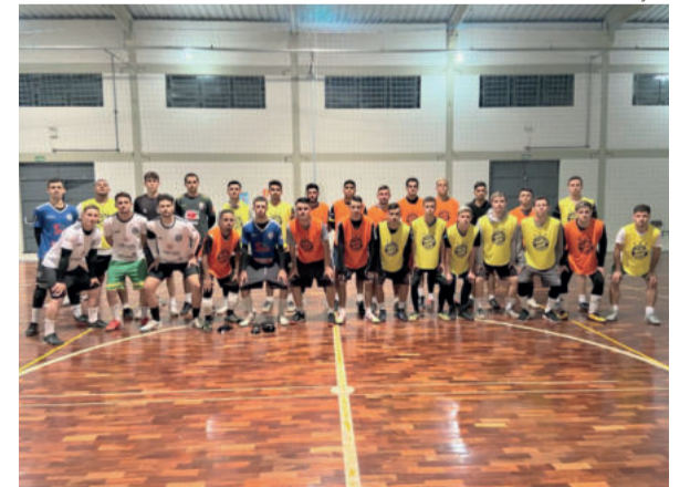
Time masculino retornou há duas semanas e feminino, nesta terça-feira