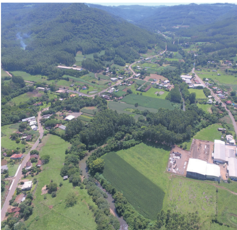
Boa Vista ficou dividida entre Poço e Barão, nos primeiros anos

- a primeira eleição que toda localidade de Boa Vista participou em Poço das Antas foi um ano após a sua anexação, em 15/11/1992.