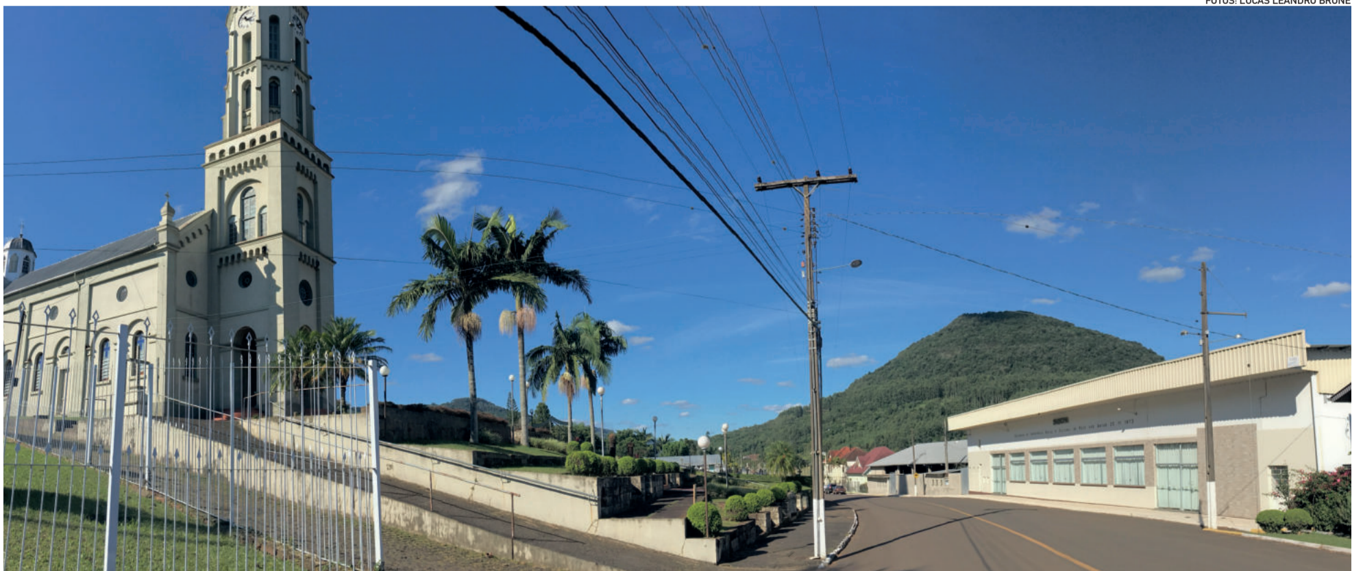
Igreja e SASCPA, local de grandes festejos de Kerb