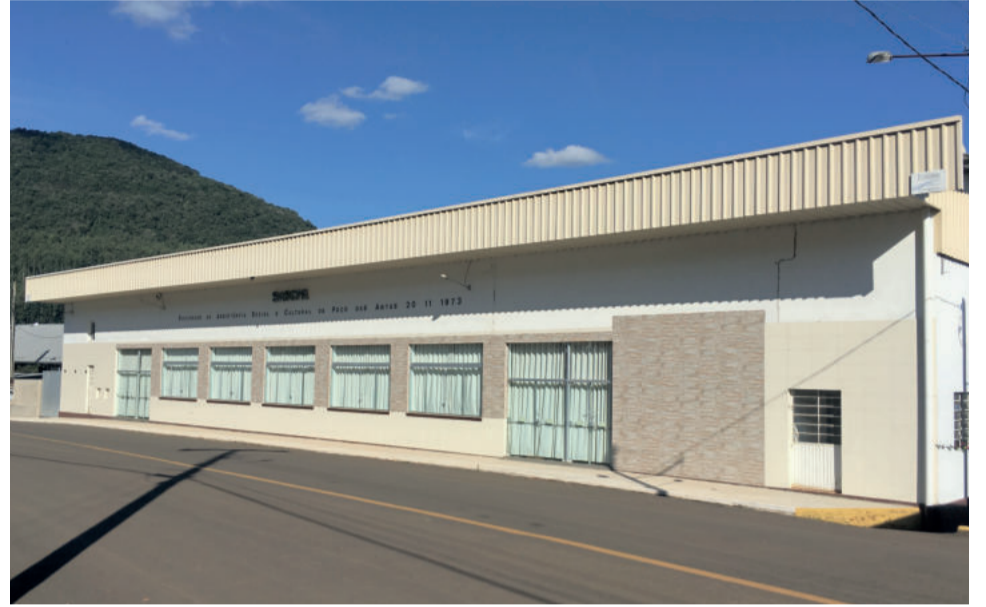
SASCPA sedia um dos maiores kerbs da região

Em cada família havia uma festa no ano do varão: ou festejava-se o seu “Santo Homônimo” ou o aniversário de nascimento ou o de bodas de casamento (este tinha significado também para ela). Em algumas famílias era festejado também a “Santa Homônima” dela ou o seu aniversário.