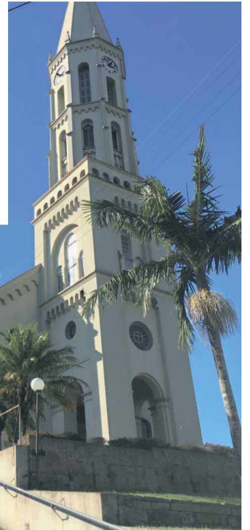
Igreja Matriz São Pedro

Em 12/5/2021, Poço das Antas, valorizando as pessoas, sua história e sua cultura, com muito orgulho e afirmação parabeniza e saúda: pessoas, servidores, vereadores, setores e comunidades. Saúda seu povo trabalhador, crianças, estudantes, jovens, adultos e idosos.