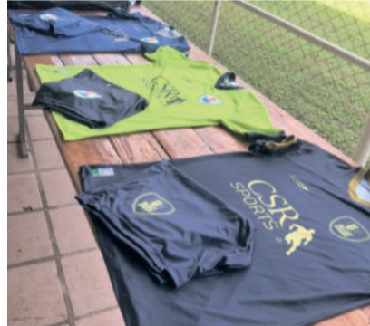
Materiais do projeto chegaram neste fim de semana