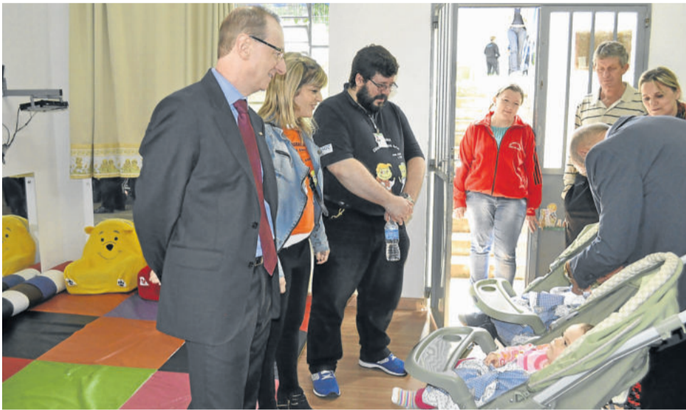
Berçário foi um dos setores visitados pelo presidente do TCE

O levantamento foi baseado em informações repassadas pelas prefeituras em 2013 e levou em conta as metas do Plano Nacional de Educação (PNE), que estipula o percentual de 50% das crianças de até três anos matriculadas em creches e 100% da população de quatro e cinco anos nas pré-escolas até 2016.