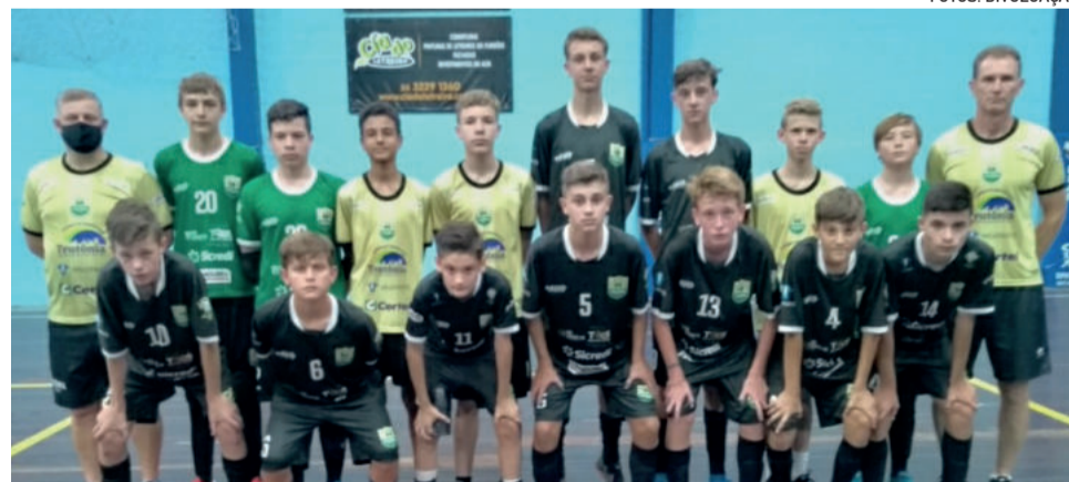
Sub-13 da ASTF jogará semifinal em casa

Os dois primeiros colocados se classificam para o quadrangular final. As outras duas vagas serão preenchidas pelo outro triangular, sediado em Lajeado, com Alaf, Grêmio Ball de Pelotas e AAPF de Bento Gonçalves.