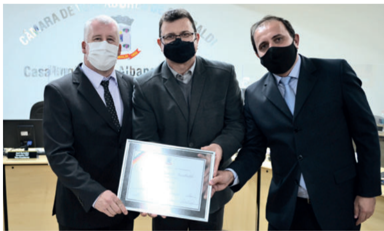
Vereadores homenagearam a Cooperativa Vinícola Garibaldi