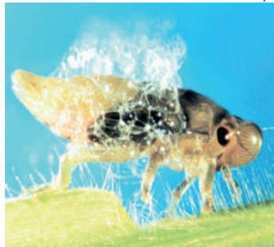
A cigarrinha depende do milho para se multiplicar