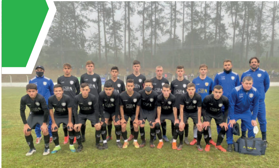
Sub-15 da Juventus venceu a sua partida