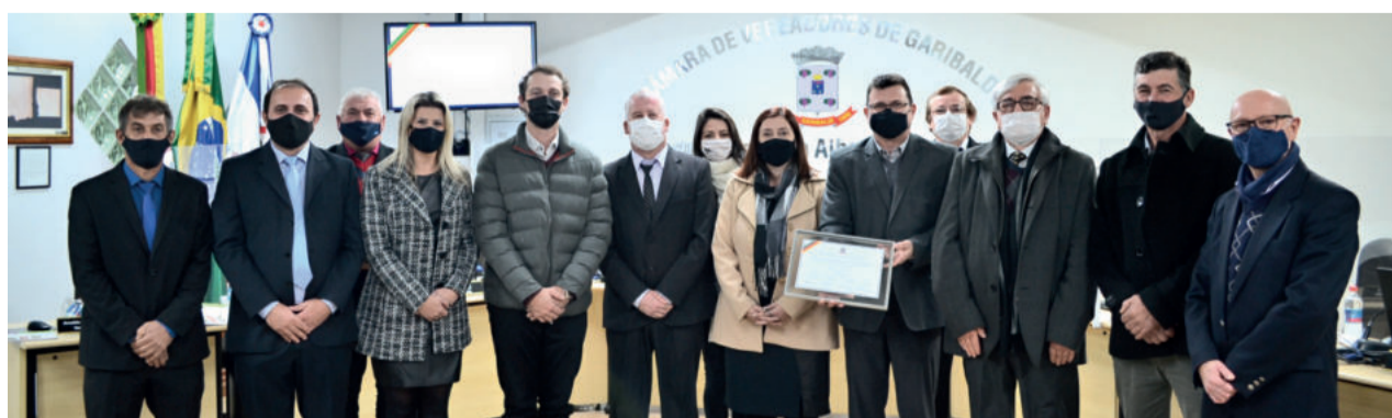
Homenagem para a Cooperativa Vinícola Garibaldi