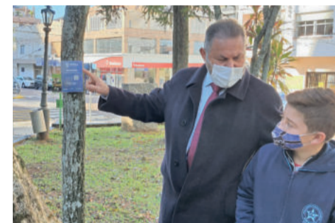
Prefeito explicou aos jovens as placas de identificação das árvores, que trazem um sistema que permite obter informações sobre a respectiva espécie

Um viveiro com mil metros quadrados, com sombrite e irrigação automatizada, propicia as condições necessárias para o desenvolvimento das mudas.