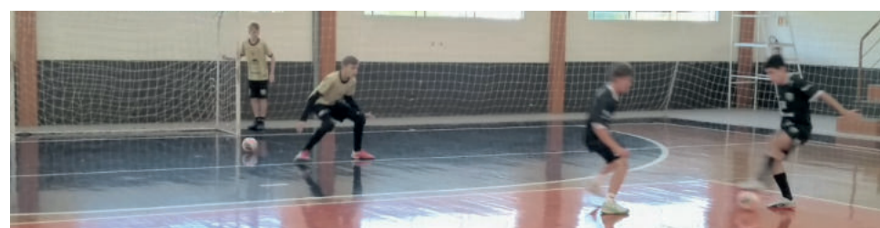
Equipe segue treinando para tentar inédita decisão