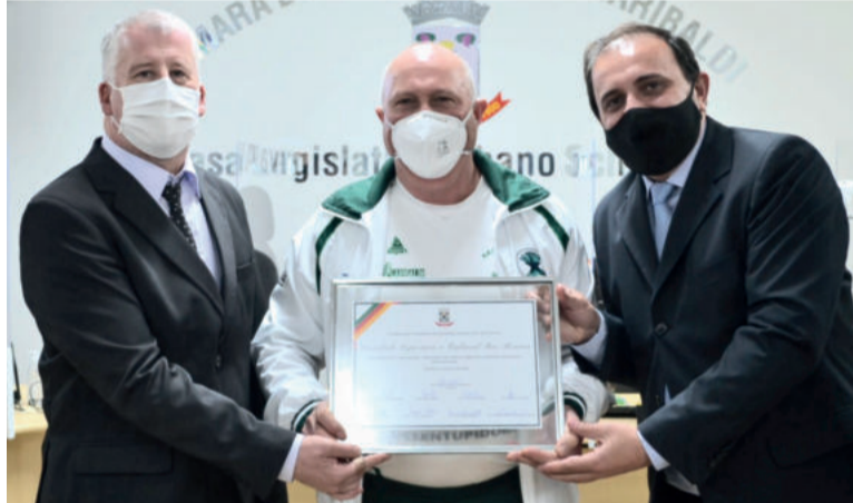
Vereadores homenagearam a Sociedade Esportiva Rio Branco