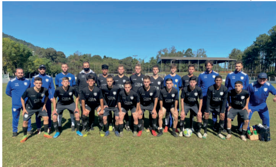
Sub-17 da Juventus empatou, mas avançou de fase