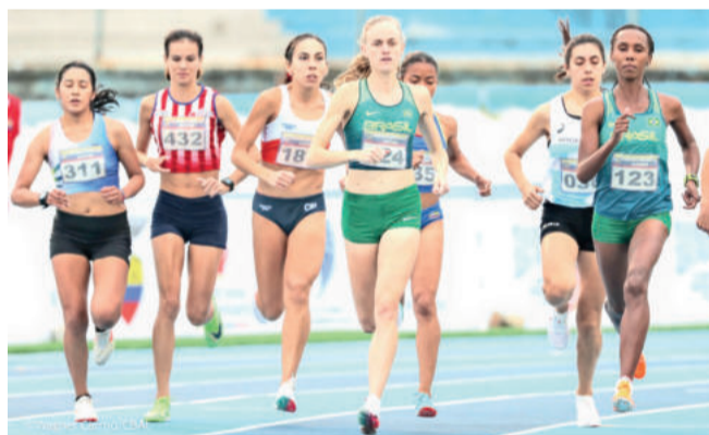
Jaque fez boa prova para melhorar bastante sua marca nos 1.500 metros