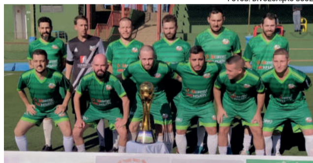
Firma foi campeão da Série Prata, nos pênaltis