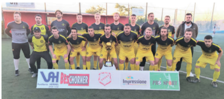
Xtotz United faturou o título do Torneio de Verão – Série Ouro

Agora, as equipes começam a se preparar para jogar a Copa Soges de Futebol Sete, cujo início está projetado para o próximo sábado.