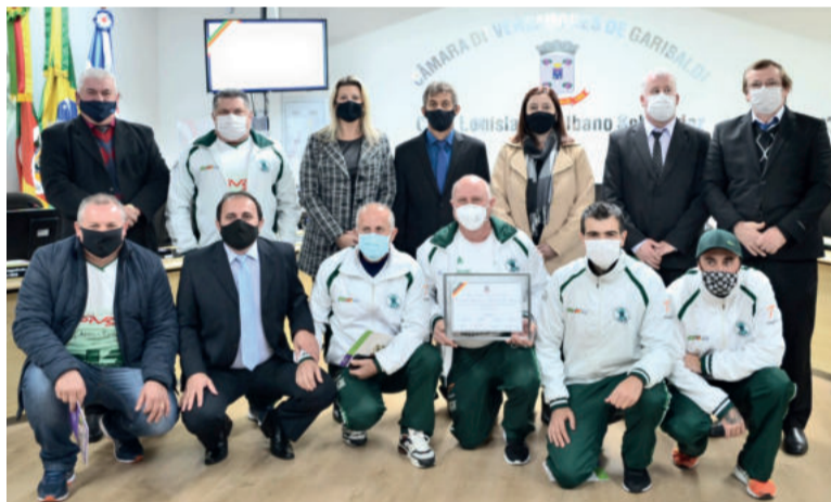
Homenagem para a Sociedade Esportiva Rio Branco