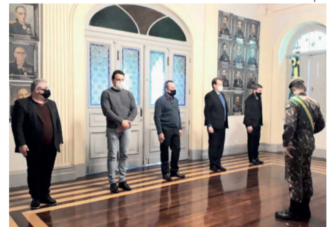
Carniel tomou posse na Junta Militar