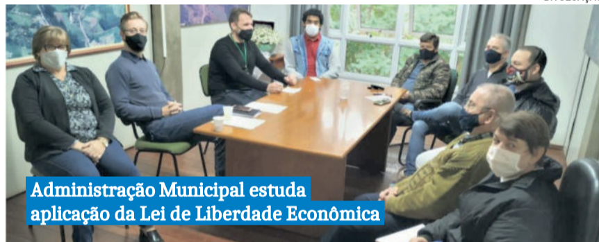
Administração Municipal estuda aplicação da Lei de Liberdade Econômica

A Lei da Liberdade Econômica define as normas de proteção à livre iniciativa e ao livre exercício de atividades econômicas de baixo risco, que busque o sustento próprio ou de sua família, de uma forma menos burocrática, menos onerosa e mais célere.