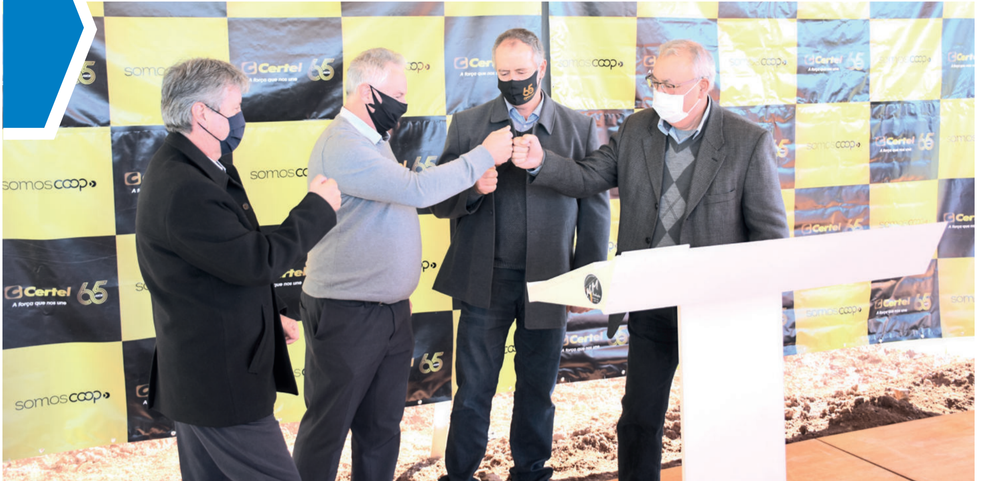
Evento foi marcado pela assinatura do contrato de financiamento das obras