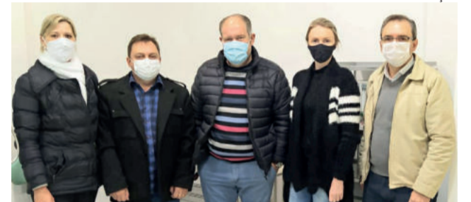
Visita em Encantado