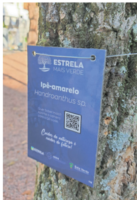
Placas de identificação trazem um QR code, com mais informações sobre as espécies

Saúde e da Infraestrutura Urbana, agentes de saúde e de endemia também auxiliarão a população na limpeza de pátios e na orientação ao combate da Dengue e outras doenças. Também ocorrerá o atendimento a cães domiciliares e de rua.