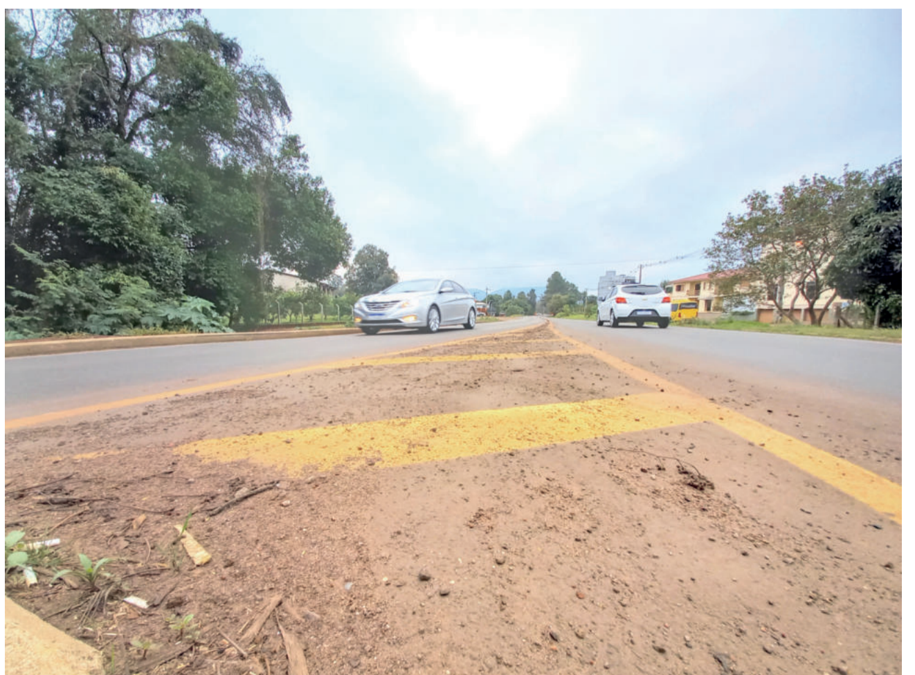
Concessão de rodovias está sob análise nas regiões