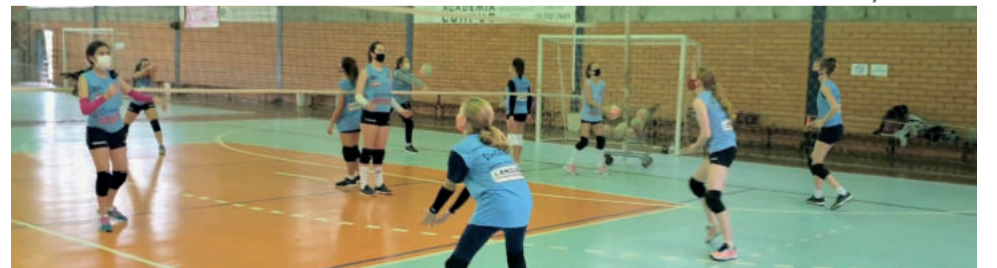
PLURAL COMUNICAÇÃO INTEGRADA

Para Rother, esse retorno também será definidor de como as equipes devem conduzir o trabalho daqui para frente. “Essa competição vai servir para balizar a nossa situação atual e para planejarmos o futuro. E assim vai