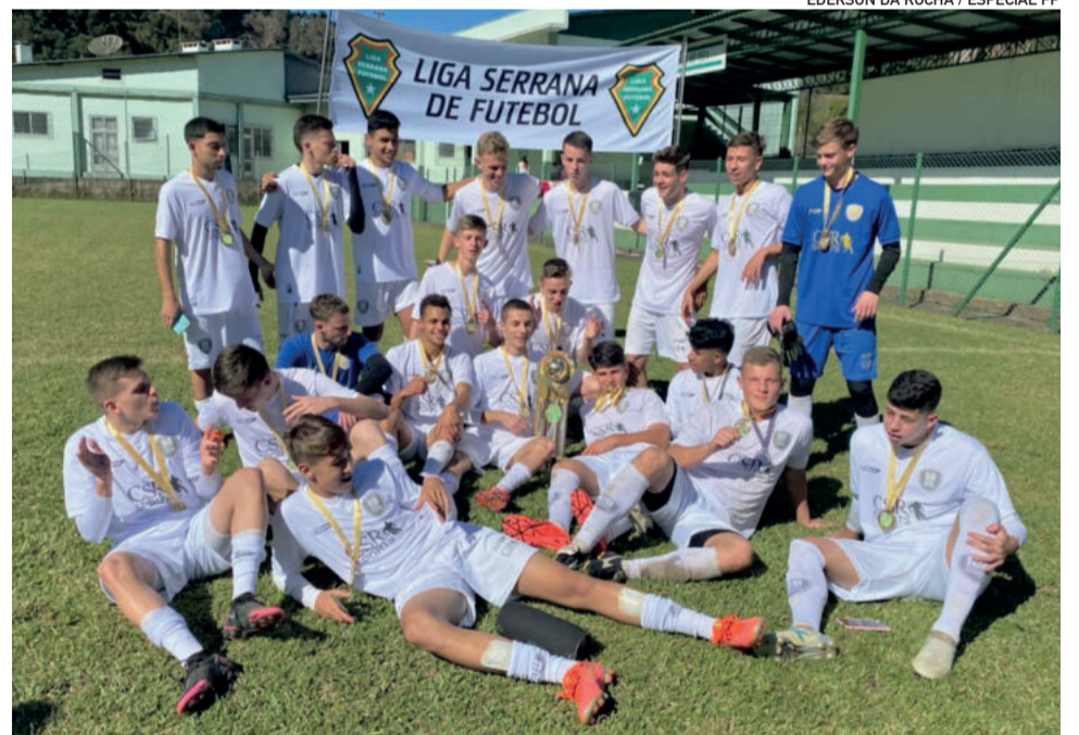
Conquista de títulos é a consequência de bom trabalho

Profissionalismo e honestidade são os pilares principais para a caminhada do sucesso. “Nunca tivemos tanta gente capacitada junta”, fala o empresário. Projeto planejado, organizado e condições práticas sendo executadas por toda comissão técnica e atletas. “É sensacional o momento que nós estamos vivendo”, cita Bandeira.