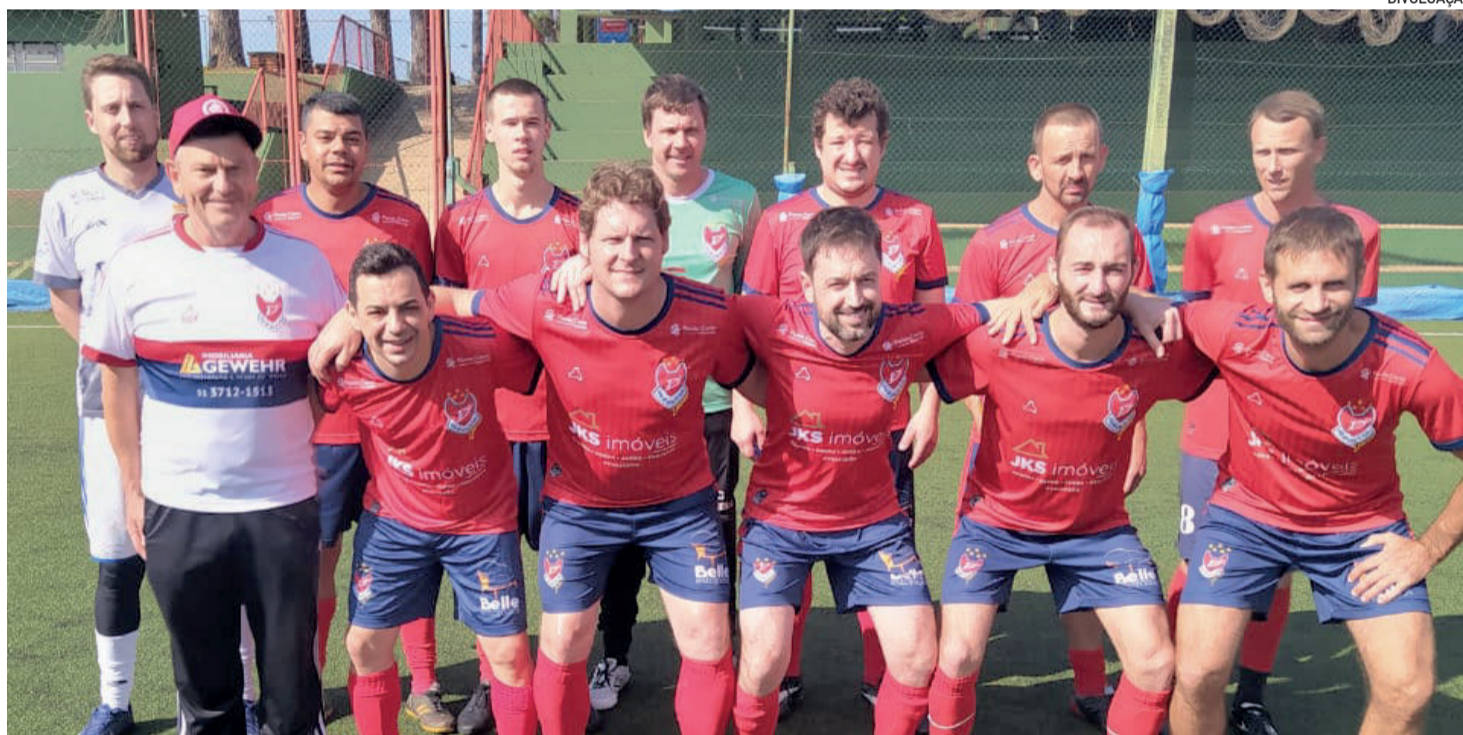
Demonhos Jr perdeu no confronto direto pela liderança da Chave A