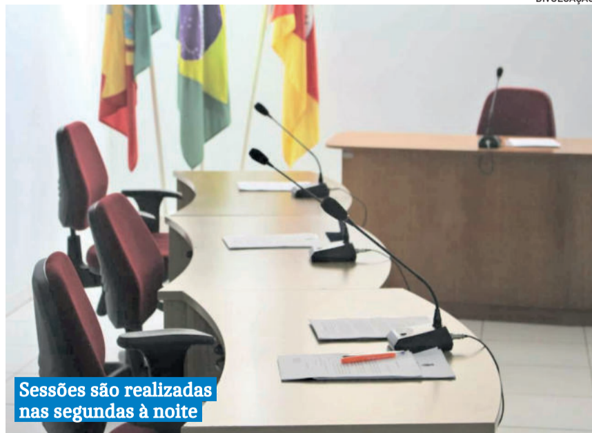
Sessões são realizadas nas segundas à noite

passam pelo recuo das cercas de muitas propriedades. Os produtores precisam aceitar estes deslocamentos para facilitar a obra.