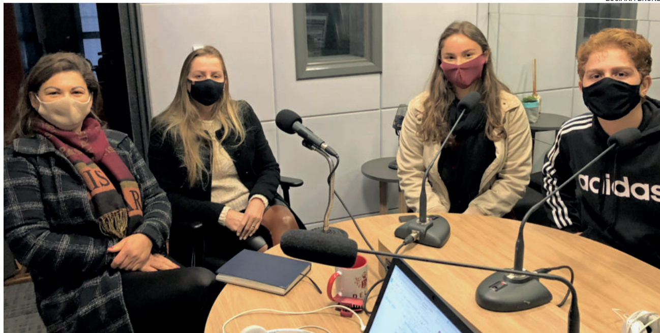
Os estudantes acompanhados das mães em entrevista ao programa Espaço Aberto