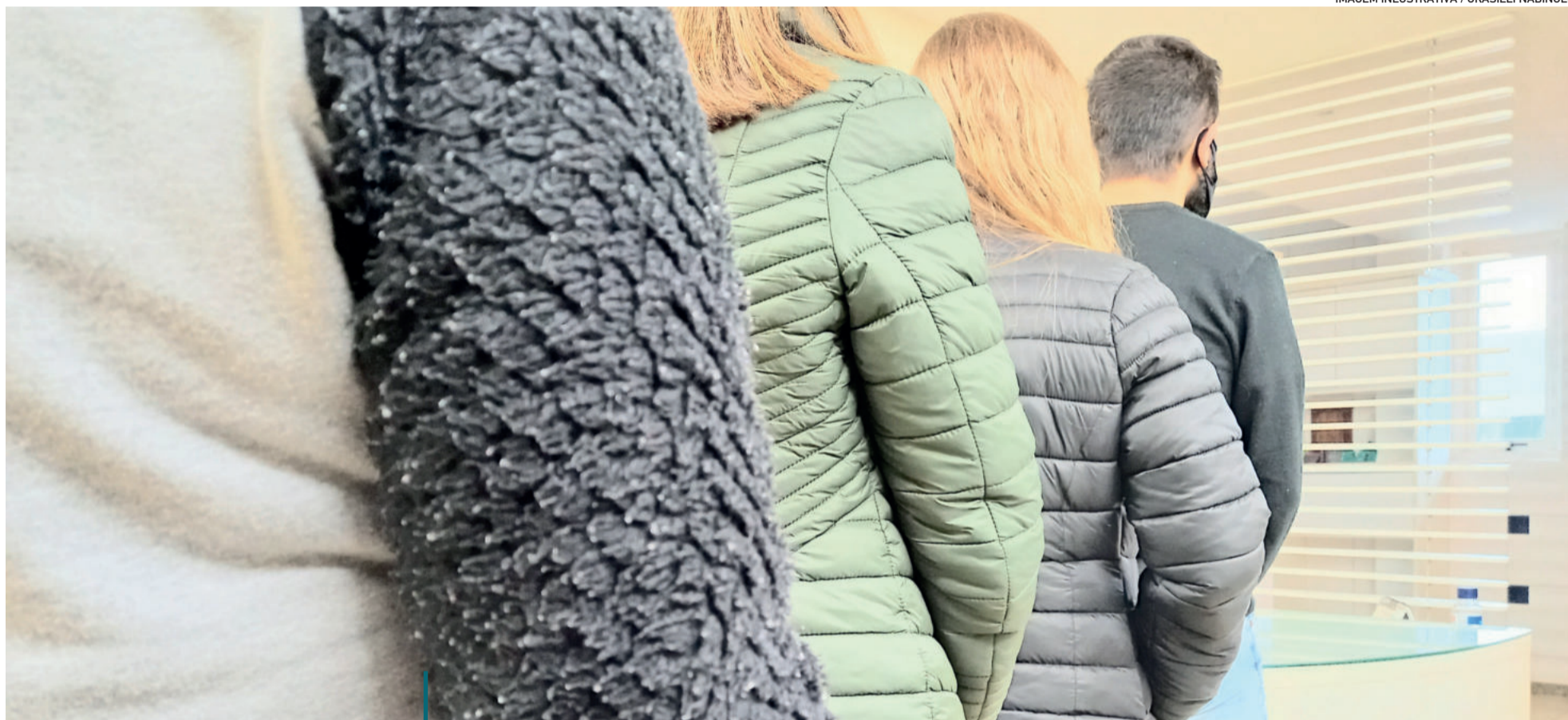
IMAGEM INLUSTRATIVA

Economia realizada com reduções contratuais permitiram começar com procedimentos represados desde 2016. Município espera liberação de R$ 2,5 milhões em emendas parlamentares para zerar a fila de 525 cirurgias.