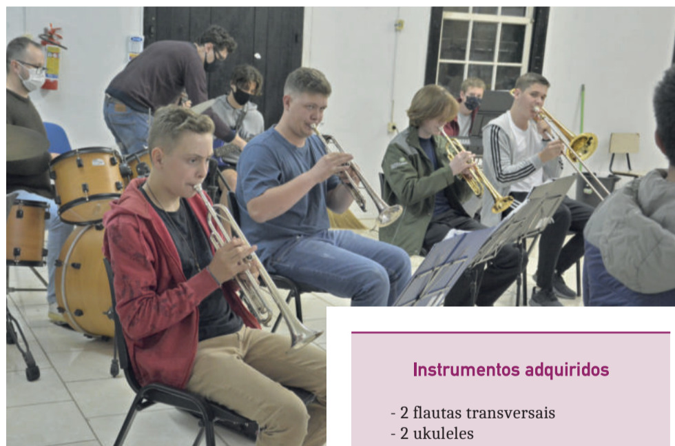
Ensaios acontecem de forma semanal, às sextas-feiras