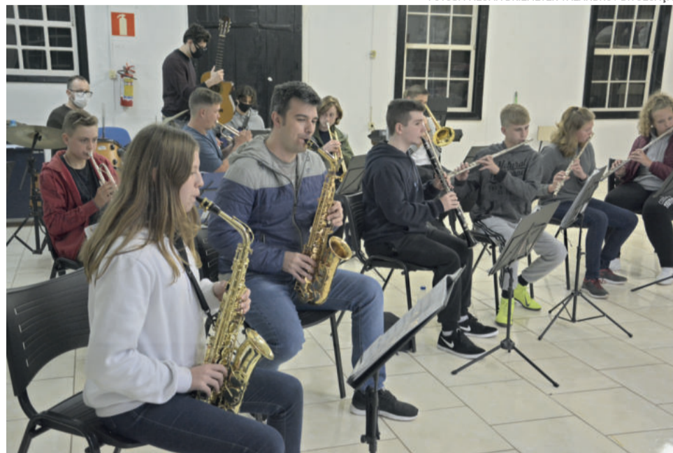
Grupo retomou atividades presenciais há poucas semanas e já reestrutura seu repertório