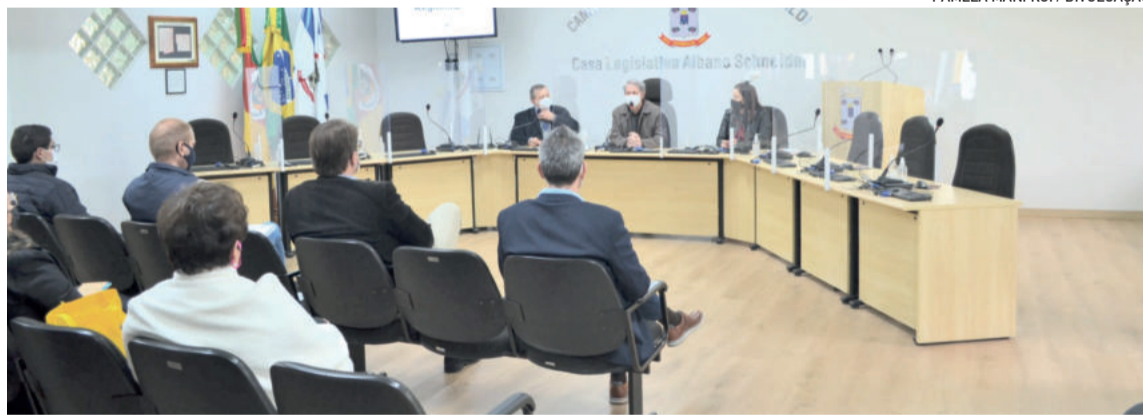
Encontro foi no Plenário Albano Schneider, em Garibaldi