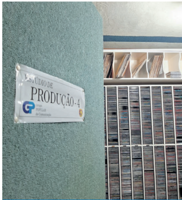
ESTÚDIO DE PRODUÇÃO