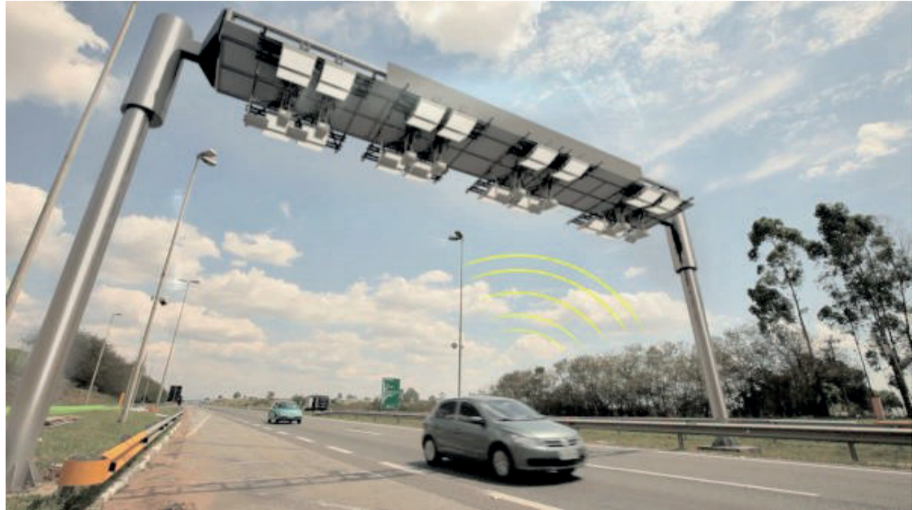
Sistema realiza a cobrança automaticamente