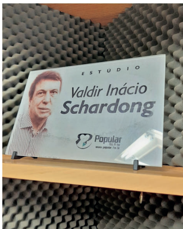
HOMENAGEM A UM FUNDADOR