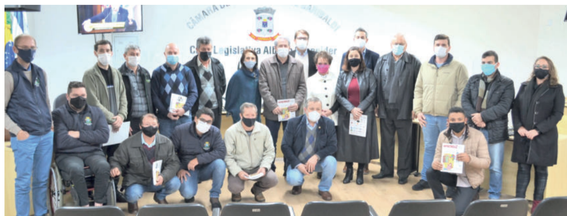
Vereadores de 14 municípios debateram questões regionais