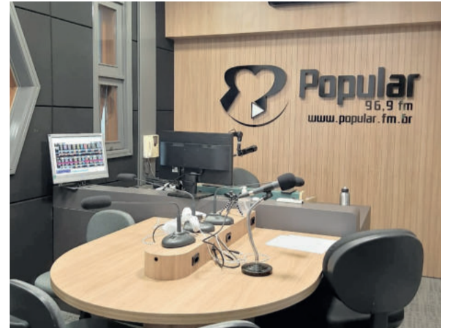
ESTÚDIO 30 ANOS