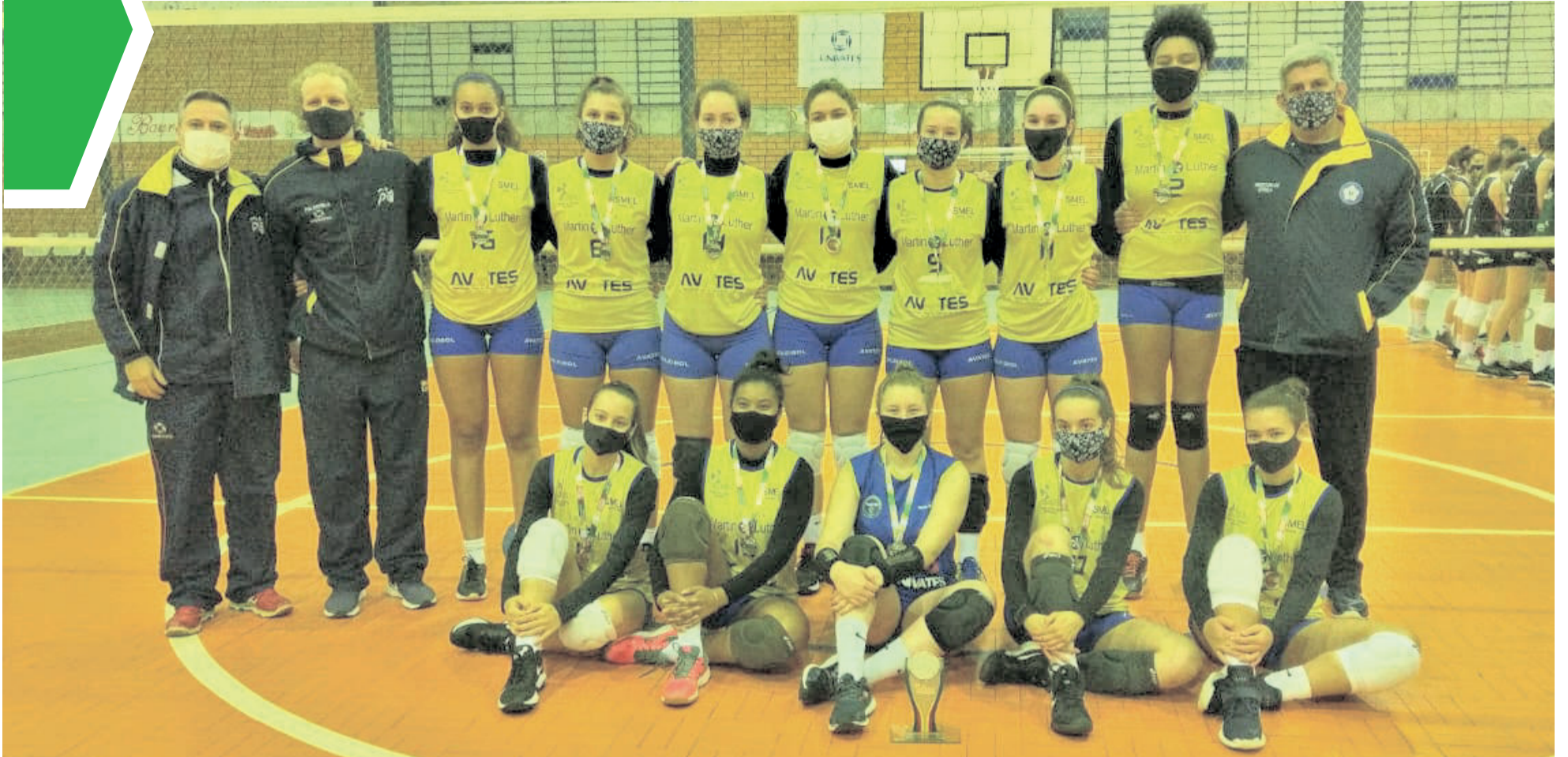
Equipe infantojuvenil conquistou a segunda colocação na competição