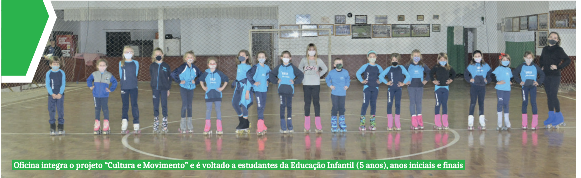
Oficina integra o projeto "Cultura e Movimento" e é voltado a estudantes da Educação Infantil (5 anos), anos iniciais e finais