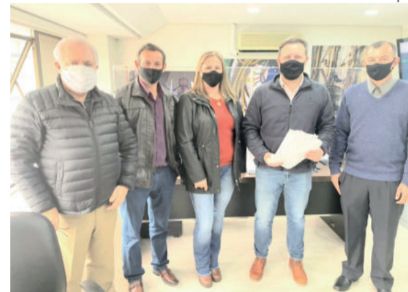
Representantes de Westfália com o deputado