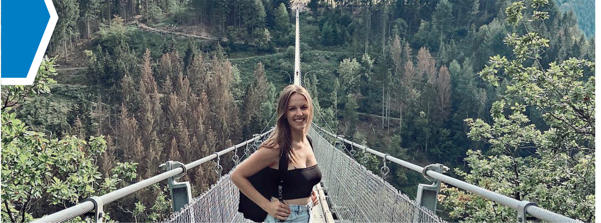
Grazi na Hängeseilbrücke Geierlay, uma ponte suspensa