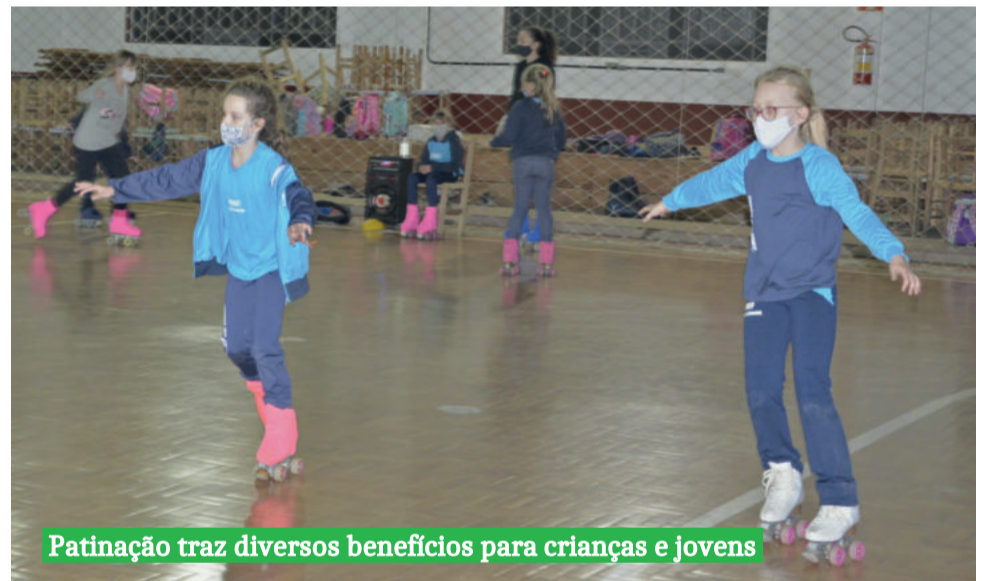
Patinação traz diversos benefícios para crianças e jovens