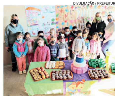
Crianças da Fazendinha comemorando o aniversário da escola

Ao parabenizar a todos, o prefeito salientou a importância de comemorar as datas que marcam a história do município, iniciando pelo aniversário da escola. “Nossa Fazendinha, nestes 19 anos, muito contribuiu para a formação educacional dos nossos filhos e continuará cada vez mais firme na sua missão de levar os primeiros ensinamentos aos nossos pequenos estudantes”, reconhece.