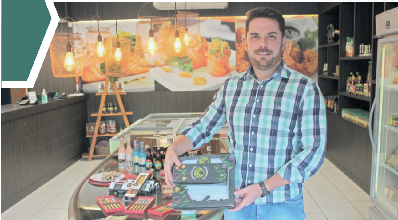
Lautert quer aprimorar apresentação dos produtos no delivery