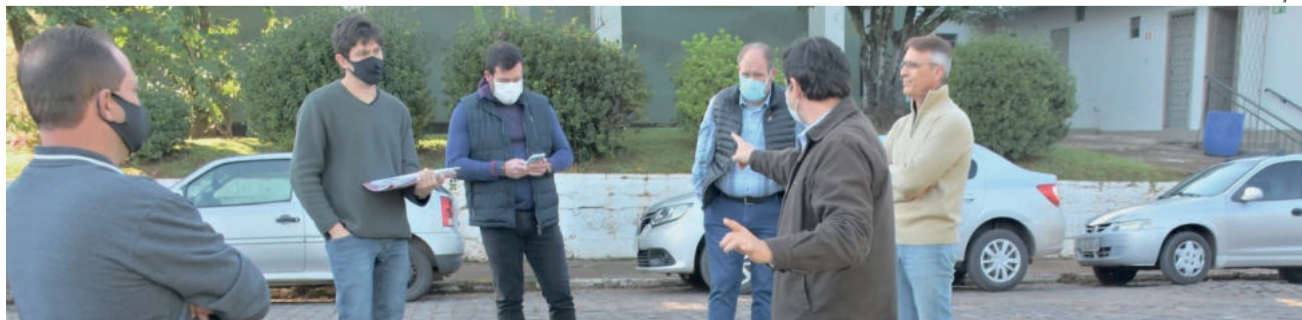
Cronograma de trabalho foi acordado