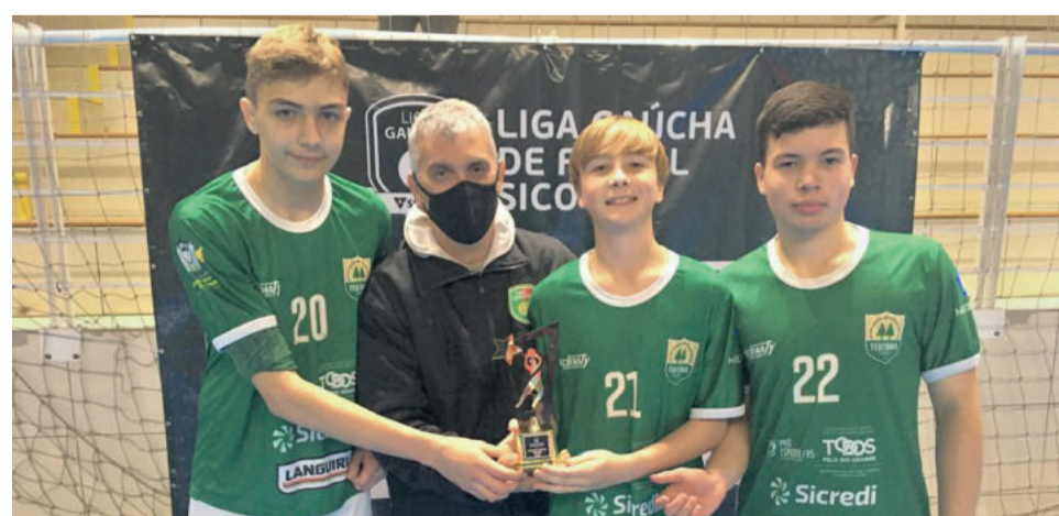
Defesa da Teutônia Futsal foi a menos vazada do campeonato