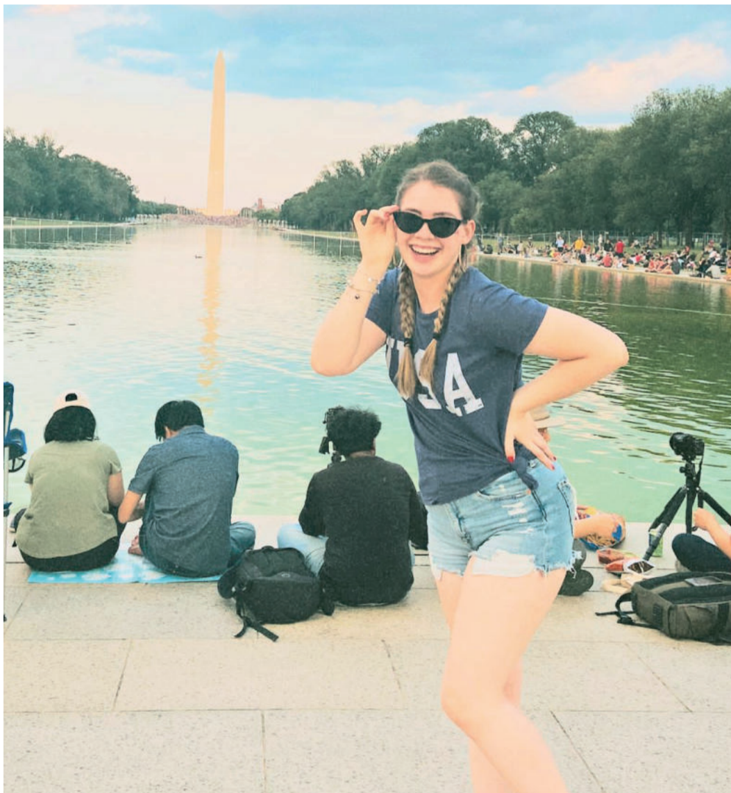
Foto no National Mall dia 4 de julho