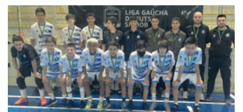
AAPF Progresso, de Bento Gonçalves, 4º lugar