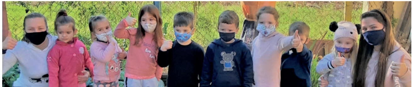
Crianças das Escolas Infantis retornarão ao turno integral no dia 2 de agosto