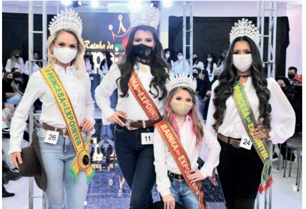
Corte da Expoiner 2021