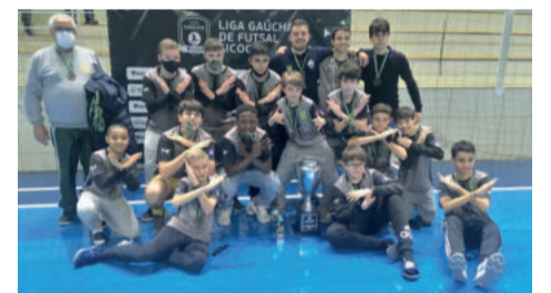
Brilhante de Pelotas foi o campeão da LGF 2020 Sub-13 anos

clássico do Vale do Taquari. A Teutônia Futsal abriu 1 a 0. No segundo tempo, em roubadas de bola, a ALAF virou para 2 a 1. A equipe teutoniense conseguiu igualar e virar para 3 a 2, garantindo a segunda posição.