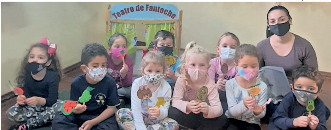
Teutônia atende cerca de 1.370 crianças na Educação Infantil, em escolas municipais e comunitárias