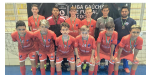
ALAF de Lajeado, 3º lugar