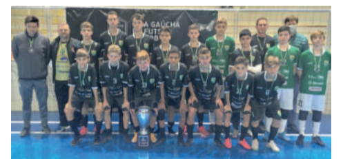
Teutônia Futsal - Colégio Teutônia ficou vice-campeão da LGF 2020 Sub-13 anos