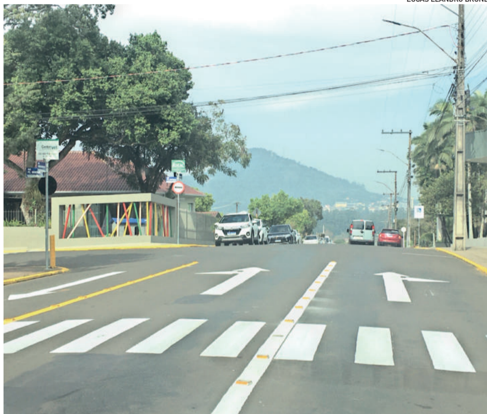
Acesso ao Colégio Teutônia teve transformações no trânsito