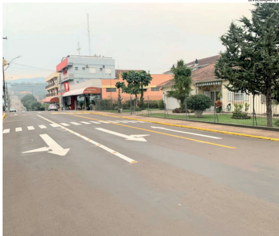
Mudanças permitem melhor fluxo de veículos e pedestres