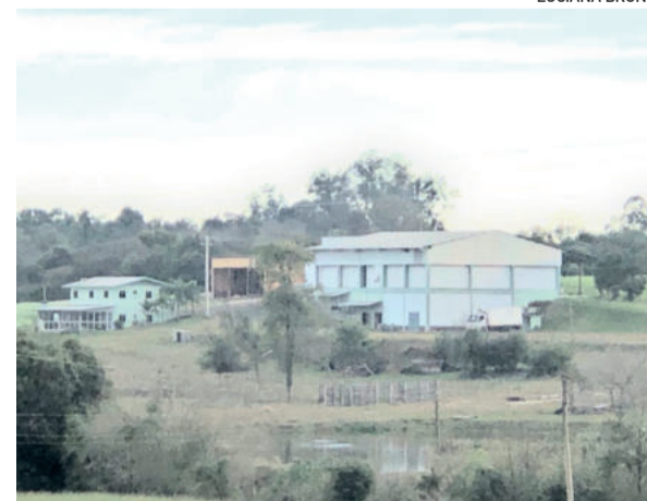
Languiru arrendou o frigorífico de bovinos para operar a partir de novembro