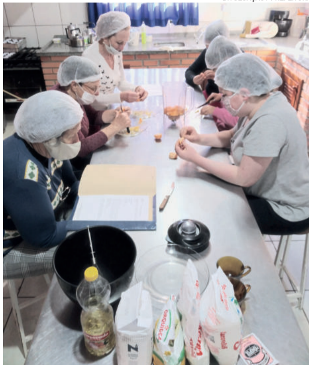
Os encontros são realizados nas sextas-feiras na sala do CRAS