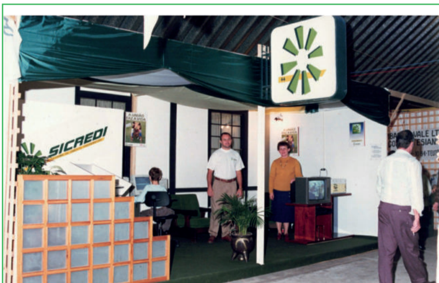
Participação na Festa de Maio de Teutônia - 1992