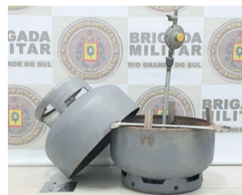
Botijão falso era utilizado para esconder dinheiro e drogas