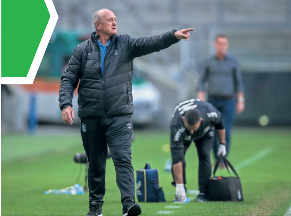
Luis Felipe Scolari está em sua quarta passagem como técnico do Grêmio