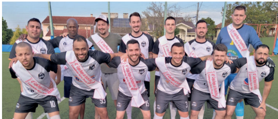
Diretoria precisa vencer o último jogo da fase para participar da elite