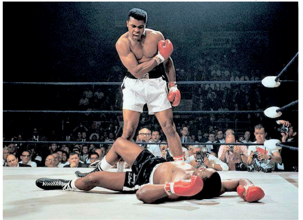
Muhammad Ali foi tricampeão mundial de boxe em 1964, 1974 e 1978