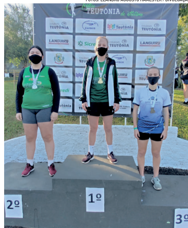
Ouro, prata e bronze: atletas da Equipe de Atletismo Teutônia/Colégio