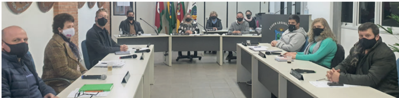
Vereadores debateram temas importantes para a comunidade