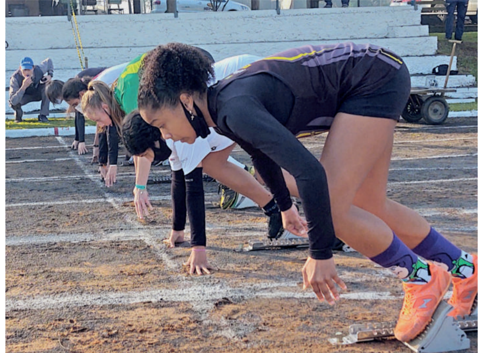
Diferentes modalidades movimentaram mais de 150 atletas