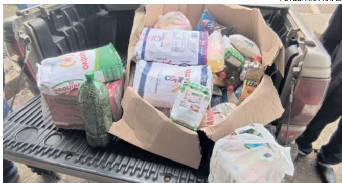
Entrega foi realizada por líderes da Comunidade