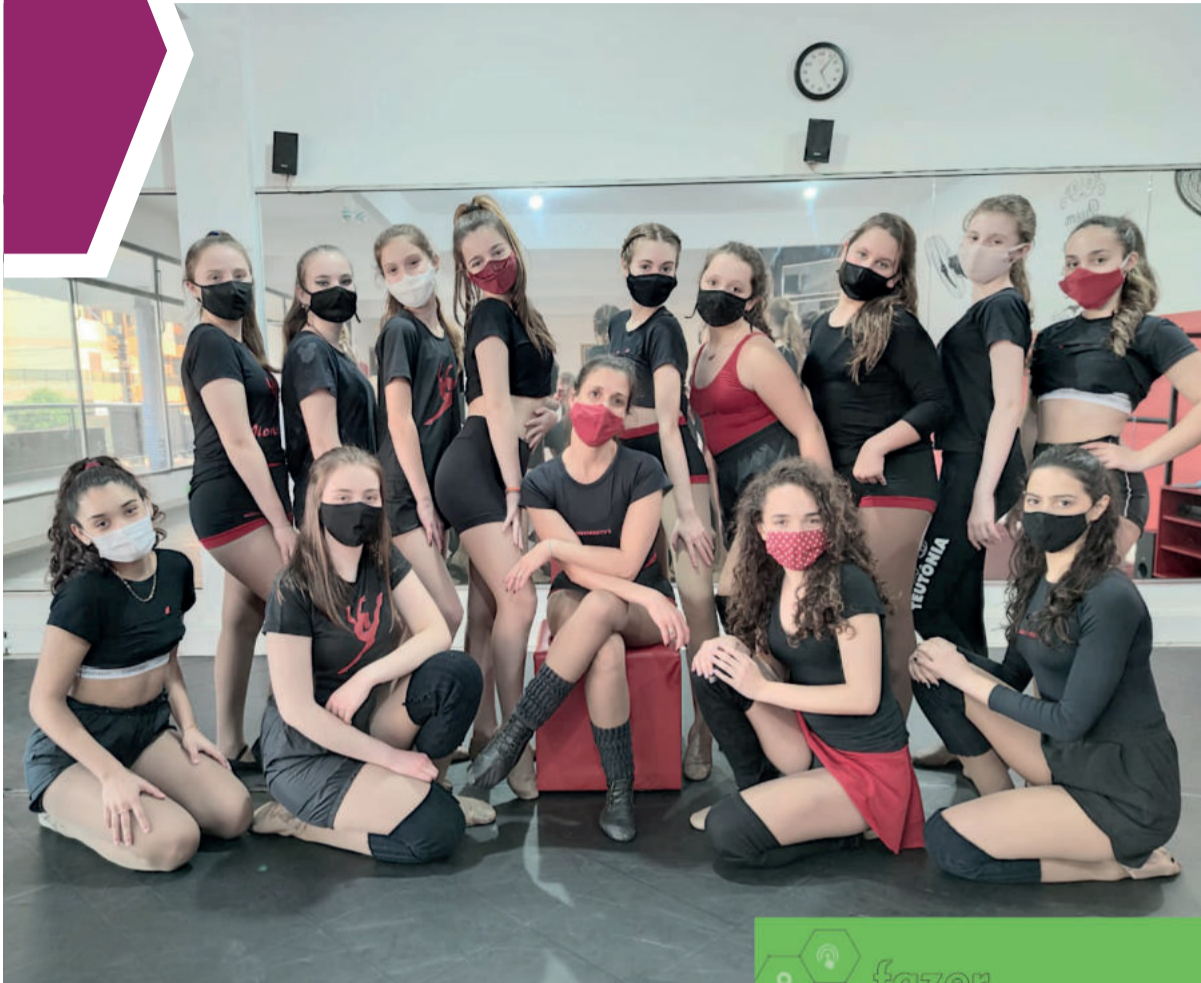
Categorias Juvenil e Adulta