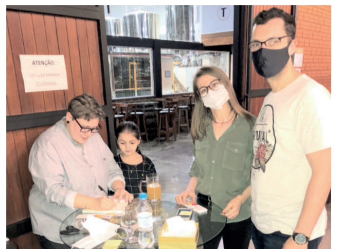
Amigos comemoraram a conquista junto com a escritora