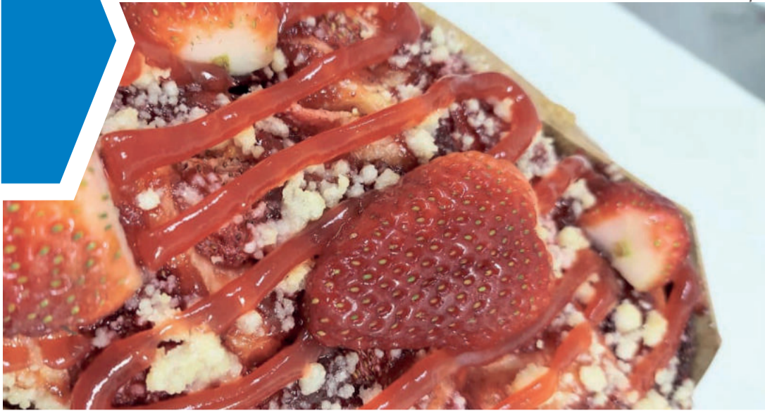
Cuca foi o produto mais vendido da Agroindústria Horning