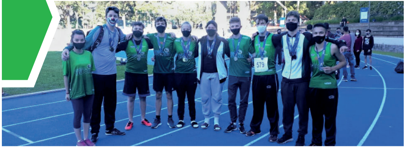
Equipe de Atletismo Colégio Teutônia/Languiru/Sicredi esteve representada por 10 atletas que, juntos, conquistaram 17 medalhas