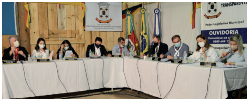
Sessão desta semana foi realizada no Galpão do CTG