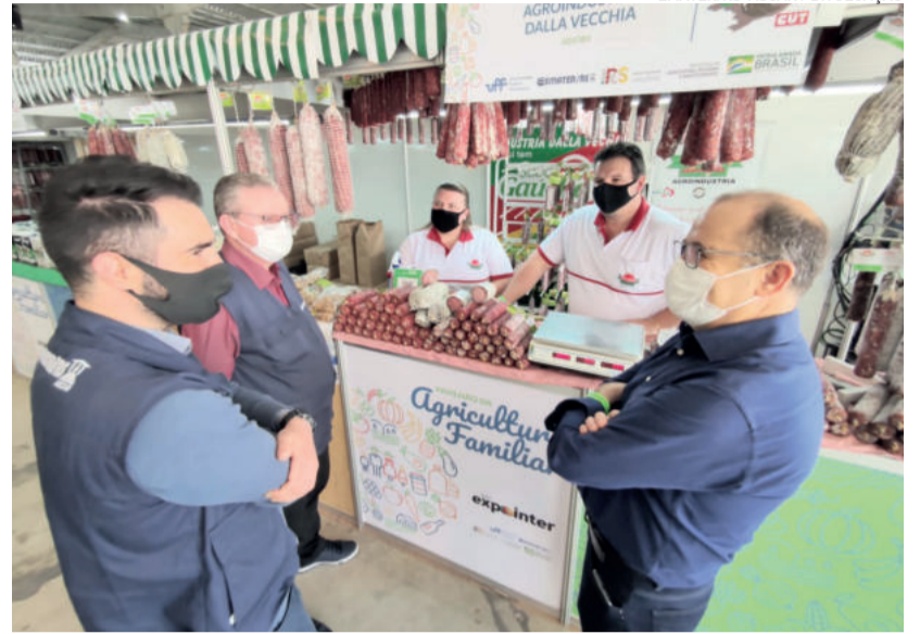
Feira serviu de vitrine para empreendimentos e produtos