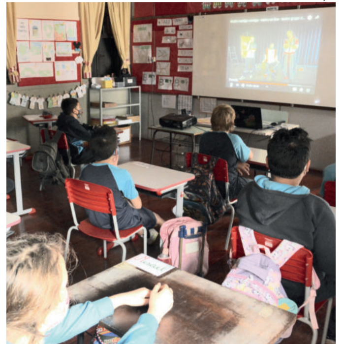
Alunos dos Anos Iniciais assistiram peça teatral de forma on-line