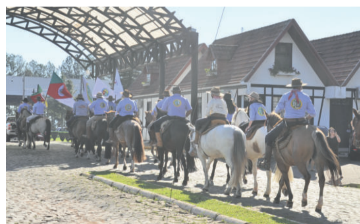
Desfile dos cavalarianos