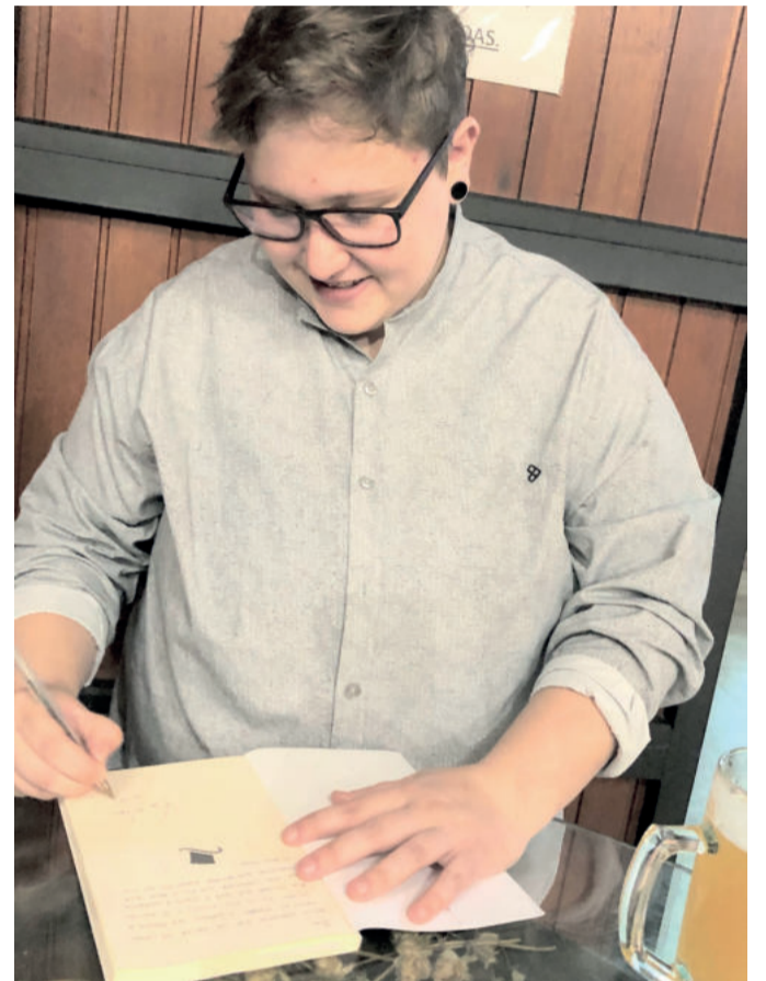
Autora autografou livros