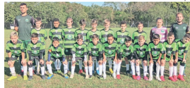
Categoria Sub-11 da Juventus