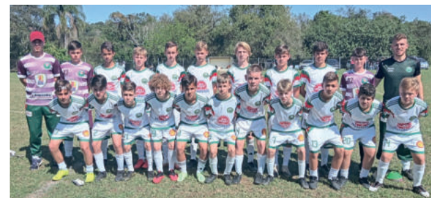
Categoria Sub-13 da Juventus