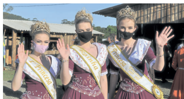
Soberanas de Teutônia