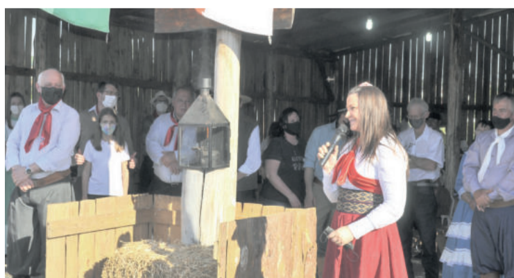
Vice-prefeita (d) na solenidade de abertura