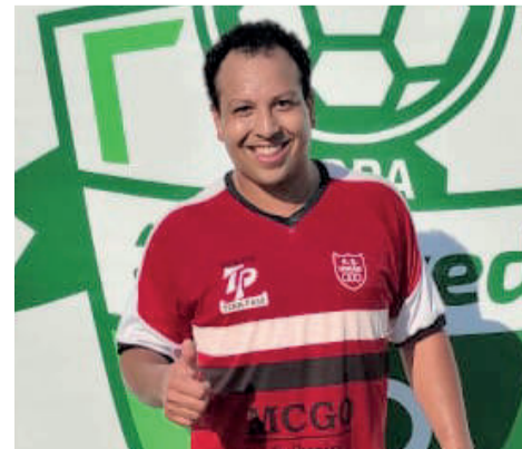
Comum, do União-G, foi craque do jogo e da rodada no campo 1