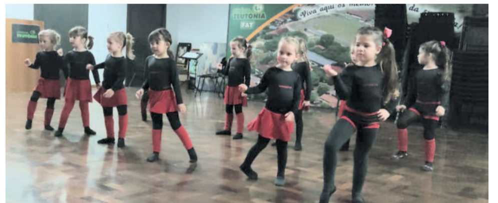
Grupo Baby Class CT

Este ano, o Grupo Movimentu's também firmou parceria com o Colégio Teutônia, o que é motivo de