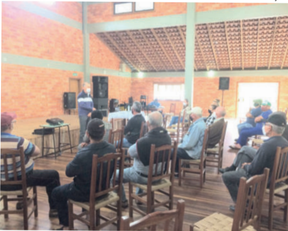
Kieling prioriza ações de prevenção para diminuir a incidência do borrachudo