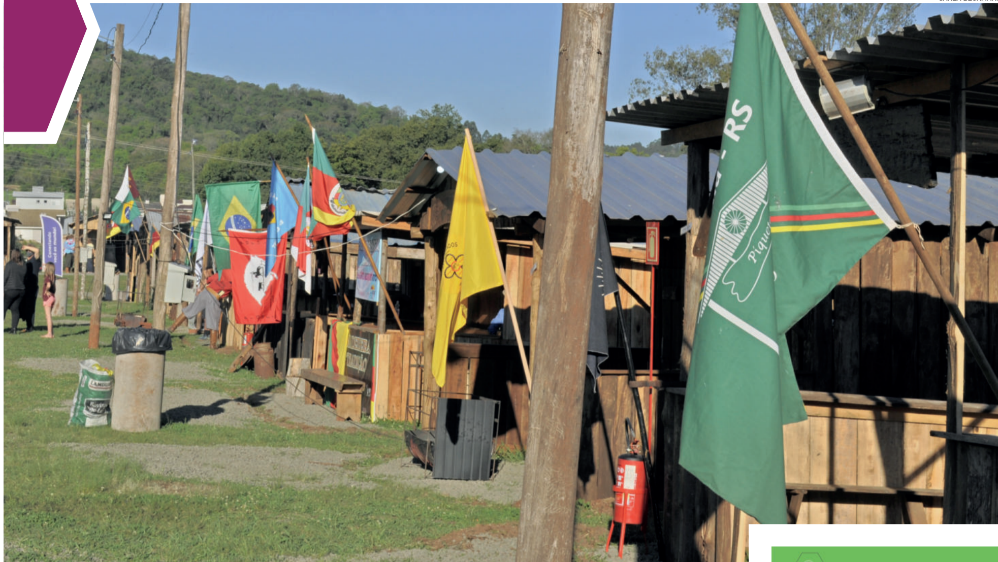
Este ano a programação ocorreu nos piquetes, que tiveram que seguir protocolos de segurança sanitária