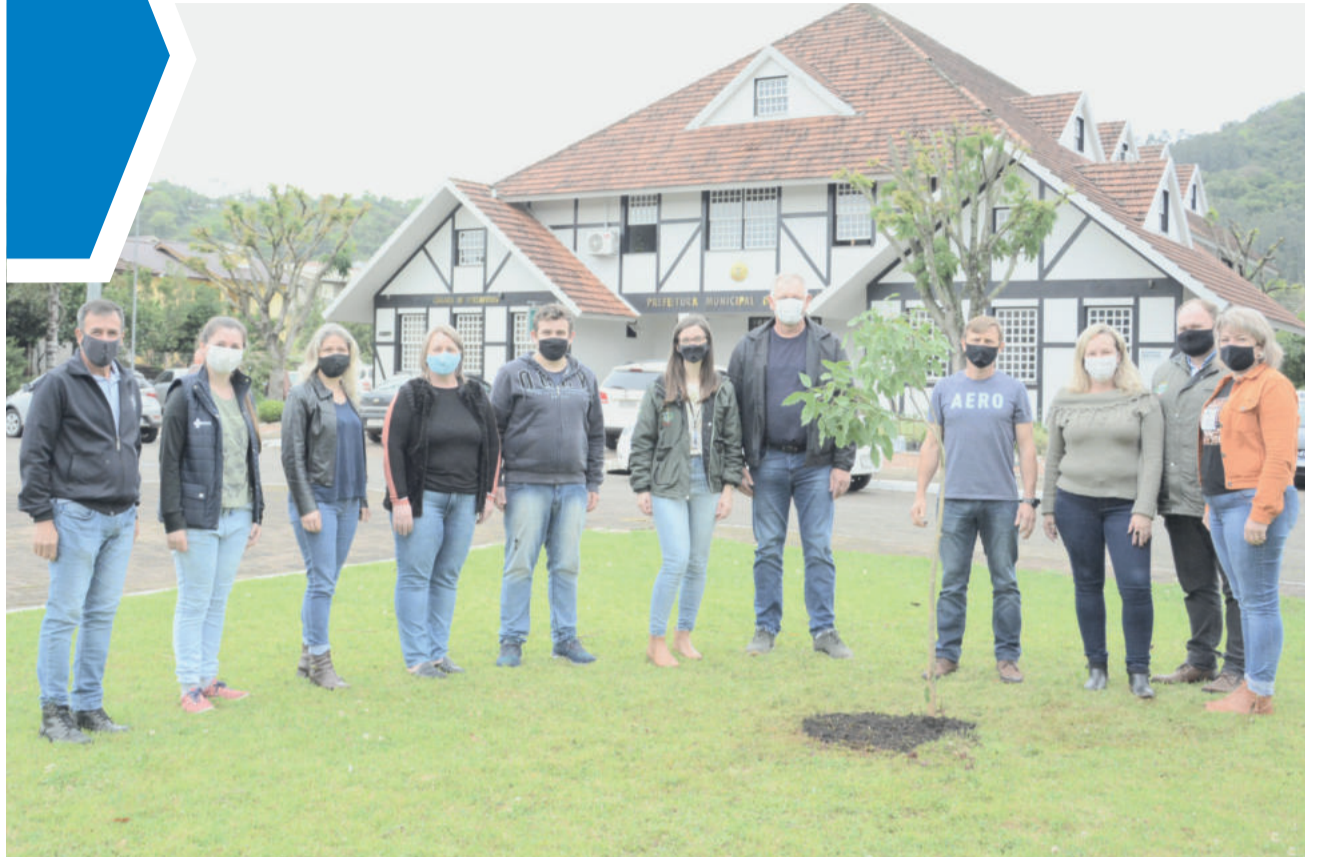
Plantio da Corticeira-da-Serra foi realizado no início da tarde desta terça-feira