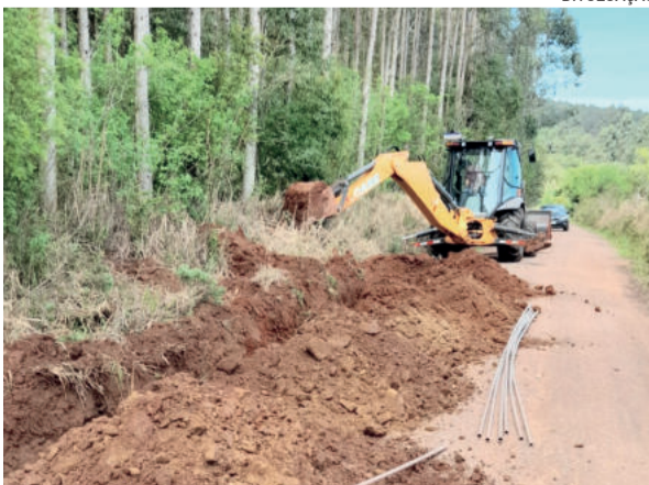
Trabalho integra sequência de obras projetadas pelo DEMAAP