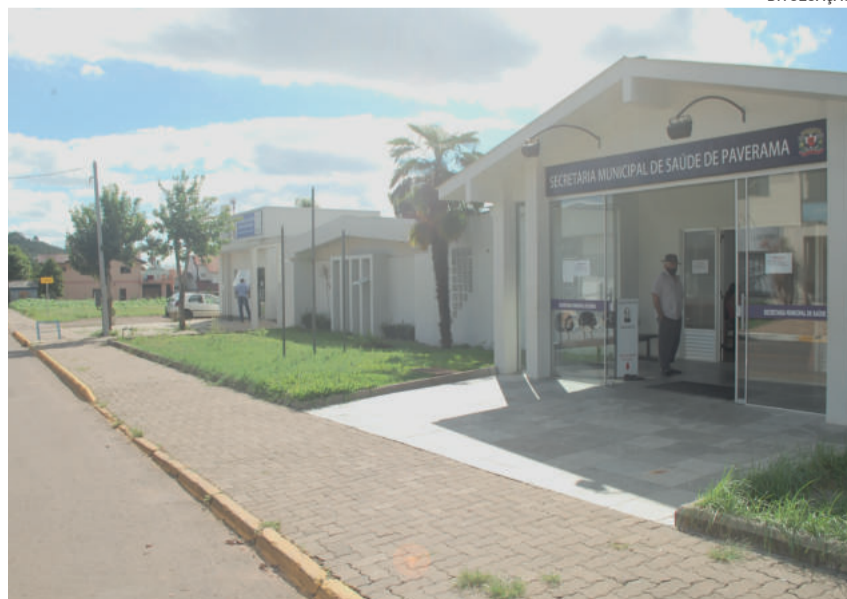
Agendamento deve ser feito no posto de saúde