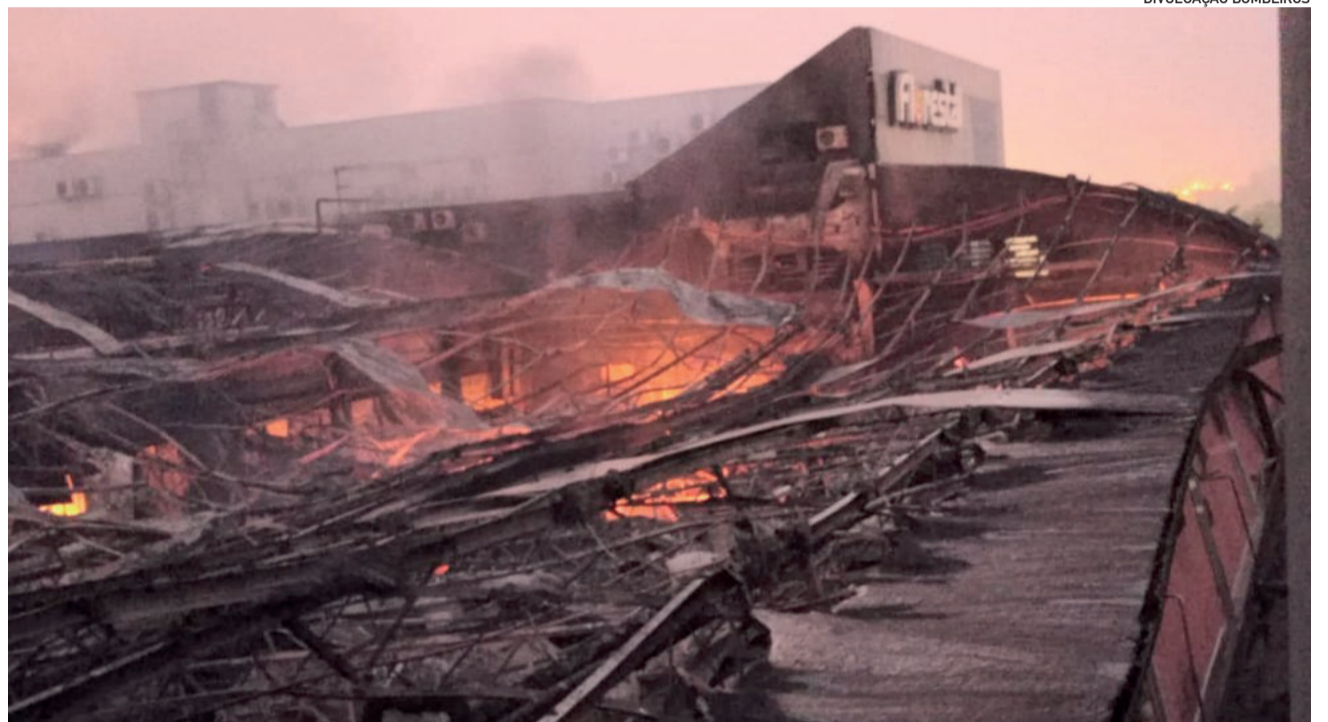
Fogo atingiu o pavilhão da produção de pirulitos