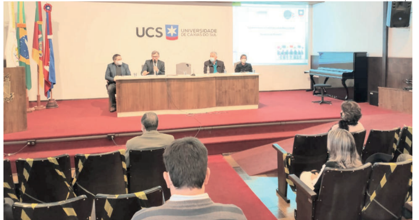
Termo de Cooperação foi assinado na sexta-feira, em Caxias do Sul