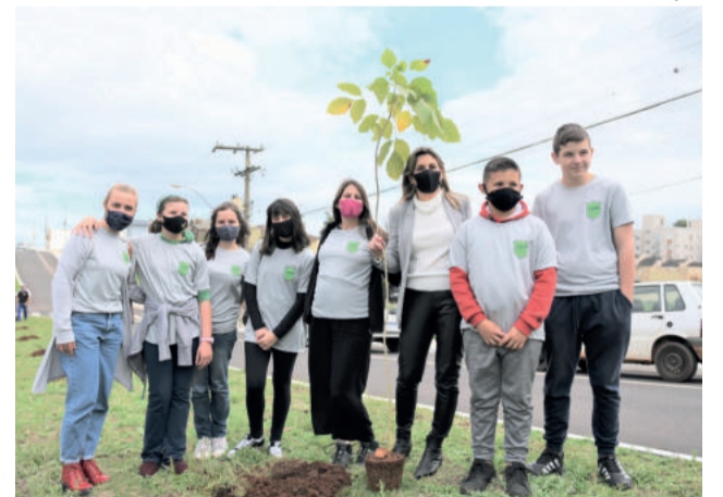
Guardiões Mirins participaram da ação