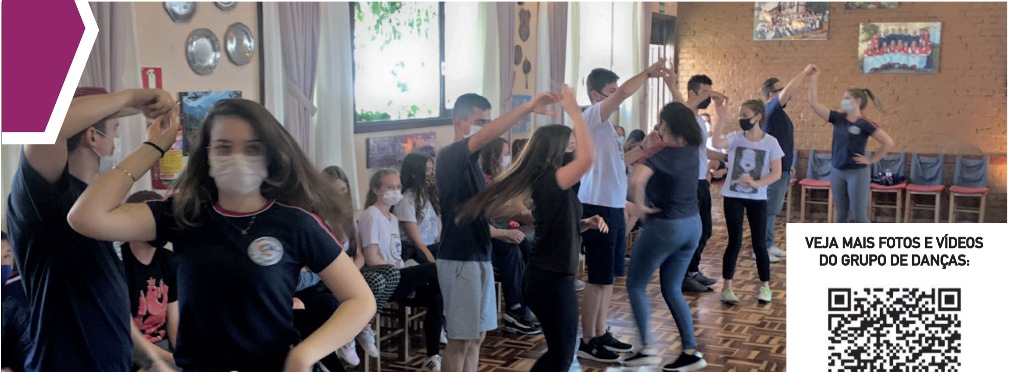
Ensaio aberto dos Grupos Folclóricos foi realizado no sábado

VEJA MAIS FOTOS E VÍDEOS DO GRUPO DE DANÇAS: