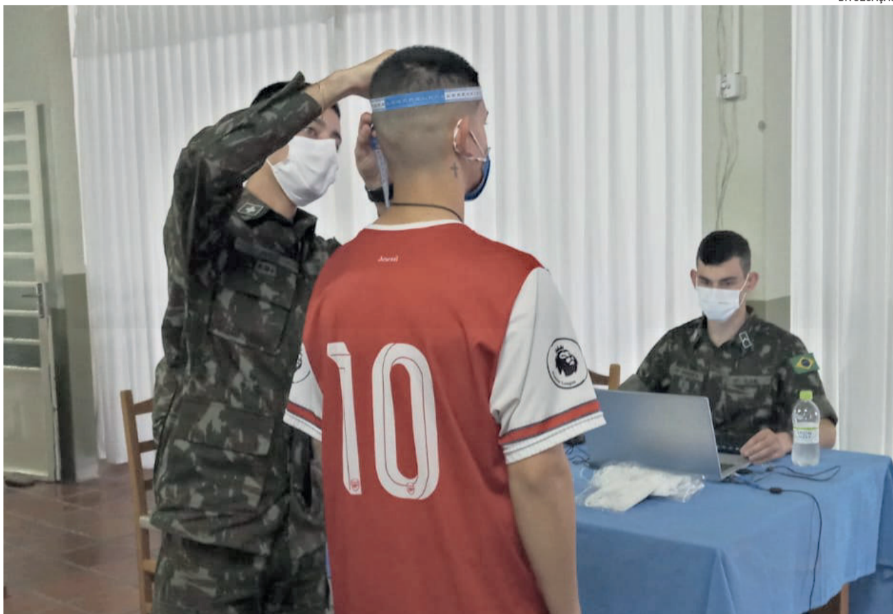
178 jovens eram aguardados para a primeira parte da seleção