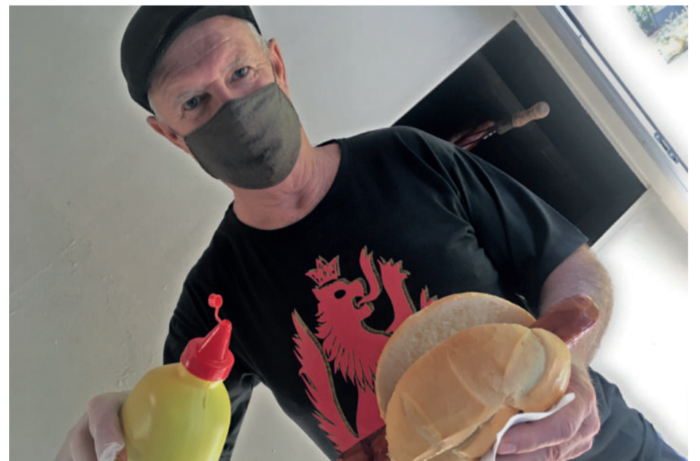
Típico cachorro-quente alemão foi servido aos grupos