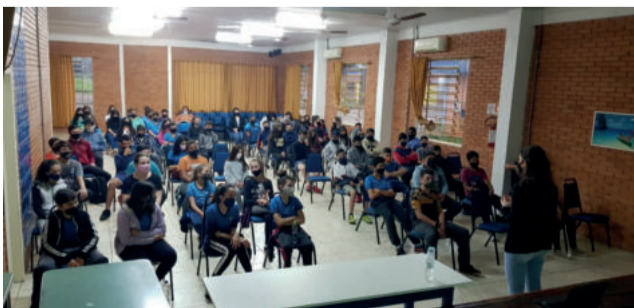
Palestra com alunos da EMEF Edgar da Rosa Cardoso alertou sobre a violência doméstica