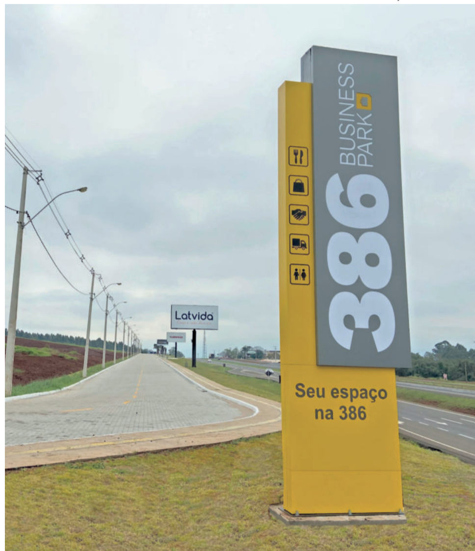
CAT e futuro parque interativo ficarão no 386 Business Park