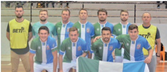
Poço das Antas continua líder da competição