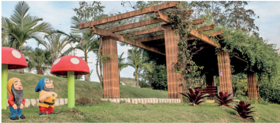
Três praças participam da proposta, entre elas a praça da entrada