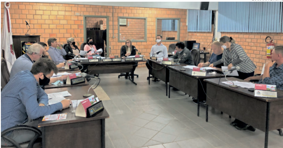
Prestação de contas e apresentação das metas para 2022