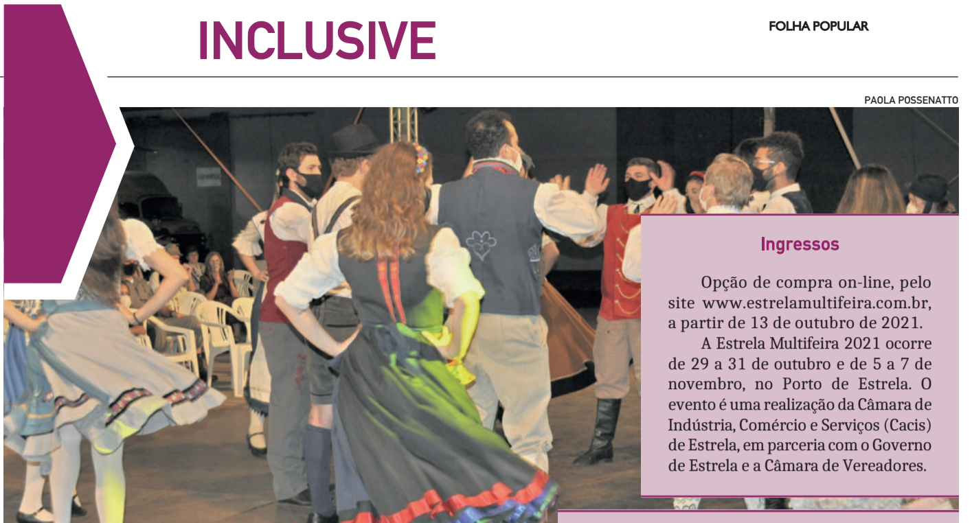
Entretenimento, turismo, cultura e negócios fazem parte da Estrela Multifeira 2021