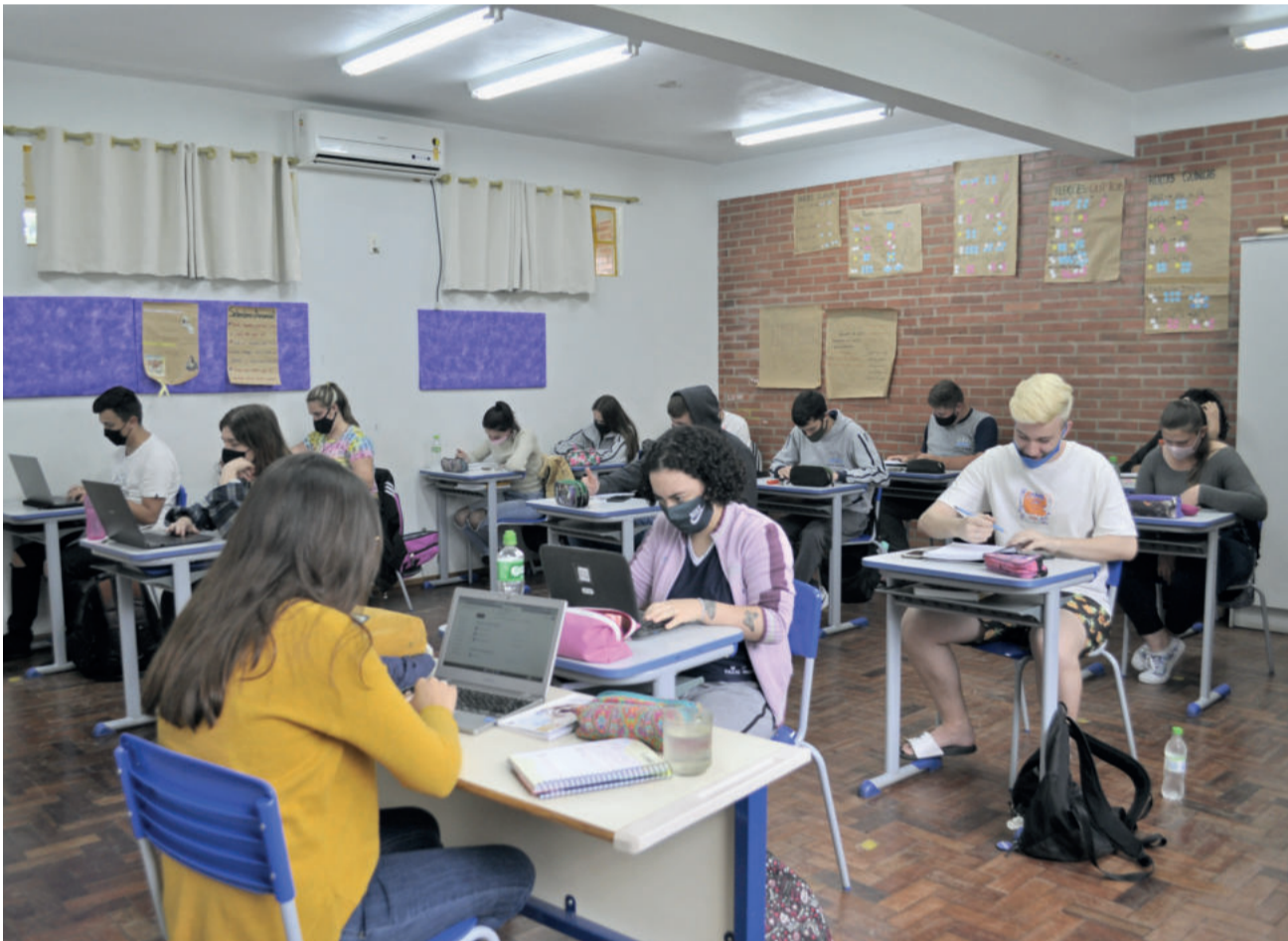
Na EEEM Westfália, o Novo Ensino Médio já é aplicado ao 1º e ao 2º Ano