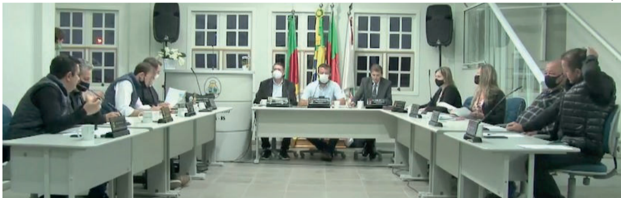
Debates foram trazidos à tribuna na sessão desta terça-feira (28/9)