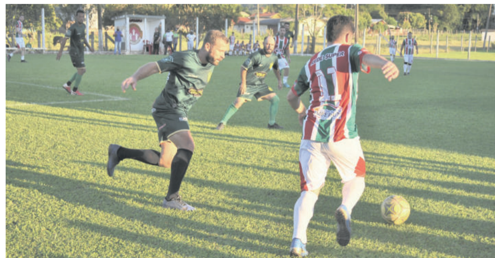
Mesmo desclassificada, a equipe do Ouro Verde deu trabalho para o Canabarense/Força Jovem