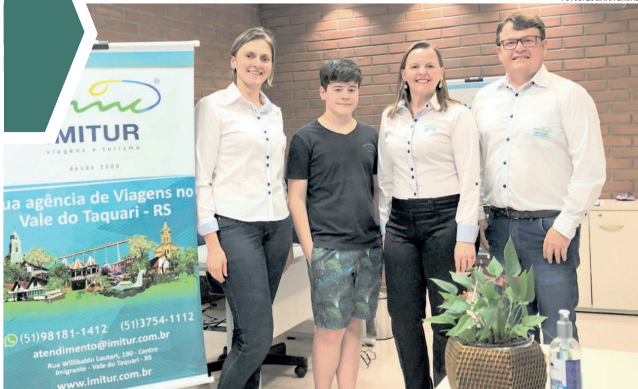
Equipe do Centro Profissional