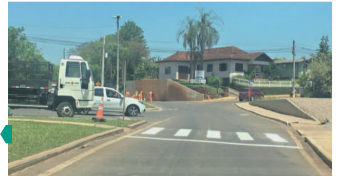
LUCAS LEANDRO BRUNE

A empresa terceirizada da EGR realizou na sexta-feira (22/10) a sinalização das faixas de segurança para pedestres na rótula da ERS-128 (Via Láctea), no acesso aos bairros Languiru e Alesgut. As travessias devem ser feitas pelos "triângulos" de aproximação e não pela rotatória central. A passagem pelos triângulos permite mais segurança, pois o pedestre tem trecho mais curto de pista, só controla uma direção de fluxo e tem calçada de passeio.