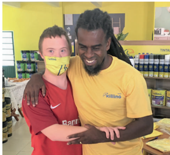
Tinga recebeu o carinho de fãs