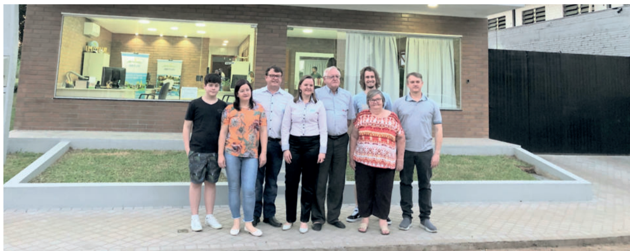
Família Gärtner em frente ao empreendimento

O prédio fica localizado na rua Fernando Ferrari, 85, no Centro