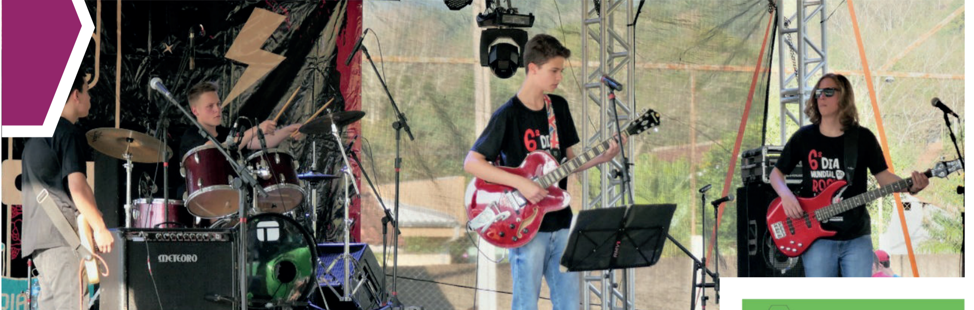
Bandas locais estão entre as atrações