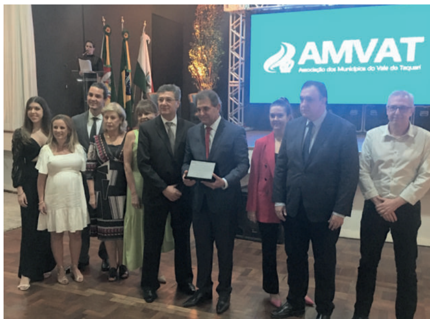
Homenagem à família de Adroaldo Conzatti