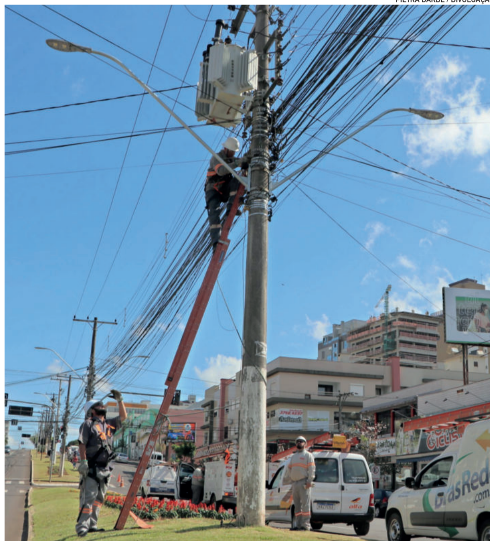
Em Lajeado, Avenida Senador Alberto Pasqualini foi a primeira a receber limpeza