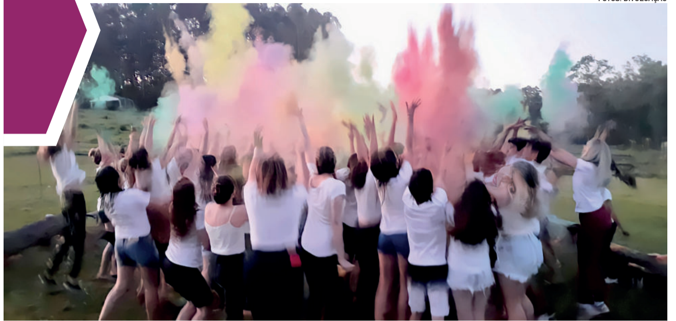
Chuva de cores foi o ponto alto da festa

Nunca houve maldição nessa história, só maldade humana, a que discrimina, a que desampara, aquela que humilha.