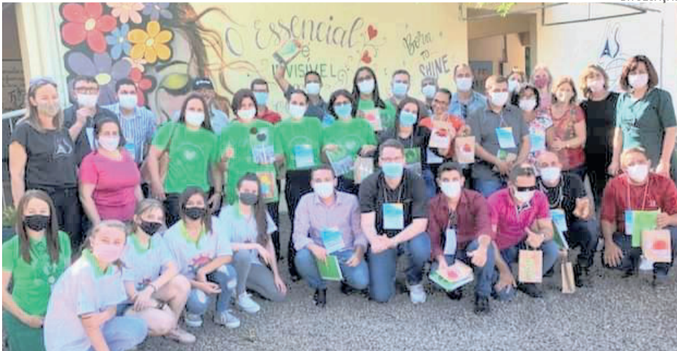
Encontro ocorreu nas dependências da escola