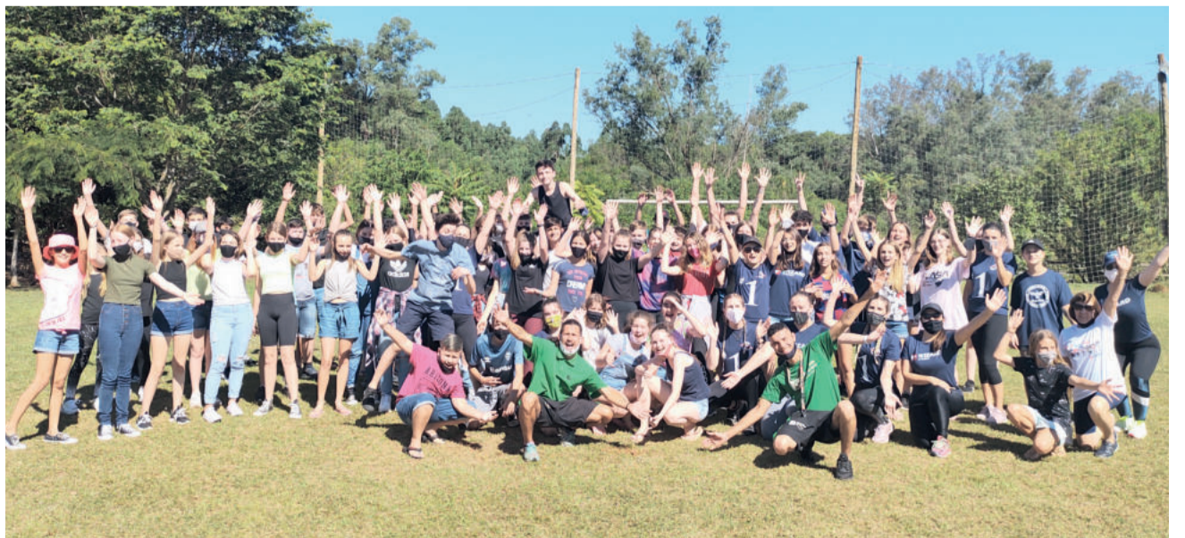
Evento reuniu funcionários e alunos da Wizard