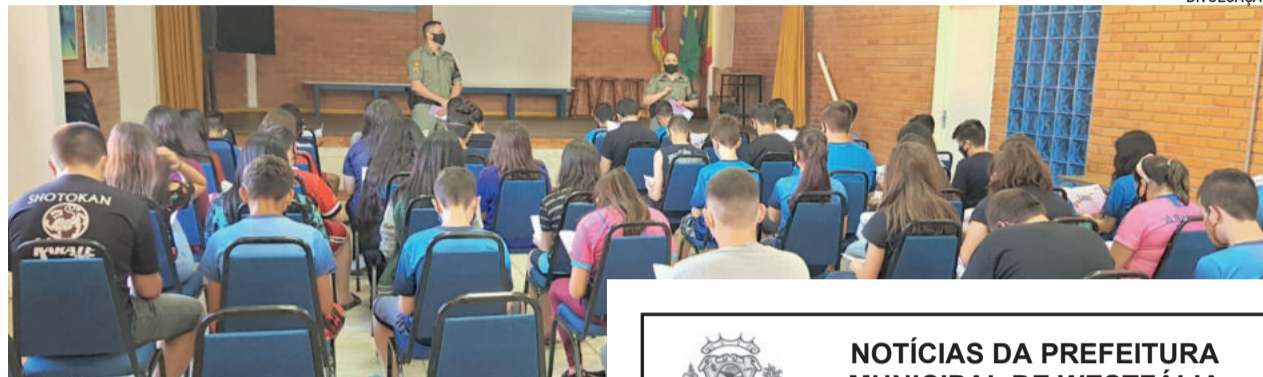
Policiais visitaram diversas escolas do Vale