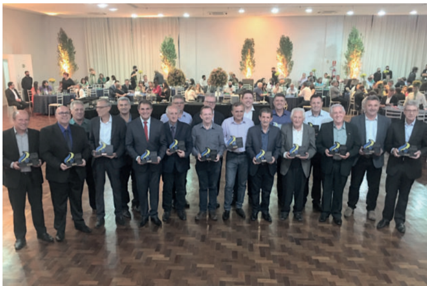
Ex-presidentes da Amvat receberam troféu alusivo