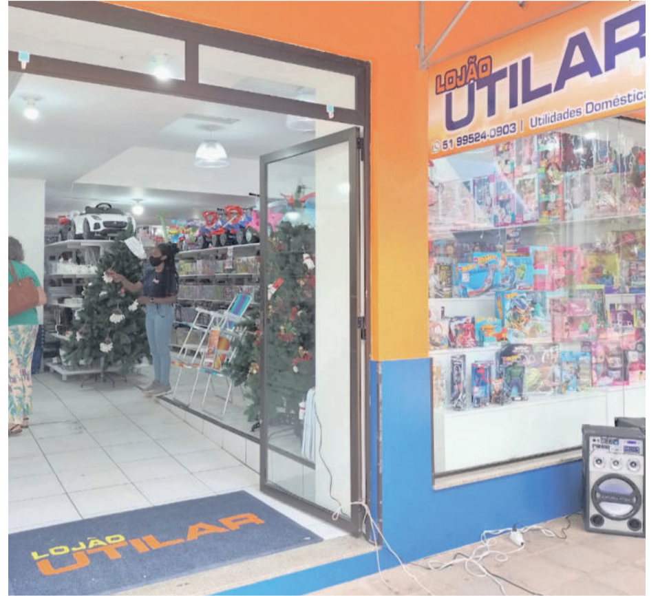
Lojão fica localizado no Calçadão, em Estrela