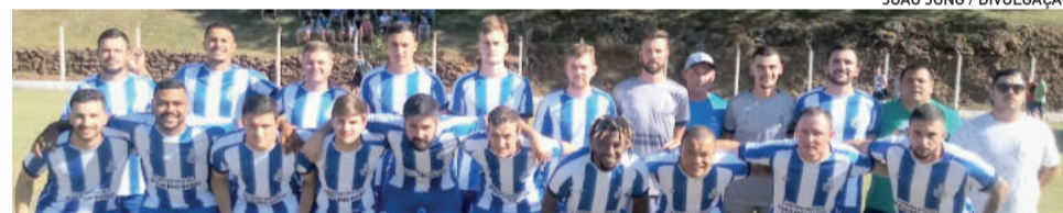
Poço das Antas precisa vencer o jogo de volta, em casa