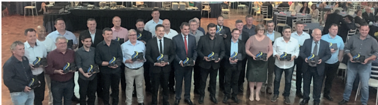
Atuais prefeitos foram homenageados