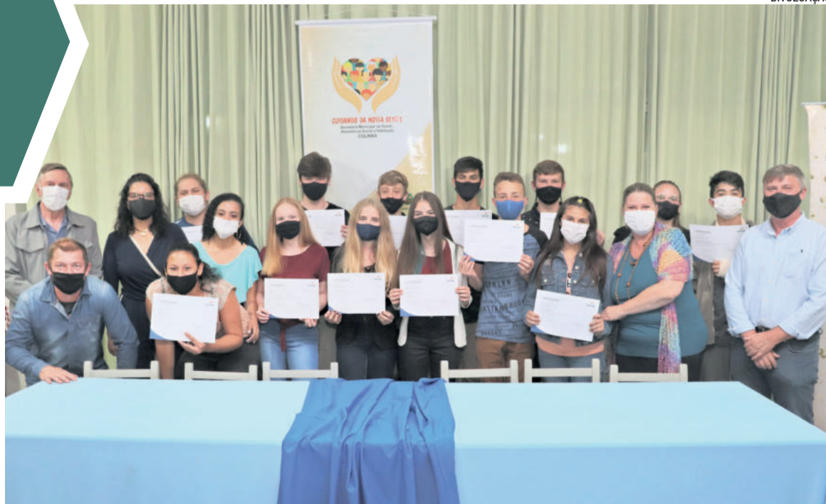
Jovens receberam os certificados do curso