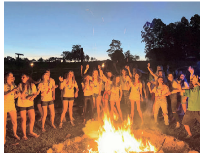
À noite, a festa seguiu ao redor da fogueira

O ponto alto da festa foi a “chuva” de cores ao redor da fogueira com o pôr do sol como cenário, momento em que a emoção tomou conta. “Essa festa foi certamente a melhor coisa que podíamos ter realizado para celebrar os 20 anos de parceria que a escola tem com a comunidade e cidades vizinhas que confiam no nosso esforço para transformar a