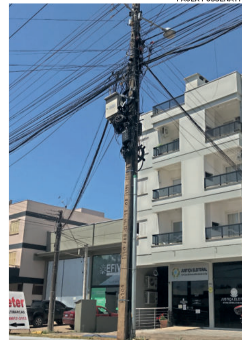
Na Avenida 1 Leste, em Teutônia, vários postes apresentam situação semelhante; além do emaranhado de conexões, estão baixos