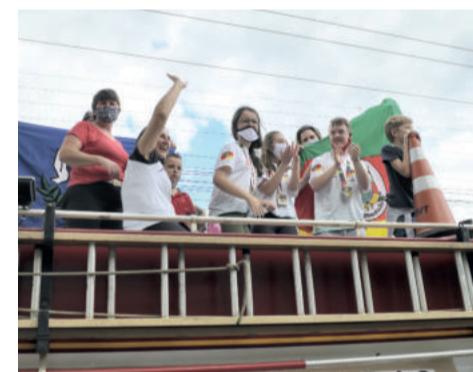
Comemoração foi grande