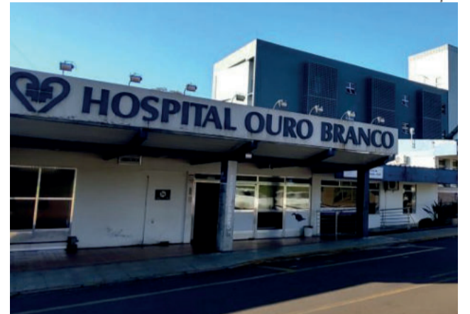
Principal fonte de reclamações, o PA passa por mudanças no atendimento