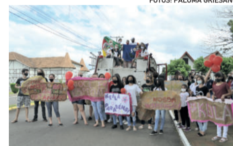
Eles receberam o carinho e reconhecimento da comunidade