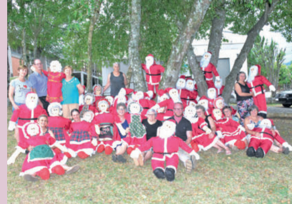
Voluntários confeccionaram decoração natalina