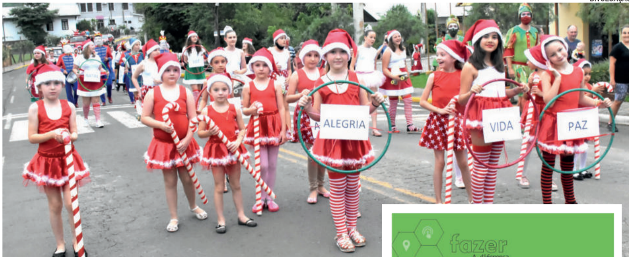
Alunos das escolas participaram do desfile