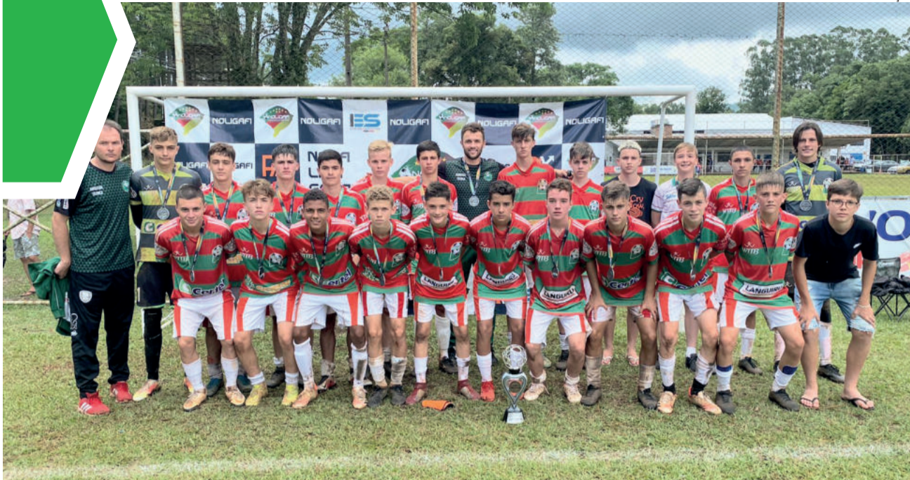
Equipe conquistou o 2º lugar