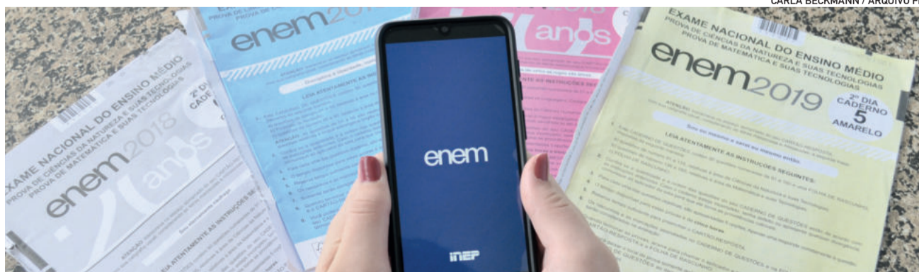
Os resultados oficiais serão divulgados hoje