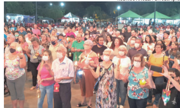
Trajeto passou por ruas centrais