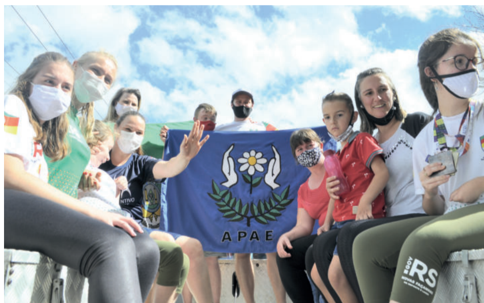
Atletas, professores e familiares celebraram com passeio no caminhão de bombeiros

A professora destaca que os alunos estão muito felizes com tudo que aconteceu. Ela explica que a vivência, para eles, é de grande valia, porque muitas vezes a inclusão não acontece na escola regular, porque eles não se sentem tão aceitos e não fazem tantas amizades quanto em um evento como esse. “Onde eles foram aceitos, onde foi visto o potencial deles e não só a dificuldade. Antes mesmo da medalha, um relato desses é um prêmio de grande valia”, opina.