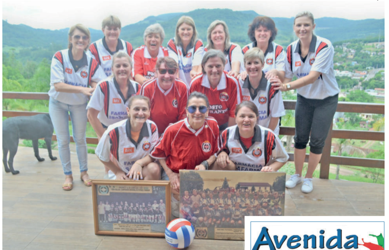
Jogadoras participantes do encontro do Racing