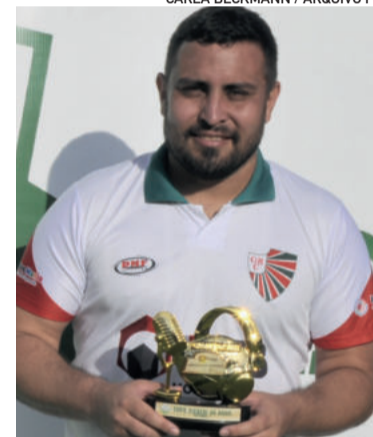
Índio foi três vezes craque do jogo e terminou como artilheiro da competição