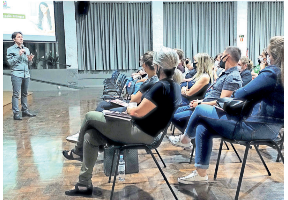
Proposta foi apresentada em reunião de pais em palestra