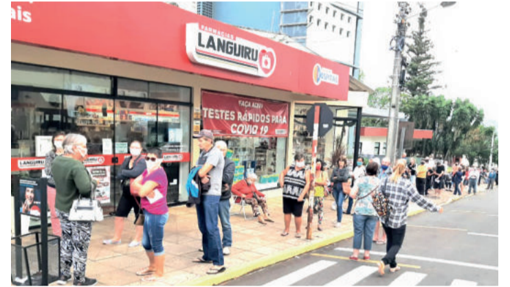
A fila do Laboratório Ouro Branco virava a esquina na Rua Santos Dumont