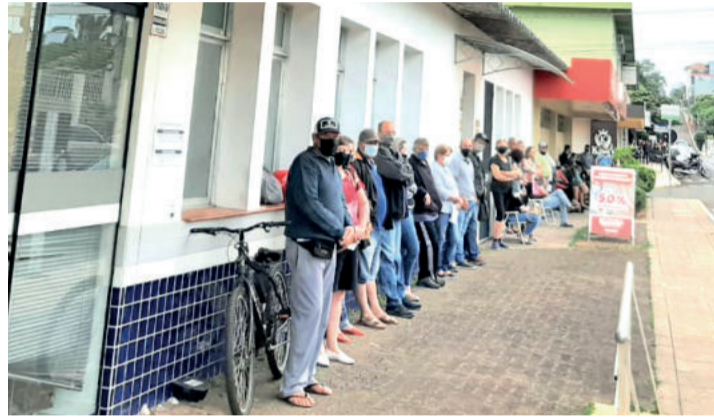
Filas em frente aos laboratórios começam a se formar ainda na madrugada