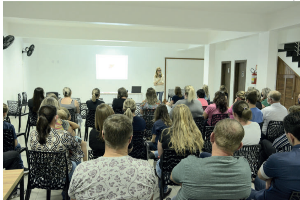
Projeto foi apresentado nesta quinta-feira (2/12)

o projeto é uma ideia linda, com propósitos de união de laços familiares.