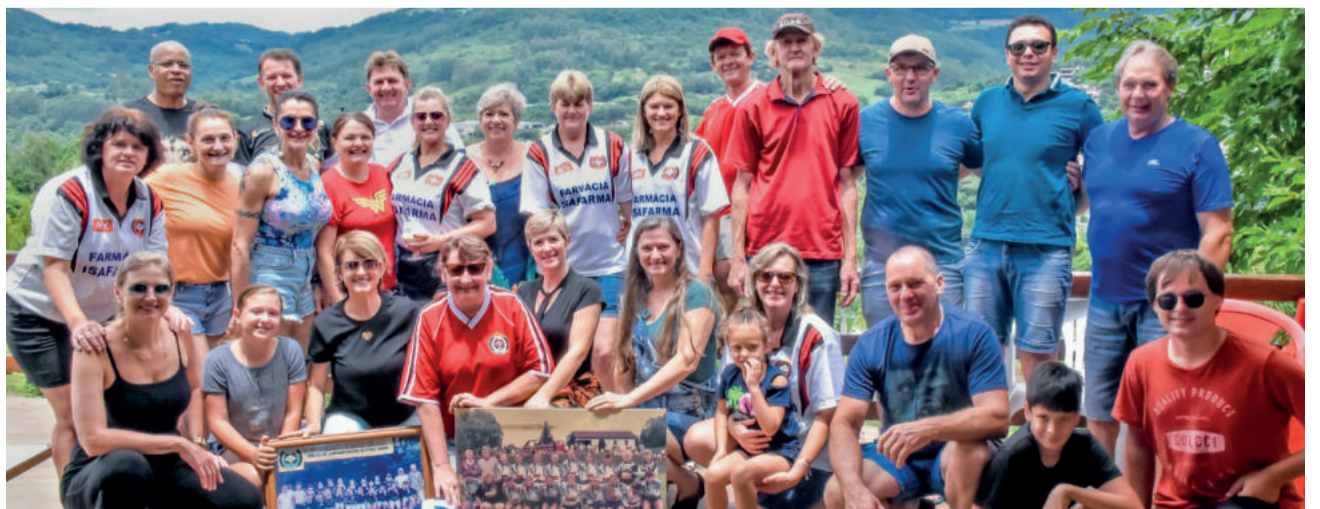
Familiares da torcida também participaram

Algumas integrantes ainda jogam futsal, mas competições daquele tipo não acontecem mais. A ideia deste encontro é retomar a convivência mais intensa e manter viva esta chama tão importante na memória de cada uma que fez parte da história do Racing. O projeto é fazer pelo menos dois encontros por ano.