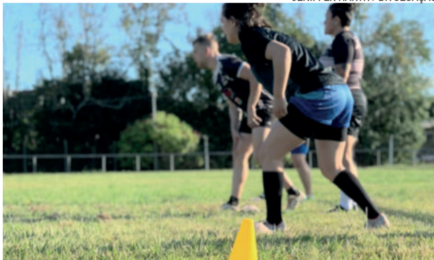
Projeto será desenvolvido com crianças de 9 a 12 anos

terial e honorários dos profissionais envolvidos”, destaca.