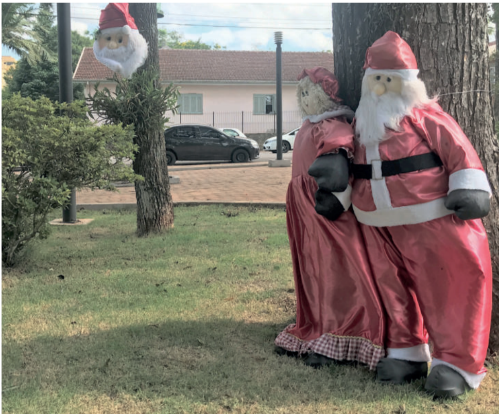
A Praça da Evangélica, em Canabarro, recebeu diversos Papais Noéis e Mamães Noéis