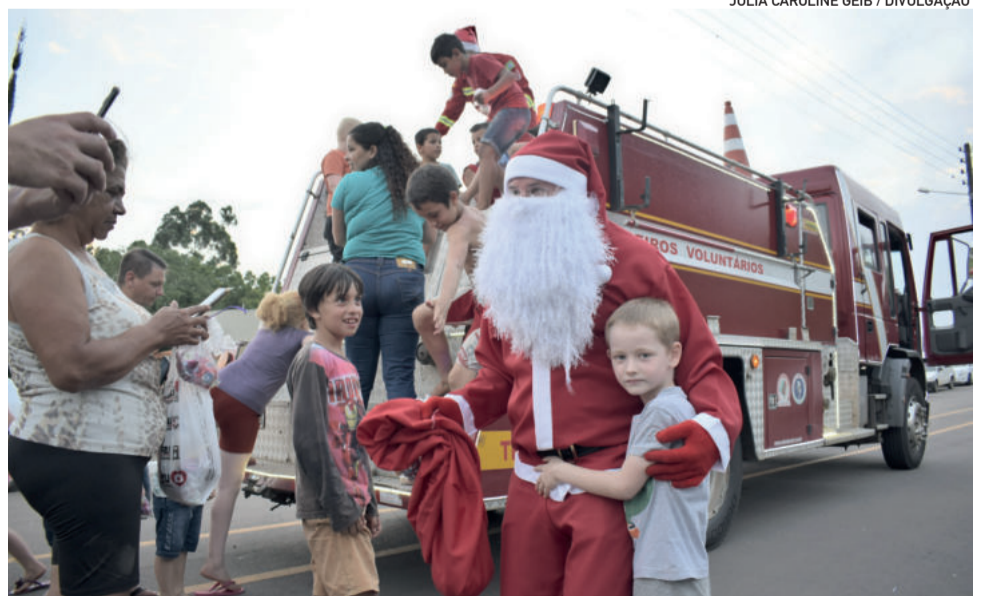
Papai Noel distribui doces para as crianças