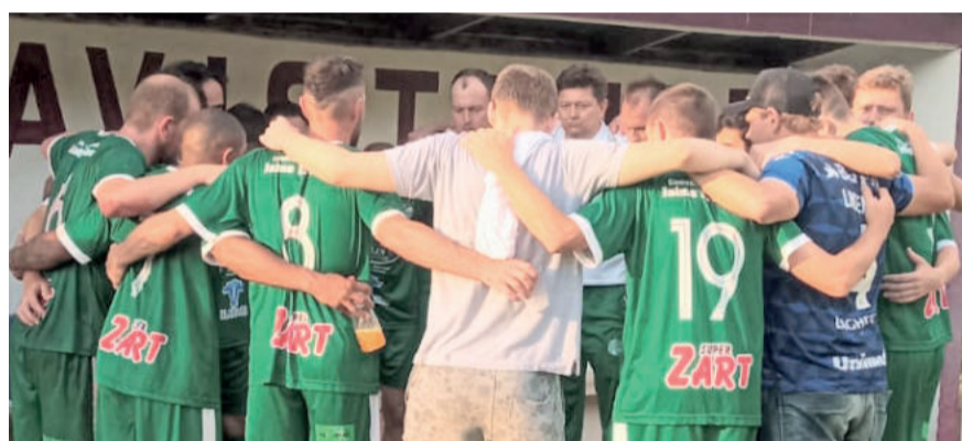
Juventude rezou e agradeceu após a primeira partida