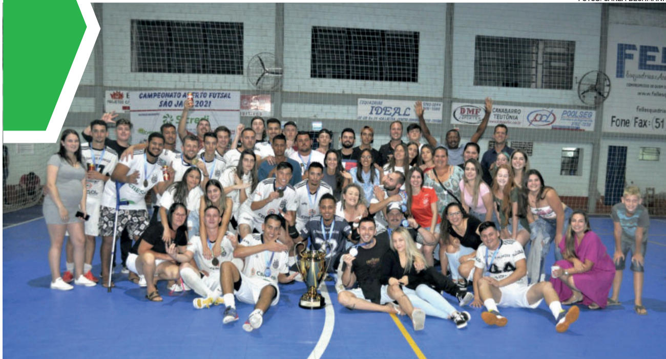
Equipe e torcida comemoraram a conquista