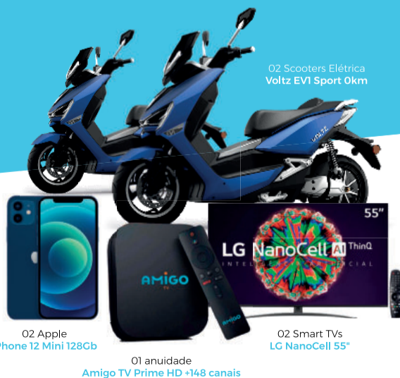
02 Apple iPhone 12 Mini 128Gb

Ainda não é assinante? Corre lá que dá tempo!