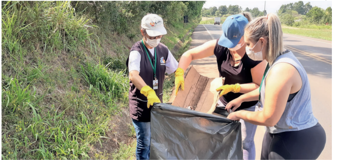
Voluntários recolheram lixo na Via Láctea

A ação também foi realizada, entre os dias 22 e 26 de novembro, nas comunidades do interior, onde foram recolhidos lixo eletrônico, linha branca, lonas