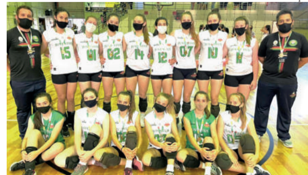
Equipe obteve o título invicto