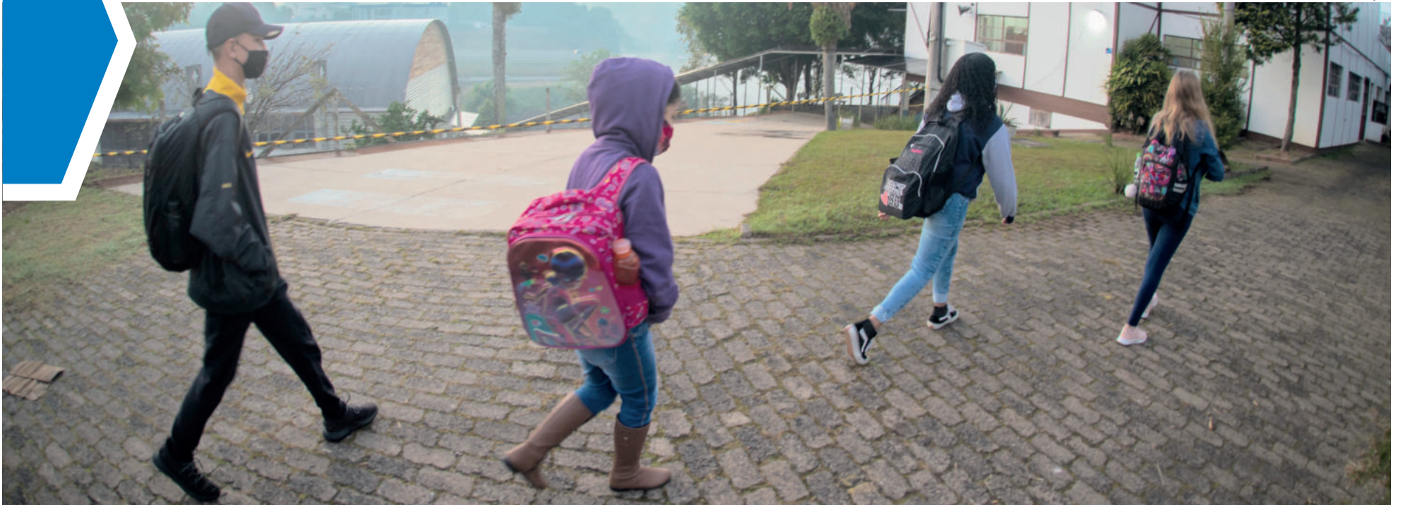
Kits escolares terão distinção de itens para crianças das Emeis e das Emefs, conforme idades e anos