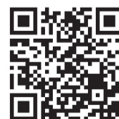
02 Smart TVs LG NanoCell 55"