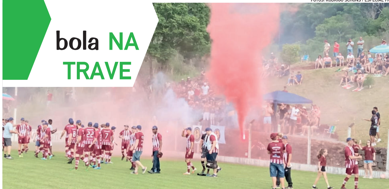
Torcedor do Boavistense fez a festa na recepção à equipe