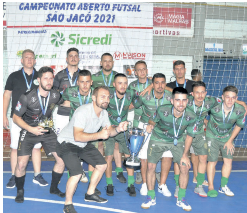
Celtic fez uma boa campanha na competição