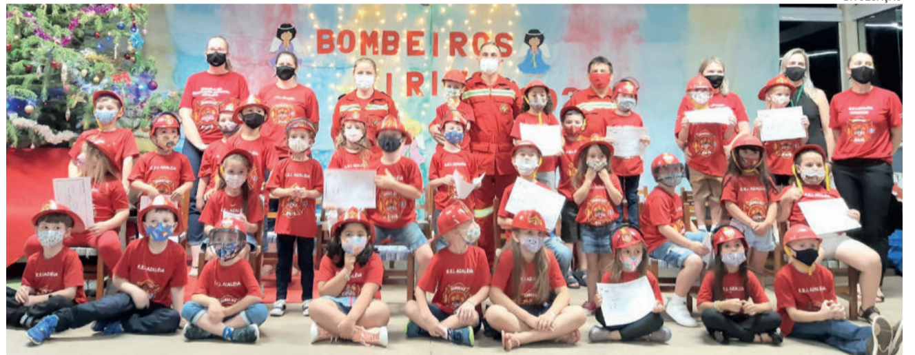
Formatura dos bombeiros mirins

As famílias que presenciaram o momento perceberam a emoção dos estudantes e o orgulho com os aprendizados, além da admiração pelo trabalho dos bombeiros. Ao final, teve confraternização e homenagens pelo dia do bombeiro, em que os estudantes fizeram cartões para reconhecer os voluntários.