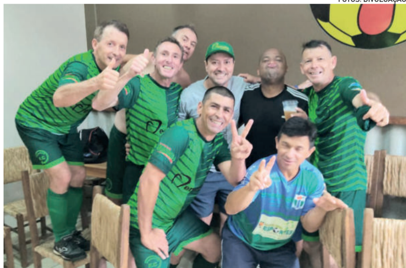
Festa do Rudibar iniciou logo após a partida