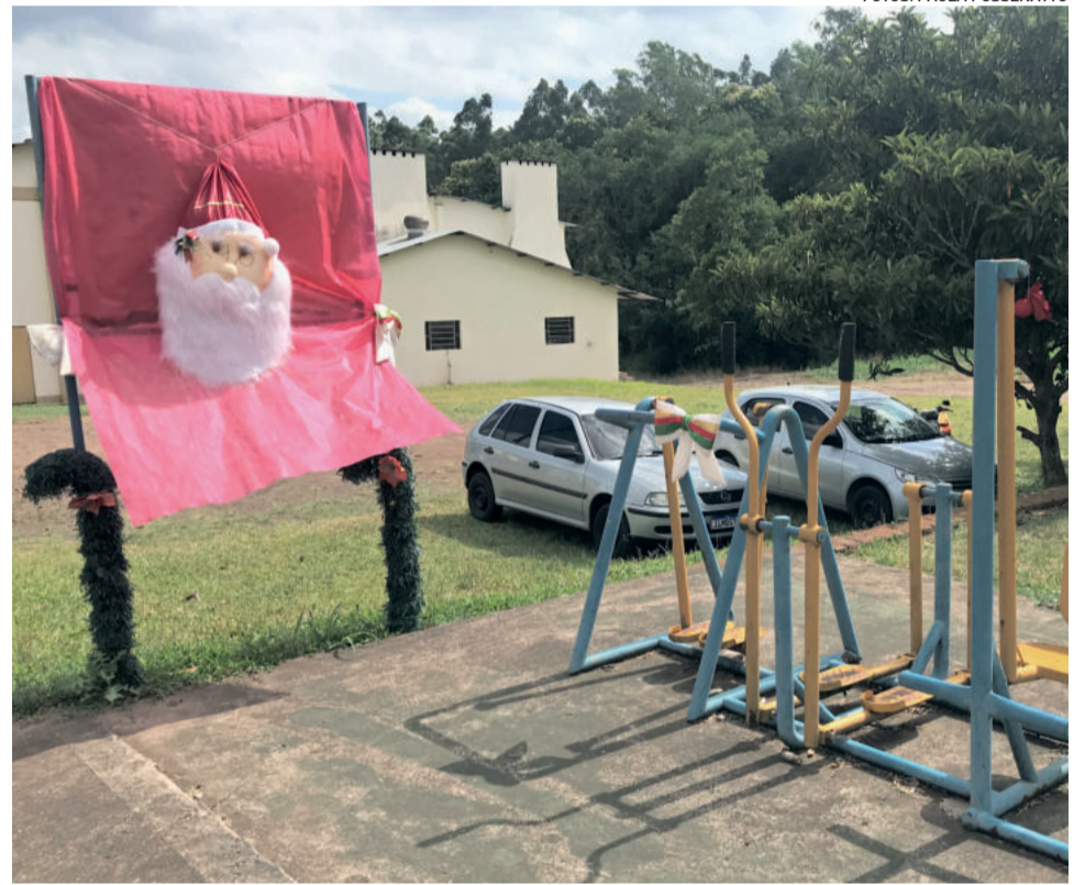
Em Boa Vista, decoração pode ser vista em ruas e na academia ao ar livre do Bairro