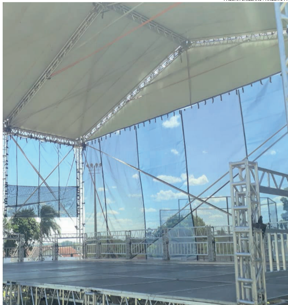
Palco na Pista do Colégio Teutônia foi montado nesta terça-feira (7/12)