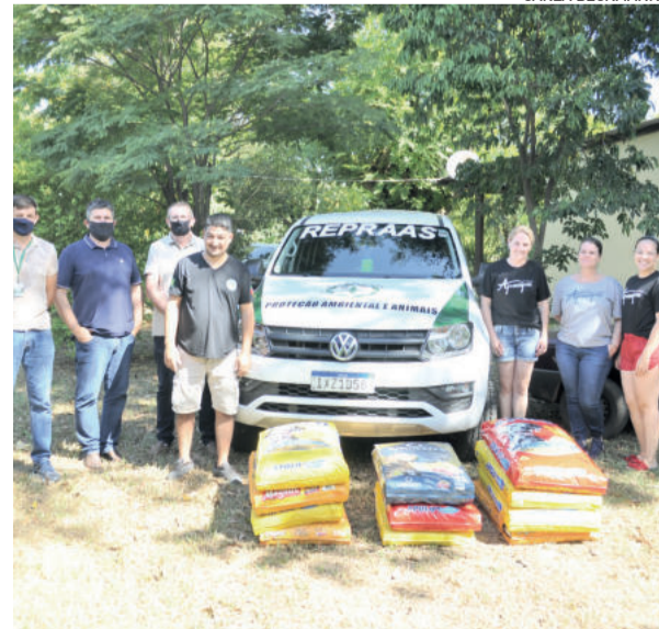
Entrega foi realizada na sede da Repraas