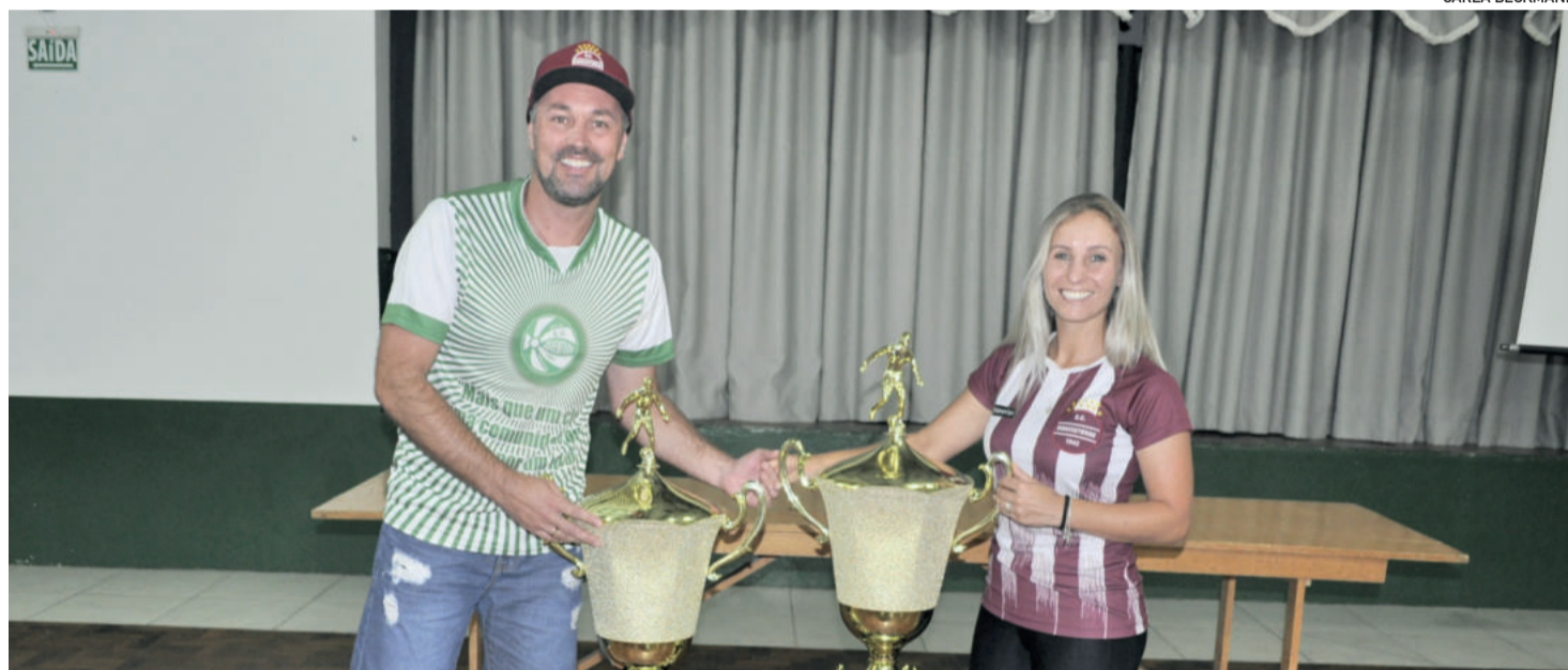
A relação futebolística do casal é pautada pelo respeito