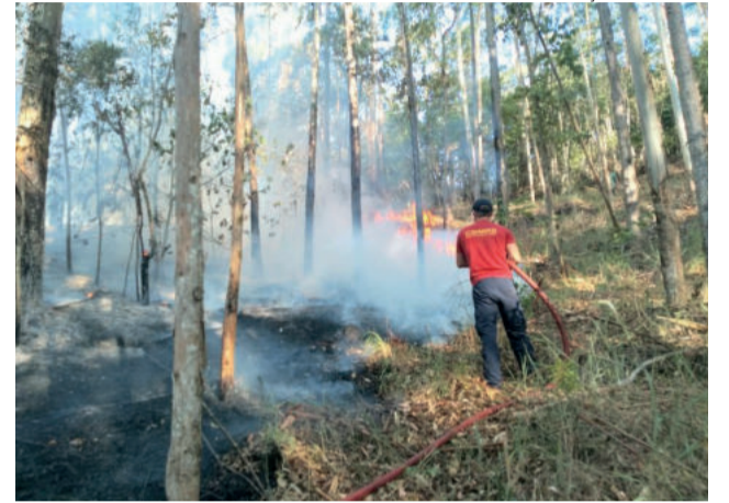
Nos últimos dias, bombeiros têm se dedicado a diversas ocorrências de incêndio em vegetação

Segundo dados dos Bombeiros de Estrela, 2021 teve o mês de dezembro com mais focos de incêndio em vegetação dos últimos 3 anos na região atendida pela corporação. Foram 35 ocorrências até o dia 27 de dezembro. Em 2020, haviam sido 15 ocorrências no mês todo. Em 2019, o mês de dezembro havia registrado 26 casos.