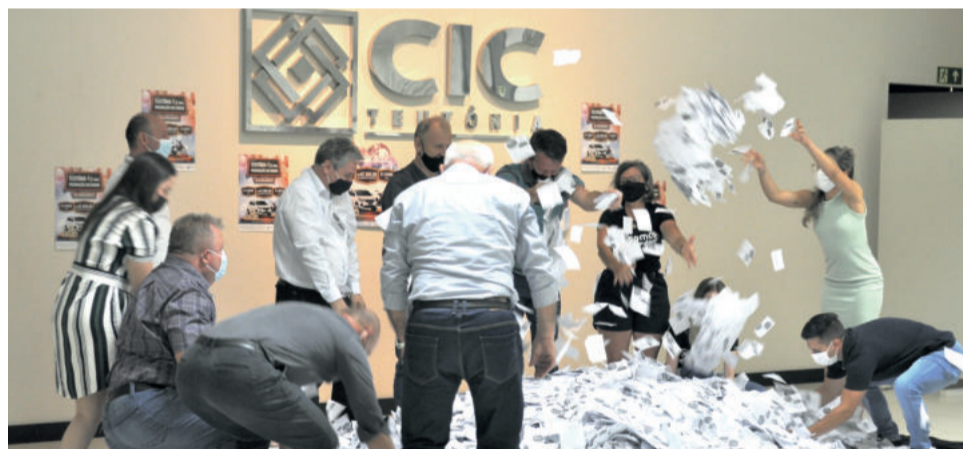
Autoridades e representantes auxiliaram no sorteio