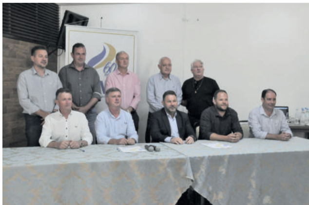
Nova diretoria da Amvat foi eleita por aclamação

O prefeito salienta que a Amvat é o braço político das decisões que precisam ser tomadas no Vale do Taquari. “Precisamos estar a frente, sempre em contato com as esferas estadual e federal, porque sabemos que esse tipo de decisão que faz a evolução e desenvolvimento aconteça de forma mais rápida ou menos rápida”, pontua.