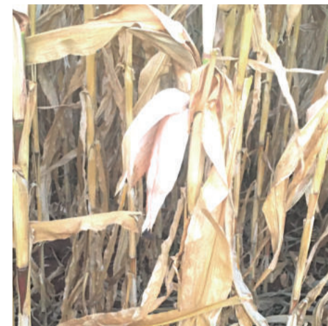
Falta de água afeta o desenvolvimento dos plantios