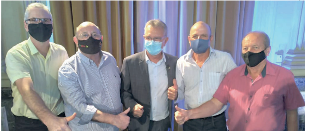
Representantes de Poço das Antas junto do secretário de Articulação e Apoio aos Municípios, Luis Carlos Busato e do deputado estadual, Aloísio Classmann (PTB) celebram conquista

O valor de contrapartida por parte do Município pode sofrer alteração em razão do tempo transcorrido entre a inscrição do projeto, o dia do anúncio e os reajustes aplicados em índices que dizem respeito às tratativas de compra e venda.