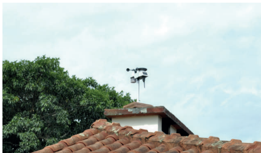
Os sensores que coletam os dados meteorológicos ficam instalados no telhado da casa de Dudu