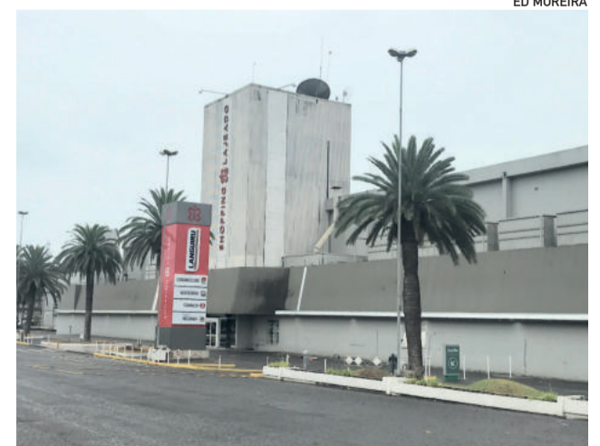
Nova administração revela ter grandes projetos que “prometem surpreender a região”

Inaugurado em 1994, o Shopping Lajeado teve diferentes nomenclaturas e proprietários. Até dezembro, pertencia a um grupo de investidores: RB Capital Cia Securitizadora S.A (70%), Multi Shoppings FII (24,88%), FII Millenium (4,66%) e Azul VX FIDC Multissetorial NP (0,44%). O Grupo Benoit, por sua vez, surgiu em 1971, possui mais de 250 lojas – no Rio Grande do Sul, Santa Catarina e Paraná – e 3,7 mil funcionários.