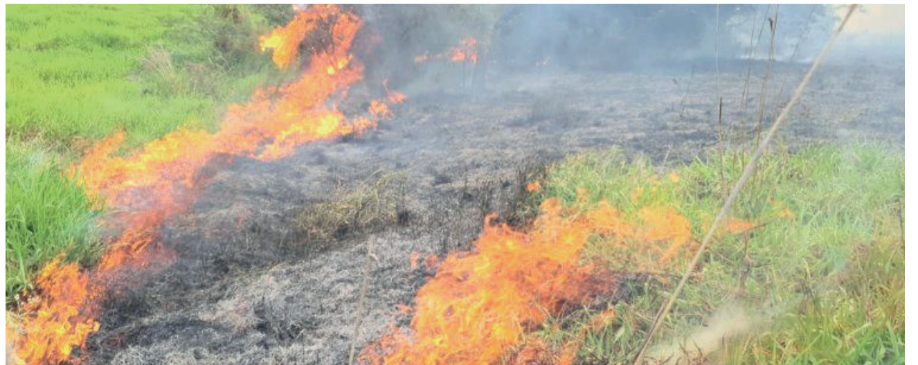
Com o tempo seco, pequenos focos se alastram rapidamente e se transformam em incêndios

Outra dica importante é manter fósforos e isqueiros longe de crianças. Também, não abandonar fogueiras.