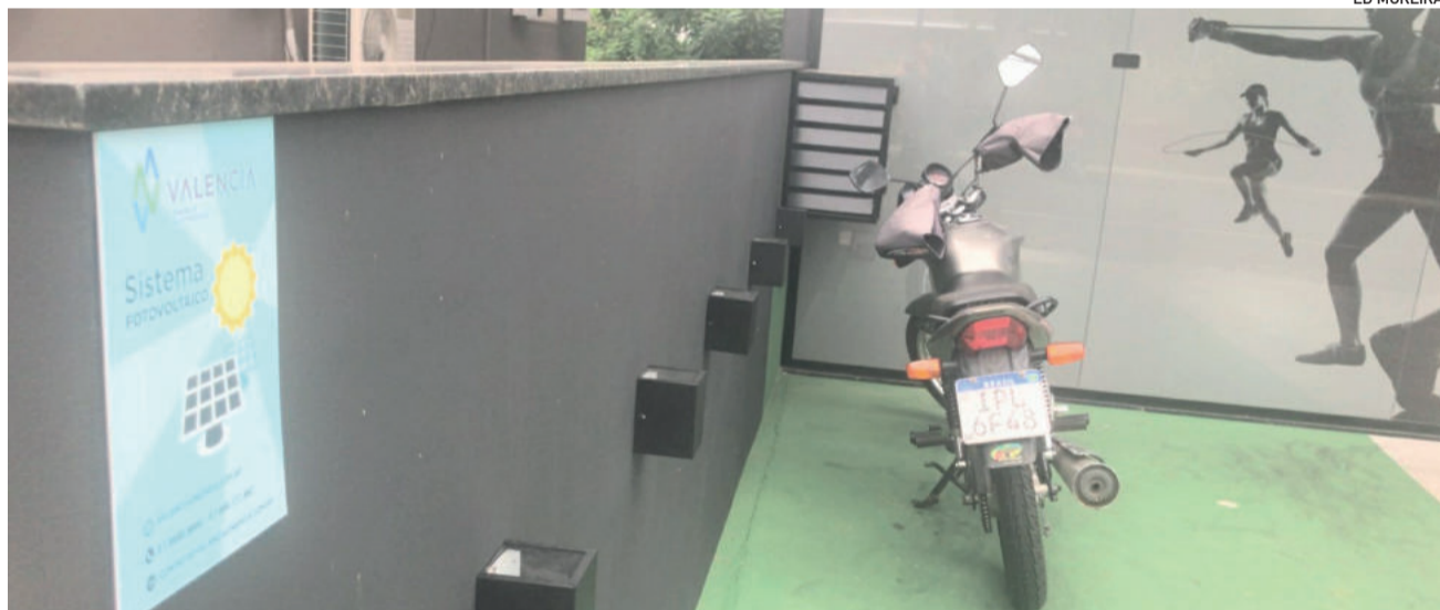
Estação de recarga encontra-se no estacionamento da Academia Supinus