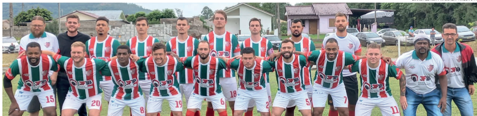
Canabarense levou a melhor diante do Atlético Gaúcho