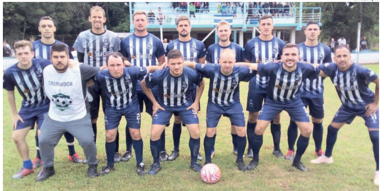
Poço venceu o Ecas por 3 a 0