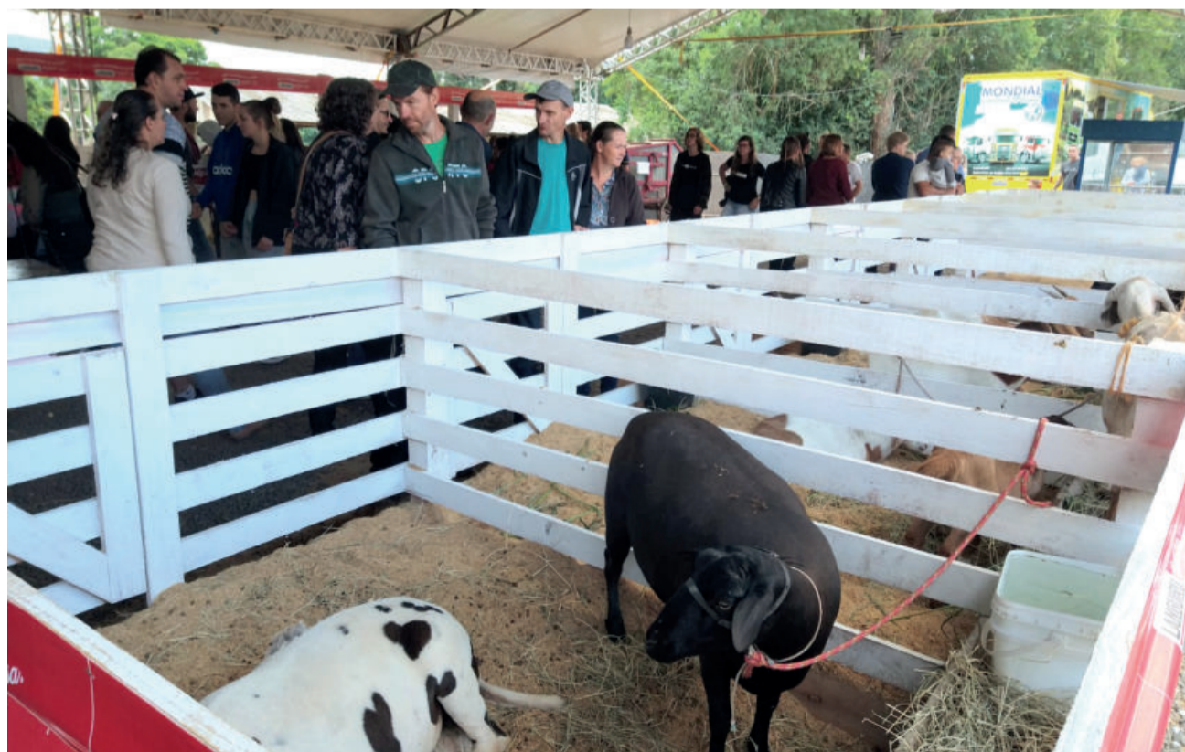
Exposição de animais atraiu muitas famílias