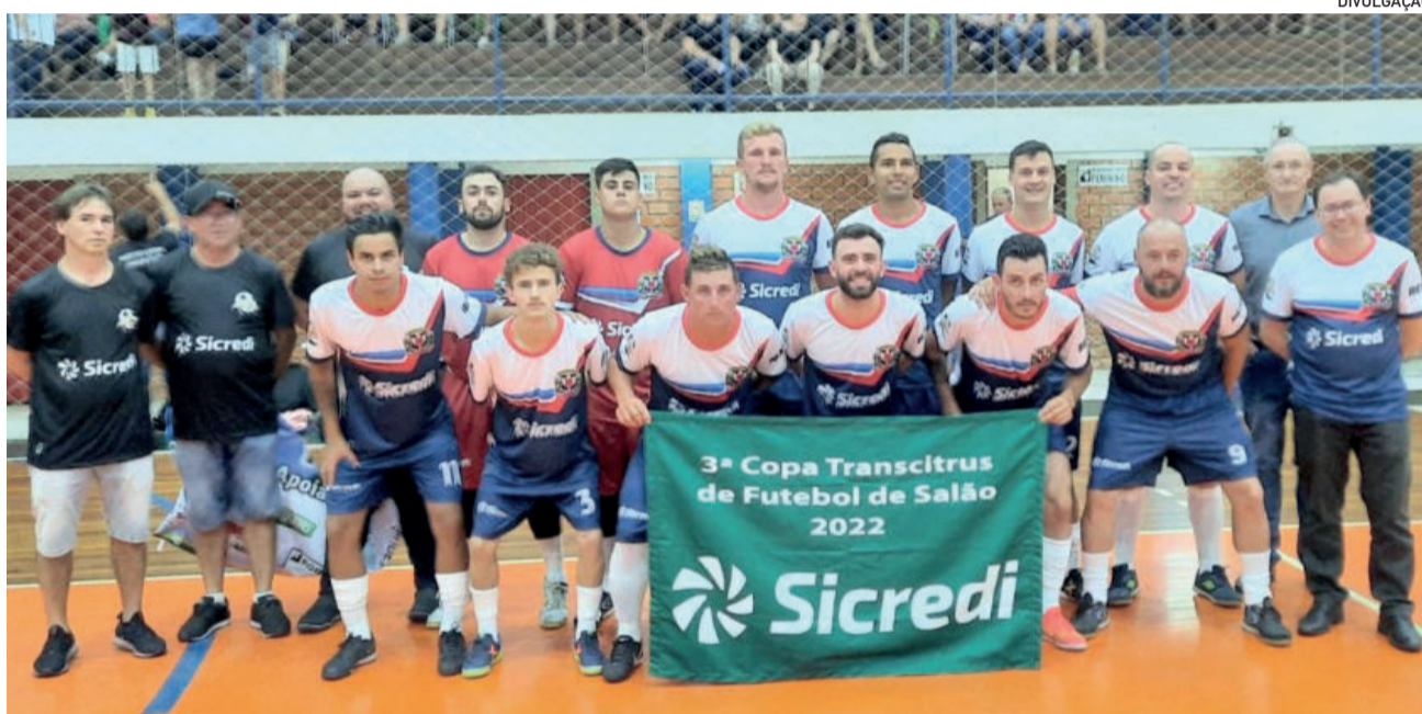
Equipe de Paverama soma uma vitória e dois empates na competição

A quarta rodada será disputada nesta sexta-feira (25/3), em Salvador do Sul. Maratá enfrenta São José do Sul; Brochier encara Harmonia; Pareci Novo joga contra Paverama; e Salvador do Sul enfrenta Poço das Antas. Paverama e Salvador do Sul são as únicas equipes invictas na competição.