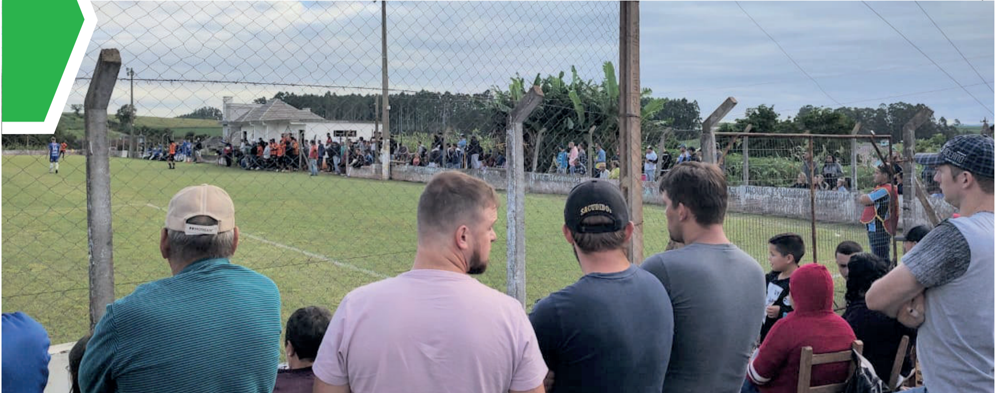
Público esteve "em peso" na rodada complementar