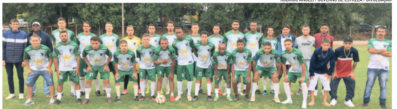
Gaviões do B.I venceu o Delfinense por 3 a 2