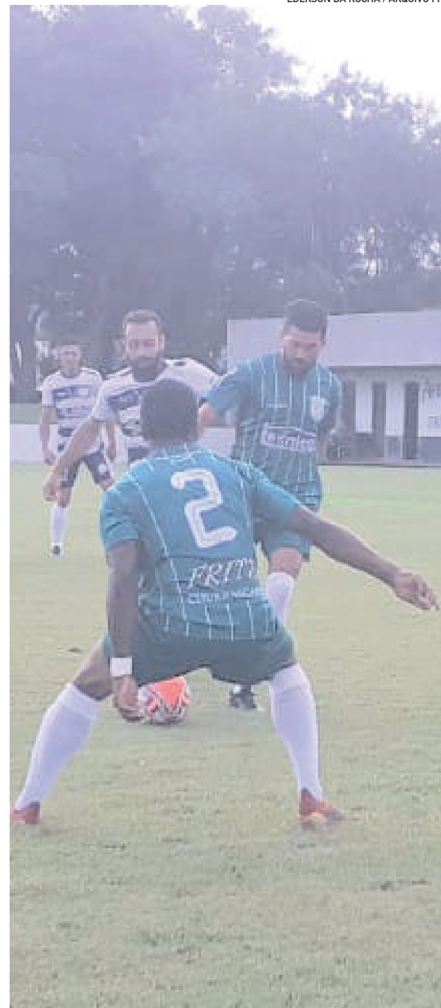
Esperança e Juventude empataram em 1 a 1