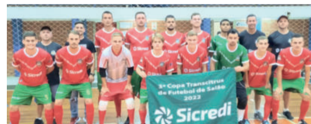
Salvador do Sul lidera com nove pontos