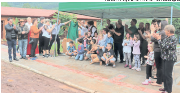
Espaço foi inaugurado no sábado