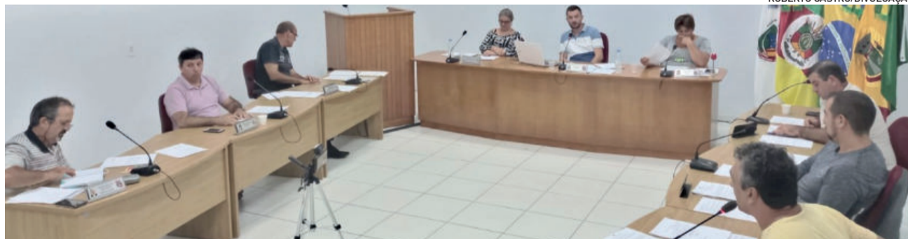
Sessão realizada segunda-feira