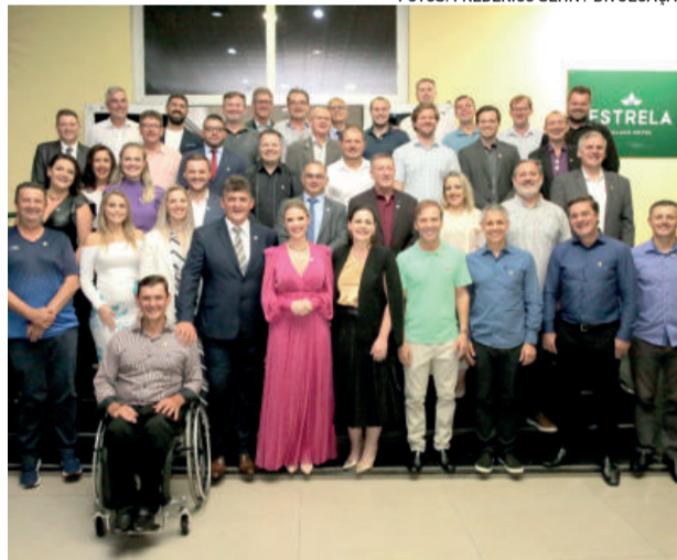
Diretoria Gestão 2022-2024 foi empossada