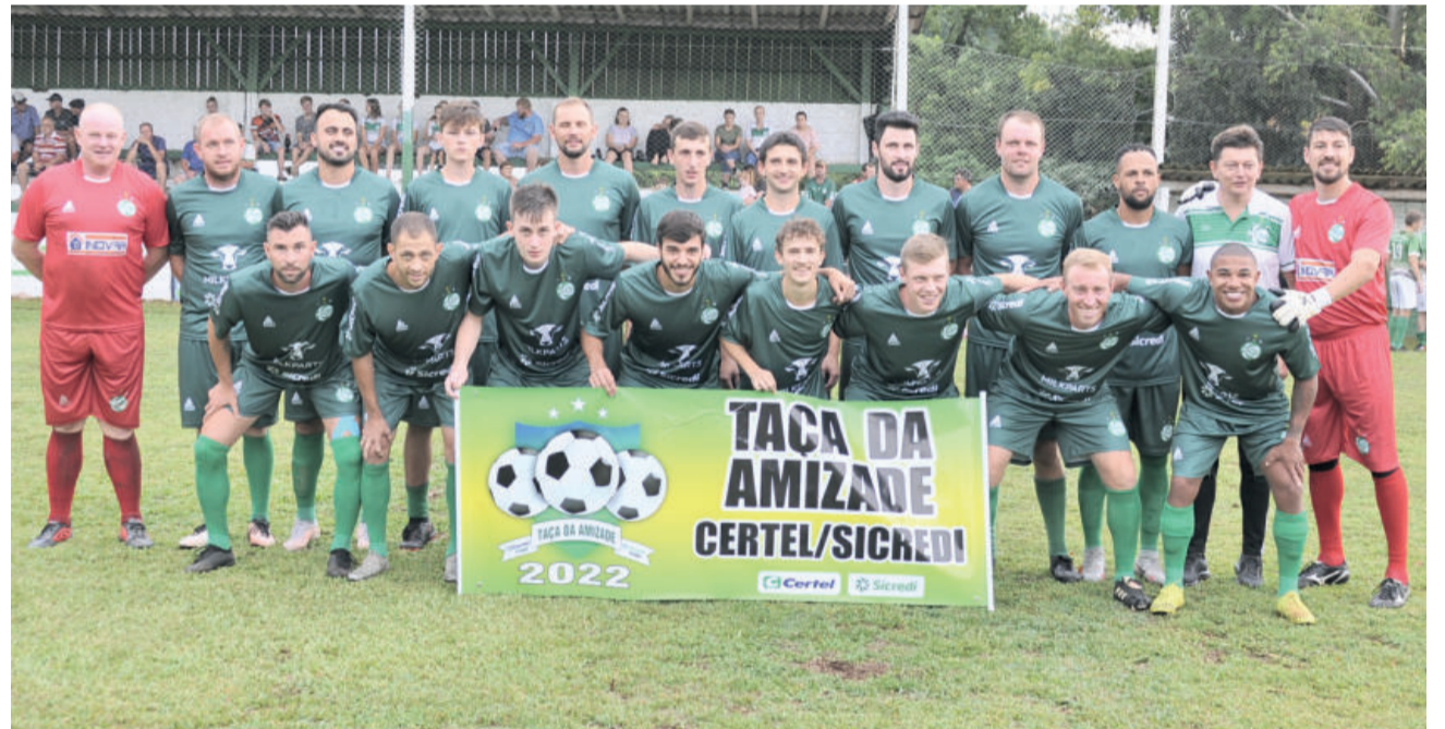
Juventude venceu o clássico diante do Boavistense por 2 a 1