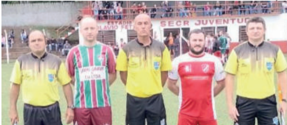
Juventude (vermelho) recebeu o Fluminense (bordô e verde) em casa