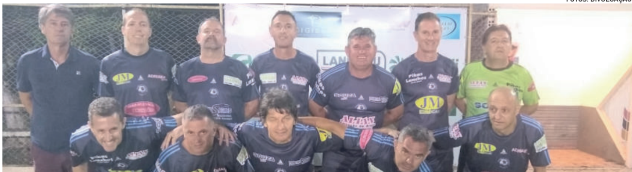
Máster – Família Azevedo/Chagas

Na categoria Máster, o Amigos do Lolo enfrenta o Ta'alentos. Pela categoria Sub-21, o Internacional de Santa Manoela – atual campeão (2021) encara o Projeto Guarani. E na categoria Força Livre, Os Parças joga contra o Galácticos. Os jogos iniciam às 20h30 no Campo 1 da Associação de Funcionários da Languiru.