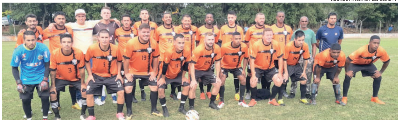
Atlético Estrelense derrotou o Geraldense por 3 a 1