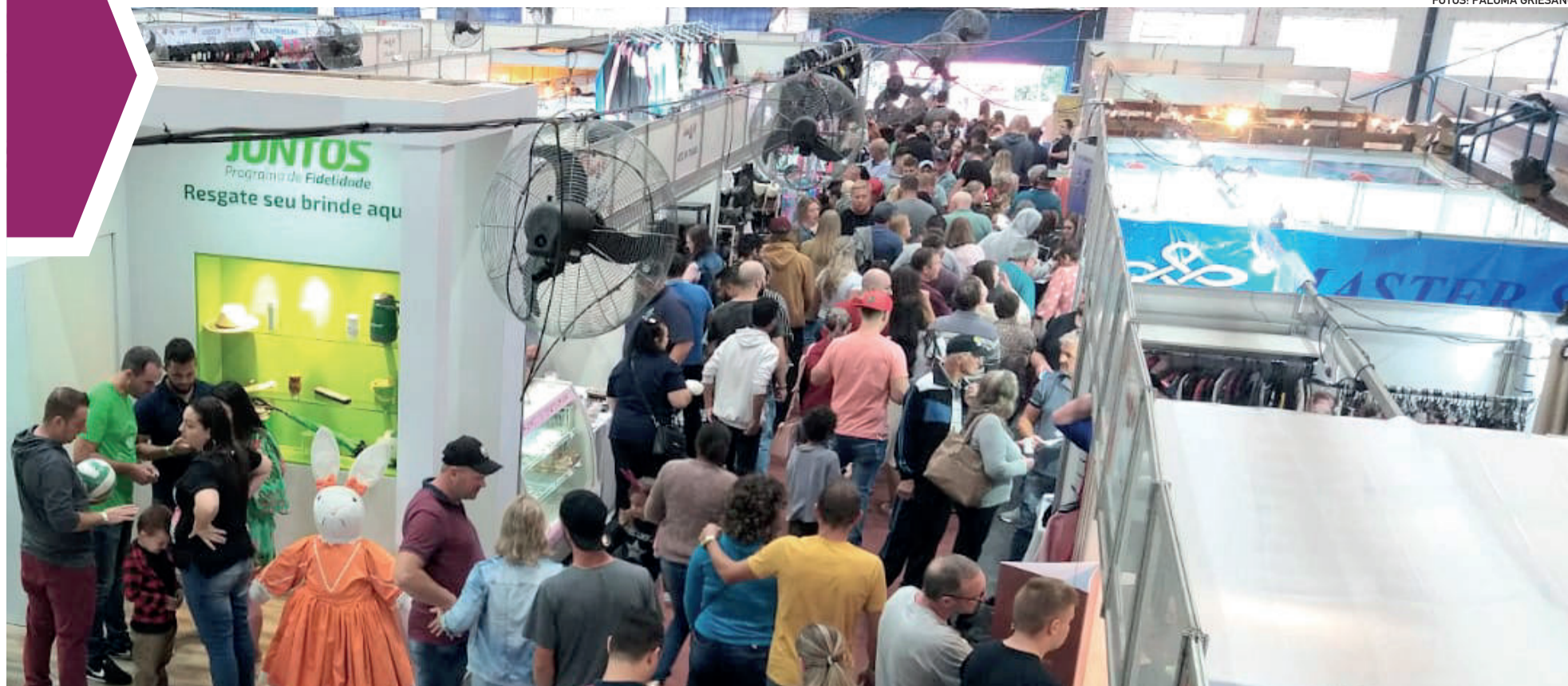
Movimentação nos estandes foi intensa no fim de semana