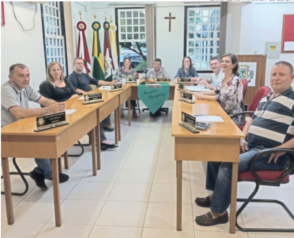
Vereadores se reuniram em sessão ordinária na segunda-feira