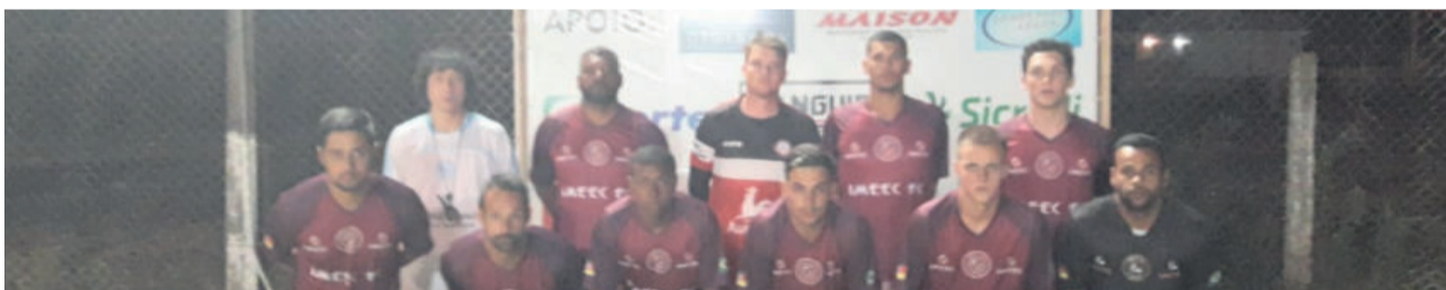
Força Livre – Imeec