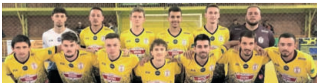
Saidera venceu o Futiba FC por 5 a 0