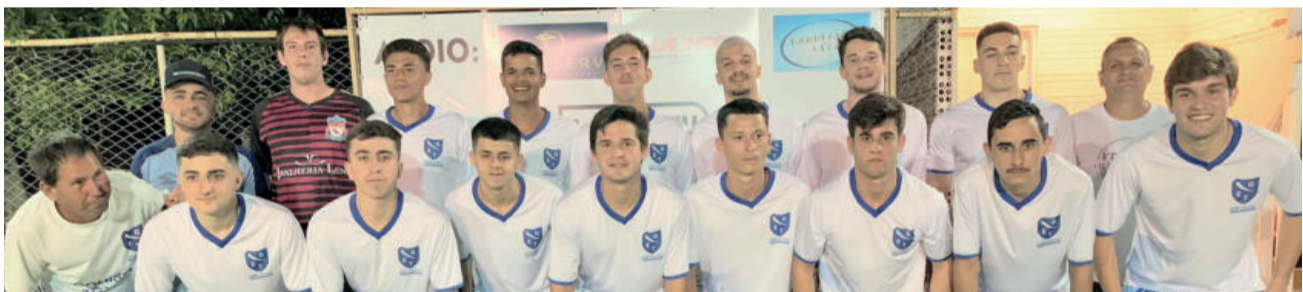
Sub-21 – Furacão/Bar do Chico