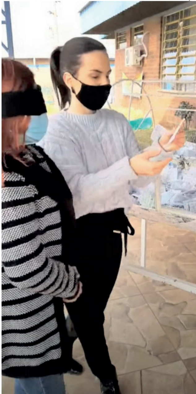
Serão cinco sorteios realizados