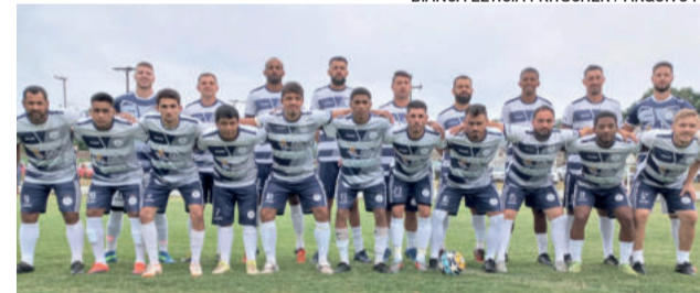
BIANCA LETÍCIA FRITSCHER / ARQUIVO FP