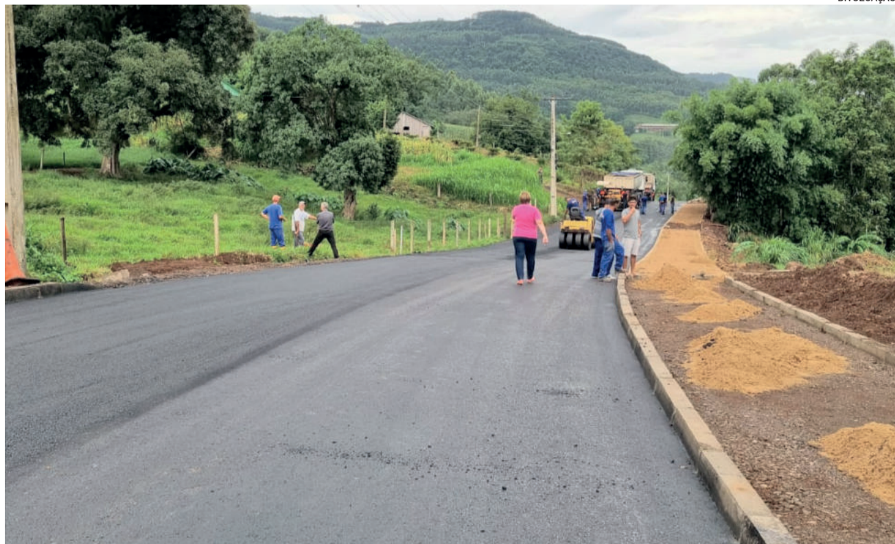
Coelhos e ovos de Páscoa aguardam pelos turistas