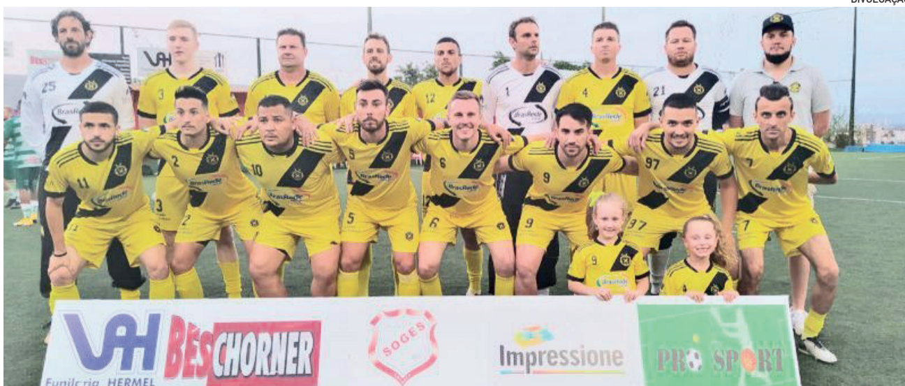
Xtotz United entra no certame em busca do tetracampeonato

A 44ª Copa Soges de Futebol Sete terá como patrocinadora oficial a 386 Business Park.