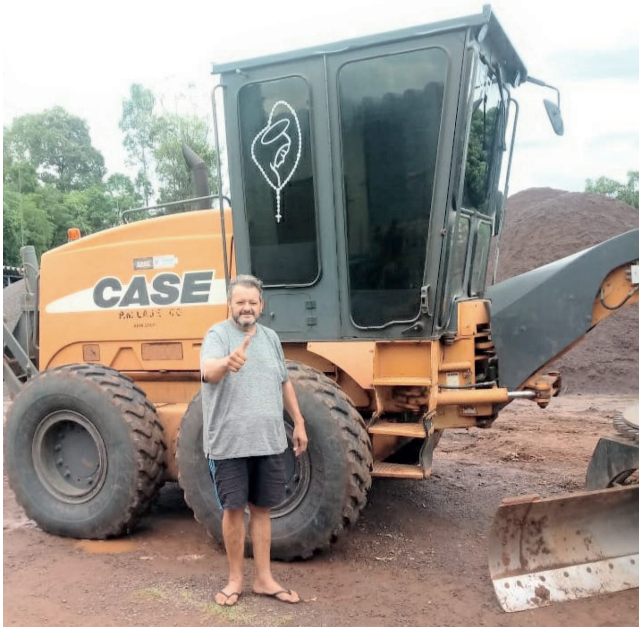
Nhonho herdou a profissão do pai, ainda criança, em Candelária

Todos os dias a sua missão é patrolar ruas, construir e manter acessos de propriedades de agricultores, bem como executar terraplanagens. Além disso, faz cancha para calçamentos, ou seja, deixa a rua pronta para a colocação do pavimento. “Sempre trabalhei com motoniveladora. Quando tinha 10 anos de idade já acompanhava meu pai na motoniveladora em Candelária. O que sou hoje devo tudo a ele”, reconheceu.