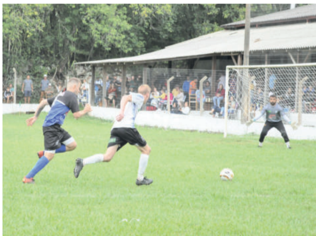
Oito equipes entram em campo amanhã