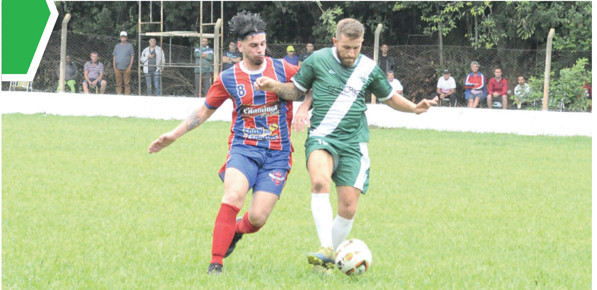
Aimoré (vermelho e azul) busca liderança na tabela