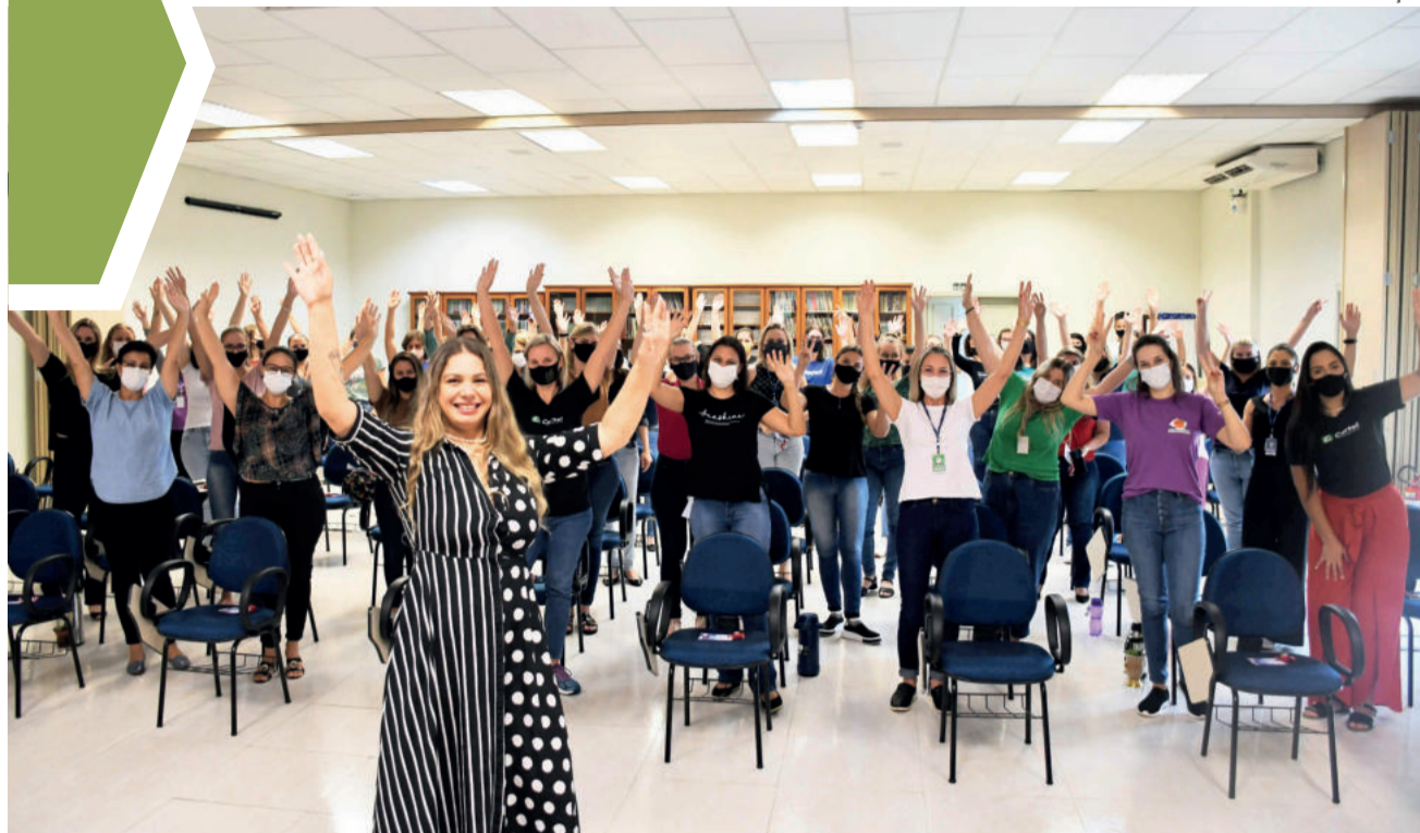
Palestrante estimulou a aceitação entre as mulheres