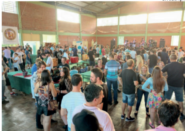
Festival entra para a 5ª edição, neste ano, sendo realizado junto à Escadaria do Rio Taquari