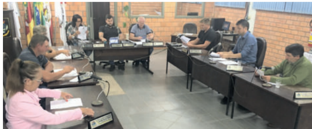
Nenhum vereador utilizou a tribuna na sessão desta semana