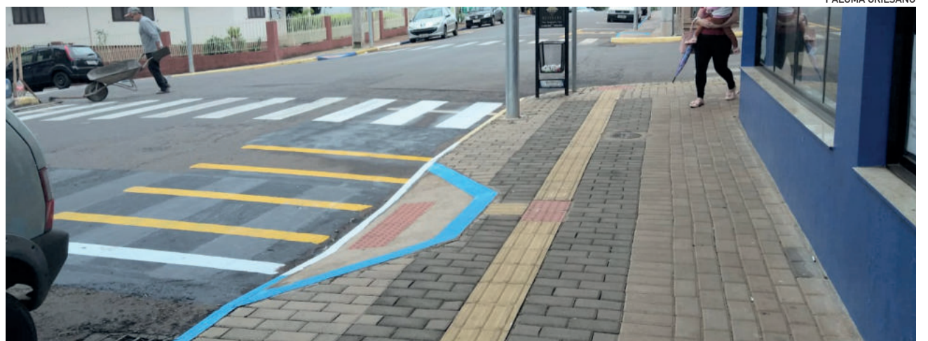
Pinturas na Capitão Schneider geraram polêmica, mas obra não está concluída