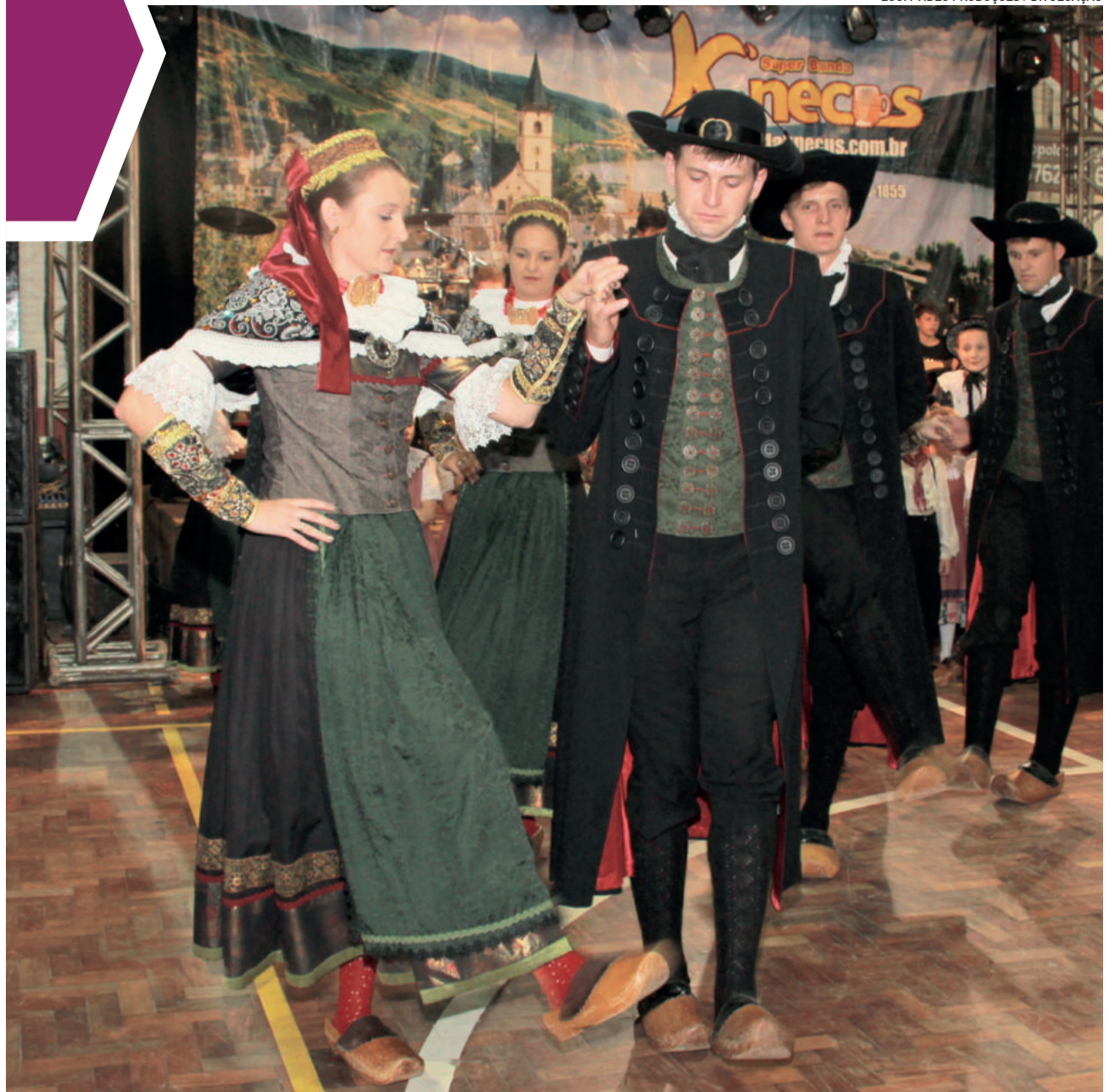
Evento contará com apresentações de dança locais e de convidados

Depois disso Lara pode contar tudo para as filhas que choravam de alegria de vê-la viva. Elas puderam viver livres e felizes para sempre.