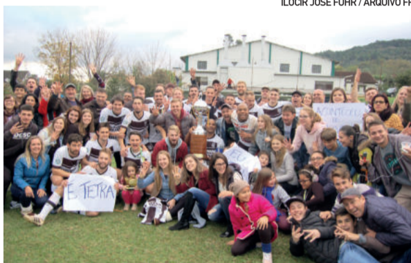
Ecas comemorou o tetracampeonato em 2018