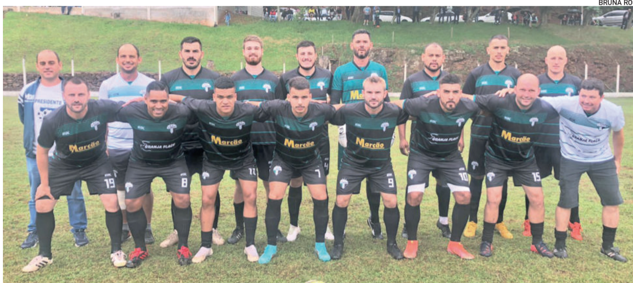
11 Amigos busca pontuar em casa

A equipe esportiva da Rádio Popular FM transmitirá o jogo entre 11 Amigos e Juventude-We. A narração será na voz de Luciano Gallert. E voltando aos gramados, Jeison Laury da Rosa fará as reportagens e comentários do confronto.