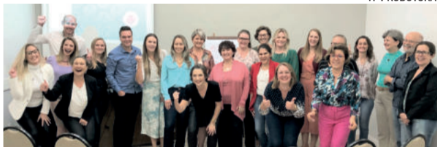
Workshop foi realizado no Baviera Park Hotel