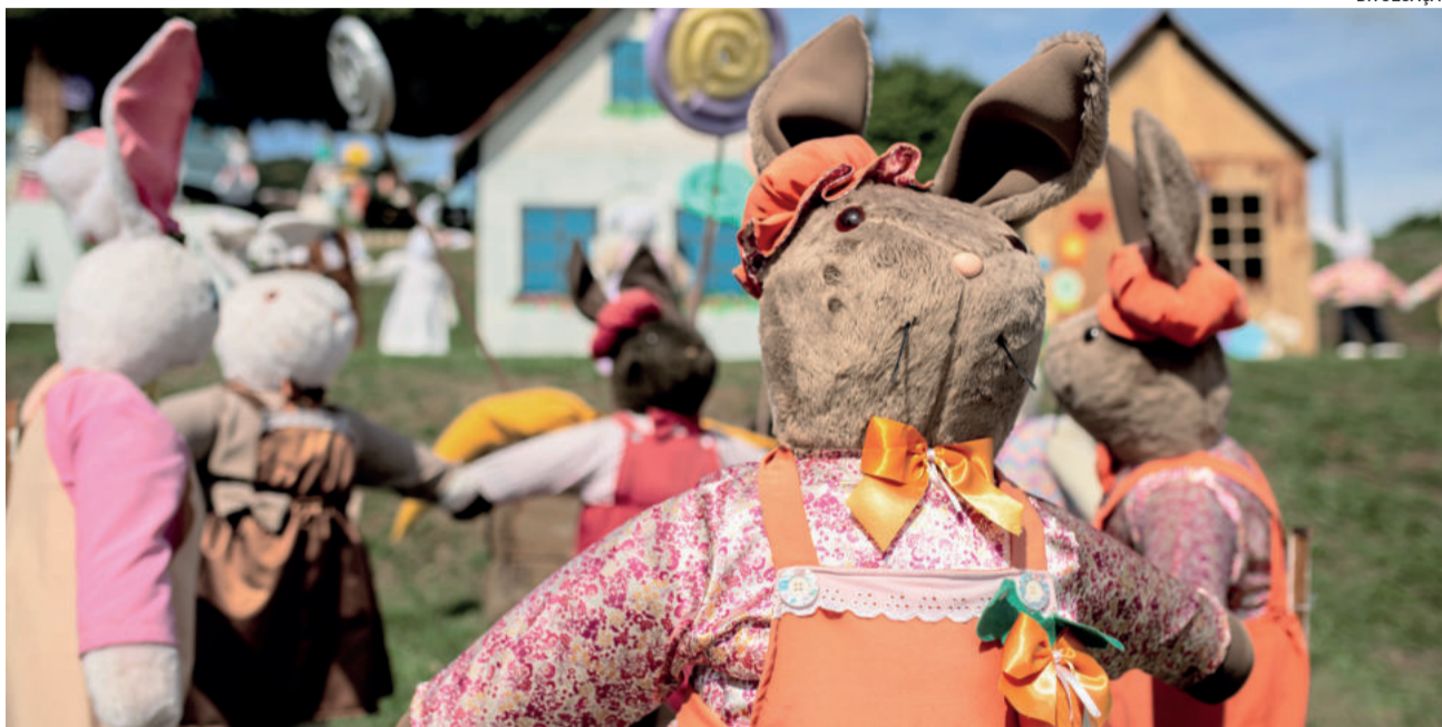
Coelhos e ovos de Páscoa aguardam pelos turistas

Colinas já está em clima de Páscoa. O município já está preparado para sua programação mais tradicional, a Páscoa Encantada, que inicia neste fim de semana. Os coelhos e ovos de Páscoa já estão espalhados pelas ruas e parques da cidade esperando os visitantes. A partir deste sábado (26/3), à tarde, haverá caça ao ninho e a presença do casal de coelhos na Praça dos Pássaros, assim como o Passeio de Trenzinho saindo do mesmo ponto. O local contará também com venda de artesanato, venda de produtos coloniais, comercialização de lanches e bebidas e brinquedos infláveis. Já a tradicional pintura de rosto que era realizada nas crianças, foi substituída, devido aos protocolos da covid-19, por tiaras de orelhas de coelho. No dia 15 de abril, às 18h30, acontecerá a apresentação da peça teatral “A máquina de Páscoa”, junto à Concha Acústica da Praça dos Pássaros, com ingresso livre. A programação de Páscoa se estende até o dia 16 de abril, acontecendo sempre nos finais de semana.