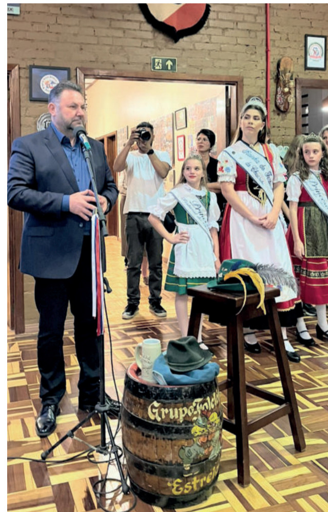
Prefeito Elmar André Schneider

Ressaltando a importância de retomada e a oportunidade de celebrar a festividade como prefeito, Elmar André Schneider destacou a importância cultural, turística e familiar do Festival do Chucrute. “Uma alegria muito grande poder viver este momento. São 55 anos de tradição. Aqui você respira cultura e conhecimento, num espaço onde as crianças são encaminhadas para o bem. A família