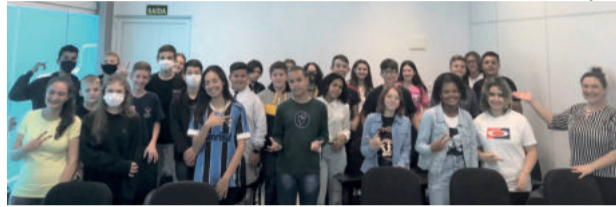
Estudantes do turno da manhã