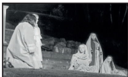
Valor às crianças