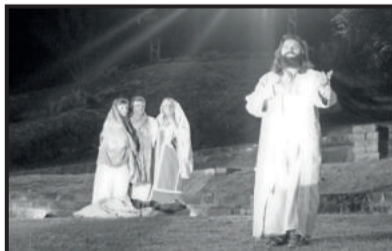
Milagres de cura