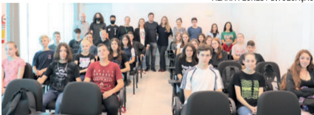
Alunos do turno da tarde com os professores e a administração