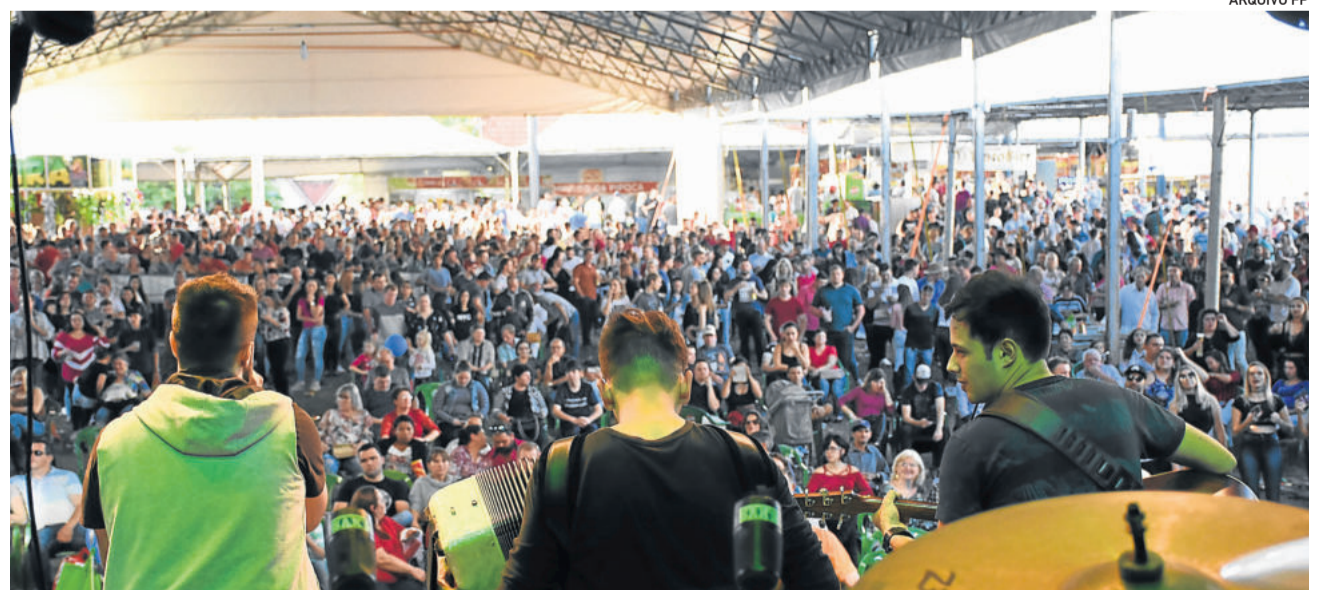
Shows são marca registrada da Festa de Maio de Teutônia

Comercial, Industrial e de Serviços 25/05 – das 18h às 22h 26 a 28/05 – das 10h às 22h 29/05 – das 10h às 18h