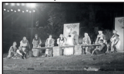
A última ceia