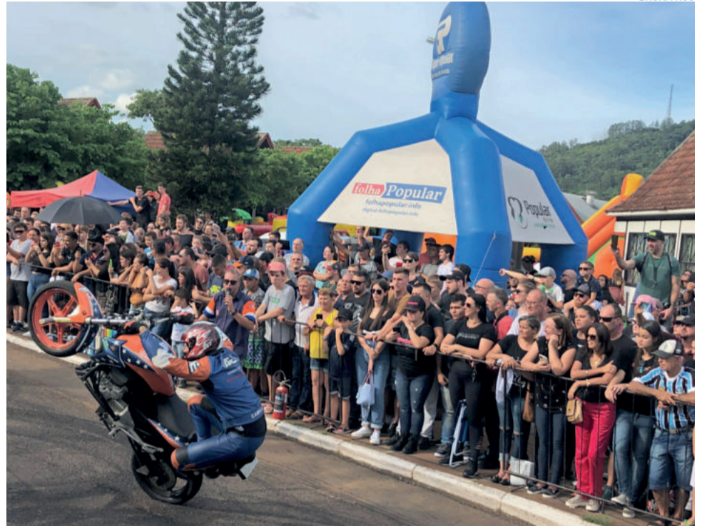
Grupo Arte & Equilíbrio proporcionou adrenalina ao público