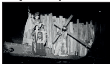
A subida ao monte calvário