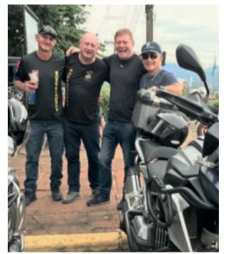
Integrantes do Moto Clube Borrachudos

explicação. Cada um traz a sua história. São vidas em cima de duas rodas. É um privilégio”.