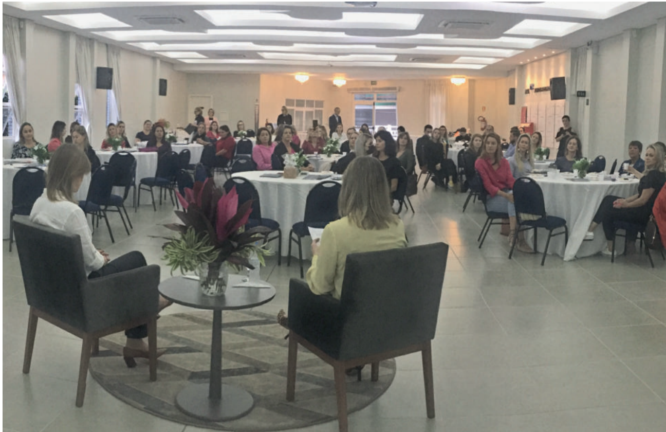
Salão de Eventos da Acil sediou o evento na manhã desta terça-feira