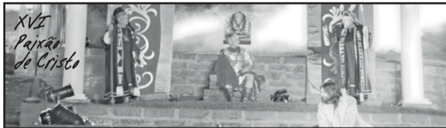
Sob o poder de Poncio Pilatos