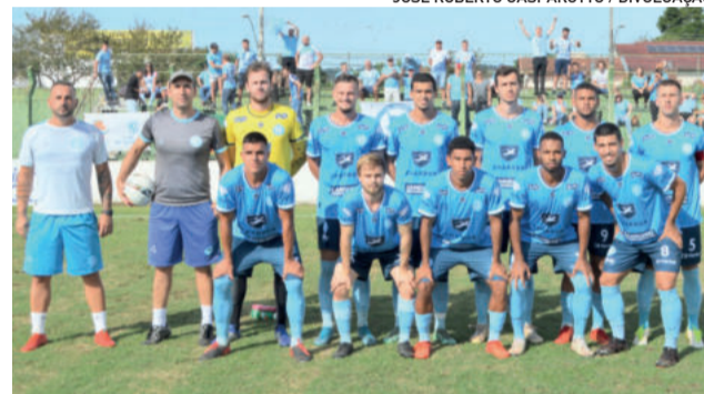
Lajeadense venceu fora de casa na primeira rodada da Divisão de Acesso