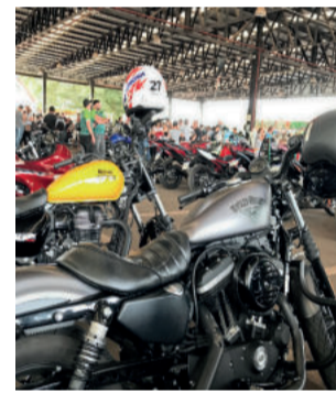
Máquinas ficaram expostas no pavilhão