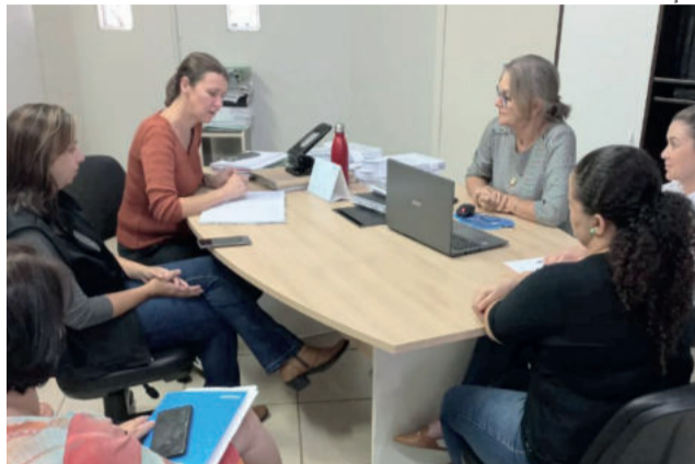
Equipe de Educação Fiscal vai coordenar concurso para escolha do nome do Parque Municipal