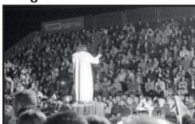
Em meio à multidão