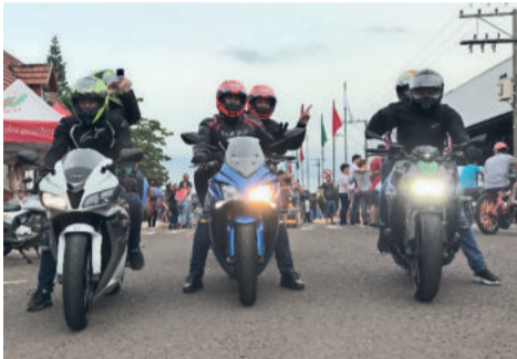
Motociclistas tomaram as ruas de Teutônia