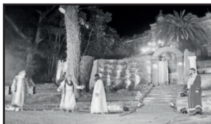
Diálogo com discípulos