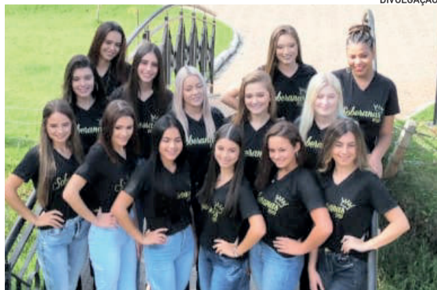
Primeiro encontro das candidatas ocorreu no sábado (9/4), no auditório Águia Azul da prefeitura

A Comissão Organizadora do Concurso das Soberanas de Fazenda Vilanova realizou o primeiro encontro com as candidatas ao trono no sábado (9/4). O evento ocorreu no auditório Águia Azul da prefeitura, com a saudação do prefeito Amarildo Luis da Silva e toda a equipe de organizadores.