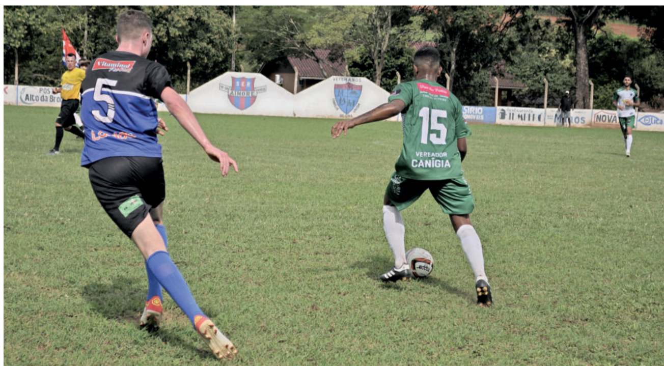
Gaviões do BI (verde) venceu o Atlântico B e subiu posições na tabela