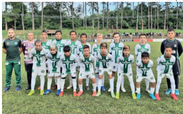
Sub-12 venceu por 2 a 0