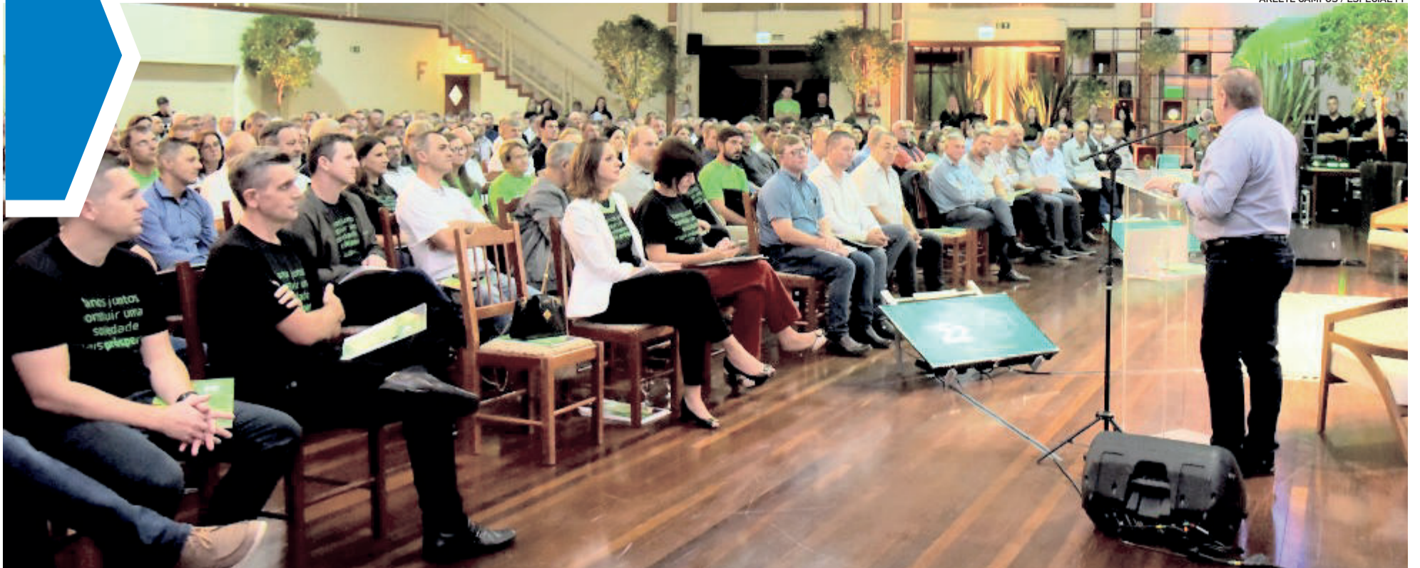
Assembleia marcou a aprovação da expansão da Sicredi Ouro Branco para o Estado de Minas Gerais