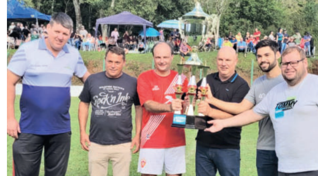
Juventude ficou em 2º lugar no Veterano