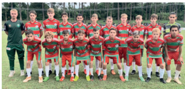
Sub-13 perdeu por 1 a 0

As categorias Sub-10 e Sub-11 são as próximas a entrarem em campo. As equipes jogam no próximo domingo (24/4), em Canoas.