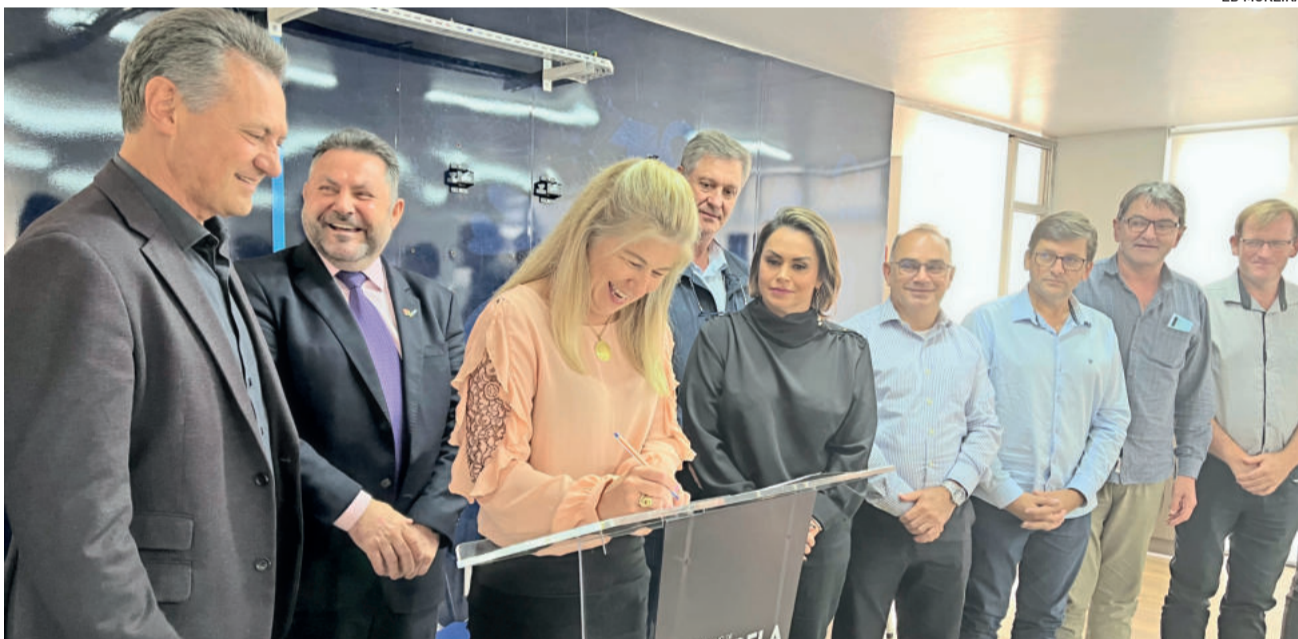
Posse foi assinada em evento no auditório da E-Log