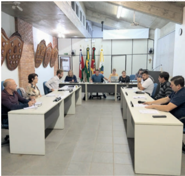
Vereadores se reuniram na segunda-feira (18/4)