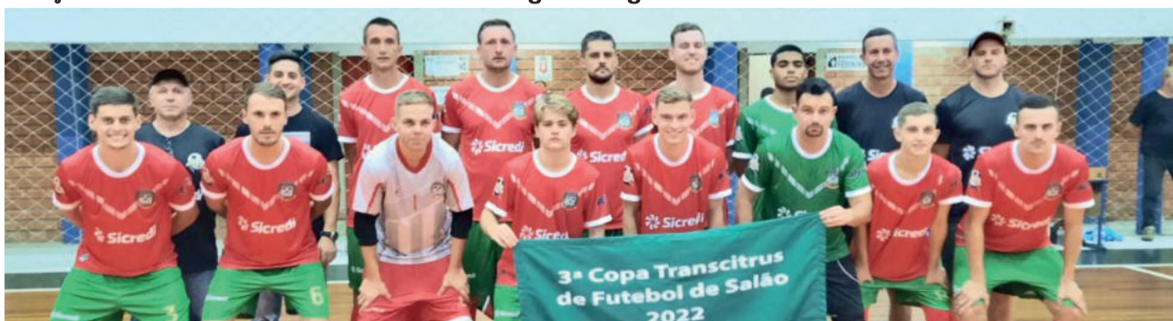
Salvador do Sul é líder com 17 pontos e está classificado para as semifinais