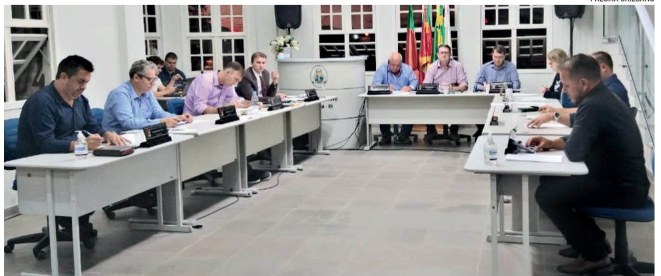
Sessão ocorreu no dia 12/4

A próxima sessão da Câmara de Vereadores de Teutônia ocorre no dia 26 de abril, na sede do Legislativo, a partir das 18h30.