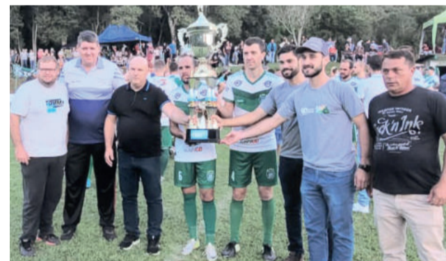
XV de Novembro ficou com o vice-campeonato

Campeão: XV de Novembro Vice-campeão: Juventude