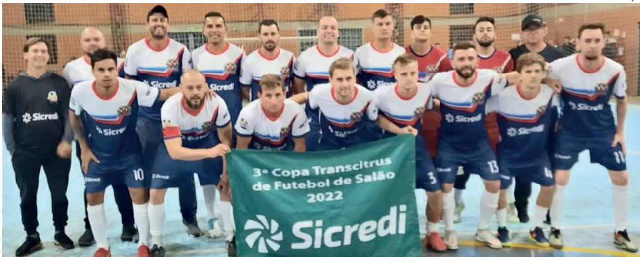
Seleção de Paverama tenta se classificar em segundo lugar