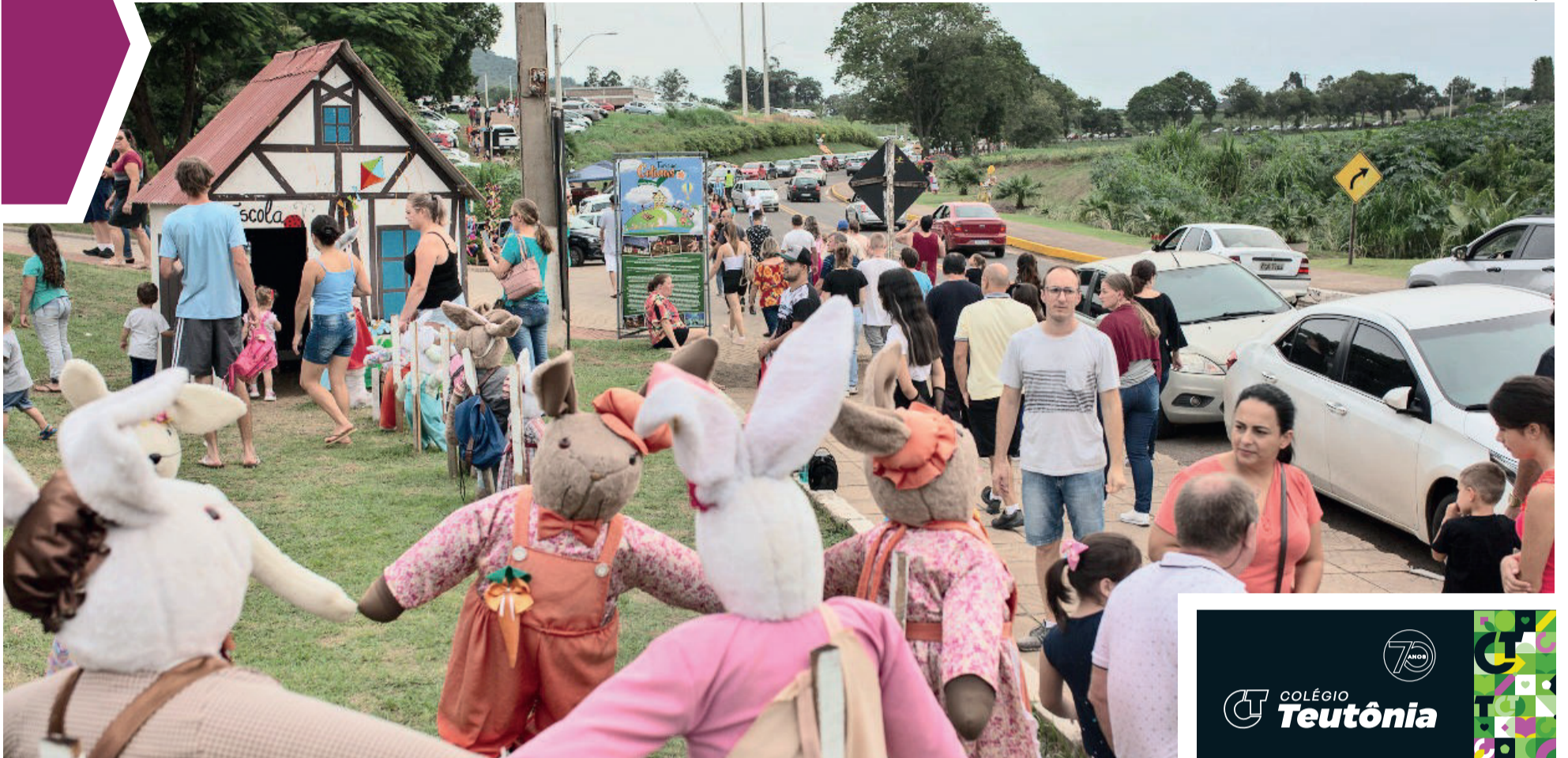
Cerca de 60 mil pessoas passaram por Colinas durante as programações de Páscoa