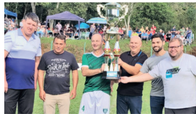
XV de Novembro levantou a taça nos Veteranos