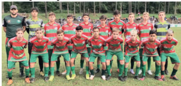
Sub-14 perdeu por 1 a 0