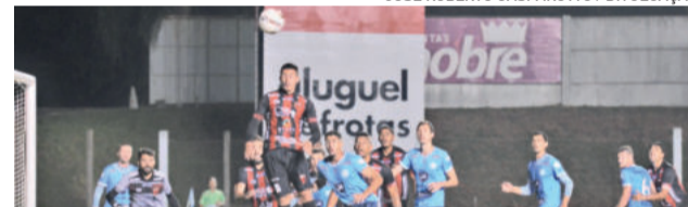
Clube conseguiu a vitória com um atleta expulso