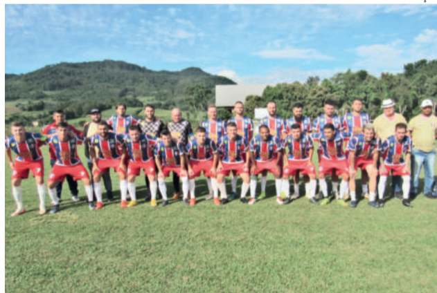
Sete de Setembro busca vantagem em casa