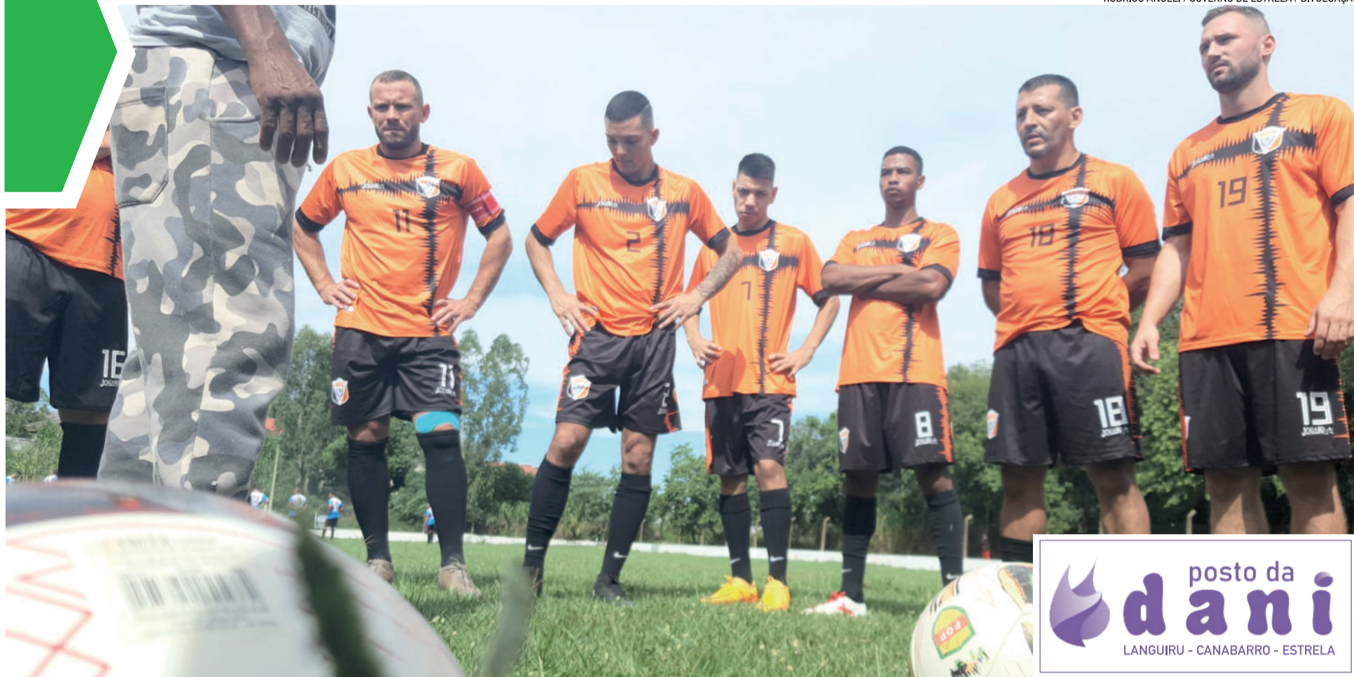
Atlético Estrelense tem complicado desafio frente o líder Aimoré