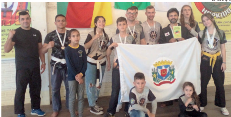
Agora, a equipe de Paverama começa a se preparar para a etapa nacional