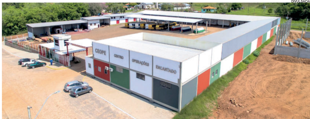
Sede do CEOPE

Em tempos de informação na palma da mão, o celular pode ser a maior fonte de conhecimentos no desafio de criar, mas também pode ser o objeto alienador que te escraviza e tira das rotas que poderiam levar a grandes transformações. O poder de combinar está em suas mãos!