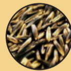
Pastagem GMX BAGUAL. Serve para silagem, pré-secado e pastejo