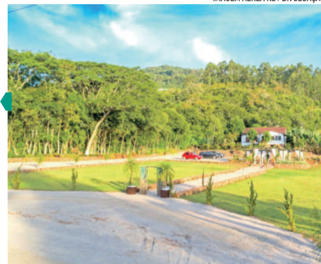
IMAGEM AÉREA RS / DIVULGAÇÃO

Voltado a famílias rurais que estejam atuando com turismo ou que tenham interesse em empreendimentos desse tipo em suas propriedades, o Seminário contará com palestras, relatos de experiências, exposição de artesanato e almoço, entre outros.