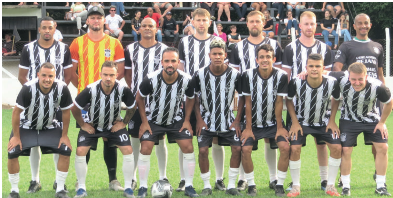
Ecas busca vantagem no primeiro jogo em casa