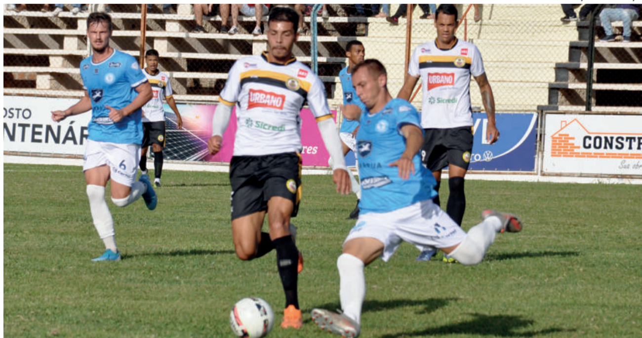
Equipe de Lajeado teve gol anulado e jogador expulso