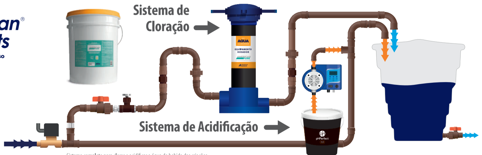
Sistema completo para clorar e acidificar a água de bebida das criações.

@americannutrients /americannutrients /americannutrients /american-nutrients-do-brasil