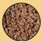
Sementes de Trigo BRS Belajoia e Embrapa BRS Reponte