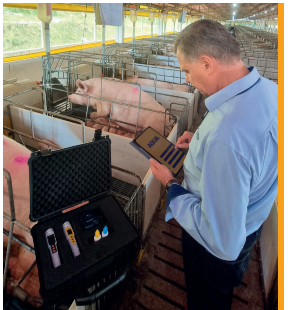
Laboratório móvel e APP Aqua Nutrients à campo: tecnologia e inovação!