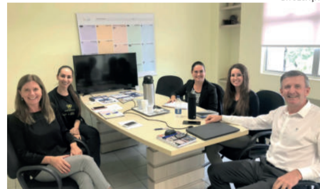
Representantes da Secretaria de Saúde com a equipe do Hospital Ouro Branco