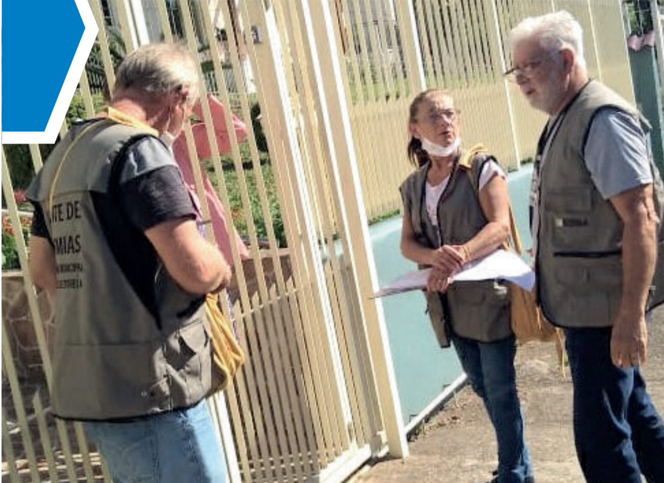
Agentes realizam visitas domiciliares; eles trabalham uniformizados e não aplicam punições