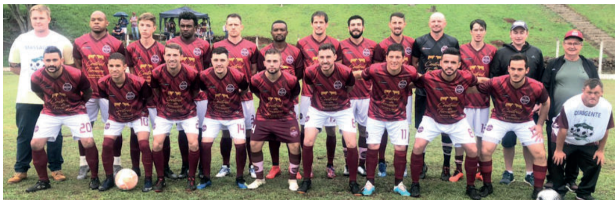
Boavistense joga o confronto de volta em casa