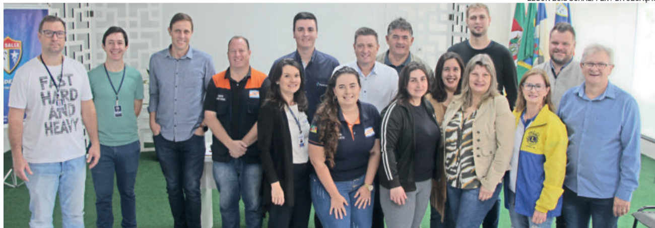
Ações foram definidas em reunião com representantes da Prefeitura, Cacis, empresas e entidades parceiras