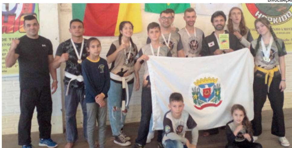
Agora, a equipe de Paverama começa a se preparar para a etapa nacional