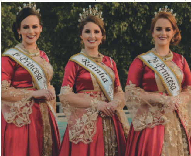
Serão quatro dias de programações variadas