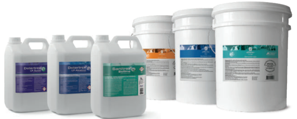
Produtos exclusivos para limpeza de caixa d'água e tubulações, e acidificantes de água de bebida.