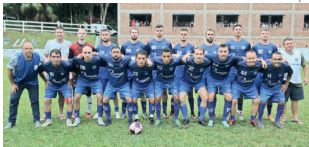
Floriano teve a melhor campanha da fase classificatória

No dia 8 de maio, feriado de Dia das Mães, não haverá rodada. O segundo jogo de semifinal será no dia 15 de maio. No Campo do Delfinense, o Grêmio da Beira do Rio recebe o Rudibar. Os jogos de volta estão previstos para ocorrerem nos dias 22 e 29 de maio. As finais serão nos dias 5 e 12 de junho.