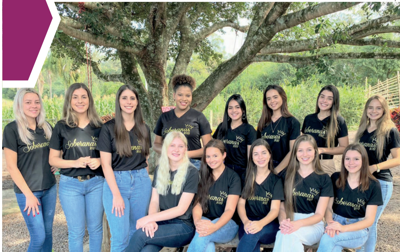
Candidatas passam por diversas etapas desde março