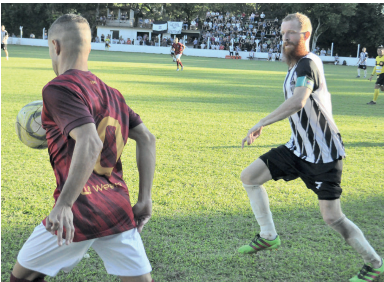
Ecas e Boavistense propuseram o jogo, mas não conseguiram sair do 1 a 1