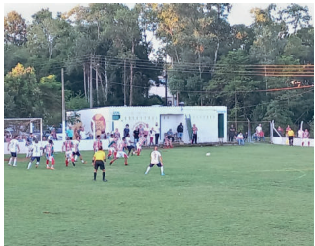
Canabarense e Juventude da Frank empataram em 1 a 1