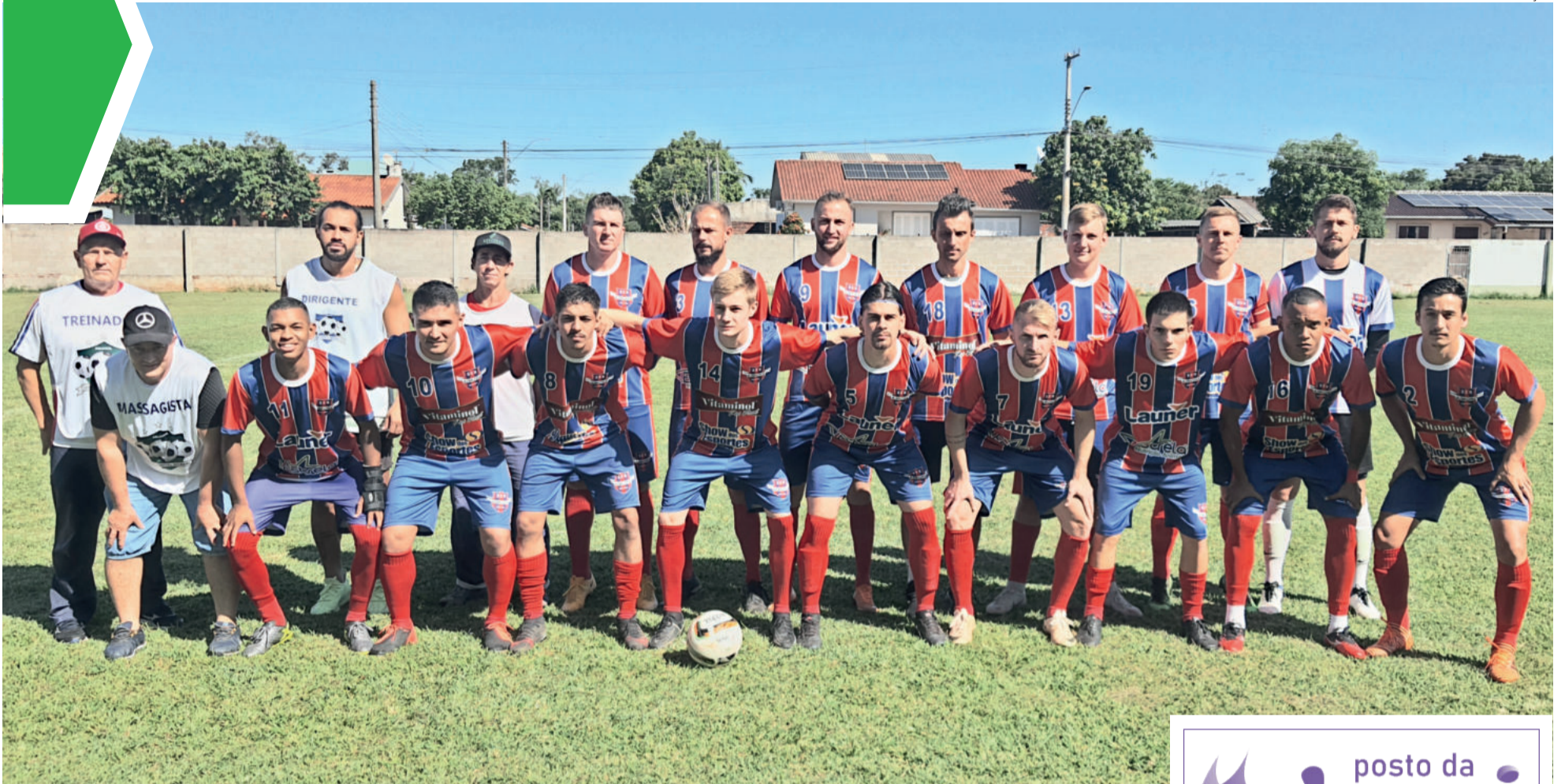
Aimoré lidera com 12 pontos