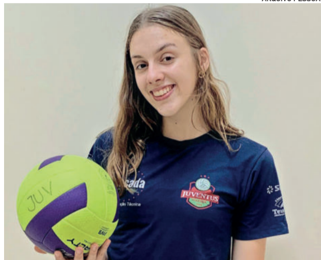
Atleta se prepara para o Campeonato Brasileiro de Seleções que será disputado no mês de maio em Jaraguá do Sul (SC)