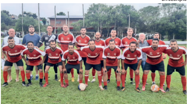
União da Germano venceu o Atlético Gaúcho por 1 a 0