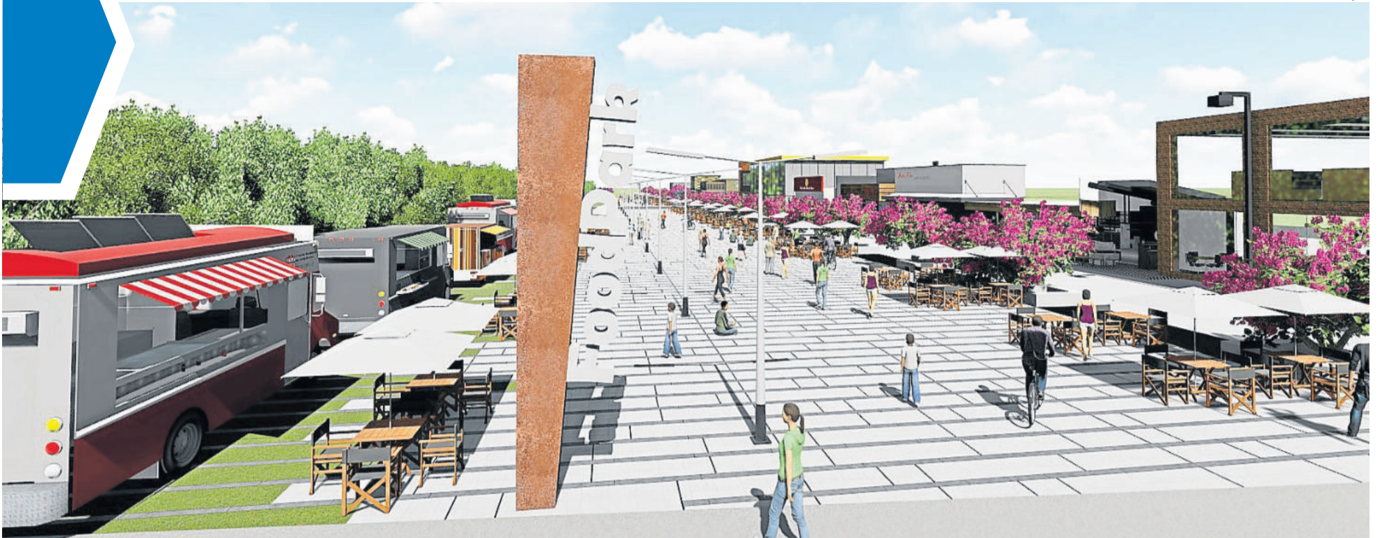
Teutopark é inspirado em parques de grandes cidades