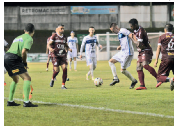
Lajeadense empatou em casa contra o Inter de Santa Maria