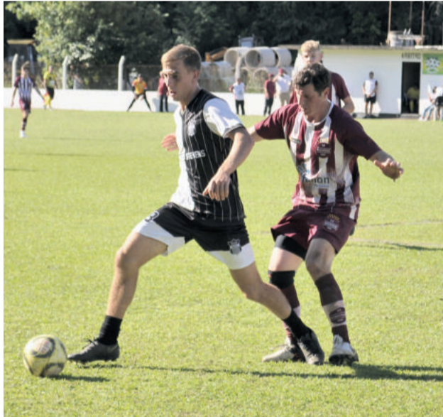
Segundinho teve o mesmo placar que os Titulares