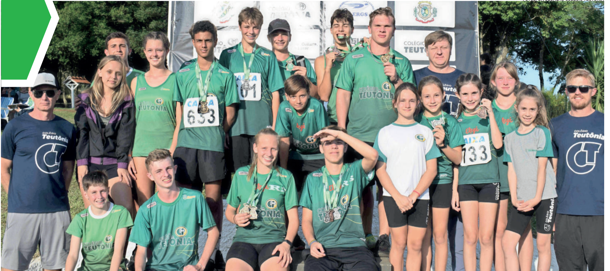
Equipe teutoniense teve bom desempenho

TEUTÔNIA ▶ 18º TROFÉU TEUTÔNIA DE ATLETISMO