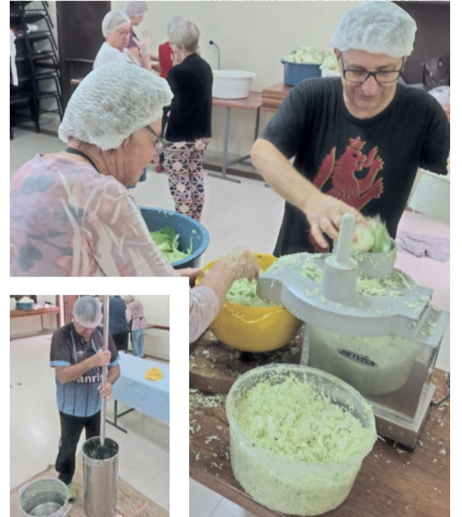
Voluntários da Comunidade Evangélica trabalharam no fim de semana para iniciar os preparativos do Festival