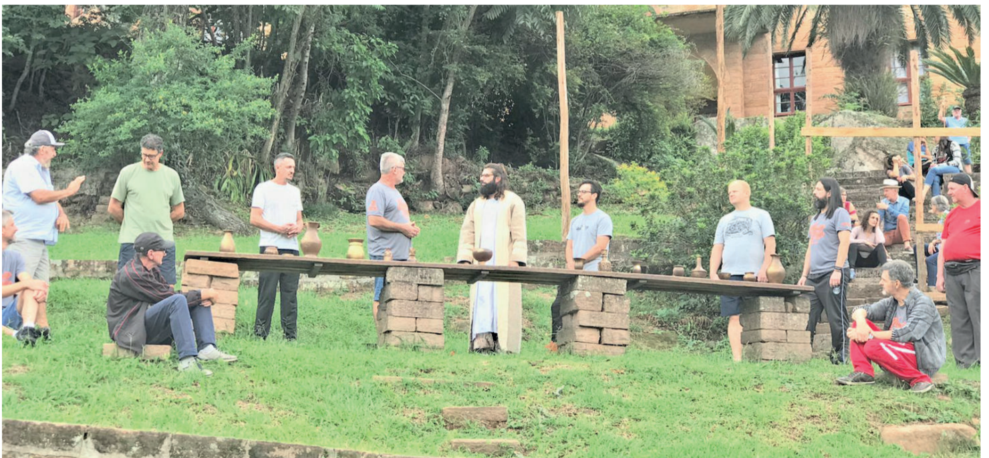
Atores ajustam últimos detalhes

Mais informações na Secretaria da Educação pelo telefone 3754-1130.