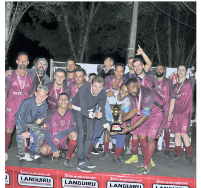
Imeec ficou em 2º lugar do Força Livre