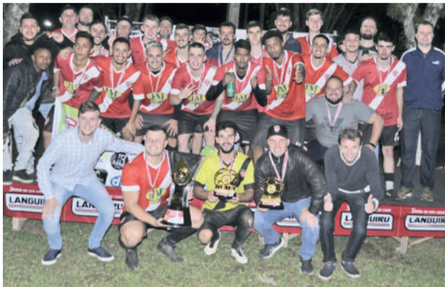
Inter de Santa Manoela conquistou o tricampeonato da Sub-21