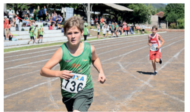
Jovens de diferentes categorias disputaram provas na Pista de Atletismo do Colégio Teutônia