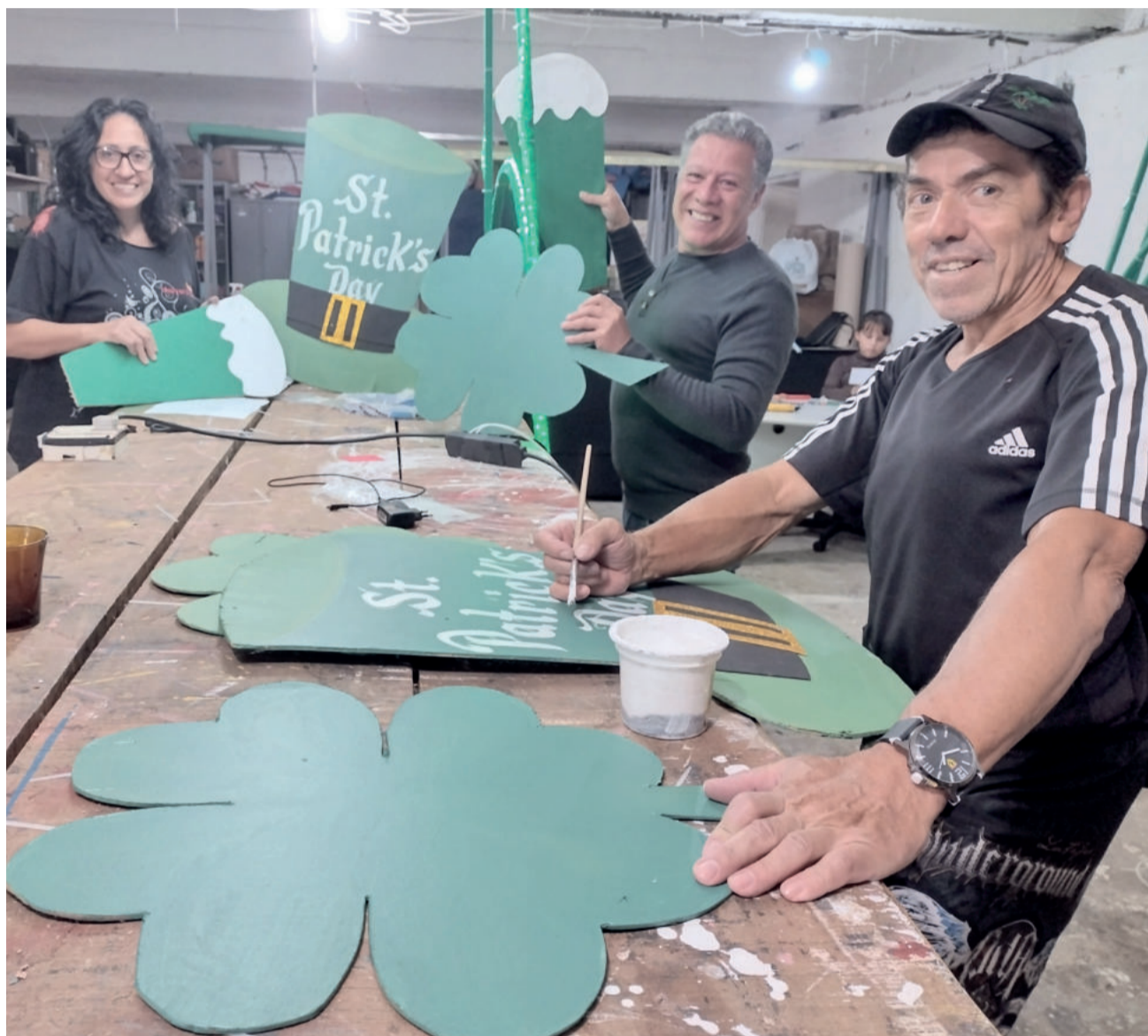
Decoração está sendo finalizada pela equipe do Barracão