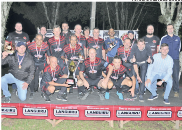
Amigos do Lolo sagrou-se campeão do Máster