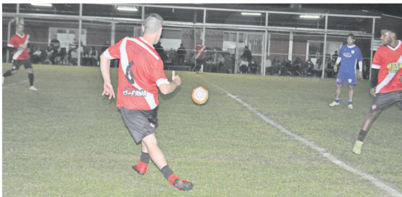
Internacional de Santa Manoela conquistou o título da Sub-21 nas penalidades