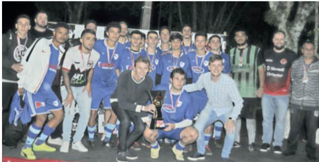
Furacão ficou com a medalha de prata do Sub-21