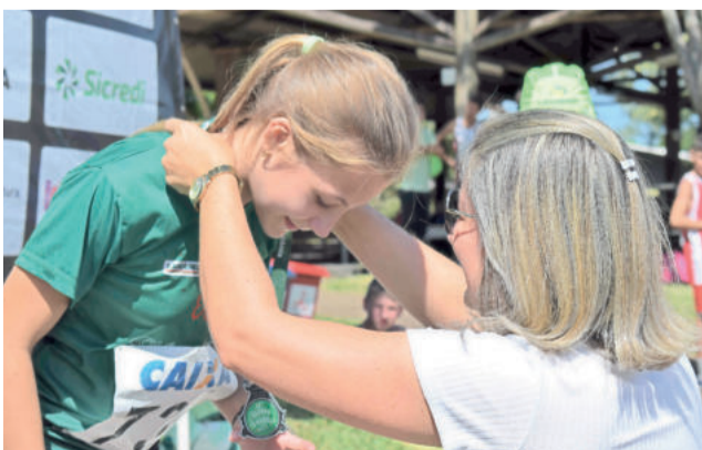
Atletas da equipe teutoniense subiram ao pódio