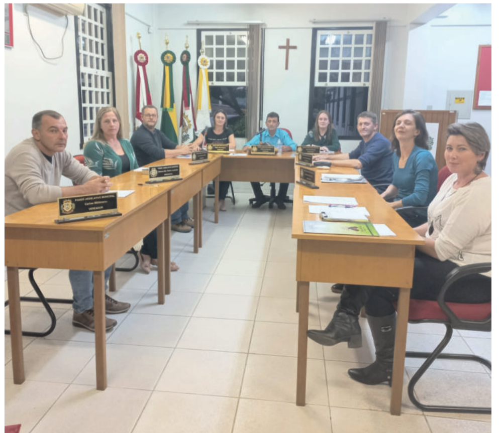
Vereadores de Westfália aprovaram quatro projetos na sessão de segunda