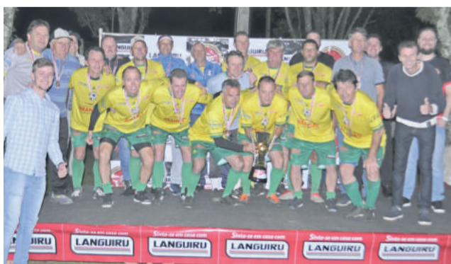
Família Azevedo levou o vice-campeonato do Máster