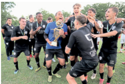
Sub-17 triunfou diante do Cruzeiro por 2 a 0