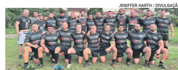
Jogos da primeira etapa ocorreram no sábado (2/4), no campo em frente ao Parque Princesa do Vale

As próximas etapas da Copa RS estão previstas para os dias 7 de maio em Porto Alegre, e 25 de junho em Marau.