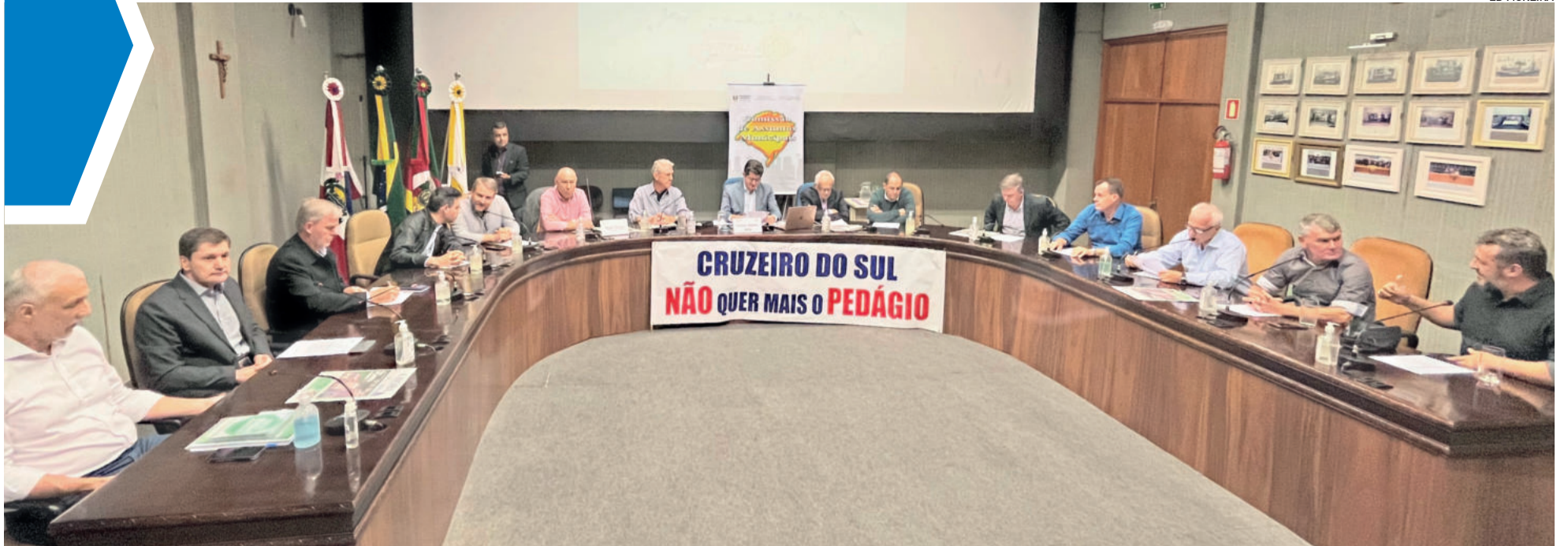
Comissão de Assuntos Municipais da Assembleia Legislativa ouviu reivindicações da região