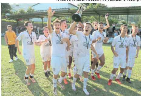
Sub-15 venceu o AC Sulbrasil por 3 a 0