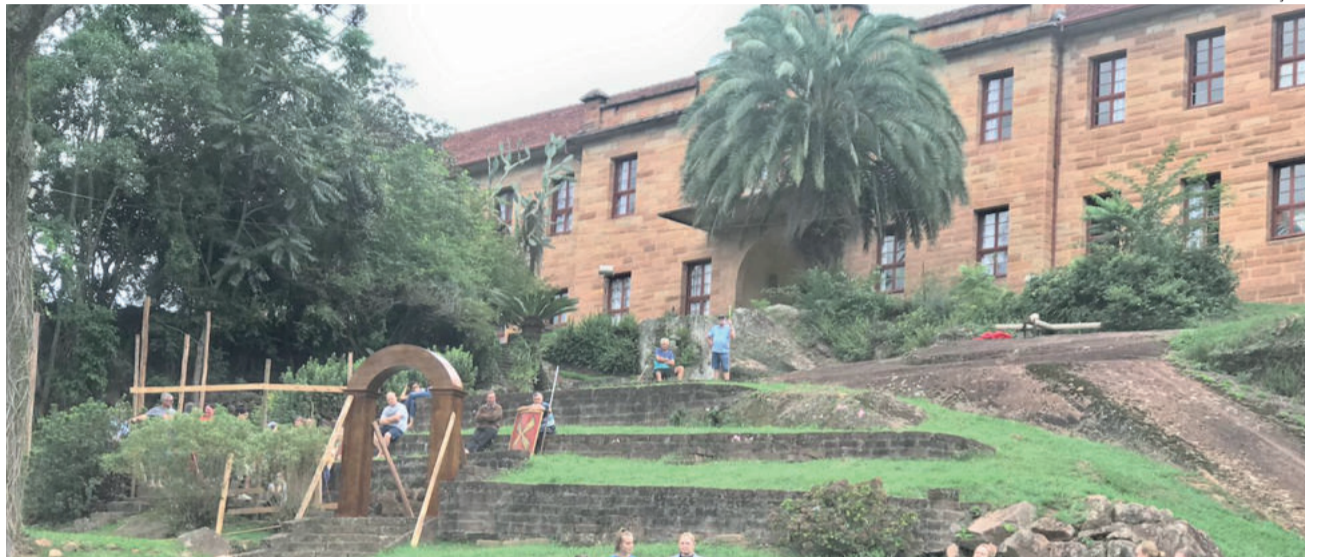
Cenário é propício com a temática da encenação teatral

Capalonga também enfatiza a retomada dos eventos culturais por meio da peça e a mensagem de esperança transmitida. “A história tradicional termina com a ressurreição. O espetáculo tem