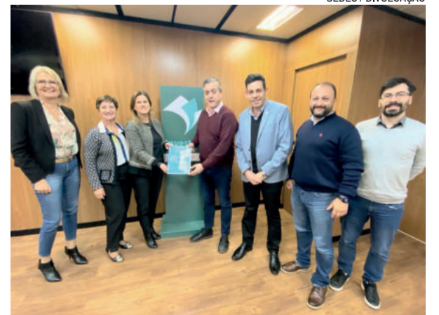
O APL AB VT espera conseguir o certificado nos próximos dias