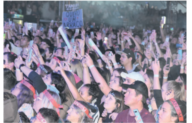
Público lotou o espaço de shows para ver o cantor sertanejo