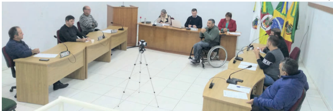
Aprovação ocorreu na sessão desta segunda-feira