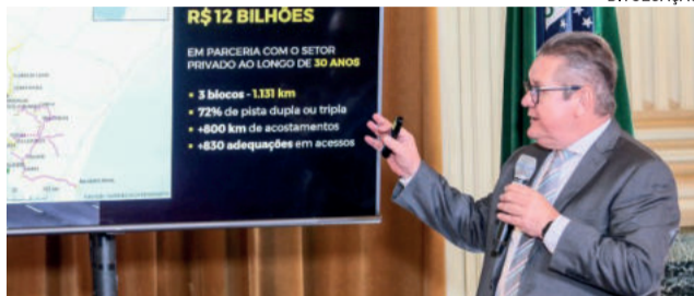
Governador Ranolfo Vieira Júnior anunciou andamento do projeto de concessões