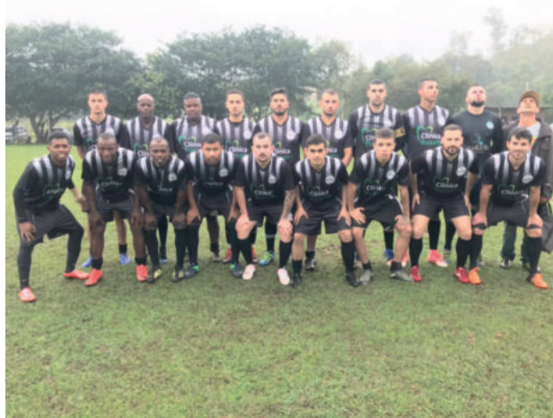
Bragantino superou o Floriano nos Titulares

O jogo de ida de semifinal foi disputado no dia 22 de maio (domingo), no Distrito da Delfina, em Estrela. Nos Titulares, Grêmio e Rudibar empataram em 3 a 3. Nos Aspirantes, o Rudibar levou a melhor em cima do Grêmio por 4 a 1.