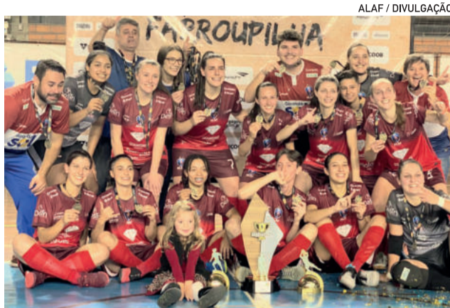
Time conquistou primeiro título após duas goleadas