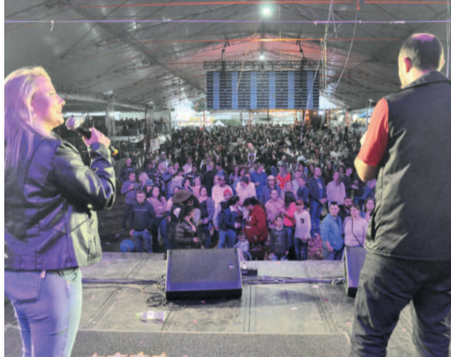
Comunicadores da Rádio Popular apresentaram as atrações

Segundo ele, após quatro anos sem o evento, o grupo optou por realizar um “show raiz”. “Com muitas bandas de bailão, sem esquecer do sertanejo e outros estilos. Isso é ser popular na essência. Estamos muito satisfeitos em contribuir para felicidade do público que esteve presente e da nossa comunidade regional”, destaca.