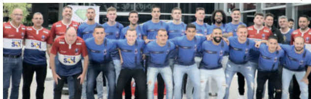
Próximo jogo do elenco é neste sábado em casa

O próximo compromisso da Alaf é neste sábado (4/5). A equipe lajeadense recebe o Passo Fundo, às 20h, no Complexo Esportivo da Univates, em Lajeado. O adversário – Passo Fundo – é campeão da Taça Farroupilha Região Norte 2022.