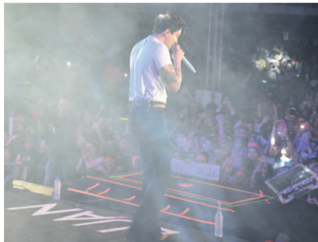
Luan Santana subiu ao palco e trouxe seus novos hits e também suas músicas clássicas