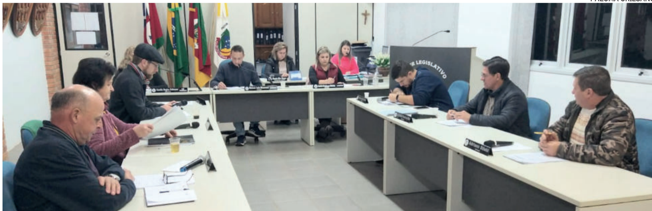
Última sessão do mês ocorreu nesta segunda-feira