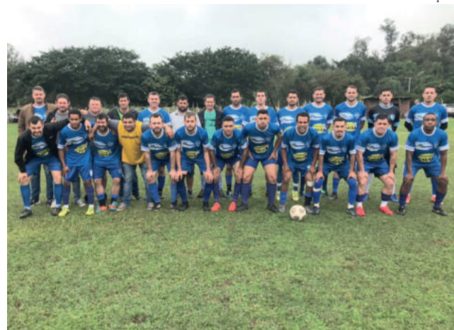
Floriano goleou e ficou com a vaga nos Aspirantes