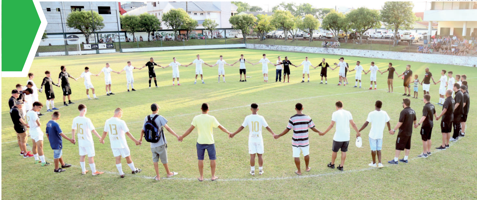
No total são 60 jovens atletas que integram a Ivo10 Brazil