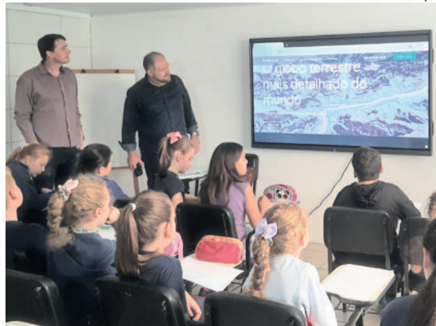
Prefeito acompanhou aula e o funcionamento da tela interativa