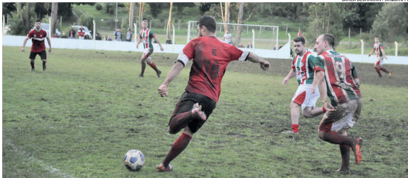
Municipal de Teutônia precisa realizar três rodadas adiadas