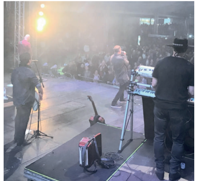
Na sexta-feira a banda Nenhum de Nós selou a noite de rock na Festa de Maio